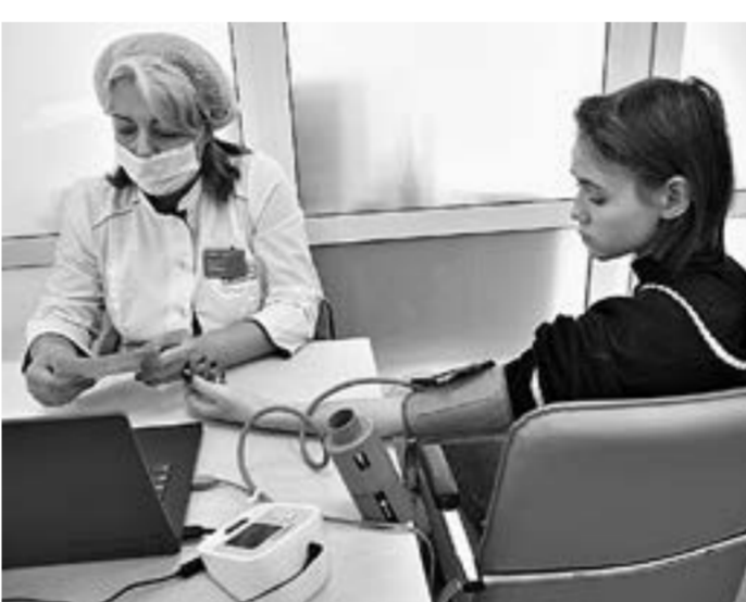
Измерять давление специалисты советуют регулярно.

По ее словам, развитие болезни сердца связано с тем, что люди стали мало двигаться. От этого – слабость и вялость. Исправить ситуацию может обычная зарядка по утрам.