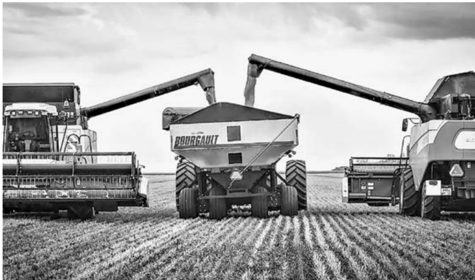
Бункер-перегрузчик «Барго» – два в одном.