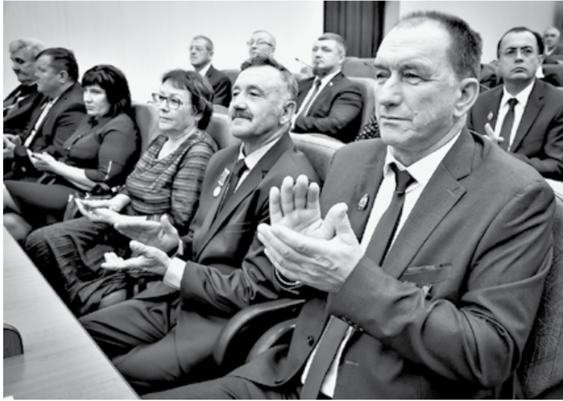
Все награжденные приложили много усилий для развития региона.

В Правительстве Алтайского края прошло торжественное вручение государственных и краевых наград жителям региона. Более 40 человек отмечены за выдающиеся заслуги в сферах промышленности, медицины, образования, строительства, энергетики и других.