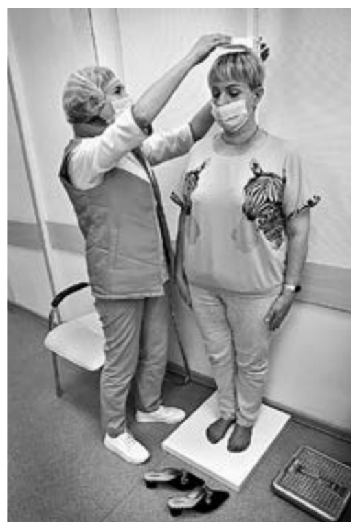
Важно знать свой рост и вес.

Только за этот год, по данным Минздрава, в центре