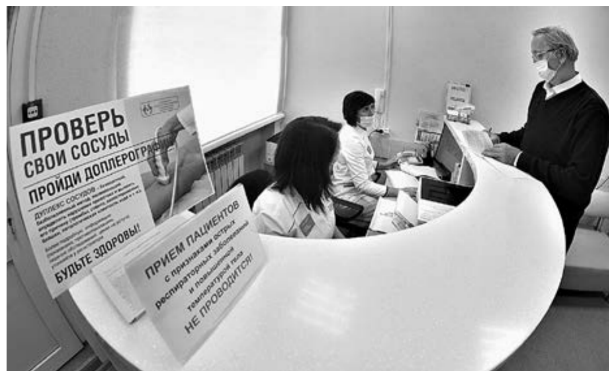
Тематические мероприятия помогают людям узнать, все ли у них в порядке с сердцем.