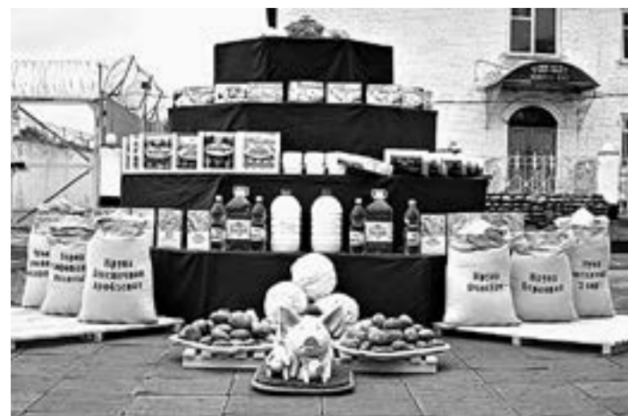
Продукция, которую производят в колониях УФСИН России по Алтайскому краю, отличается хорошим качеством.