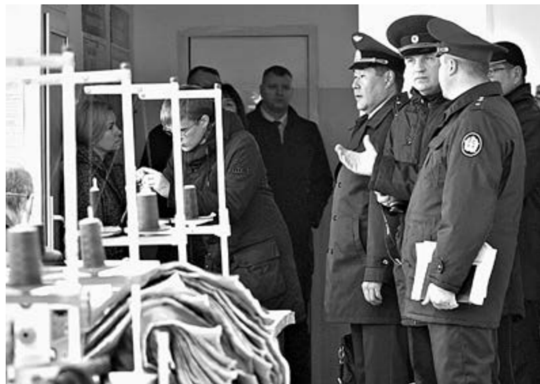
В швейном цехе ИК № 3.

Представлены для обозрения были товары, которые производятся во всех колониях края. Это швейные изделия, обувь, мебель, продукция металлообработки, изделия для благоустройства общественных и придомовых территорий, строительные материалы, сувениры и многое другое. Также гостям презентовали продукцию пищевой промышленности – муку, крупы, овощи, растительное масло, мясные полуфабрикаты, хлебобулочные и кондитерские изделия. Затем гостей сопроводили на участок автосервиса, в цех металлообработки, на швейное производство и участок