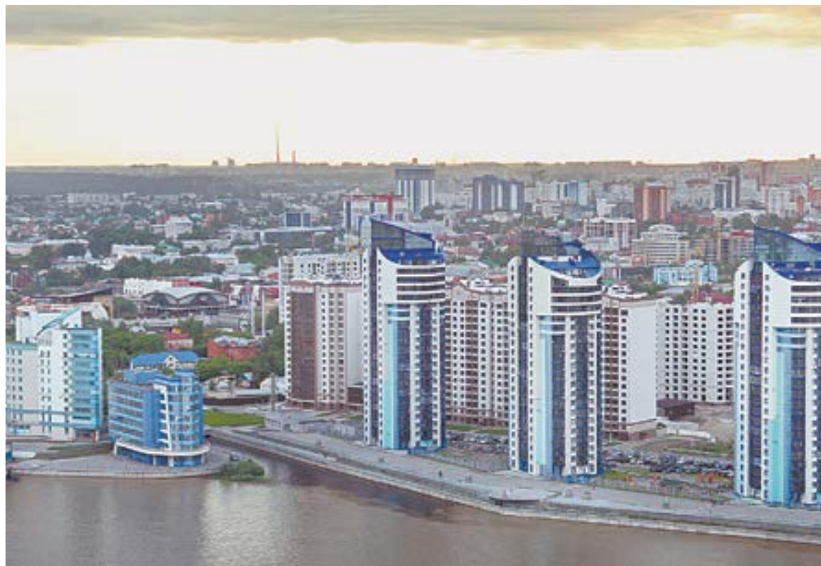
Минимальный первоначальный взнос по ипотеке составит 20 процентов от стоимости жилья.

В силу вступают новые указания ЦБ о макропроденциальных