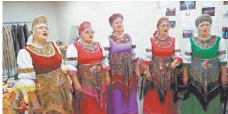
...как и творческие вечера.

Для пожилых людей организованы циклы оздоровительных