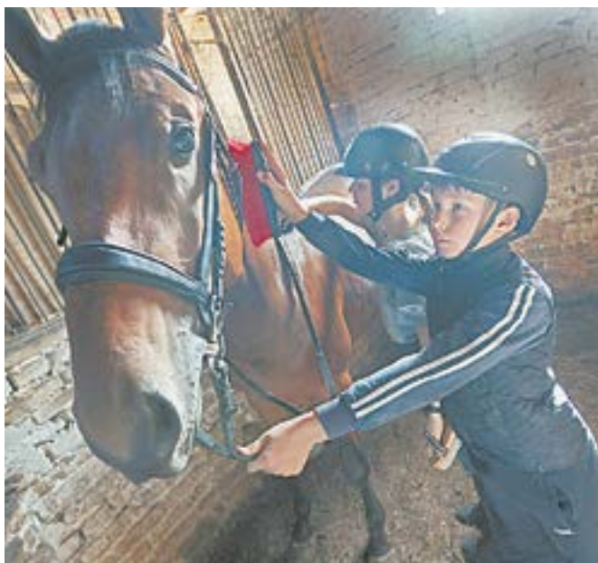
Дети не только тренируются, но и заботятся о лошадях.