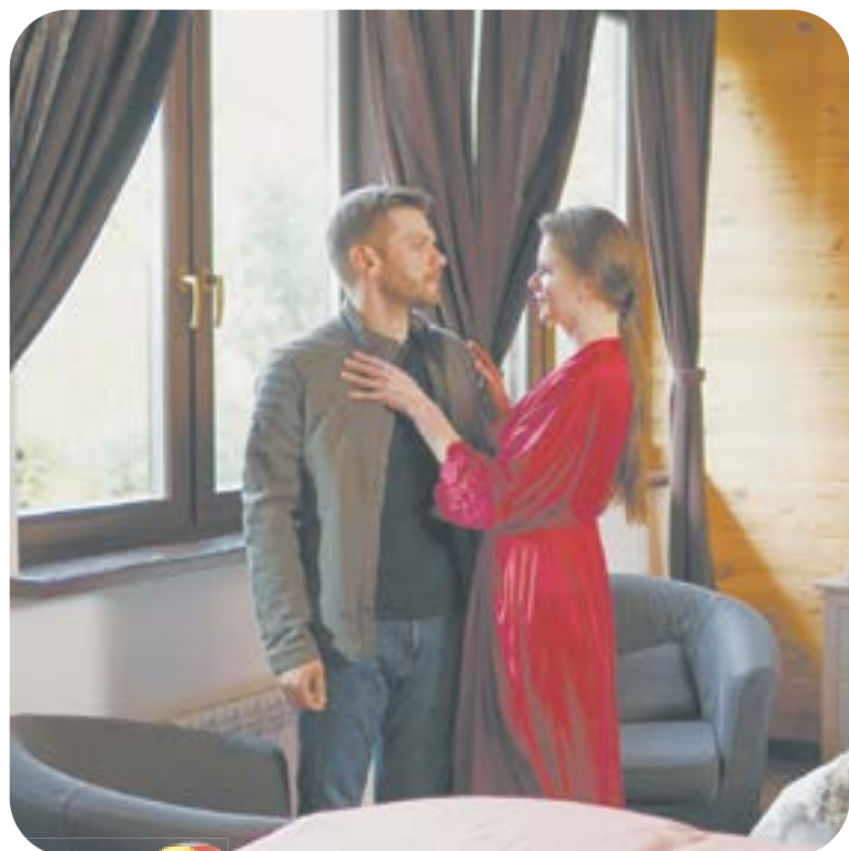
19.00 Х.ф. «СЛИШКОМ БЛИЗКО, СЛИШКОМ БОЛЬНО» (16+)