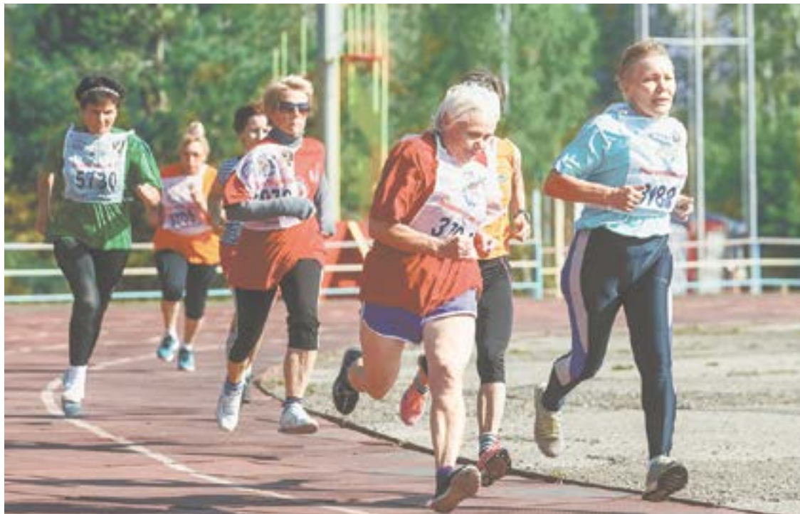
Спартакиады пенсионеров стали в крае традицией...