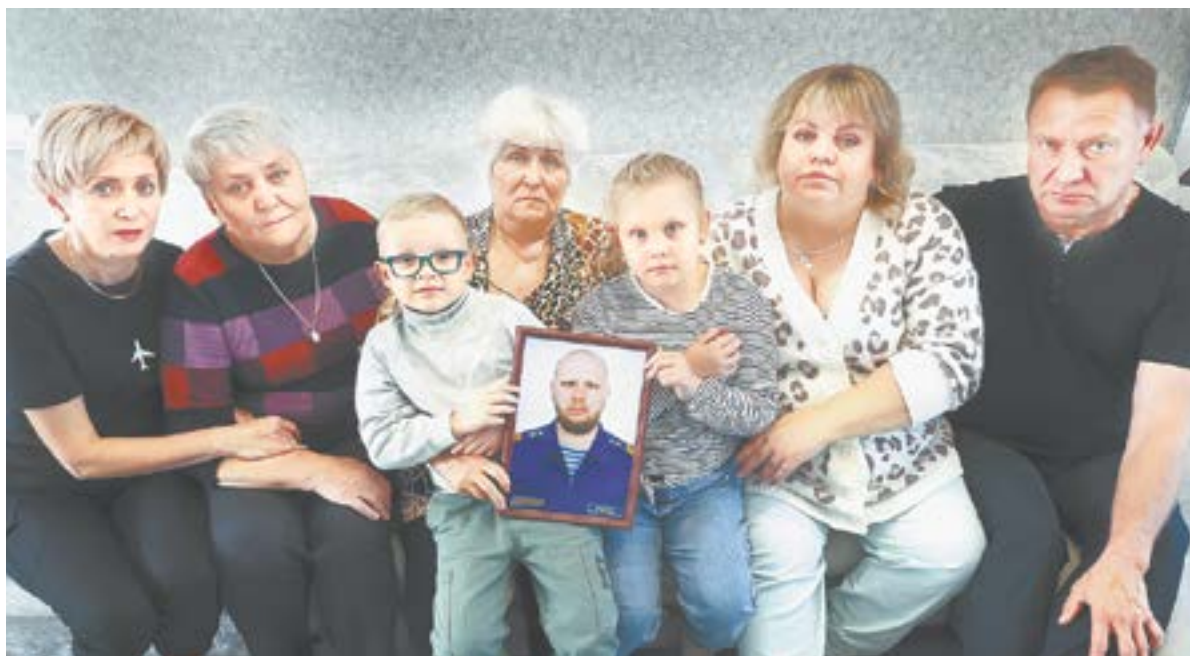
«Нет в России семьи такой, где не памятен был свой герой».