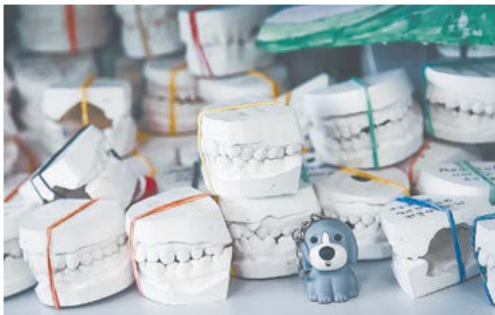
Слепки зубов до брекетов и после.

кус брекет-системой, иногда приходится прибегать к хирургическим вмешательствам, – делится Семён.