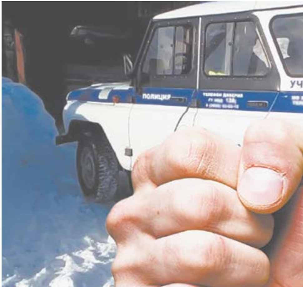
Коллаж О. ТАРАСОВОЙ.

Участковый понял, что Евгений не дышит, а проверив пульс, определил, что тот скончался. Сказал Жукову: «Ты его убил...» А тот удивился, мол, как так, несколько раз только ударил.