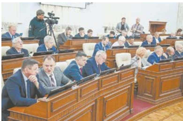
Обсуждение очередного вопроса сессии.