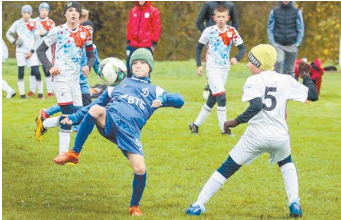
Хозяева соревнований – ребята из футбольного клуба «Патриот» – играли с повышенной мотивацией. За себя и за тренера.