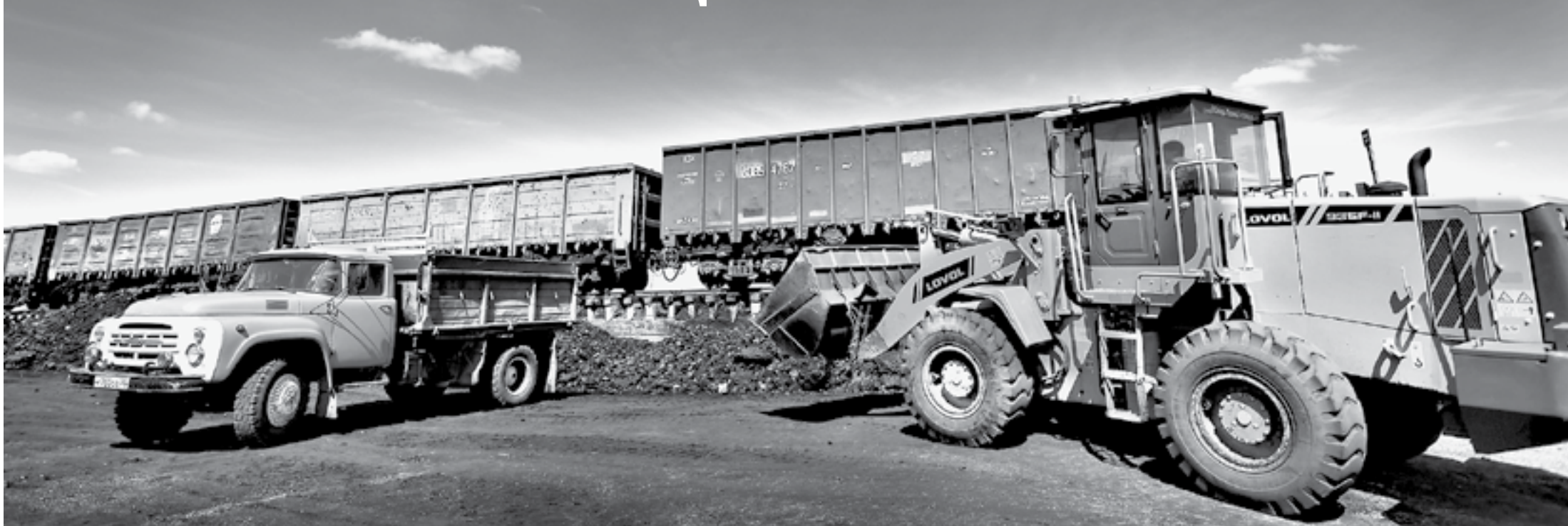
Запас угля карман не тянет.