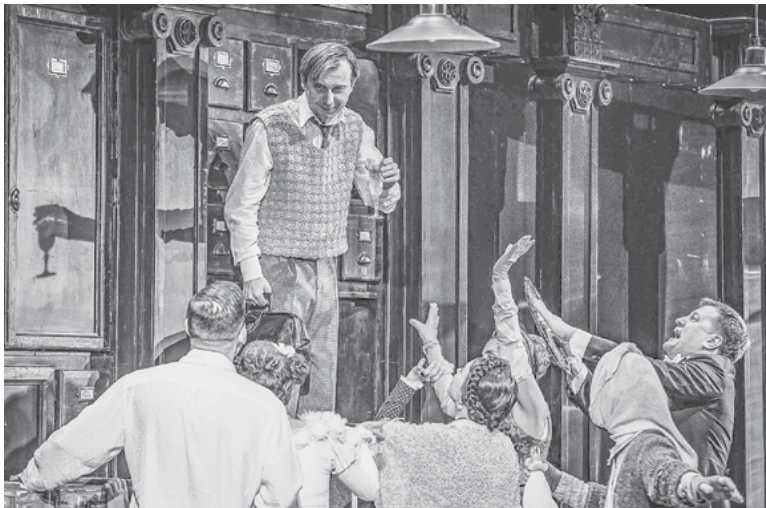
Сцена из спектакля РАМТ «Свои люди – сочтёмся».

В воскресенье в Барнауле завершился V Всероссийский молодёжный театральный фестиваль им. В.С. Золотухина.