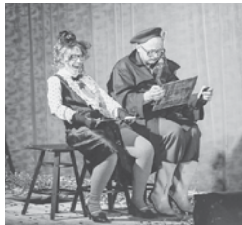
Гран-при у «Петра».