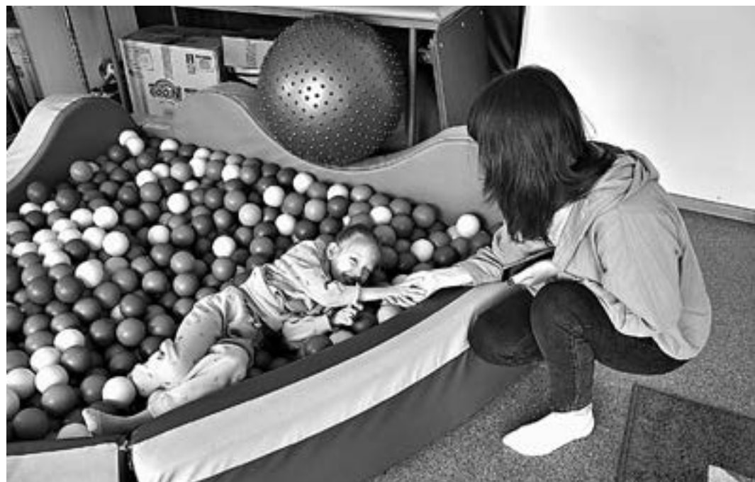
Детям — радость и польза.