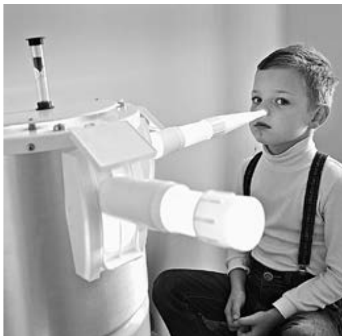
Новое оборудование избавляет от последствий ОРВИ.