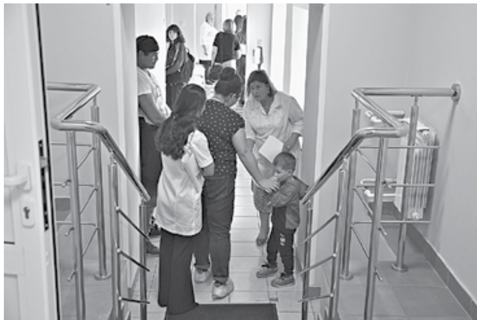
Дневной стационар рассчитан на 15 мест.