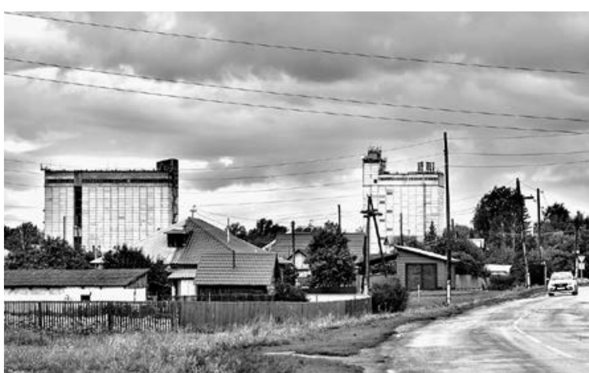
Комбикормовый завод – якорное предприятие Повалихи.

Такая структура сложилась исторически. Село стоит в природоохранной зоне Кислухинского заказника. Не разбегившись с организацией производства. Только сельхозсектор, только то, что не навредит биоценозу.