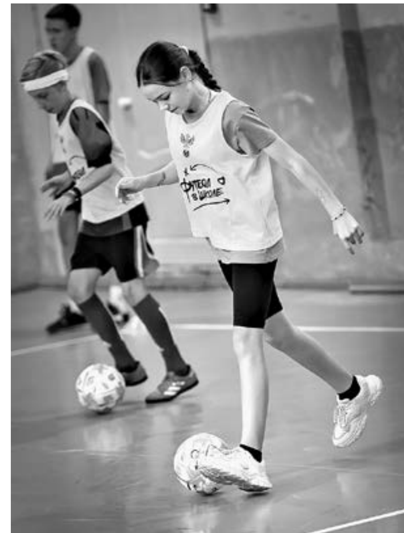
Главная цель – чтобы детям понравилось.