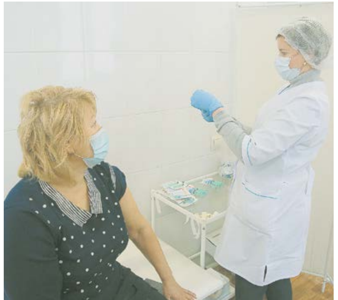
Медики планируют вакцинировать 1,3 млн человек.