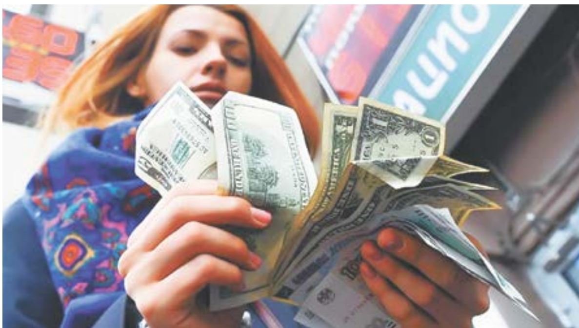
Покупать или продавать доллары – каждый решает сам.

Таким образом, получается, что ЦБ будет продавать валюту на 21,4 млрд рублей, а Минфин ее скупать на 13,15 млрд. И продлитесь эта акция в поддержку рубля неделю. А дальше ведомство Антона Силуанова, получается, будет играть против национальной валюты?