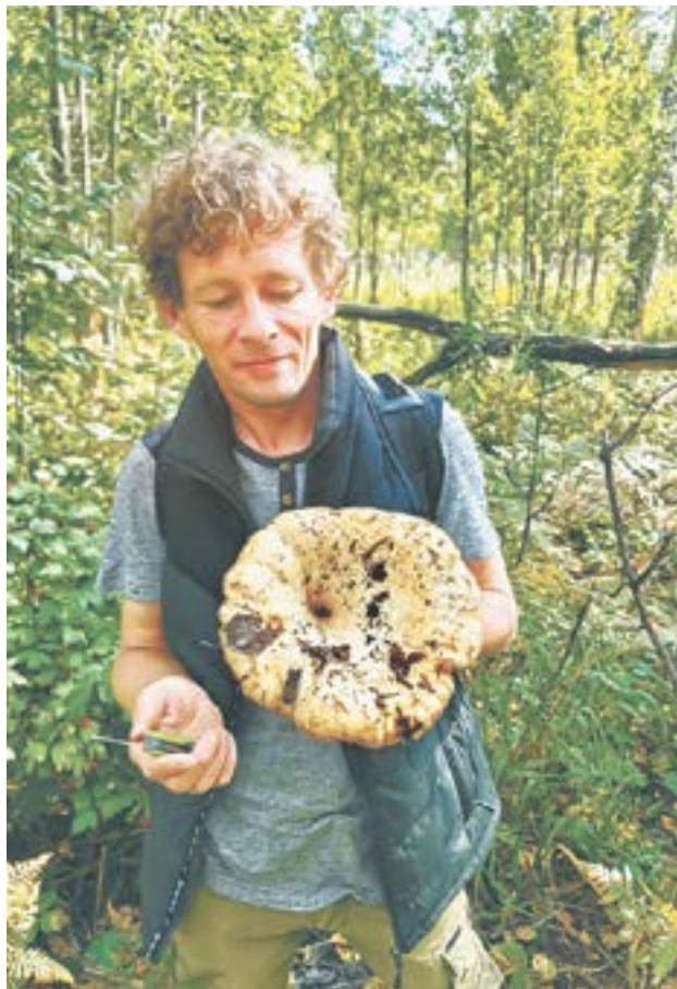
Сентябрь преподносит сюрпризы.