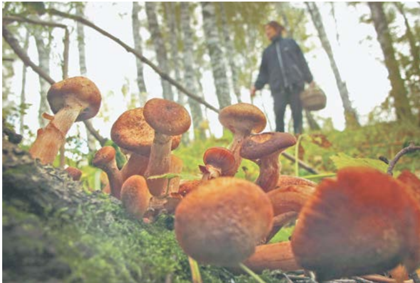
Грибникам еще есть что найти.

Сезон тихой охоты подходит к концу. Этим летом у жителей Алтайского края случился настоящий «грибной бум». В разных районах они собирали небывалое для многих количество белых, лисичек, маслят, подосиновиков, груздей... Попадались «охотникам» и редкие виды. Например, гриб ежовик (Гиднеллум Пека), похожий на кекс, только вместо изюма из него торчат кроваво-красные капли. Из-за чего в народе его называют «кровоочащим зубом», трутовик (Феолус Швейница), вес которого оказался более двух килограмм. Гриб под названием «Олень рожки», что похожи на морской коралл.