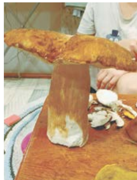
И такого гиганта находили.