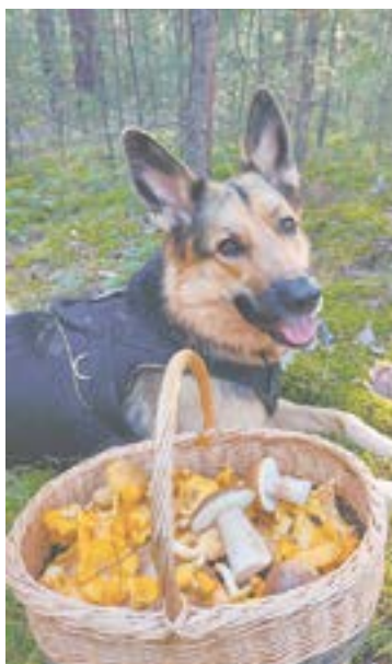
... и обычные.