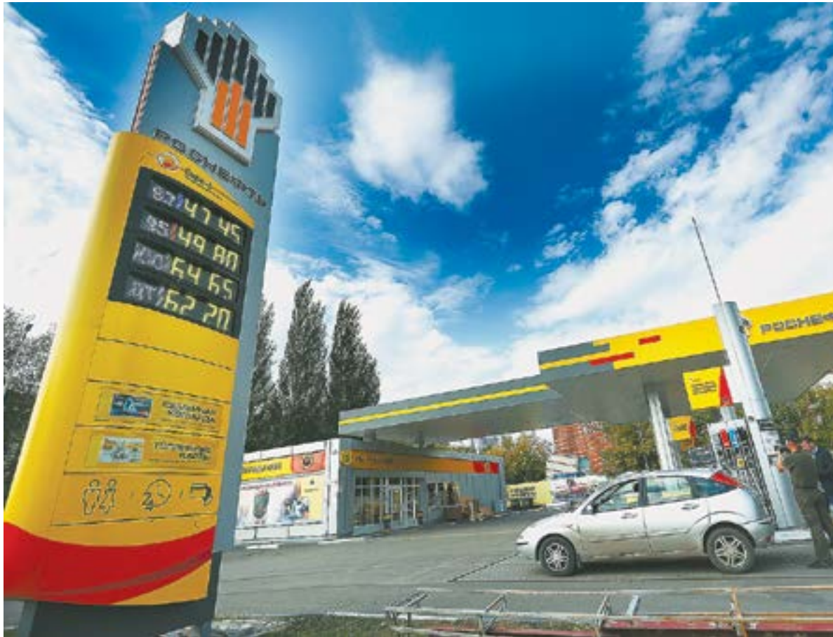
Нефтеперерабатывающие компании могут себе позволить самые низкие розничные цены.

Он напомнил, что в Центральной России расположено 30 НПЗ, а в Сибири близкие к нам только два – в Ачинске и Омске, где