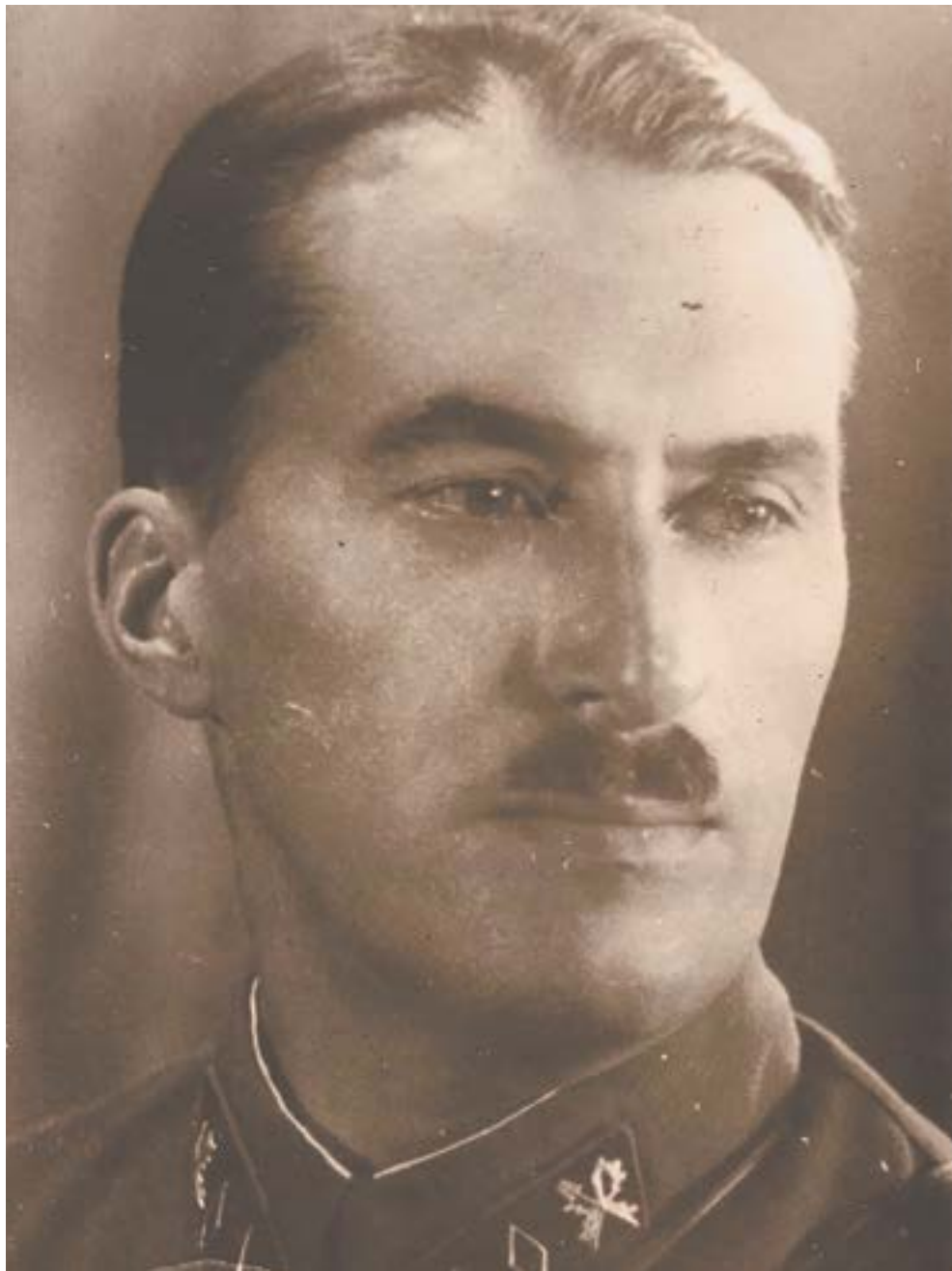
Генерал Константин Пядышев.

8 сентября 1941 года немцы захватили Шлиссельбург. С этого времени началась блокада города на Неве. За последовавшие 900 трагических и героических дней город защищали многие советские воины, чьи биографии связаны с Алтаем. Стоит вспомнить одного из них: его решения повлияли на судьбу тысяч защитников Ленинграда.