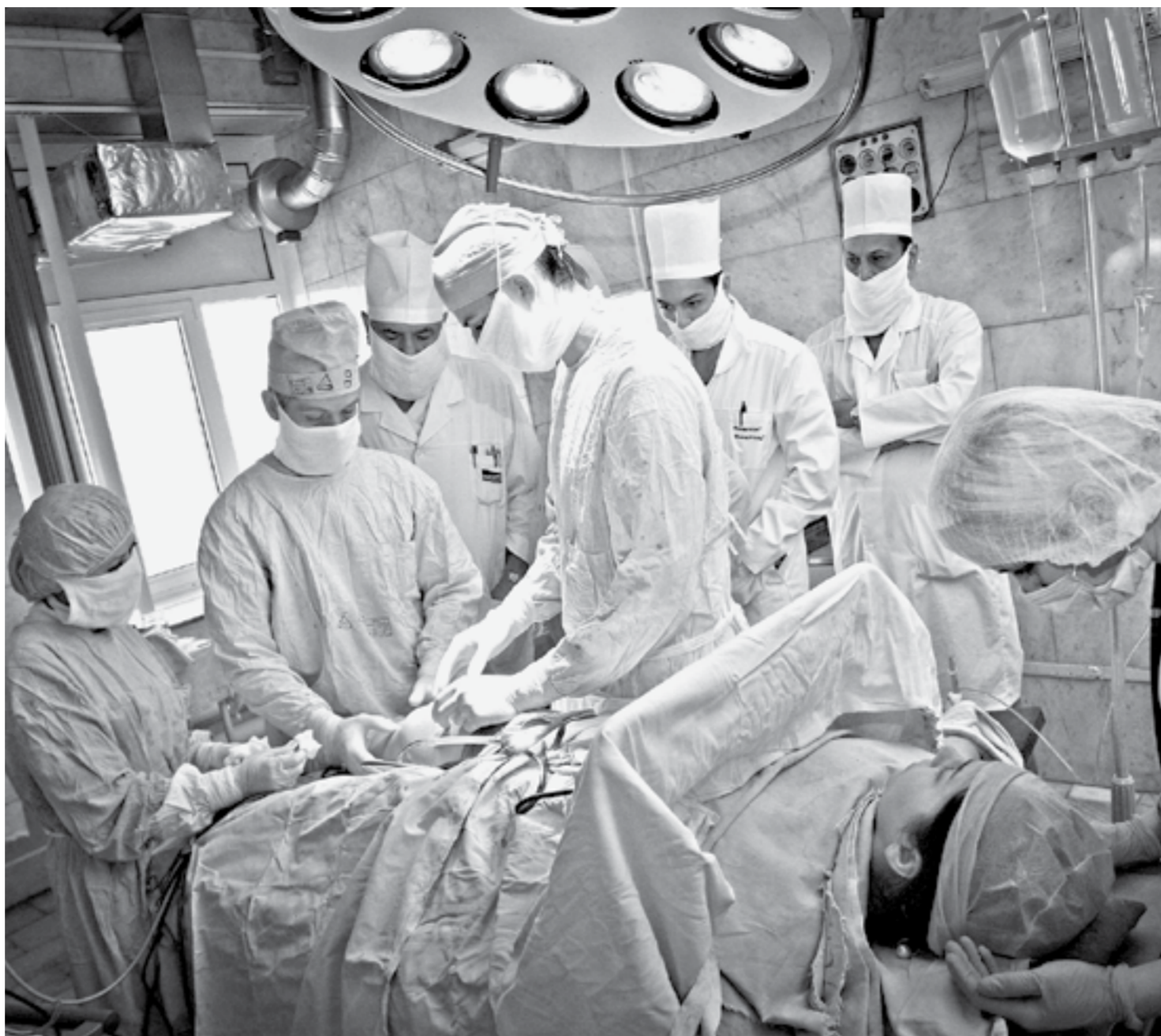
Пациентов, нуждающихся в трансплантации органов, немало.