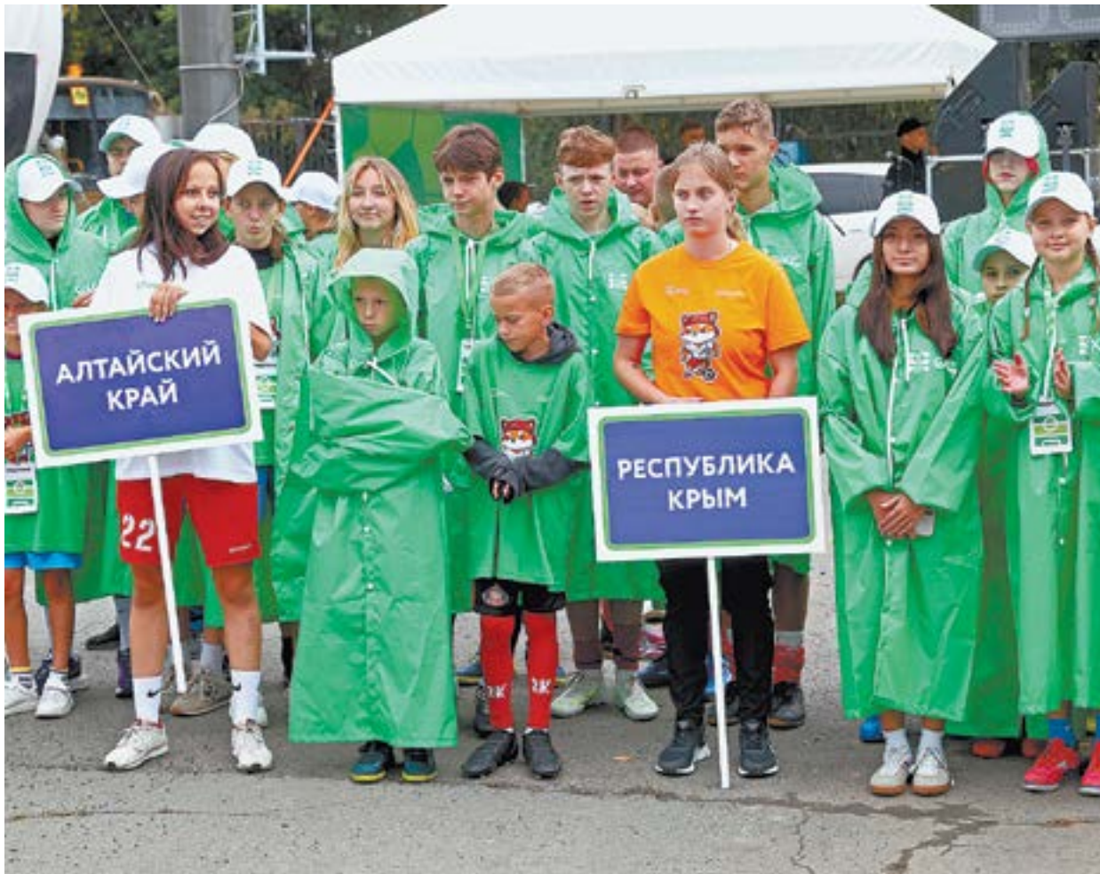
32 команды из разных районов России.