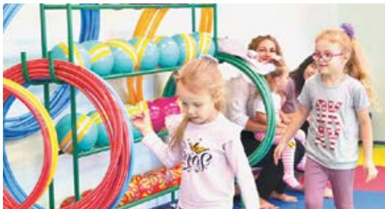
Малышам интересно заниматься в современном спортзале.

– Мне это очень интересно, люблю маленьких детей. Очень жду малышей! Хочу развивать их по системе Монтессори, а в дальнейшем разработать или найти и внедрить то, чего не было еще нигде. Сама получу новый опыт, дети будут развиваться, и роди-