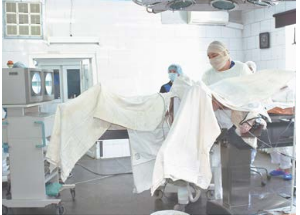
Ход операции на шейке бедра виден на мониторах.