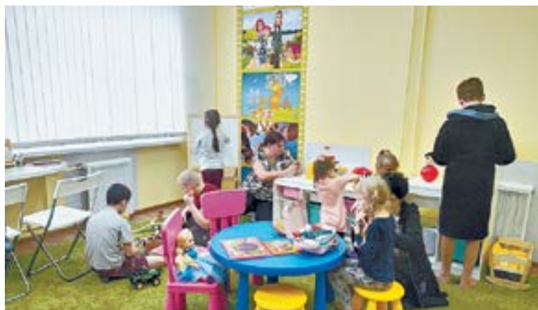
Вид игровой комнаты.

игрушки, мебель, уголки для творчества, телевизоры, – отмечает предпринимательница.