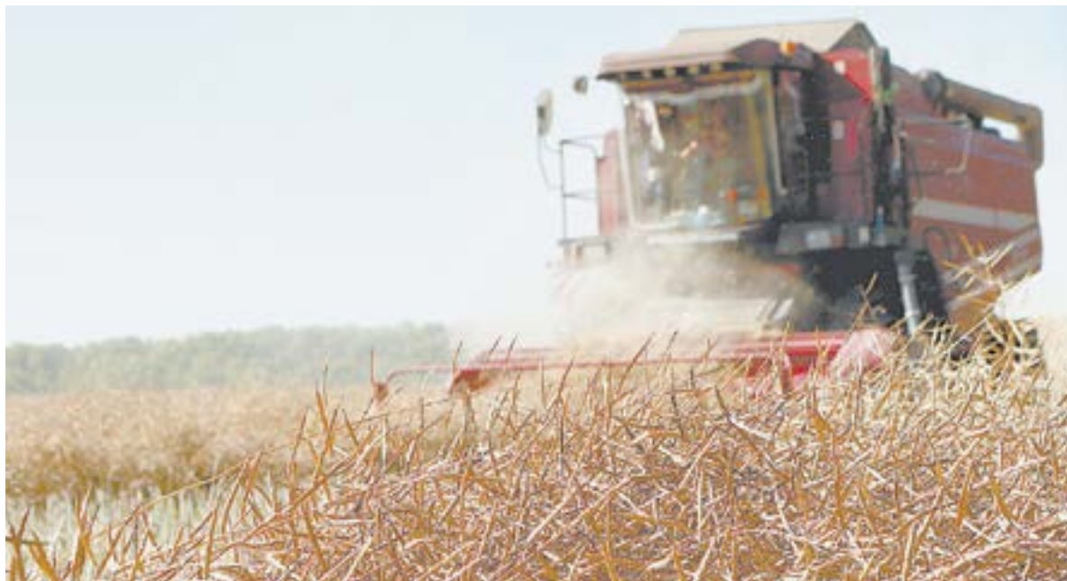
Уборка рапса в Алтайском крае завершается, а цена на него растет.

Еще несколько лет назад такие культуры, как соя, рапс, лен-кудряш считались нишевыми, а сегодня ими заняты в Алтайском крае сотни тысяч гектаров, еще больше – посевами подсолнечника. Это говорит о большом спросе на масличные со стороны переработчиков и, соответственно, интересе наших крестьян. Но последних волнуют цены, которые постоянно скачут. Угадать их пытались эксперты формулы «Зерно Сибири», который недавно прошел в Барнауле.