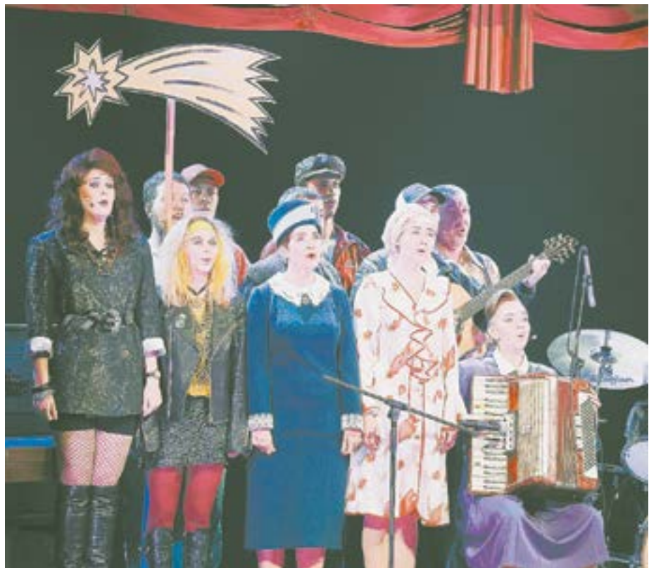
Сюжет прерывается музыкальными номерами в живом исполнении.