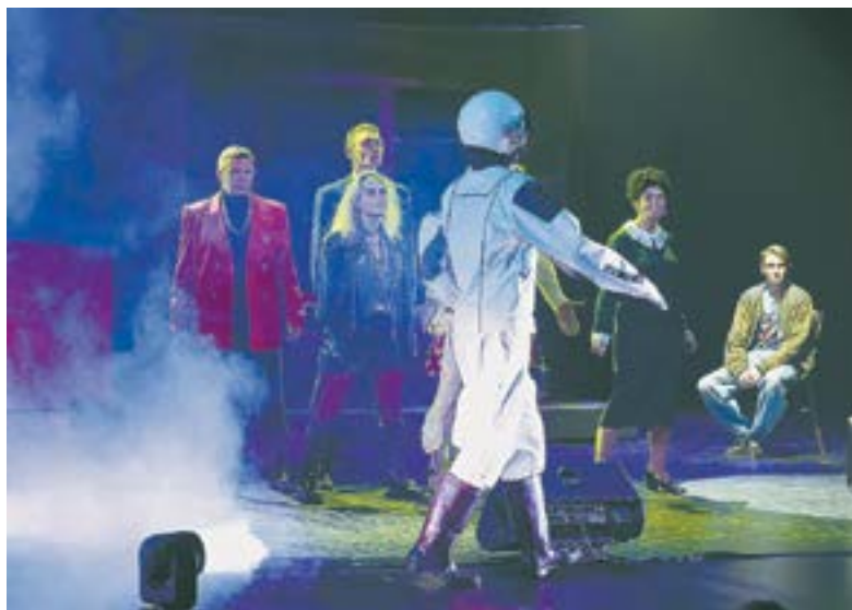
Покинуть дом – как улететь в космос.