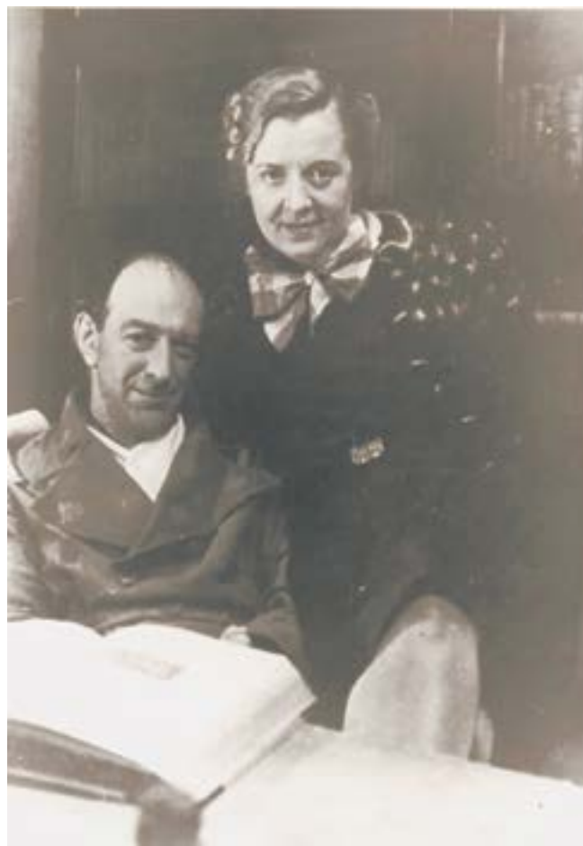
Вадим Шершеневич с женой.

Знаменитый поэт, прославившийся провокационными стихами, совершенно непонятными советскому человеку из глубинки, вдруг возникает в начале Великой Отечественной войны в Барнауле. Уму непостижимо! Его вместе с женой эвакуировали сюда в качестве организатора агитбригад! Он действительно выступал на заводах с патриотической лирикой, вдохновляя трудящихся на героический труд в тылу. Говорят, что в конце своего творческого пути поэт несколько растерял свой имажинистский пыл и встроился в реалии советского литературного пространства.