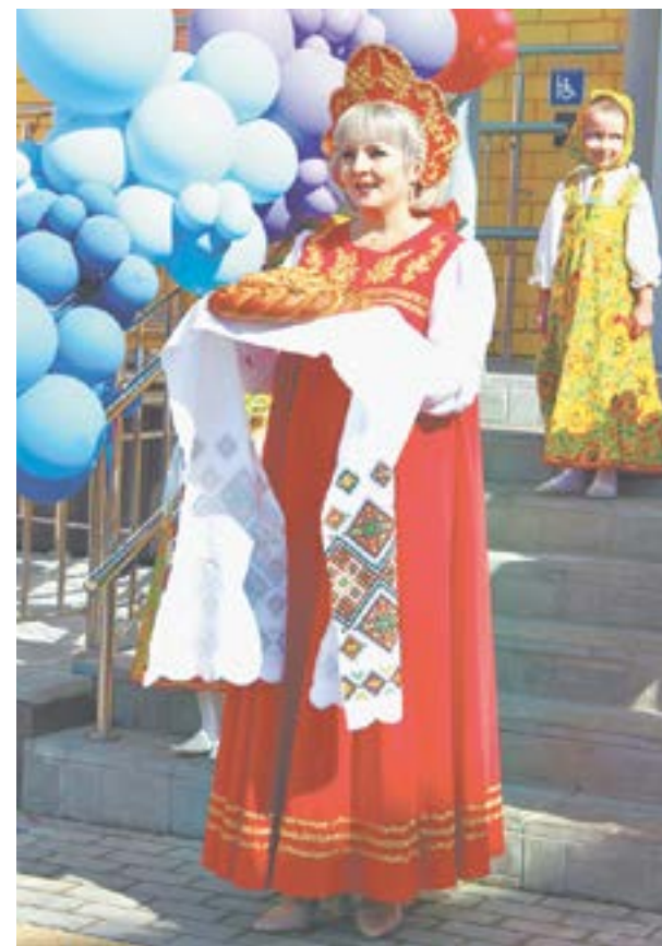
Гостей встречали хлебом-солью.