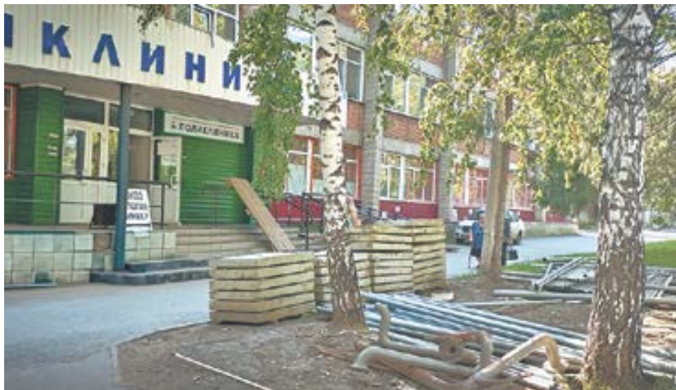
После реконструкции получить медицинскую помощь станет быстрее и удобнее.

Ремонтируется весь первый этаж, но прием пациентов не прекращается. Правда, врачам пришлось сменить кабинеты. Некоторые специалисты продолжают при-