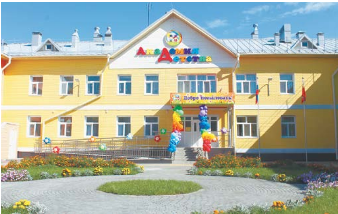
Новый детский сад рассчитан на 280 ребятшек.