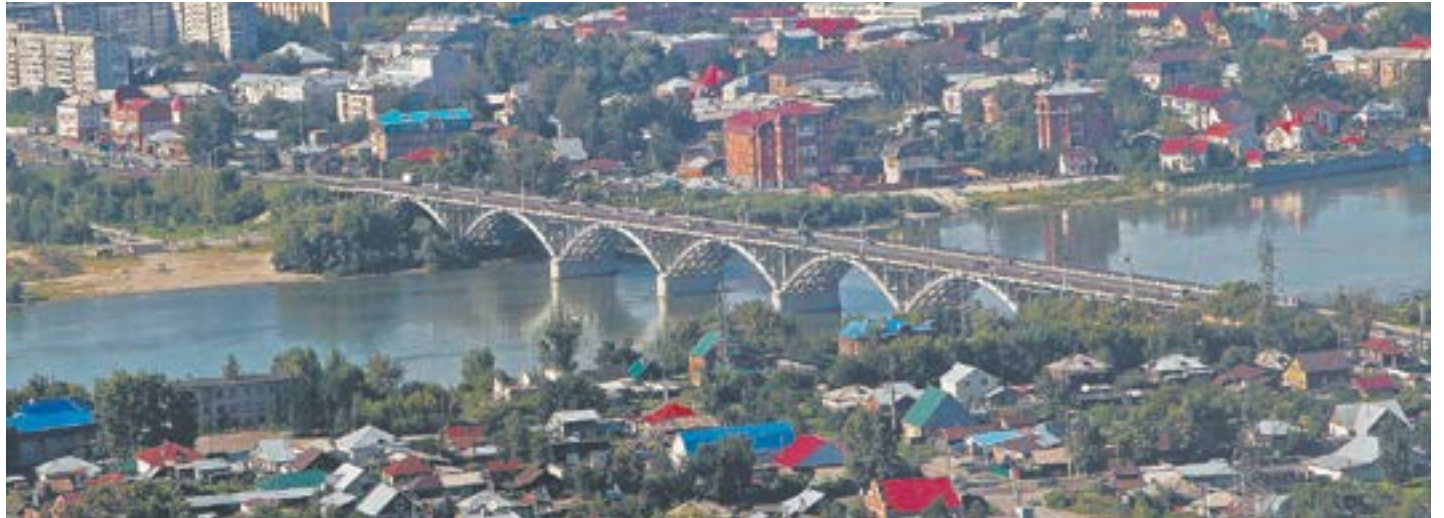
Краевые власти уделяют большое внимание развитию наукограда.

Губернатор Алтайского края Виктор Томенко и полпред президента в СФО Анатолий Серышев на днях побывал в Бийске. В ходе рабочей поездки они посетили оборонные предприятия и предприятия легкой промышленности. Подробности в нашем материале.