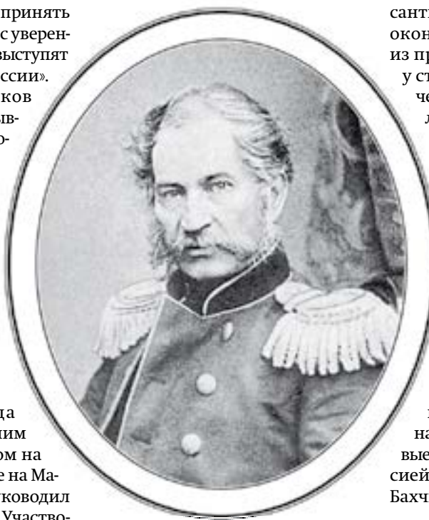
Егор Петрович Ковалевский (1809–1868)

Его брат, профессиональный военный, генерал-лейтенант Пётр Ковалевский, в войну 1853–1855 годов удачно защищал Ахалцах, разбил турок под Суфлисом, осаждал Ардаган и командовал частью главных сил кавказской армии при штурме Карса 17 сентября 1855 года. При этом штурме он получил рану, от которой и умер. Крепость позже взяли измором. Чтобы оценить значимость этого события, надо знать, что по условиям Парижского конгресса Севастополь и другие занятые города в Крыму возвращались России в обмен на Карс – «ворота в Персию и Индию», как называл его министр