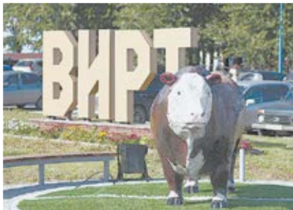
Легендарный бык Степан.