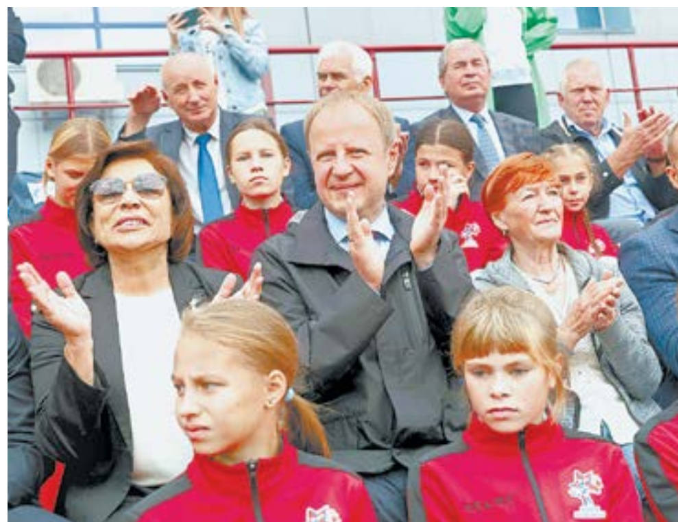
К приему турнира готовы.