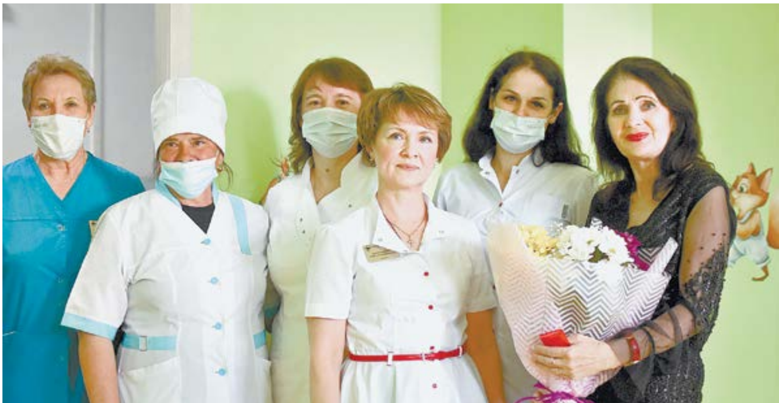
Команда врачей и благотворителей на открытии детского пространства.

– В комнатах есть все для того, чтобы маленькие пациенты могли отвлечься от лечения и просто побыть детьми: новые