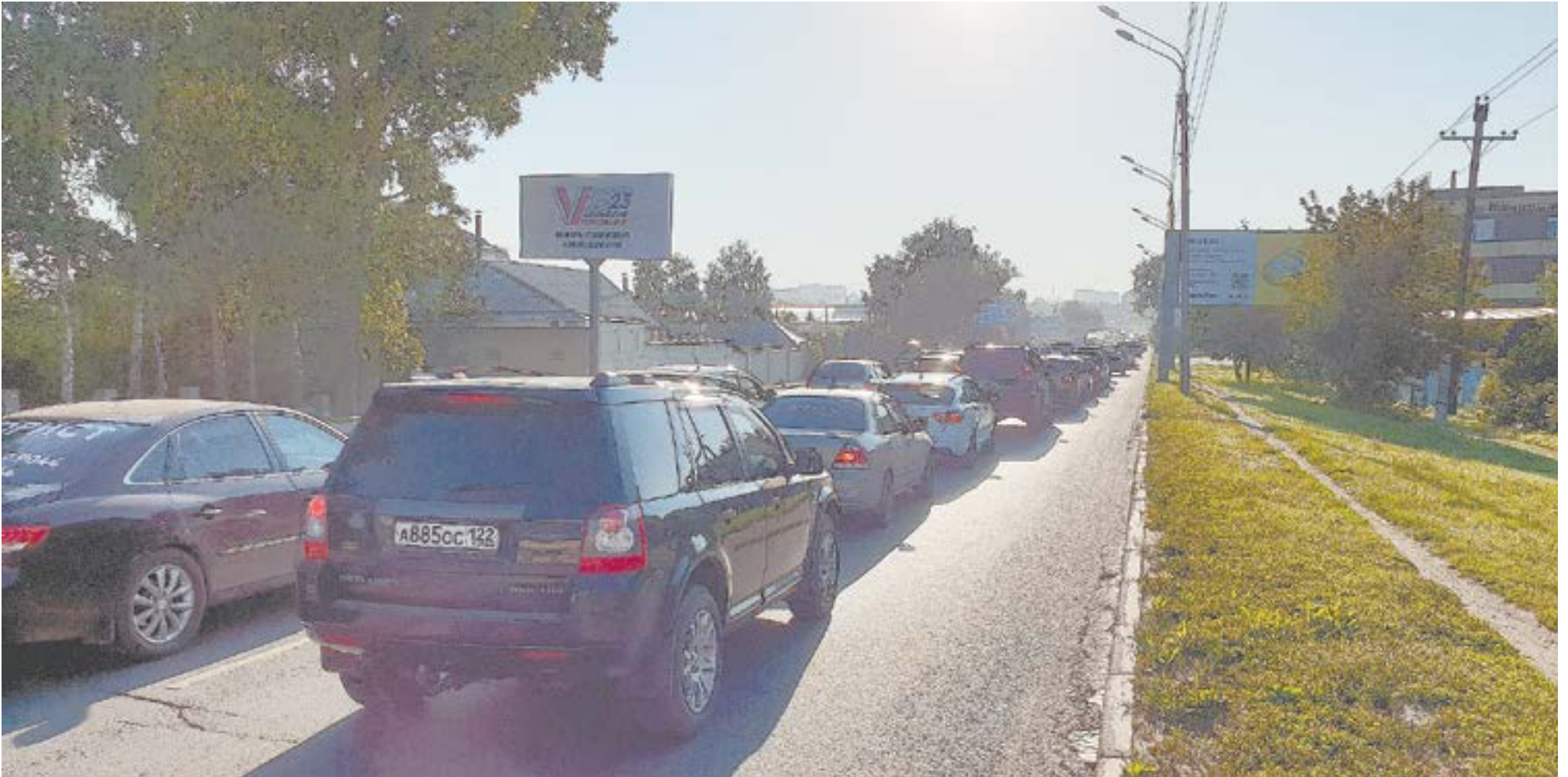
Пробка перед ул. Фурманова. Место еще для одной полосы занимают столбы.

Этот полет по Павловскому тракту я не забуду до конца жизни. Во втором часу ночи надо было очень быстро добраться из центра Барнаула к перекрестку Попова – Взлётная. «Скорости не боишься?» – спросил меня таксист. Светофоры в такое позднее время не работали, и мы мчались 150 км в час, притормаживая перед редкими камерами видеонаблюдения.