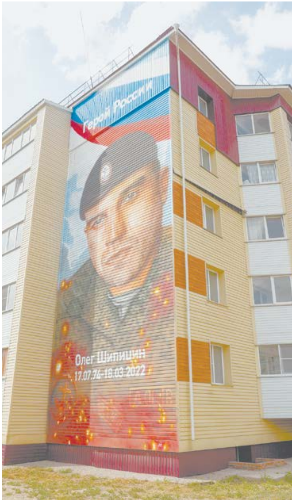
В Рубцовске в июне появилось настенное изображение погибшего земляка-морпеха Героя России Олега Шипицина.

В Змеиногорске в апреле было решено продолжить существующий мемориал участком, посвященным погибшим землякам – участникам СВО.