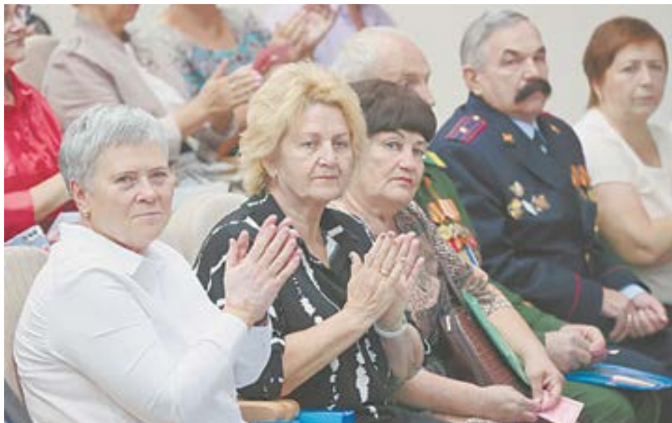
Представители краевых ветеранских объединений.