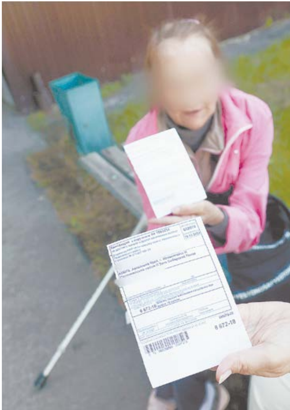
Лица, адреса и имени женщины не показываем по этическим соображениям.