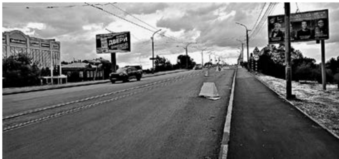
Совсем скоро будут открыты обе стороны коммунального моста.

На мосту уже работает трамвай. – При ремонте столкнулись с тем, что трамвайные пути были сделаны по ГОСТам со-