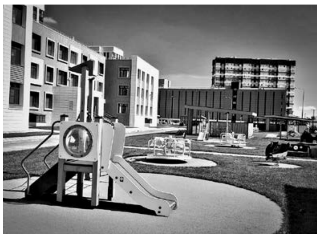
Детский сад – как в сказке.

– Других слов, кроме «молодцы», не подберу, после того как посмотрел кабинеты, которые оснащены всем необходимым в соответствии с преподаваемым предметом. Но главную оценку дадут дети, когда придут сюда 1 сентября.