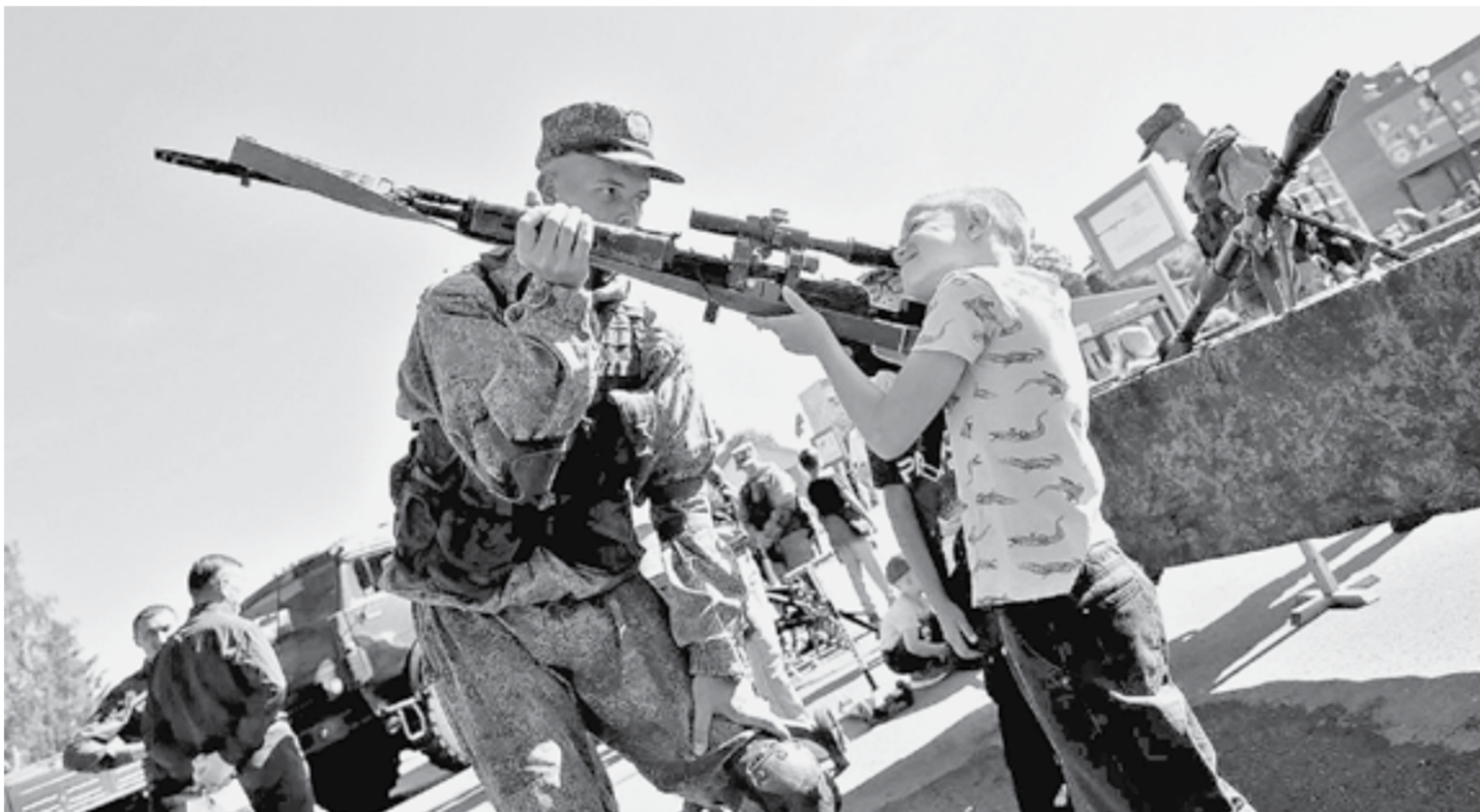
Мальчишкам на празднике вдвойне интересно.