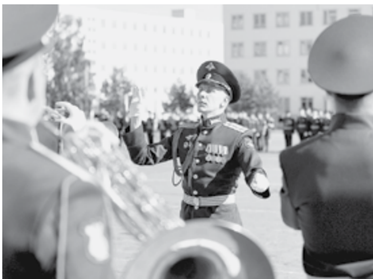
Под звуки военного марша.