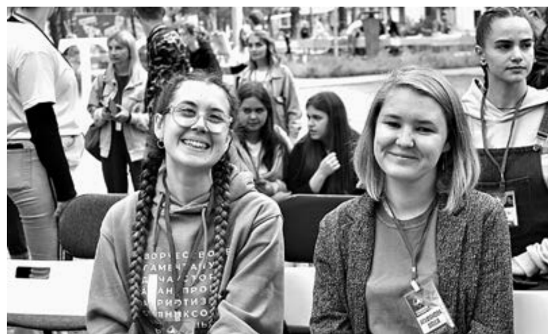
Форум заряжал энергией и положительными эмоциями.