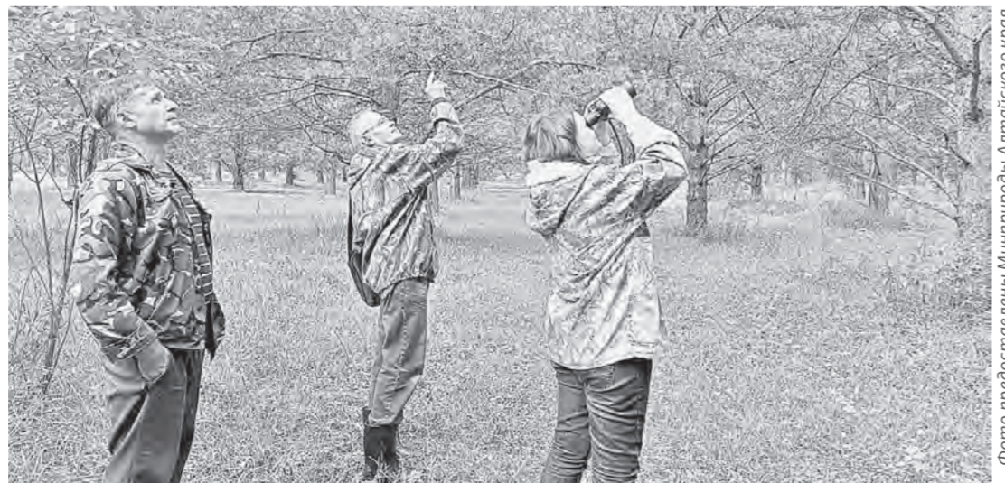
«С бору по сосенке!»

Главная проблема в том, что большая часть урожая шишек сосредоточена в верхней и средней части крон семенных деревьев на высоте 7–9 метров и является труднодоступной.