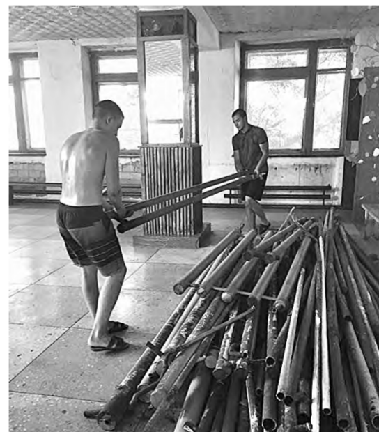
Ремонт Дома культуры в Верх-Чуманке.

Упакованные подарки были отправлены в Союз женщин Алтайского края, откуда вместе с комплектами, собранными неравнодушными жителями других территорий региона, они отправятся адресатам. «Наверняка получение посылки из Алтайского края для школьников из ЛНР станет настоящим праздником, ведь многих из них родители не смогли бы собрать в школу самостоятельно», – пишет «Новый путь».