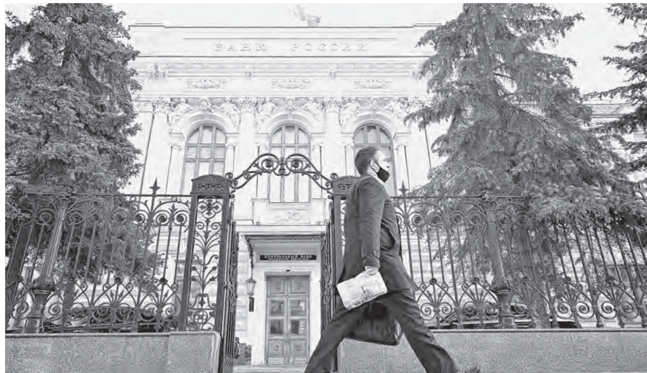
Мезарегулятор пока принял часть возможных мер, но они уже дали результат.

Надо полагать, что дополнительные деньги в основном пошли предприятиям ВПК и военнотруженикам. Но когда они возвратились в виде