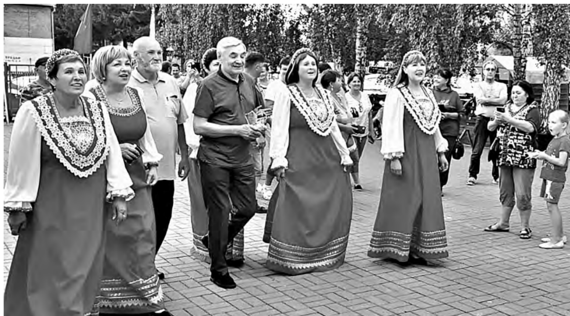
Встреча Александра Панкратова-Чёрного с земляками.