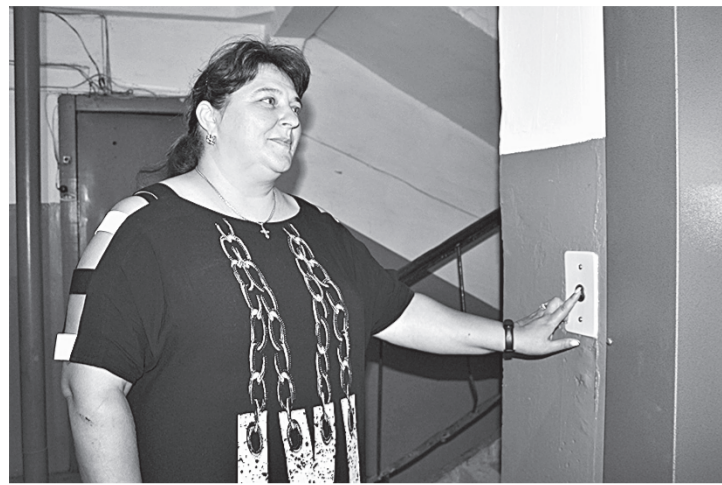
Жители дома с удовольствием пользуются новым лифтом.