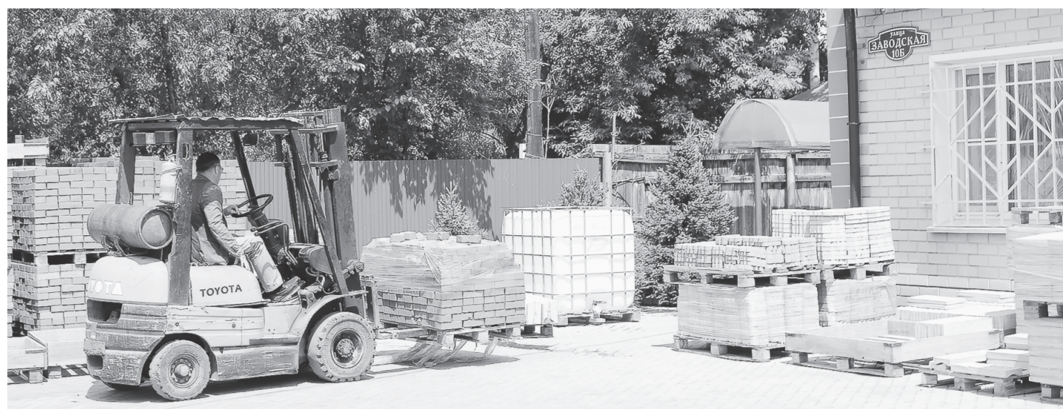
В летний период тротуарная плитка пользуется спросом у местных жителей.

Тем не менее за прошлый год, согласно данным из открытых источников, выручка предприя-