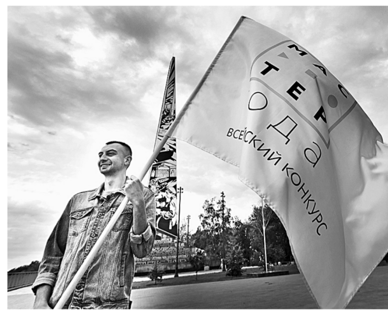
Шествие стартовало с Нагорного парка.