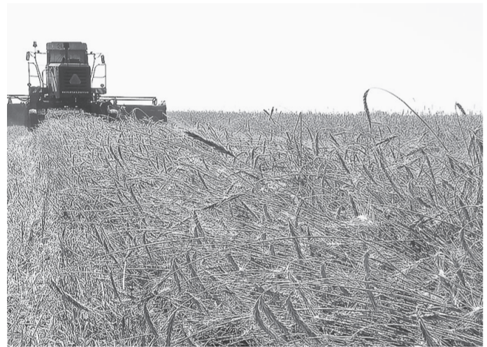
Рожь в этом году удалась на славу.