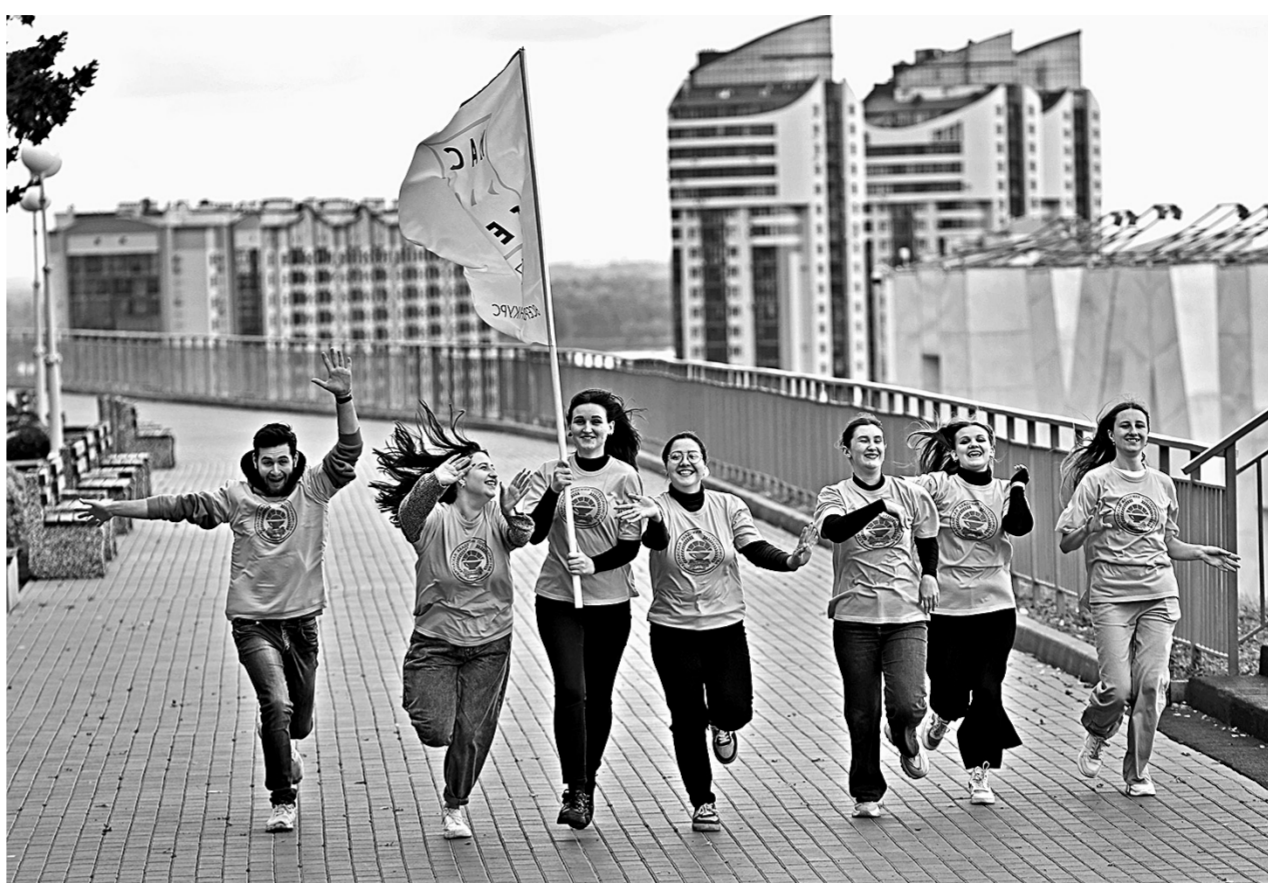
Флаг Всероссийского конкурса «Мастер года» повидает всю страну.

Эстафета перешла в Барнаул из Южного федерального округа. В Алтайском крае оператором ее приема и передачи стала Алтайская академия гостеприимства, преподавателем