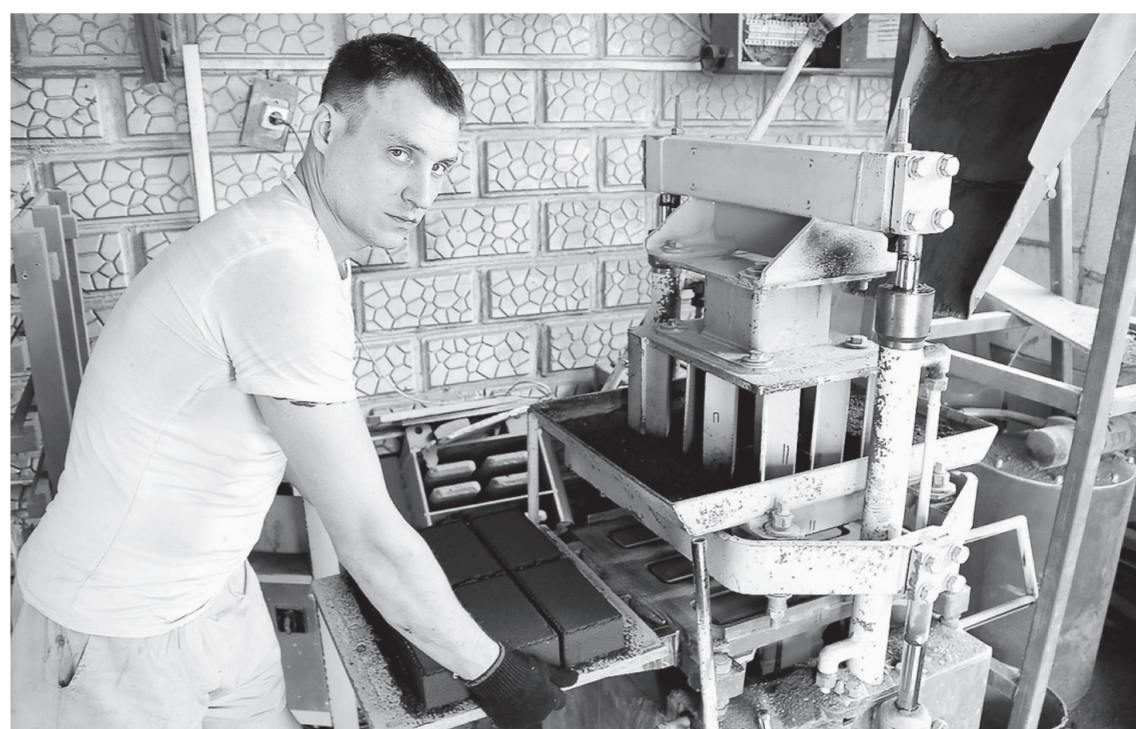
Оборудование для вибропрессования приобретено на краевые деньги.

тия увеличилась на 16%, а чистая прибыль – на 29%. В этом году рост продолжается.