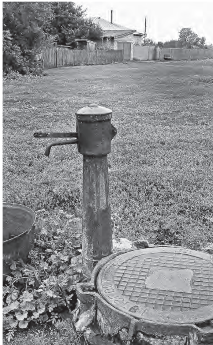
Перебои с водой случаются часто.

Несколько населенных пунктов Рубцовского района страдают от отсутствия воды.