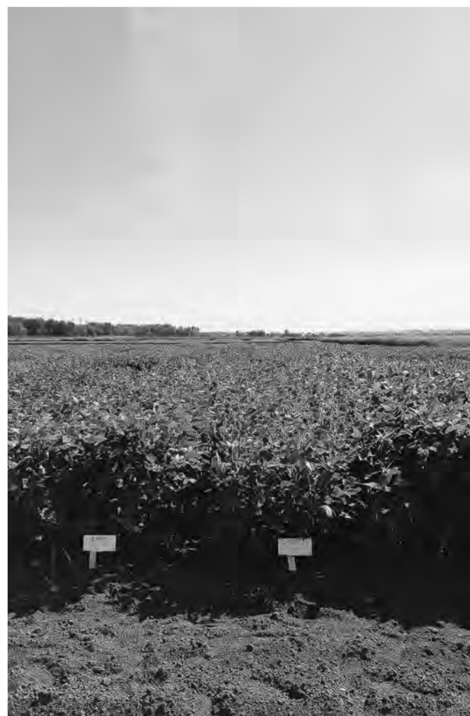
Соя «альфа» обещает стать популярной.