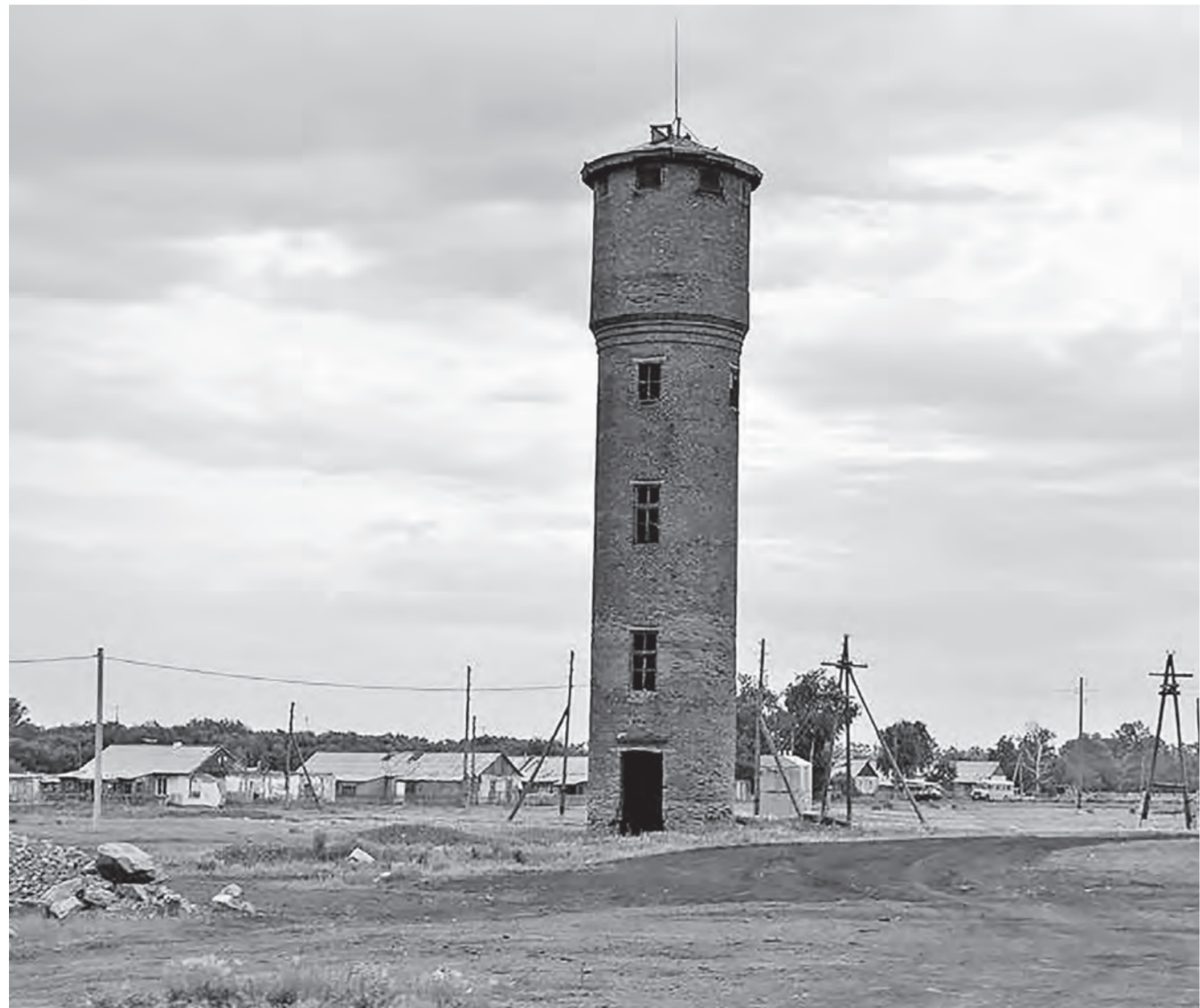
В Дальнем есть водонапорная башня, но нет воды.