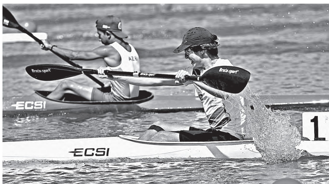
Турнир собрал беспрецедентный состав участников.

Например, было любопытно и приятно понаблюдать, как юные гребцы из России и Индонезии пытались общаться перед стартами. Трудность заключалась в том, что гости из Юго-Восточной Азии не знали ни одного языка, кроме своего родного. Поэтому ребята