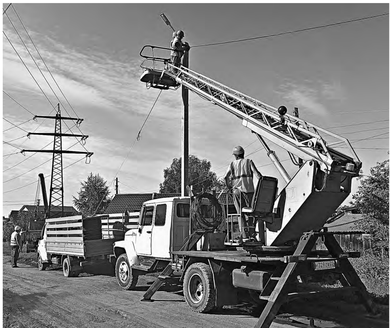
Высоко сину, освещение монтирую.

РЕКЛАМА «АП», ул. Короленко, 105, 5 этаж, 501 каб. Тел. 63-34-78.