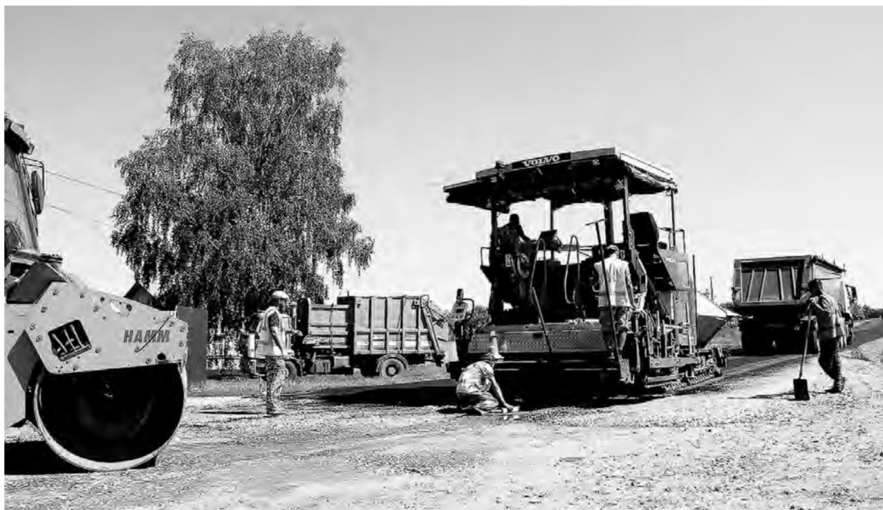
Укладка асфальта в разгаре.

На прошлой неделе в поселке Беловском Троицкого района произошло грандиозное по местным меркам событие – там построили асфальтированную дорогу стоимостью 3 817 тыс. рублей.