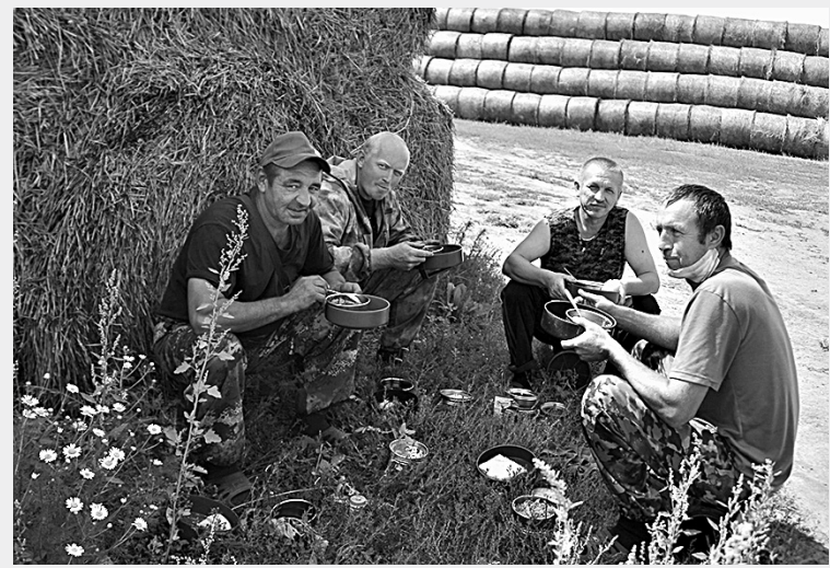
Обед для механизаторов.

хлеб и чай. Пшца незамысловатая, но от термосов идет невероятный ароматный запах: готовить в столовой СПК «Колос» умеют — в этом неоднократно корреспонденты «Знаменки» убеждались лично.