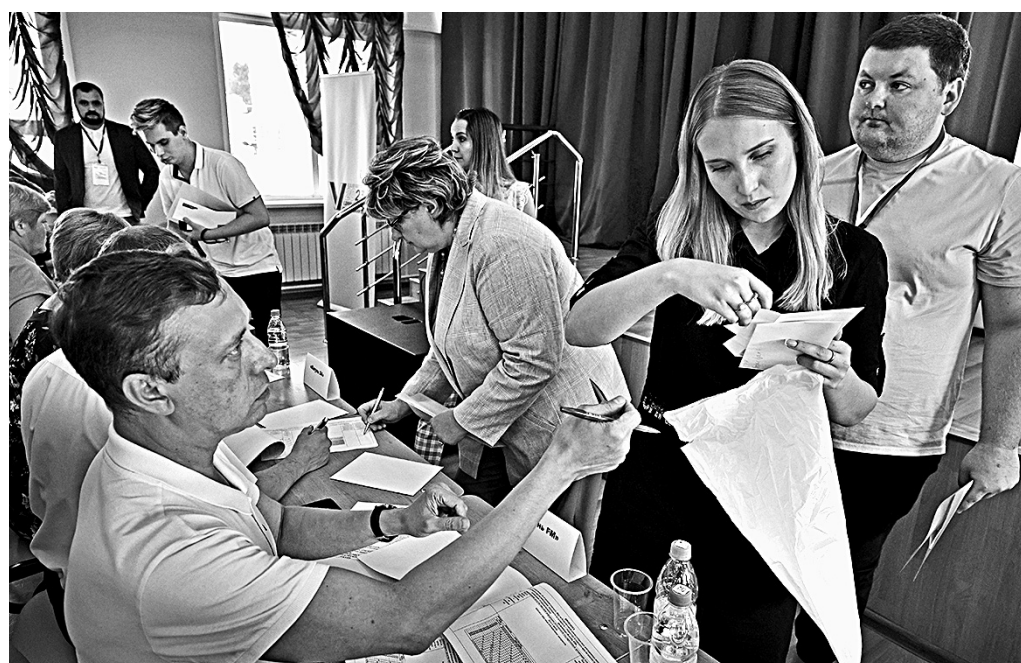
Представители кандидатов проходили жеребьевку в очереди, в накой они регистрировались в Избиркоме.