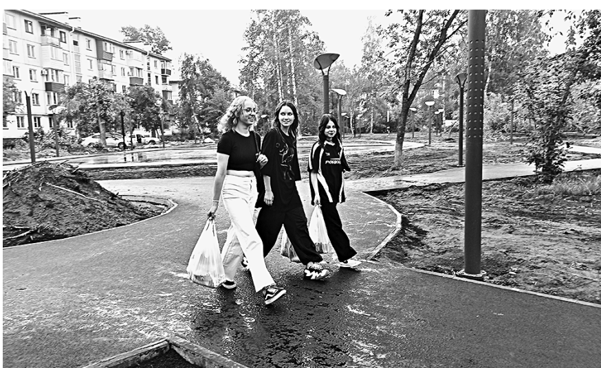
Вдоль асфальтовых дорожек.

В Бийске завершается благоустройство нового сквера в микрорайоне АБ. Пока эта территория не имеет никакого названия, но думается, что до этого недалеко. Зеленая зона спрятана от глаз людей домами на ул. Ломоносова и Радищева. Ранее здесь были просто сплошные заросли, которые особо никого и не интересовали, а теперь по асфальтированным тропинкам катаются дети на роликах, самокатах и велосипедах и неспешно прогуливаются мамы с колясками.