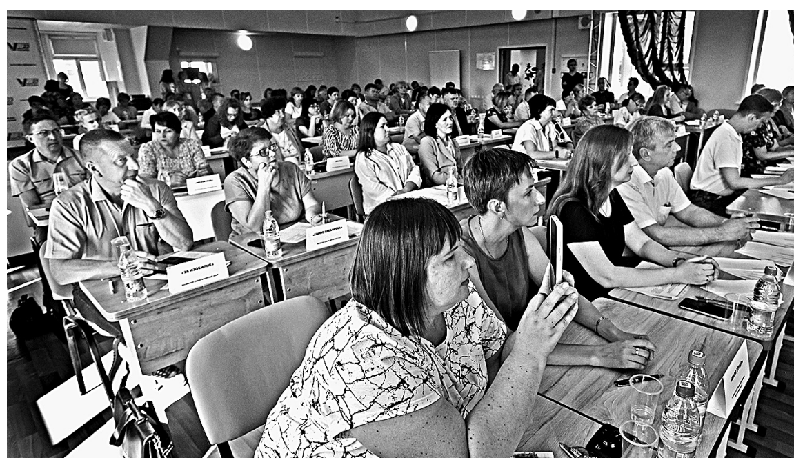
62 муниципальных издания предоставят свои площади.