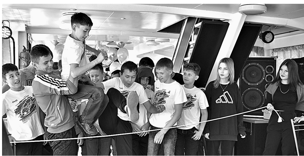
Во время путешествия ребята участвовали в конкурсах.