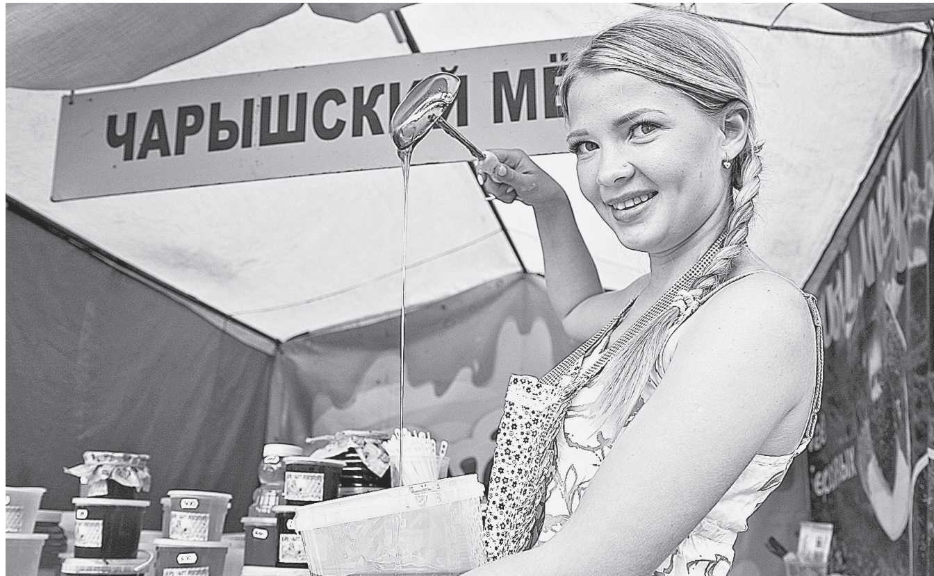
Любой покупатель ищет своего пчеловода и свой продукт.