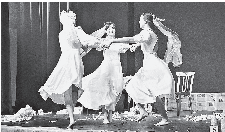
Весь спектакль на сцене играли три актрисы.