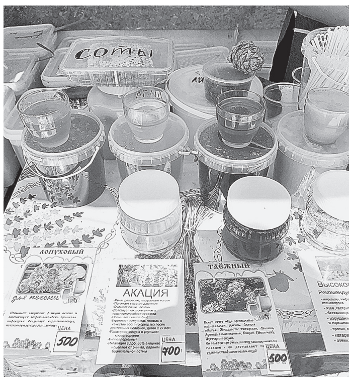
Элитных сортов в этом году маловато.

«Мед из лопуха – для желудка, мед из акации повышает гемоглобин, высокогорный – от бессонницы...», – читаем мы этикетки и пробуем сладкое, пахучее лакомство. На площади Сахарова в Барнауле заработала ярмарка меда.