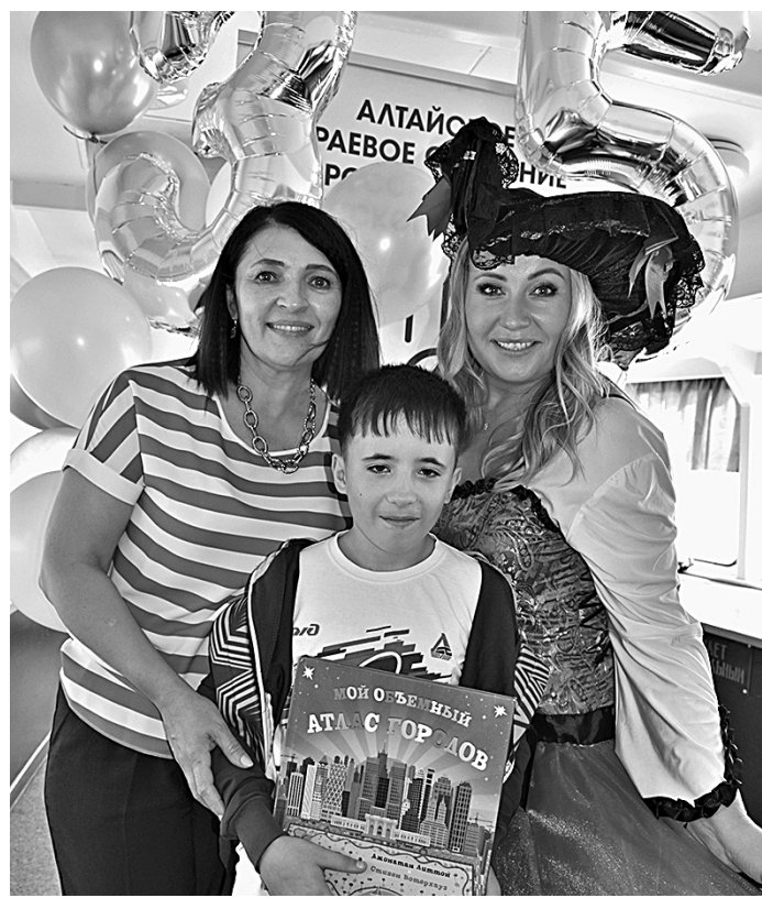
Поздравления для именинника.

— Отправиться в плавание по красавице Оби было давней мечтой наших ребят, и вот на днях она исполнилась, — делится