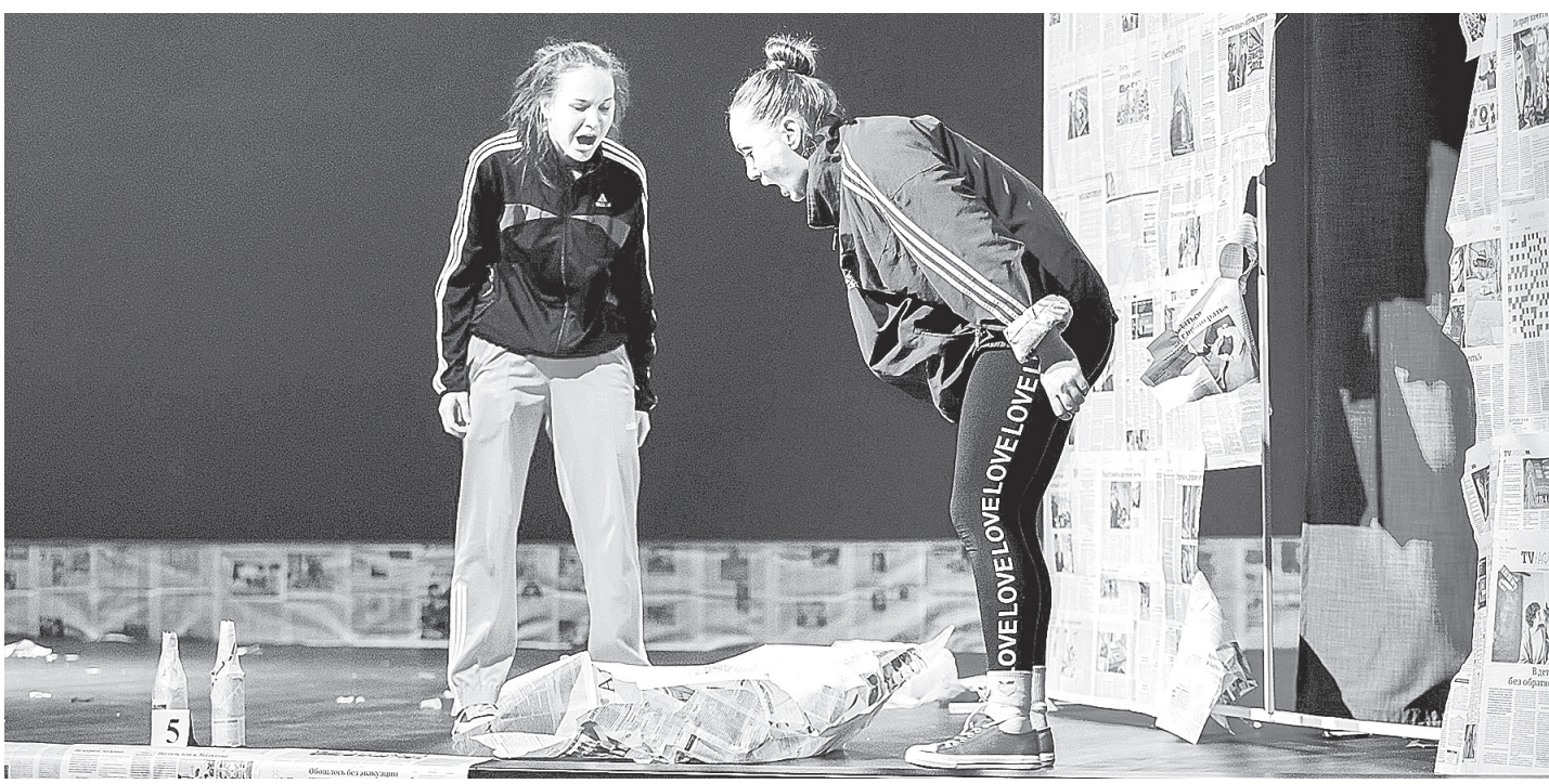
Один из кульминационных моментов. Главная мысль произведения: все идет из детства.

героиню истории, которая, влюбившись, совершила большую ошибку.