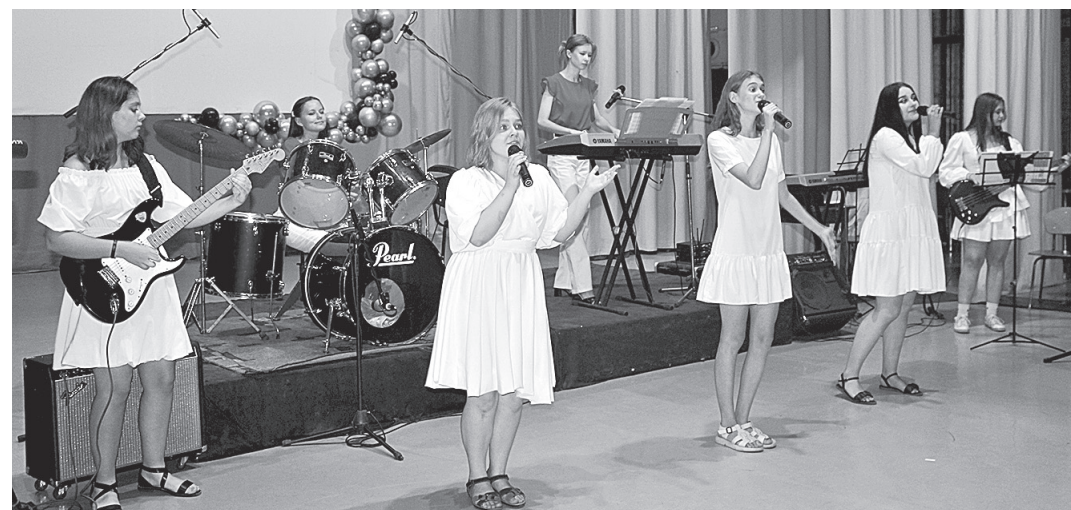
В составе ВИА всегда семь участниц.

Интересно, что группа изначально вовсе не замышлялась как эстрадный ансамбль. Скорее, это был кружок в детской музыкальной школе № 1, где учащиеся под руководством преподавателя Шатилова ова-