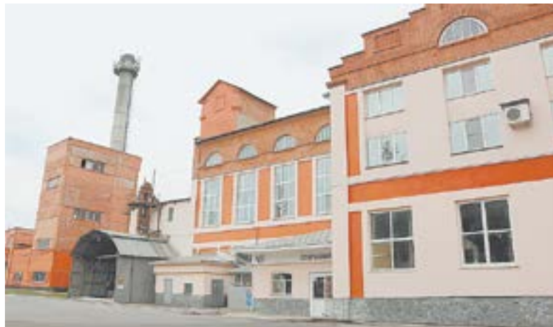
На заводе сохранилось историческое здание.