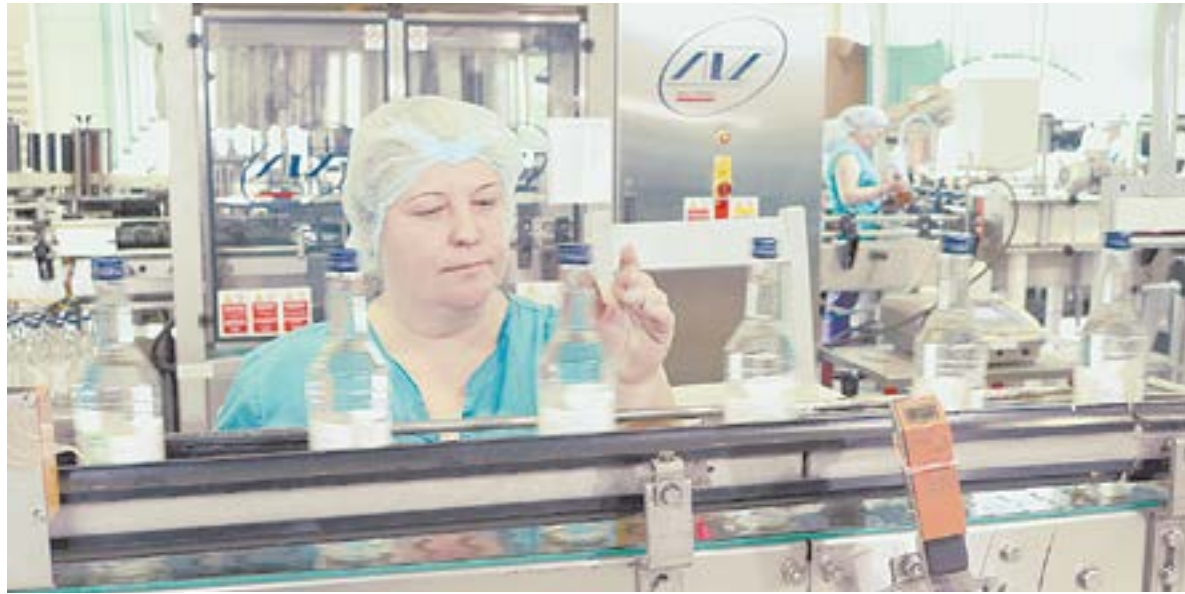
Предприятие использует свои водочные мощности только на четверть.

– Мы считаем эти претензии кредиторов совершенно необоснованными, – говорит гендиректор. – Мы приобрели завод в состоянии банкротства, погасили все его долги, которые были на тот момент (около миллиарда рублей). А потом у кредиторов ГК «Кристалл» развился аппетит. Они