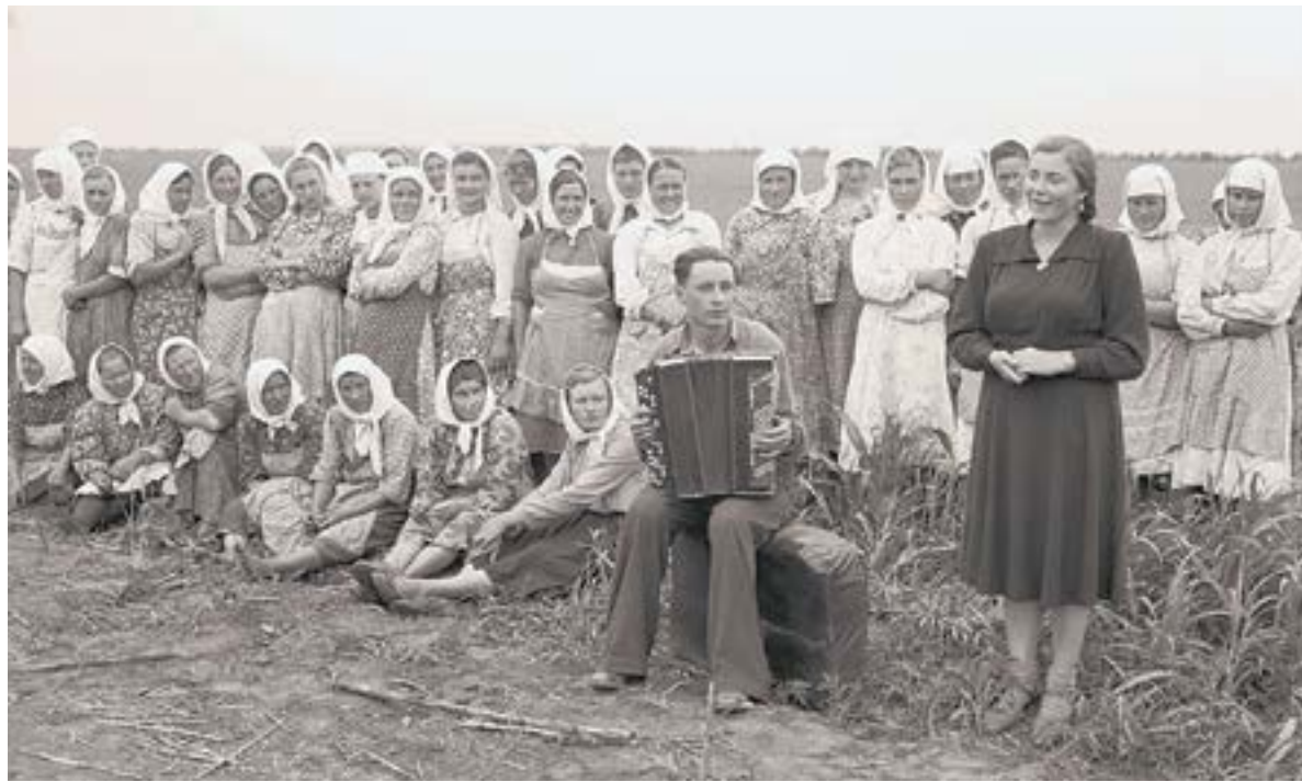
Концерт на полевом стане в годы Великой Отечественной войны.