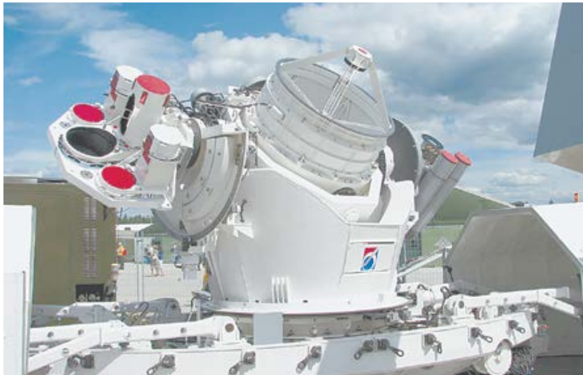
Главная задача центра – наблюдение за спутниками.

Кроме того, тут были готовая инфраструктура, дороги, недалеко населенный пункт, а значит, людские