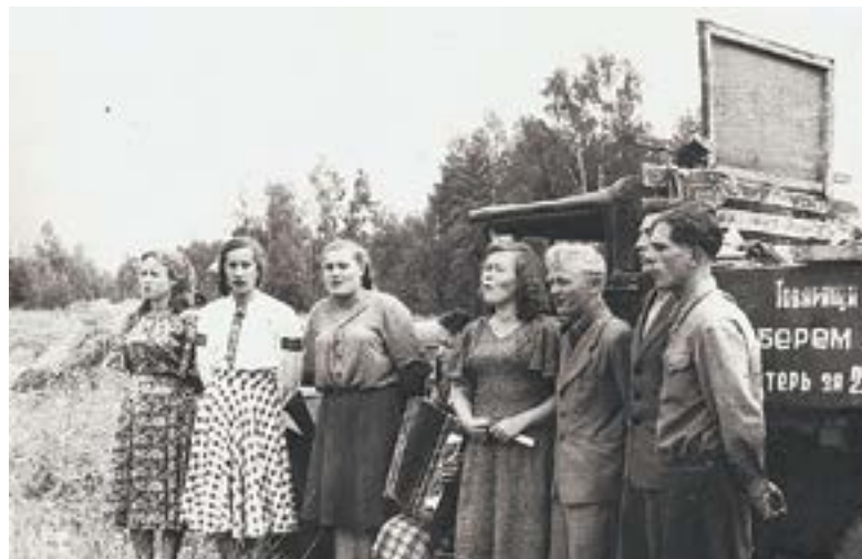
Посмотреть выступление артистов приходили за много километров.

Действительно, каких мужиков могли тогда увидеть у себя