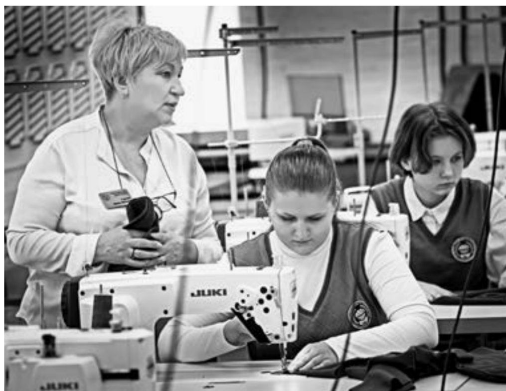
Занятие в Академии гостеприимства.

Теперь колледжи. По актуальной на конец июля информации, предоставленной пресс-службой