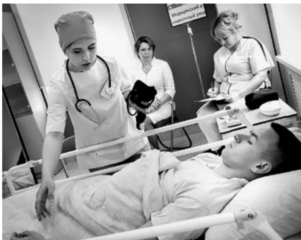
Идет экзамен в медицинском колледже.

Несложный сравнительный анализ поможет ответить на вопрос, так ли все радужно.