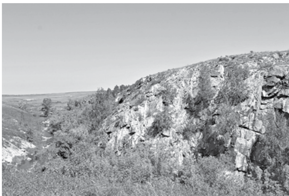
Скальный каньон на реке Кизихе признан памятником природы.

Если человек приехал на несколько дней, он может захотеть совершить выезд за пределы города. Привлекательны озера в Егорьевском районе, ленточный бор, скальный каньон на Кизихе, признанный памятником природы, Кольванское озеро, Белое озеро, гора Синюха, Музей Калашникова в Курье, камнерезный завод в Кольвани и многое другое.