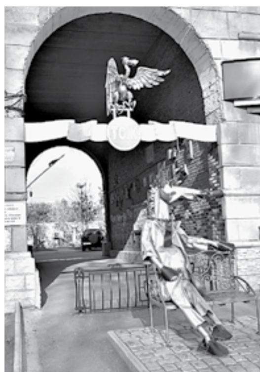
Одна из известных городских скульптур.

Прежде всего участникам встречи предложили определиться с местными достопримечательностями, которые были бы интересны туристам. Поначалу возникла заминка, даже памятник архитектуры — 100-летний Михайло-Архангельский храм не сразу вспом-