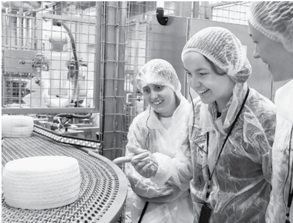
«Алтай – сырный край!» – это теперь знают участники проекта.