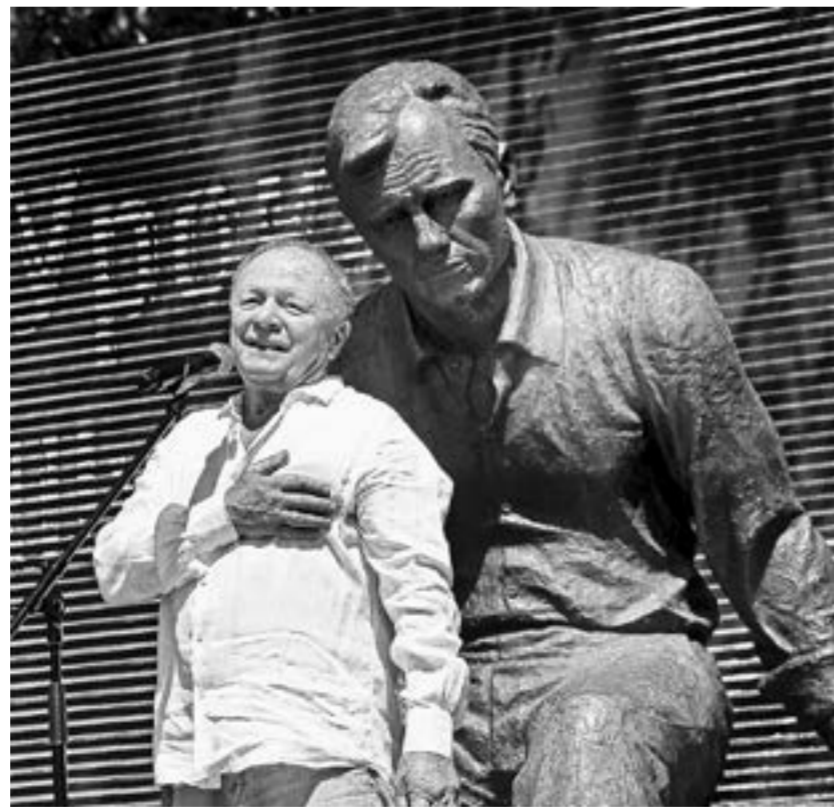
Борис Галкин познакомился с Шукшиным на съемках фильма.

А старшая дочь писателя, филолог и переводчик Екатерина Шукшина сказала: «Сегодня я хочу пожелать всем нам подлинного праздника».