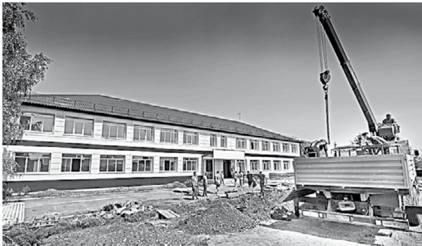
Объект готов на 90%.