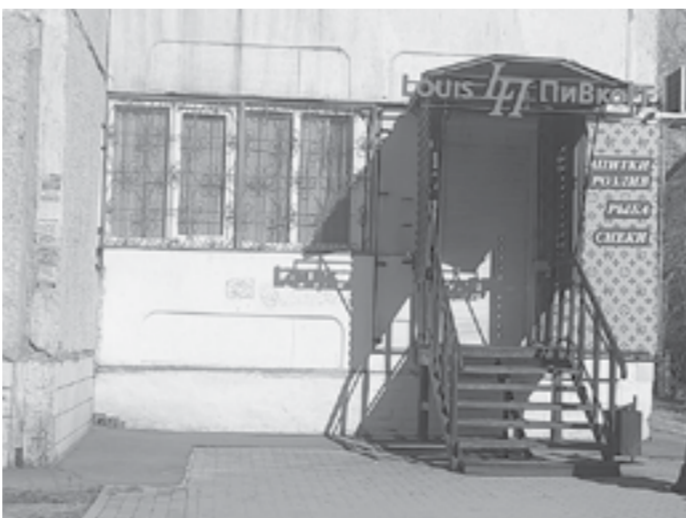
Сегодня так называемых пивнух может быть до нескольких точек в многоквартирном доме.

Принятие в последние годы законодательные реше-