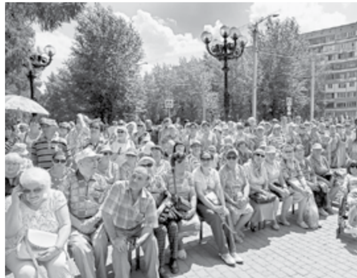
Перед памятником нашему земляку.