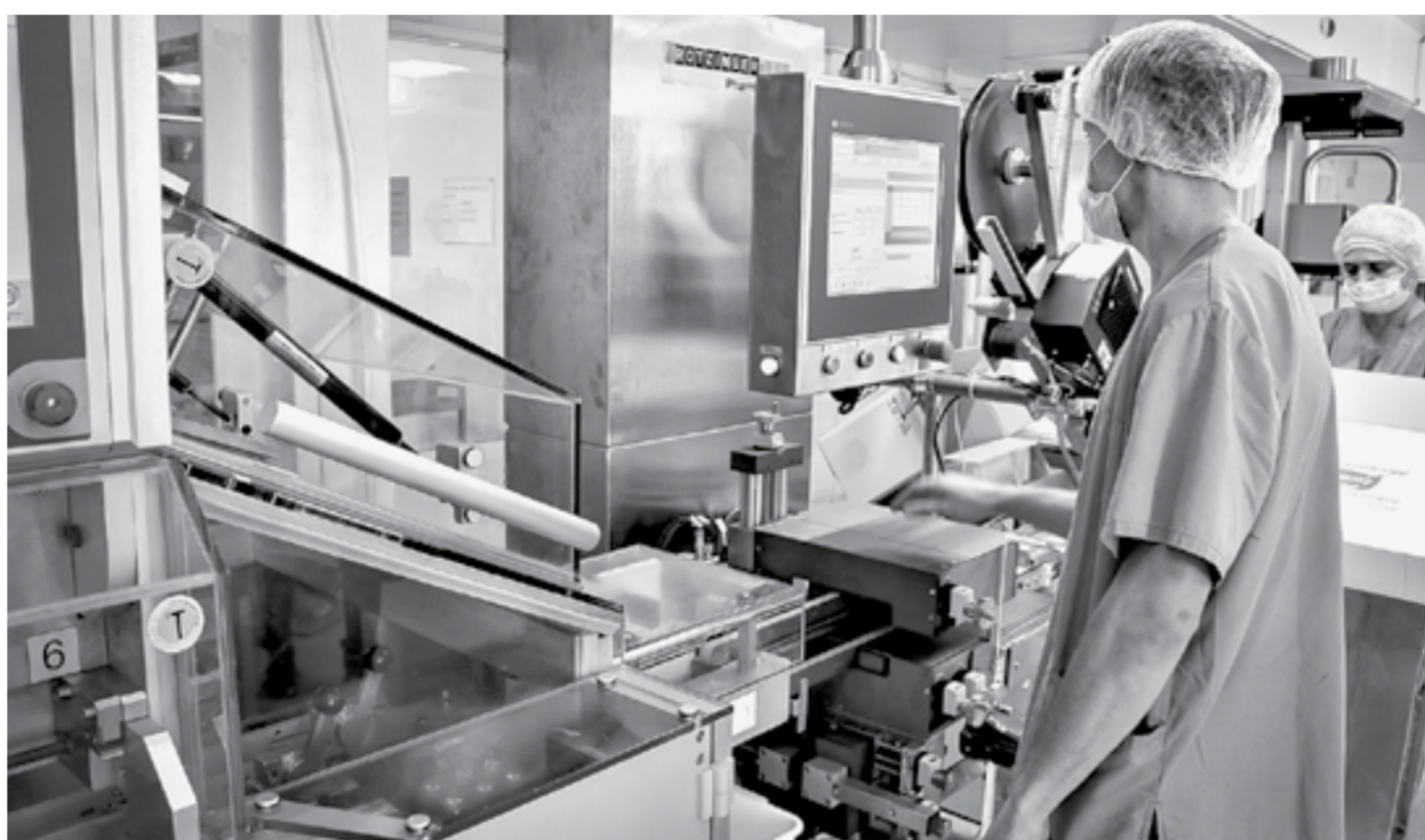
В компании «Эвалар» маркировку БАД внедряют уже год.