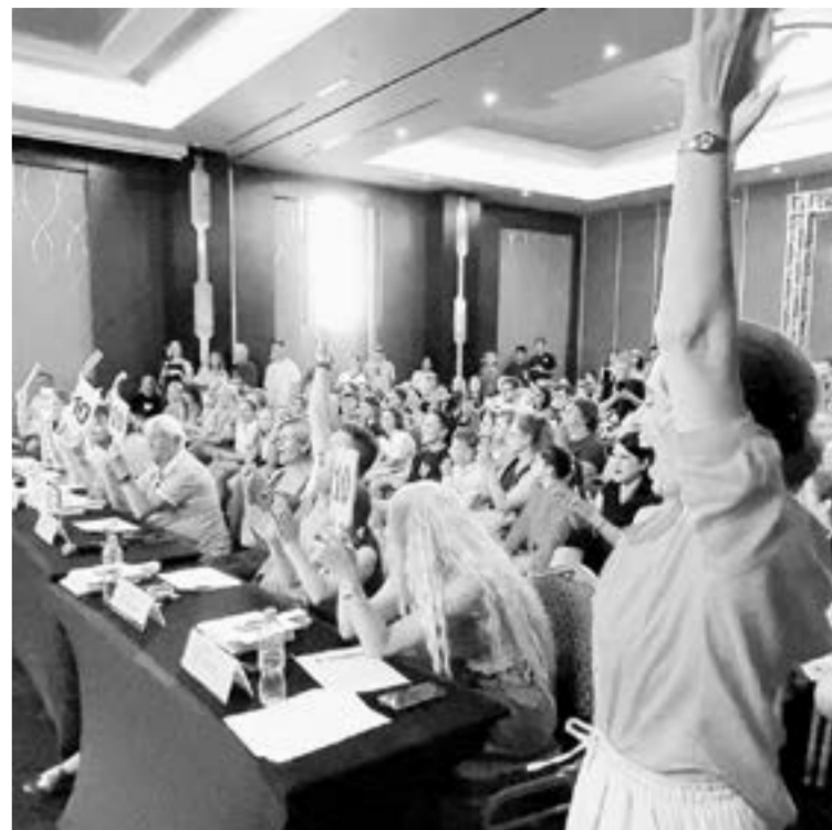
Реакция на вердикт жюри была бурной.

Самое яркое впечатление у участниц группы Harry voices от реакции жюри. Они, конечно же, ехали за победой, но понимали, что соперники очень сильные. Были готовы к любой оценке и критике. А когда эксперты аплодировали стоя, не сразу поверили, что это происходит с ними. За кулисами долго плакали от радости.