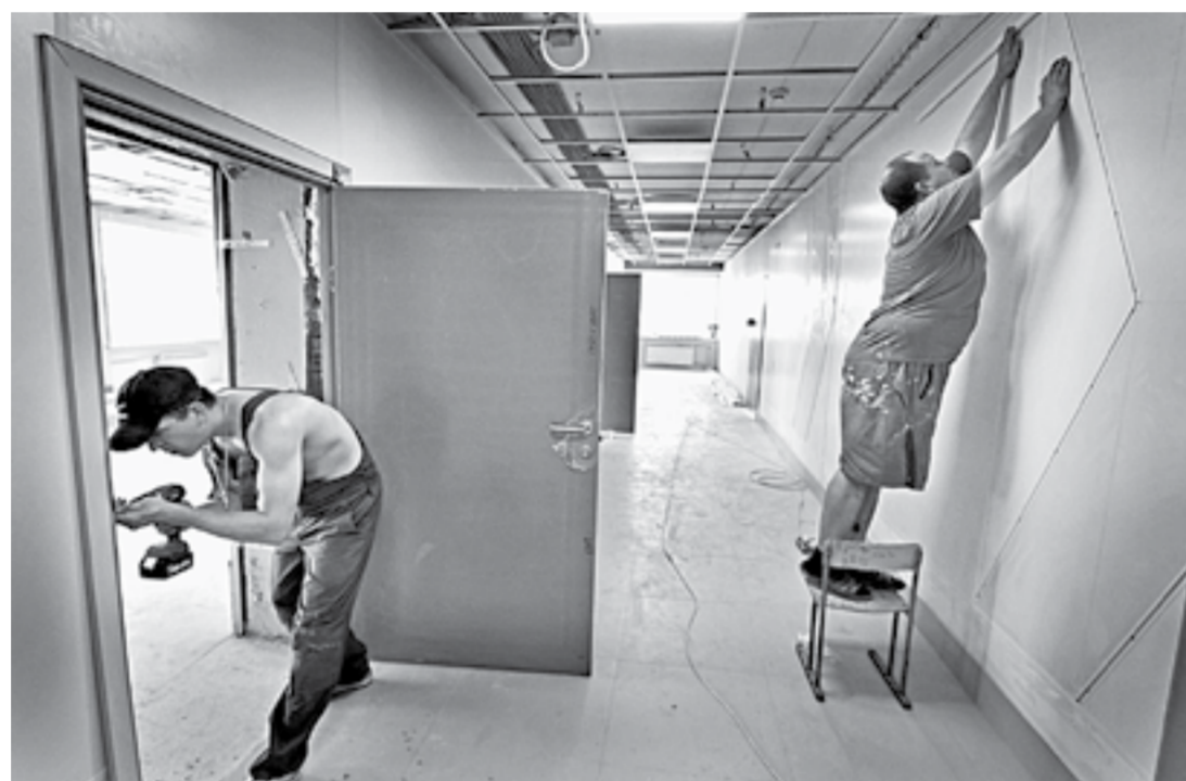
Стены облицованы антивандальными панелями.

жевые акценты. Почти готова рекреация, куда после ремонта вернут попугая и многочисленные растения. «Здесь и рыбки жили – мы этот уголок сделали своими руками», – объясняет учительница начальных клас-