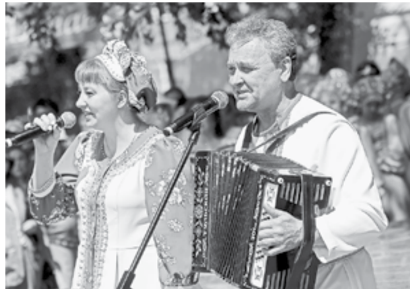
Выступает ансамбль «Повелика» из Зонального района.