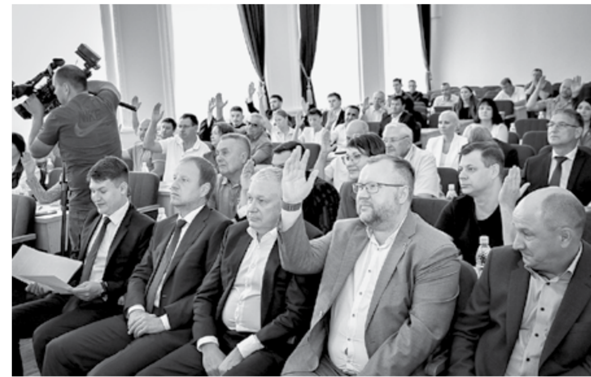
За кандидатуру председателя палаты проголосовали единогласно.