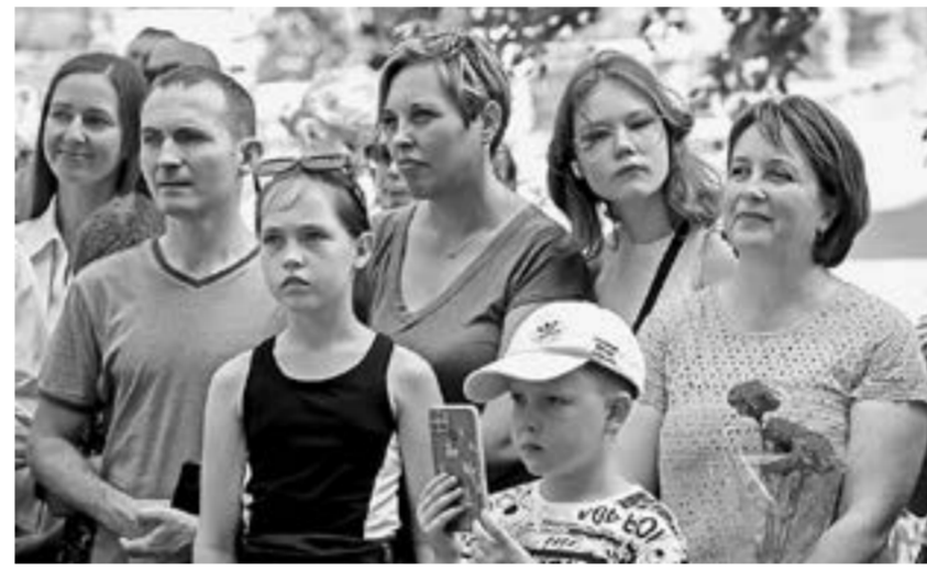
Памятная акция собрала разные поколения.

Личные воспоминания бывшего фронтового разведчика были переизданы при жизни автора 6 раз, в том числе в московском издательстве «Современник». В книгу, вышедшую в Барнауле, попали и рисунки из фронтового дневника. Один из них теперь повторили на мемориальной доске.