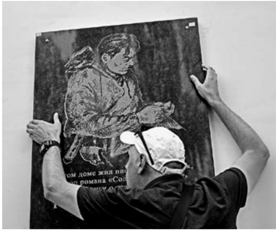
Книжная иллюстрация на мемориальной доске.

12 июля в Барнауле открыли мемориальную доску известному алтайскому писателю и журналисту Георгию Егорову. В декабре нынешнего года ему исполняется 100 лет.