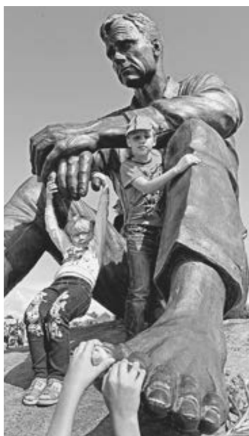
В Сростках к Шукшину.