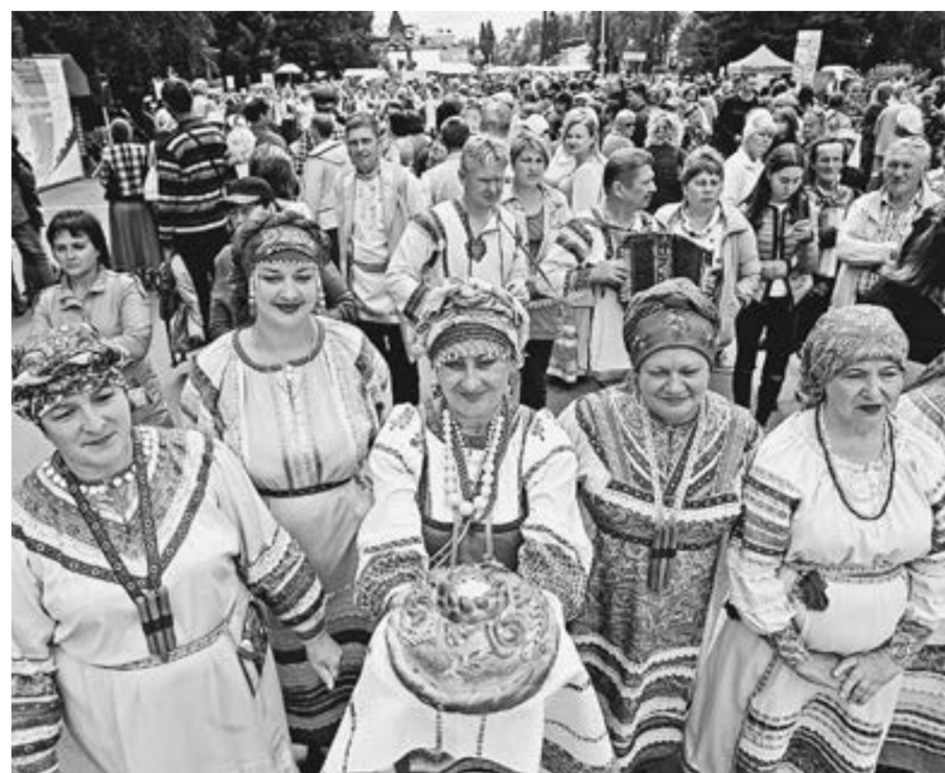
Алтай встречает гостей.

С 18 по 22 июля в Алтайском крае пройдет Всероссийский фестиваль «Шукшинские дни на Алтае».