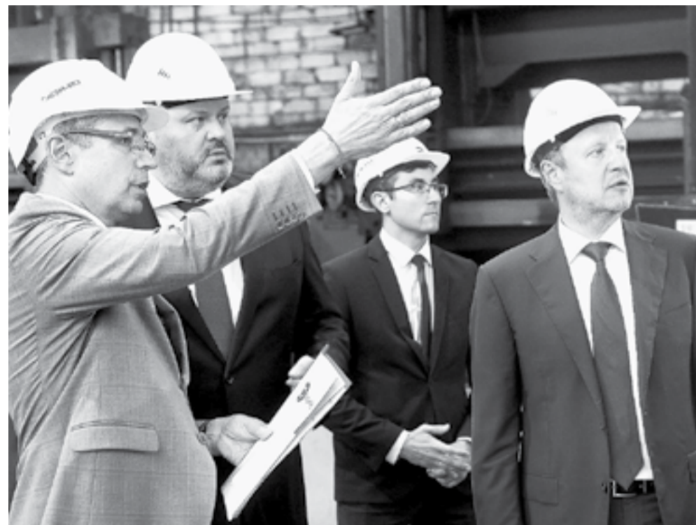
На «Сибэнергомаше» Антону Котякову рассказали о кадровой политике предприятия.

В крае функционирует система повышения квалификации и подготовки кадров. В ее успешной реализации убедились федеральный министр труда и глава ре-