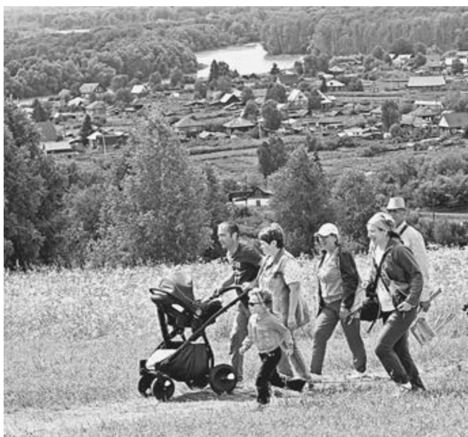
Снова дорога на Пикет.