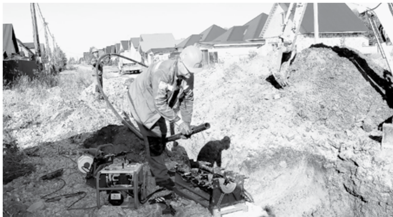
Трубы соединяют с помощью сварочного аппарата.