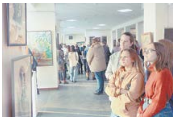
Каждый год творческая организация проводит десятки выставок.