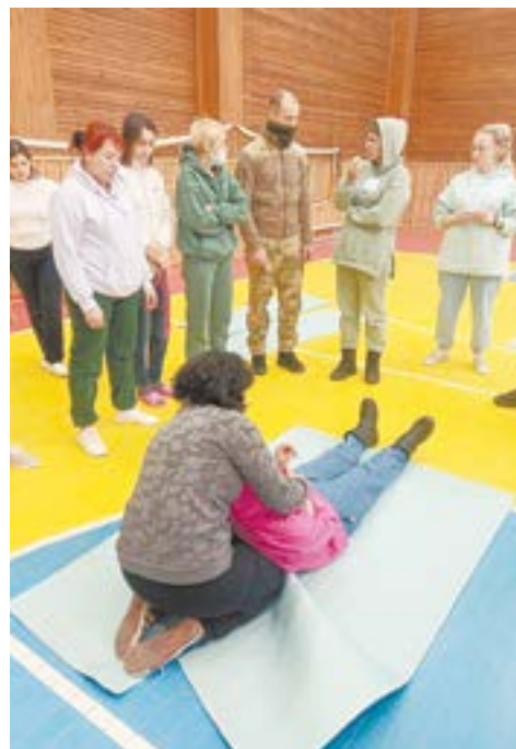
Отработка приемов спасения раненого.

Одно дело – сдавать теорию и практику в учебном кабинете, на симуляторе. А если боец истекает кровью в окопе и неадекватен от боли? Тренировка выдержки, воли,