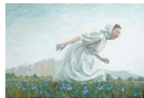
Ай-Хаан Адыг-оол. Девушка на поле ирисов. 2022. Республика Тыва.