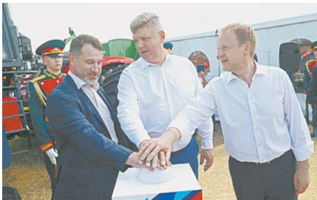
Высокие гости участвовали в символическом запуске двигателя нового трактора.