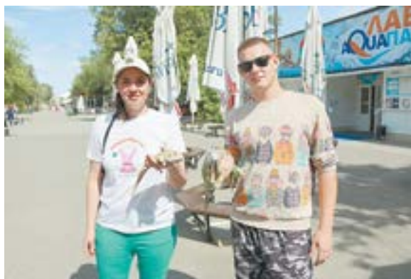
Желающие могут фотографироваться с вараном.