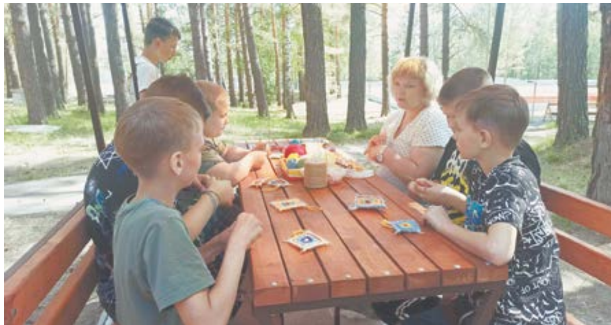
Домой можно увезти кучу сувениров, сделанных своими руками.

По ее словам, в 2023 году все загородные оздоровительные учреждения объединили в виде струк-