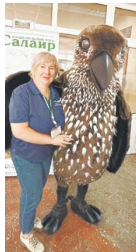
Под крылышком у кедровки.