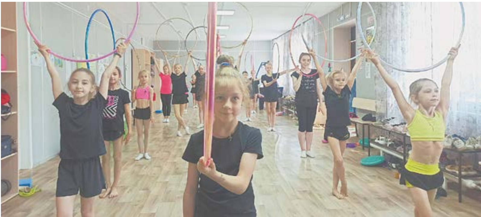
У гимнасток отдых сложный.