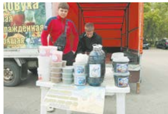
Лечебная грязь – недорого.

требования по содержанию животных, которые используются для зрелищ. После этого цирк и дельфинарий перестали гастролировать. И очень жаль, ведь посмотреть на их представления собралось очень много людей.