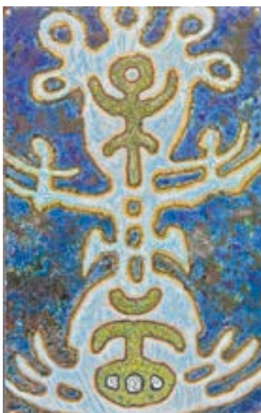
Сергей Ануфриев. Шаманы (медь, эмаль). 2018. Красноярский край.