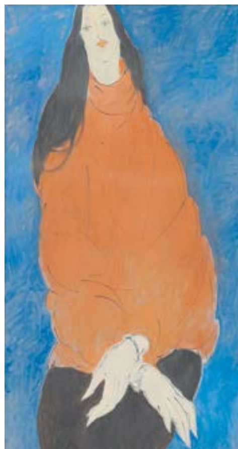
Игорь Бессонов. Ева. 2022. Новокузнецк.