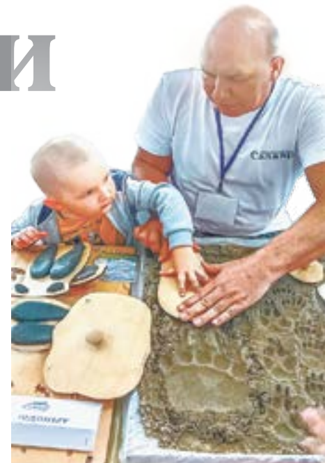
Учимся распознавать следы животных.

Оксана ШИЛЬРЕФ (фото автора и газеты «Заря Востока»)