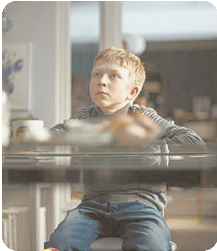
15.15 Х.ф. «НЕЛЮБОВЬ» (16+)

05.00 Т.с. «Береговая охрана» (16+) 06.30 «Утро. Самое лучшее» (16+) 08.00 «Сегодня» 08.25 Т.с. «Лесник» (16+) 10.00 «Сегодня» 10.35 Т.с. «Лесник» (16+) 13.00 «Сегодня» 13.25 «Чрезвычайное происшествие»