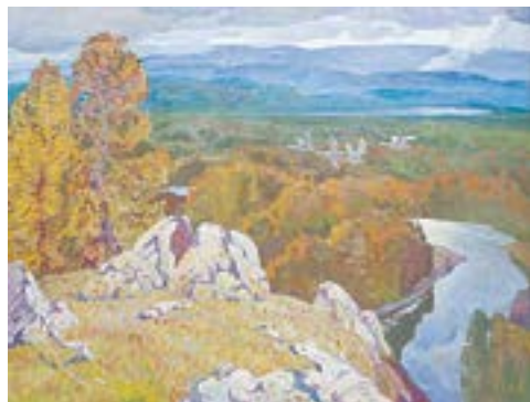
Валерий Марченко. Сибирское раздолье. 2020. Алтайский край.