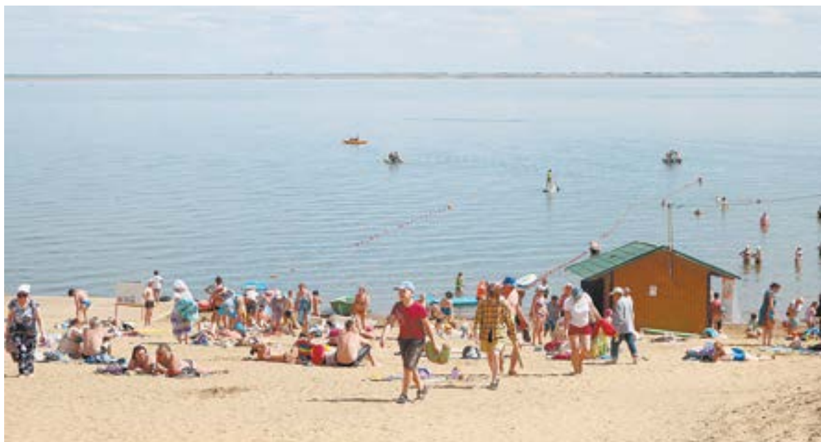
Купающихся пока меньше, чем загорающих.

В 2020 году дельфинарий не приехал из-за пандемии. А потом законодатели сильно ужесточили