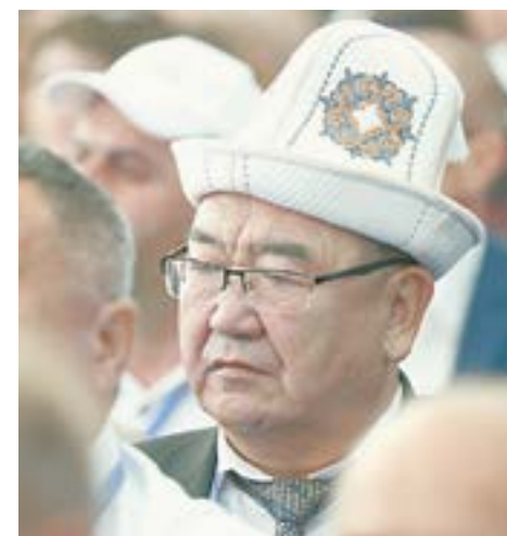
Форум привлекает все новых участников.