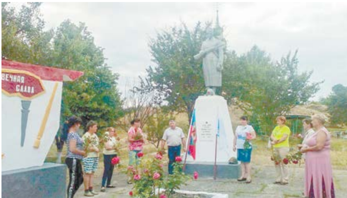
Так выглядел памятник в Славяносербском районе до того, как был разрушен бомбежкой.

цев мечтает, что когда-нибудь и эта скульптура найдет достойное место в историческом месте Барнаула, Нагорном парке.