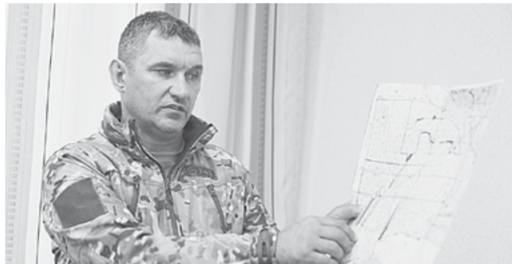
На аппаратном совещании.

В Егорьевском районе – вновь крупный пожар, охвативший 3400 гектаров леса. Столбы дыма видны в Рубцовске, а запах гари чувствуется даже в Шипуновском районе. По данным на 21 июня, двое суток с огнем борются 211 человек и 87 единиц техники. Также подключена авиация, используется самолет-амфибия Бе-200. Отправлено обращение за помощью в Ханты-Мансийский автономный округ, где расположено подразделение «Авиалесоохраны».