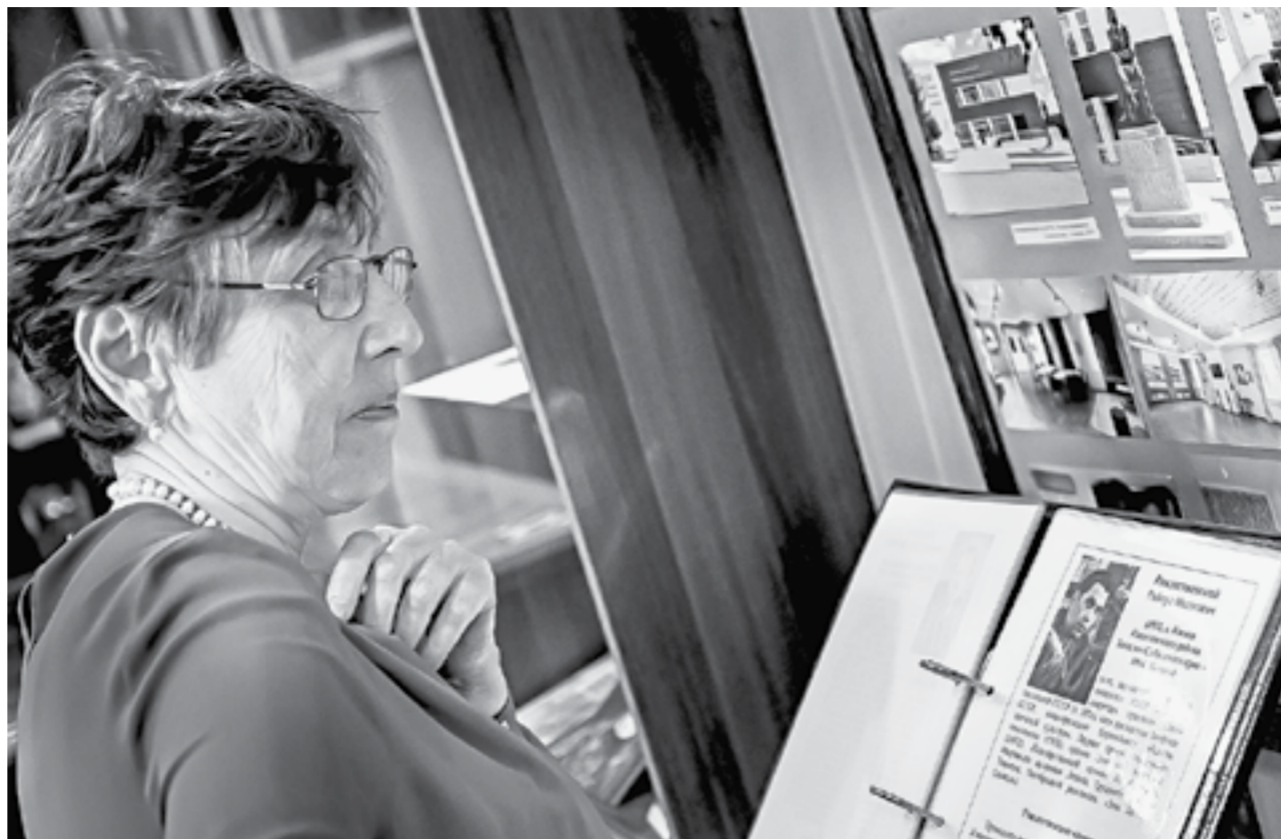
В ГМИЛИКА день рождения поэта отметили экскурсией, викториной и подборкой видеоклипов.