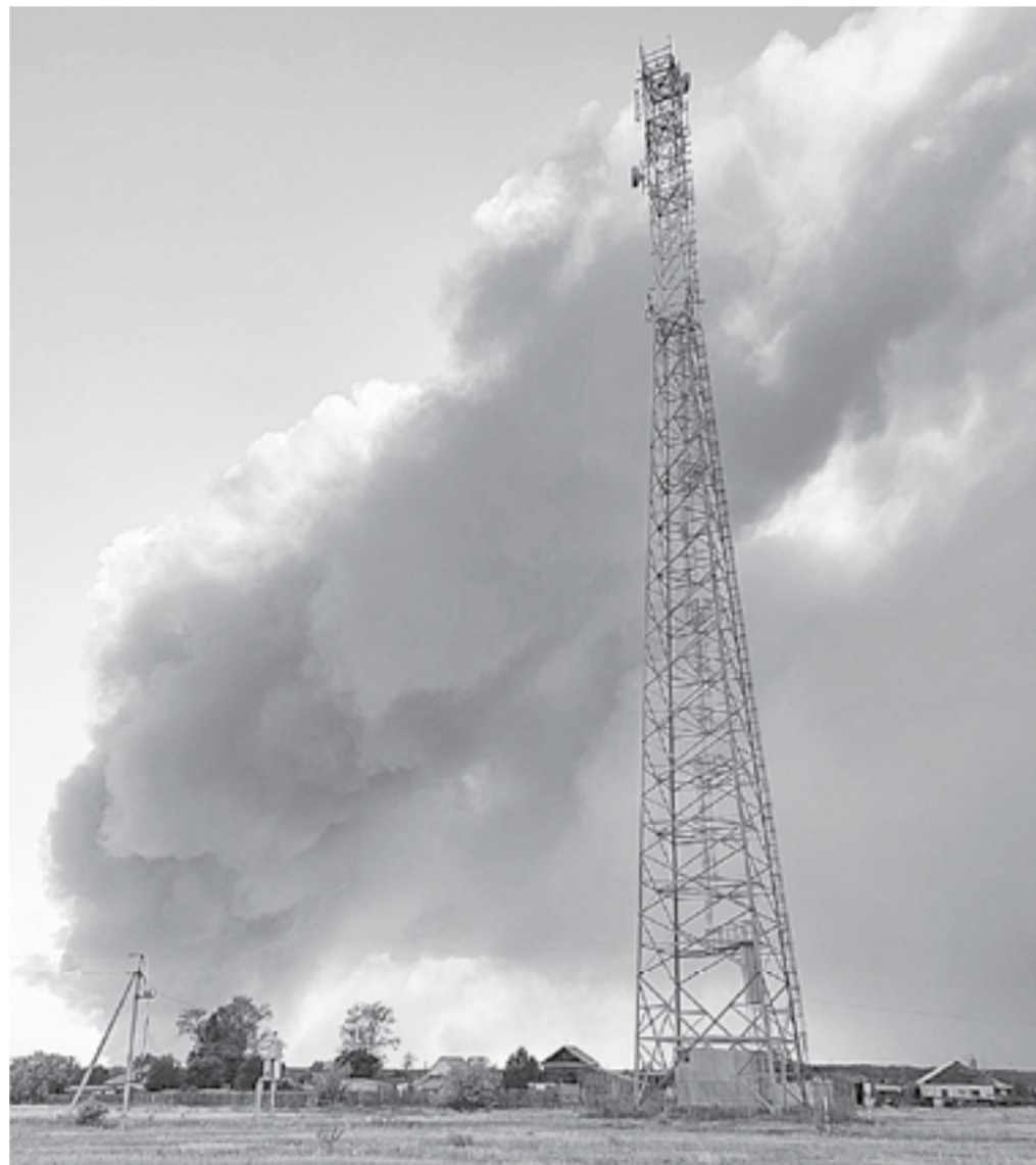
Борьба с пожаром продолжается.