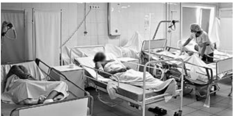
Путь к исцелению начинается здесь.