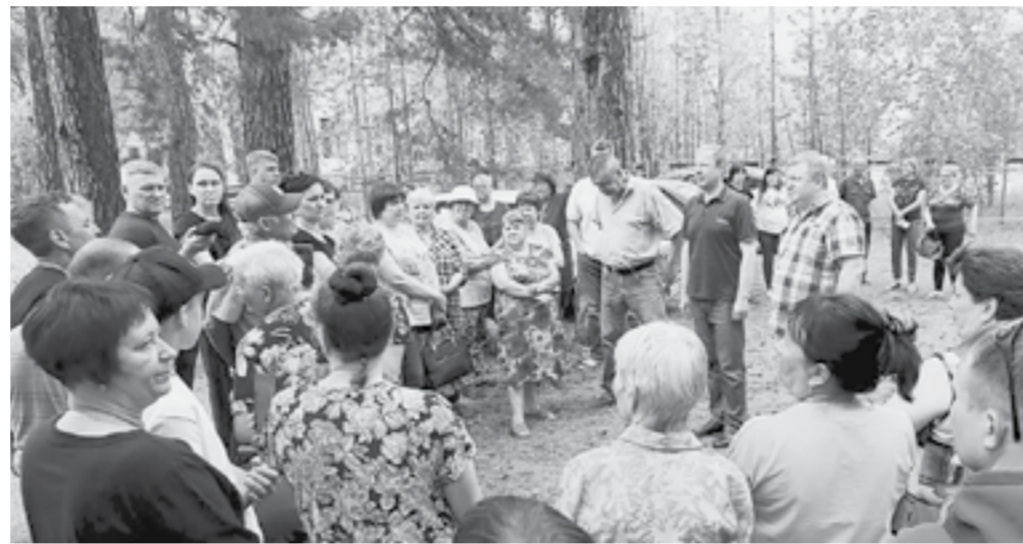
Губернатор встретился с жителями поселка Перешеечного.