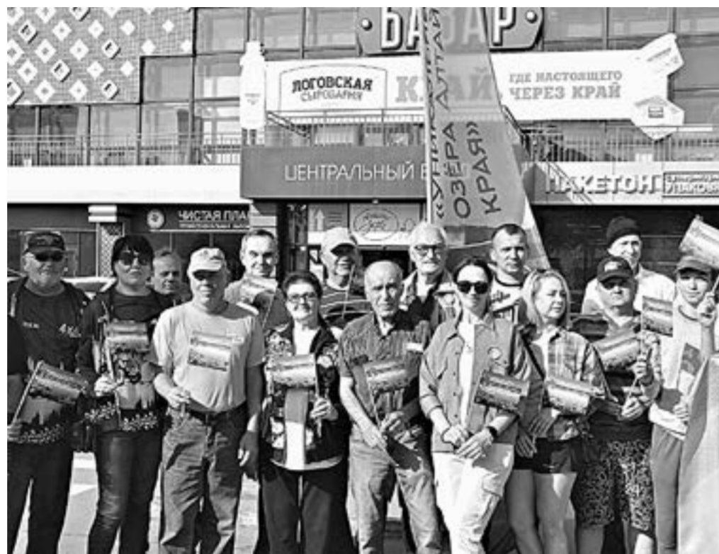
Общее фото на память.

Автораритетам предстоит преодолеть около 250 километров по до-