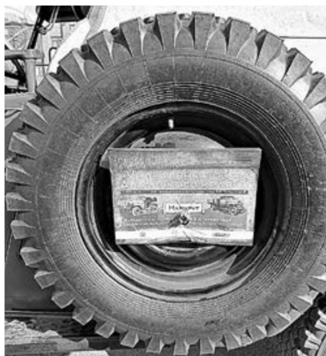
Пусть все услышат о проекте!

рогам Степного Алтая, в пути к этой колонне будут присоединяться и другие восстановленные энтузиастами автомобили. К слову, максимальная скорость некоторых экземпляров не превышает 60 километров в час.