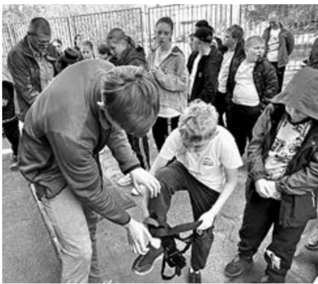
Страховка – вещь необходимая.

Главным событием для ребят стал фестиваль, к которому они готовились целый год. На соревнованиях юные