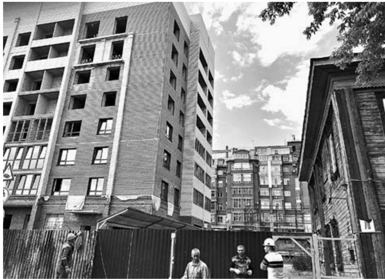
Старый дом в окружении новостройки.

После 90-х привычный уклад жизни поменялся, жильцы стали обязаны за все отвечать в доме сами. У собственников накопилось долги по квартплате, канализация вышла из строя, пол на первом этаже начал гнить. Была возможность подключиться к центральной кана-