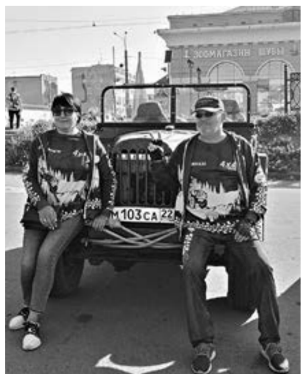
Семья из Бийска покоряет новые рубежи.