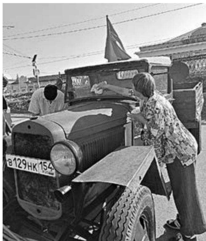
Последние штрихи перед стартом.