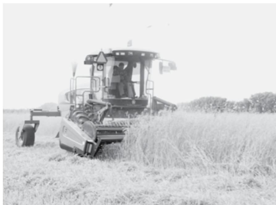
В крае началась заготовка кормов.

Прошедший 10 июня дождь дал надежду аграриям края на урожай. Мы поговорили с руководителями сельхозпредприятий о текущей ситуации в АПК.