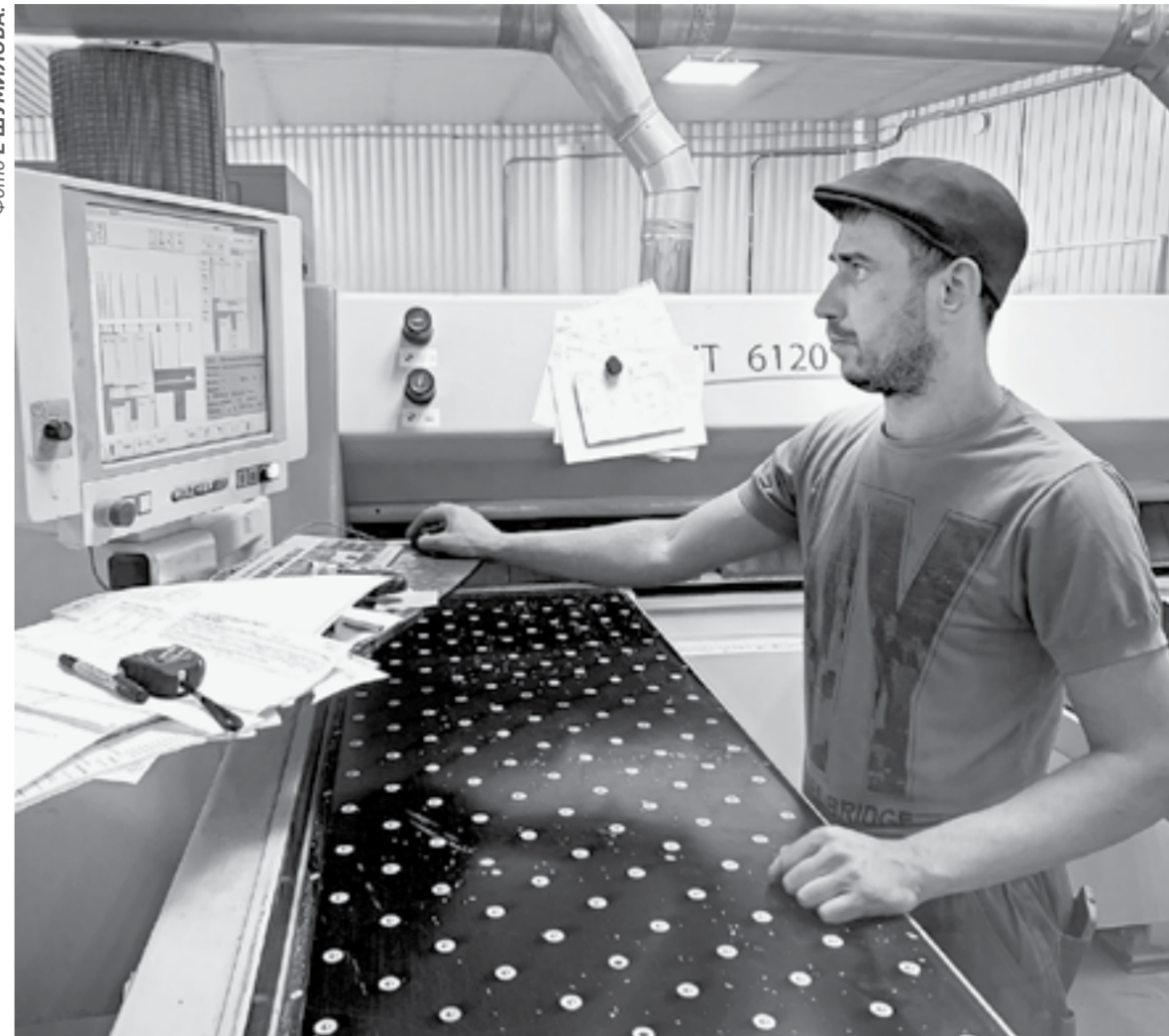
В перспективе на предприятии создадут около 20 рабочих мест.

– Мы же предлагаем альтернативный вариант – модульную мебель, практичную и, главное, доступную по цене. Но не стоит рассматривать ее как типовую,