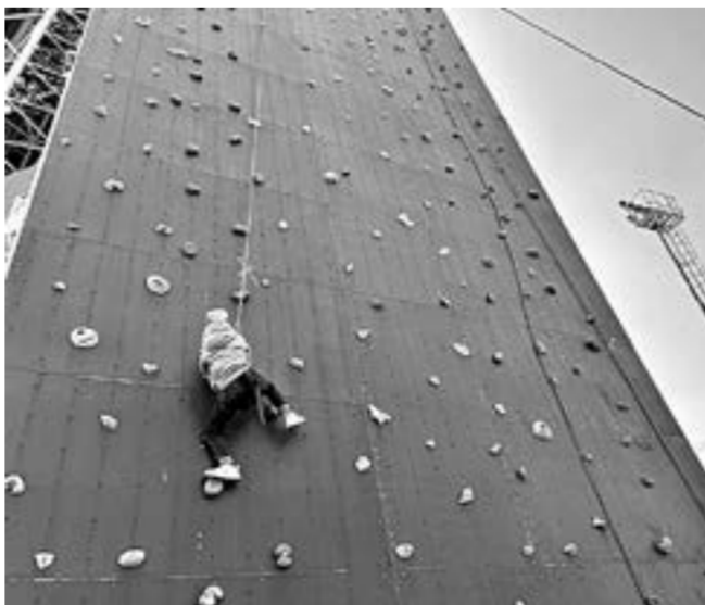
Все выше и выше.

скалолазы продемонстрировали свои достижения в дисциплинах «Трудность» и «Скорость». Они показали, как научились преодолевать крутые вертикали скалодрома и быстро и ловко добираться на самый верх. Все участники получили подарки.