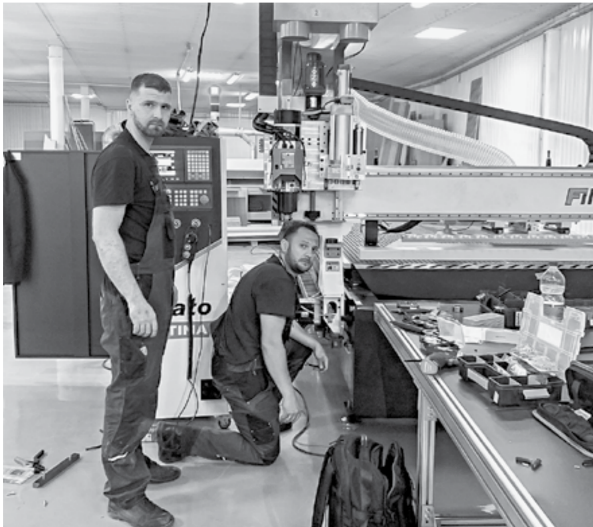
Монтаж оборудования идет полным ходом.

Бийская мебельная компания «Дизаж» монтирует импортное оборудование, на котором с начала следующего года будет изготавливать серийную модульную мебель и фасады для нее. Финансируется проект при поддержке индивидуальной программы социально-экономического развития Алтайского края на 2020–2024 гг.