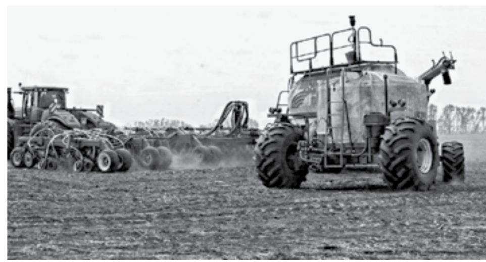
Посевная в Рубцовском районе завершилась в срок.

Все это не лучшим образом отразилось на экономике сельскохозяйственного сектора района. По итогам первого квартала сельхозтоваропроизводители реализовали продукции, товаров, работ и услуг на сумму 347 млн рублей (в прошлом году выручка была 630 млн). По результатам