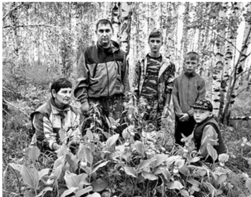
В «Башмачковой роще».

– Мы родник огородили, построили там беседку. Помогла администрация села, а также использовали небольшой экологический фонд районного