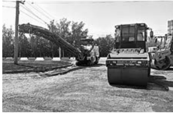
Тяжелая техника продолжает работы. (Начало на 1 стр.)