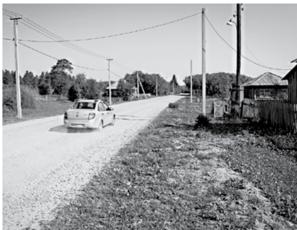
От легковушек проблем не так много.

«Здесь мамы с колясками ходят. Всегда переживаю, когда они пропадают в завесе на несколько минут, пока пыль не оседет. Прикрывать нос платком бесполезно, тут защитный костюм нужен!»