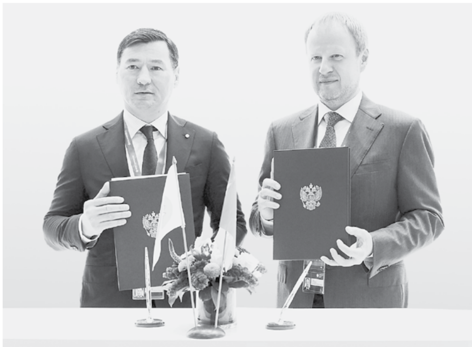
Виктор Томенко и глава Калмыкии Бату Хасиков.

По Чуйскому тракту проезжает около 20 тысяч машин в сутки, а рядом с городами доходит и до 50 тысяч. Для безопасного движения трассу планируется перевести к