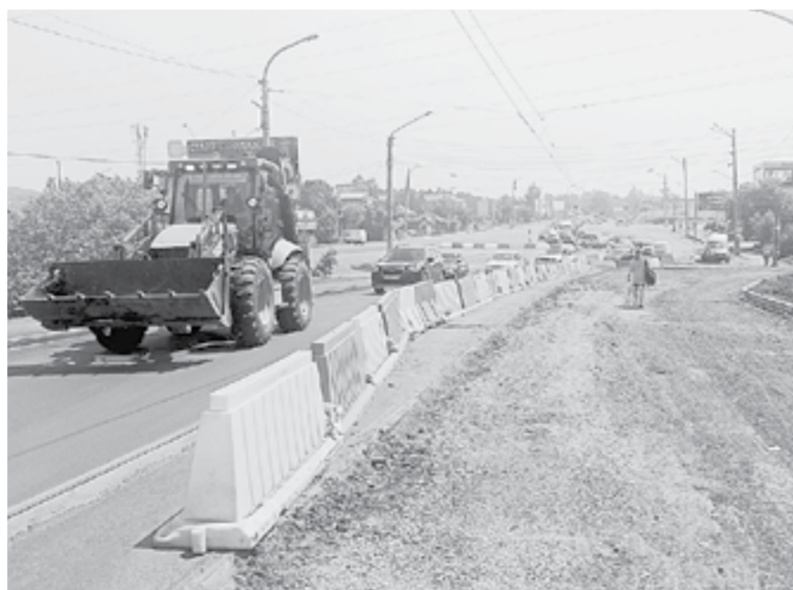
Съезд с коммунального моста в сторону Республики Алтай и Белокурихи.

Не иначе как ремонтом века можно назвать реконструкцию главной переправы города Бийска через Бию – коммунального моста. Она затронула как самих горожан, так и десятки тысяч туристов, привыкших быстро пересекать второй город края и «уходить» в Горный Алтай или Белокуриху. Теперь же приходится постоять в пробках. В какой точке находится ремонт коммунального моста, узнал наш корреспондент.