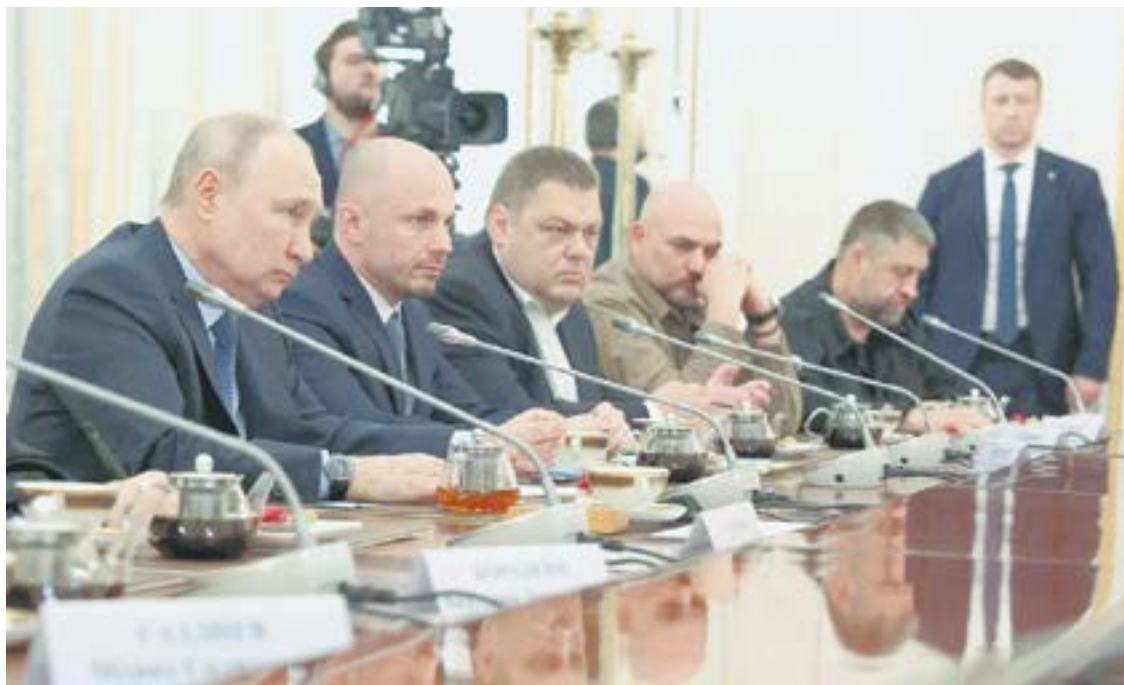
Встреча с военкорами: откровенно о главном.

Президент Владимир Путин провел встречу с российскими военными корреспондентами, на которой обсуждалась тема спецоперации и всех связанных с ней мероприятий.