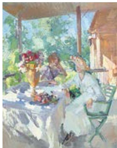
К. Коровин. Две дамы на террасе (1911).