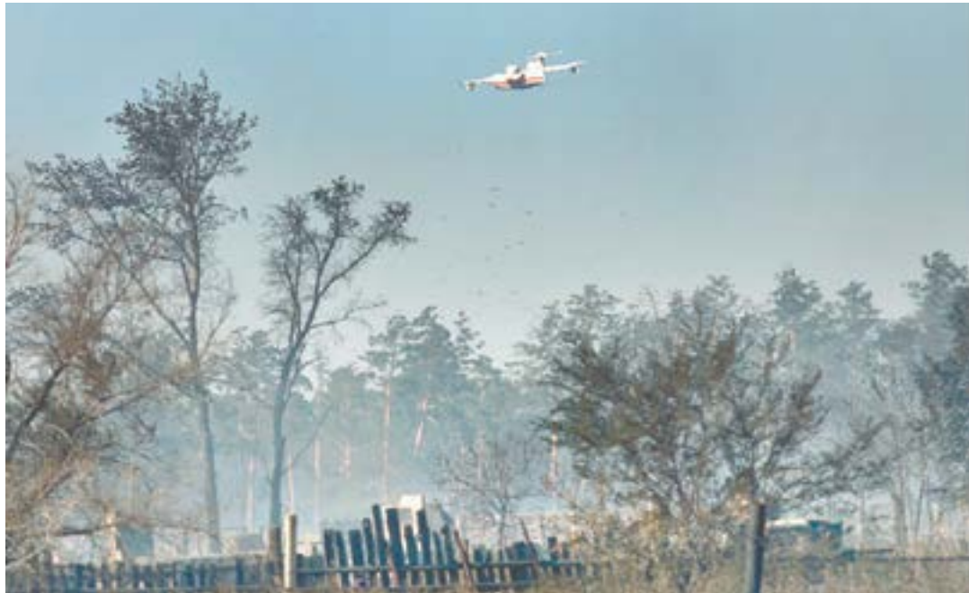
Самолет-амфибия Бе-200ЧС помогал тушить пожар.