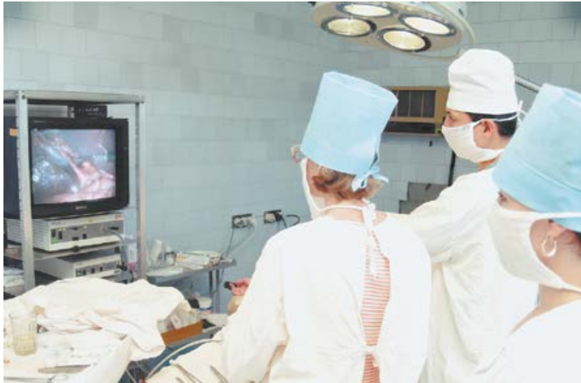
Горбольница № 8 сейчас и в 70-е годы.