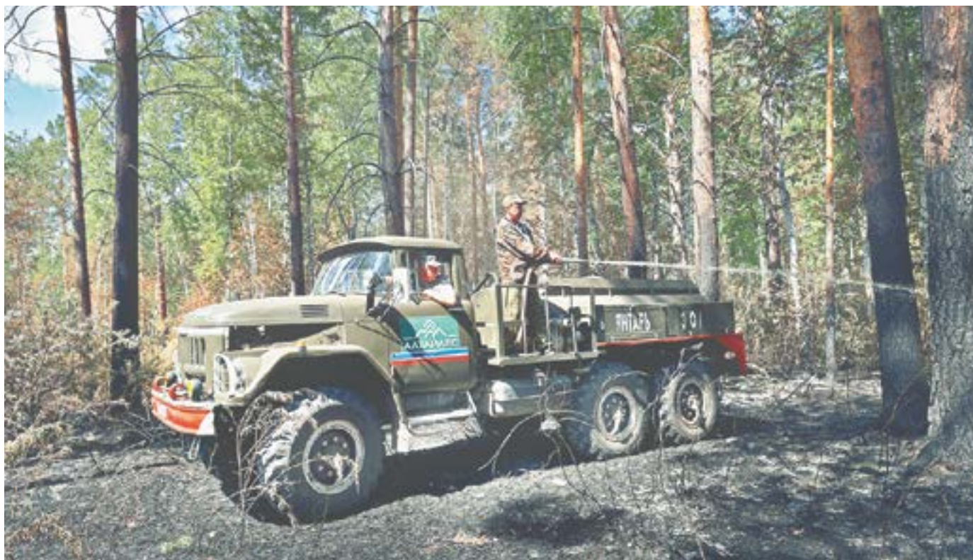
Пожарные устраняют локальные очаги возгорания.