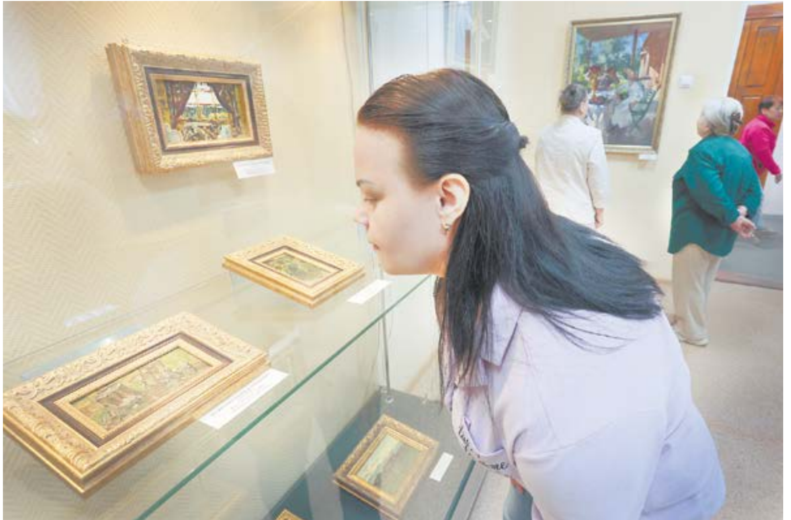
В витрине – этюды художников Сергея Малютина, Леонарда Туржанского и Михаила Нестерова.

В 1863 году будущим художникам-передвижникам, как гласит история, задали писать картину на германо-скандинавский сюжет про пир в Валгалле – они сочли это слишком далеким от реальности и попросили свободную тему. Получив отказ, покинули аудиторию, чем сорвали конкурс к 100-летию академии. Предводительствовал среди «бунтарей» (заметьте, лучших выпускников академии!) Иван Крамской, и впоследствии его соратники противопоставляли свое творчество академизму и вдохновлялись идеей народничества.