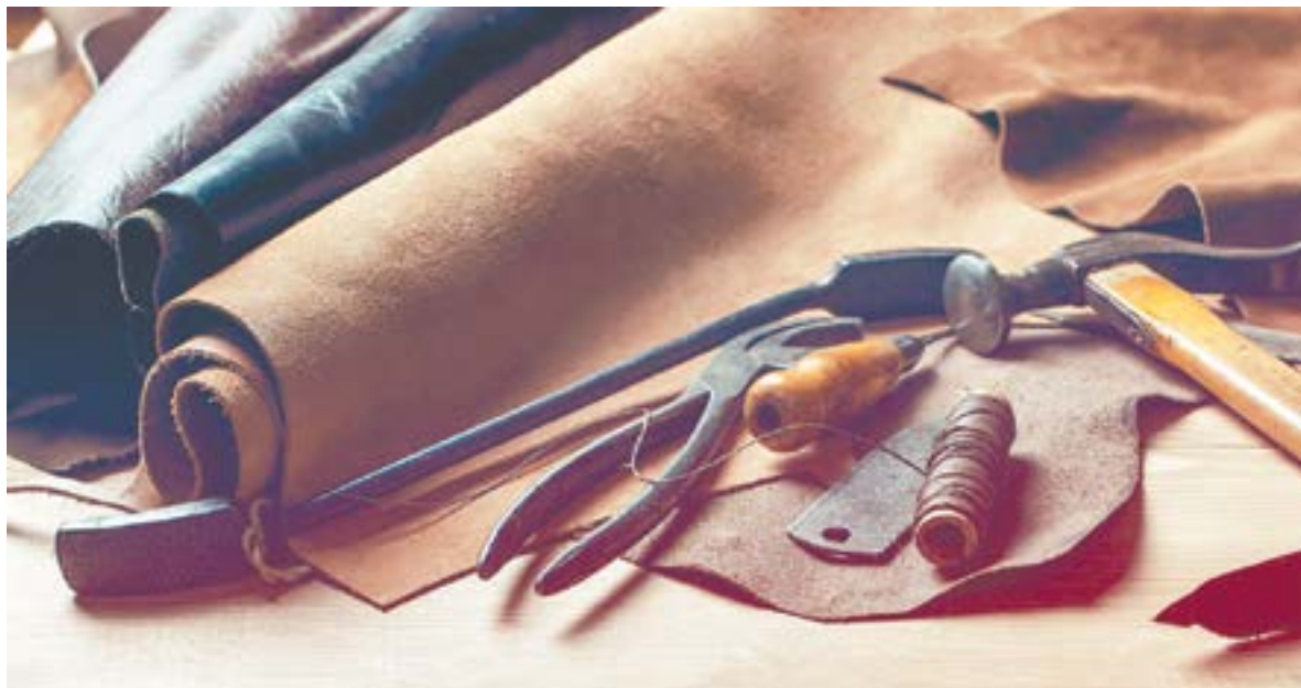
Все готово, можно начинать.

– Конечно, я сначала многого не умел, – признается мастер, – Да и инструменты у меня тогда были, можно сказать, доисторические – переделанная на нужный лад заточенная столовая вилка для разметки плюс шило. Очень