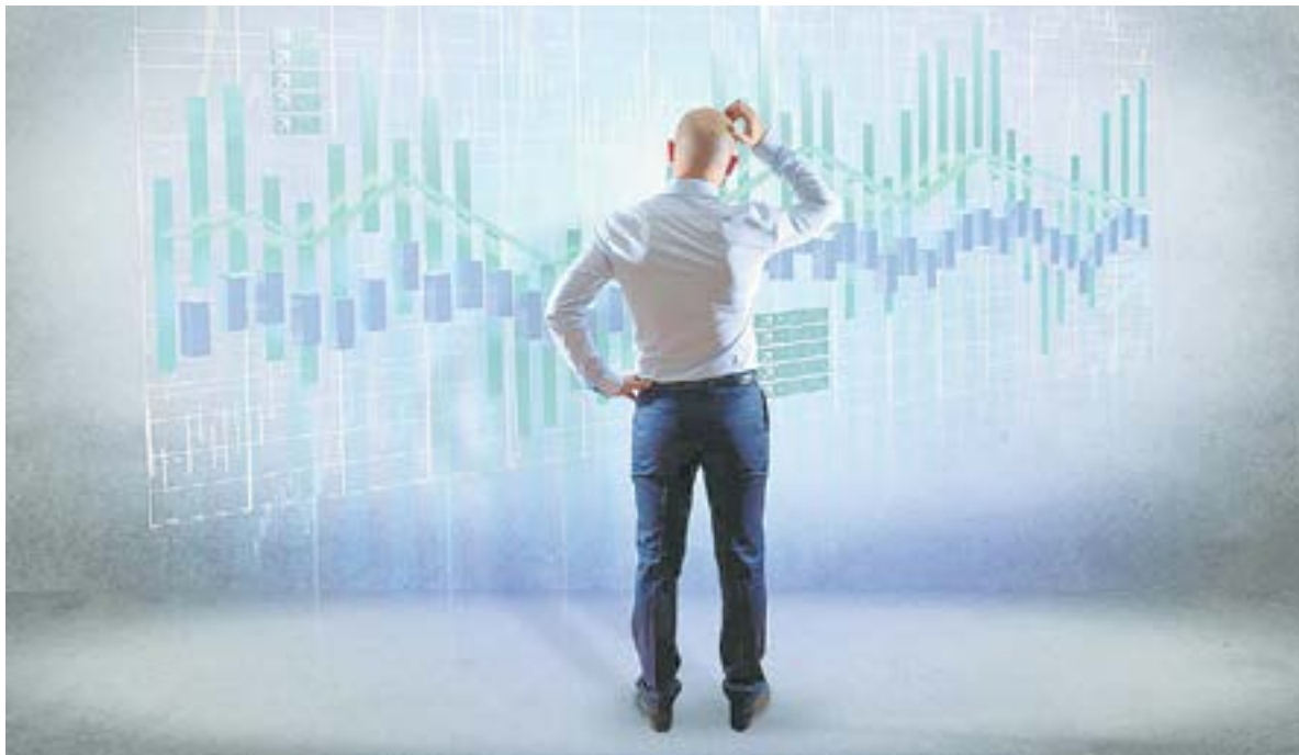
Надо 100 раз подумать, прежде чем сделать инвестицию.

– Прямого инвестирования в акции и облигации компаний населением у нас никогда не было. В стране был большой госбанк, который деньги отдавал государству, а оно финансировало экономику. После того Россия встала на путь строительства капитализма, появилось много частных банков, каждый из которых предлагает свои условия кредитования. Соответственно, бизнесу получать от них деньги сложно и дорого. Однако в экономически развитых странах уже давно существовал фондовый рынок, на котором компании размещали свои акции и облигации. Инвесторы их покупали и тем самым финансировали деятельность бизнеса несколько дешевле, чем банки.