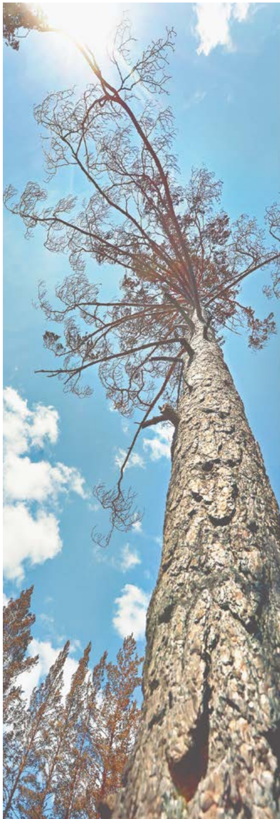
Лес будет восстановлен.