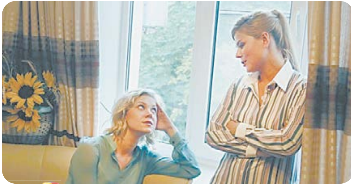
19.00 Х.ф. «ИДЕАЛЬНЫЙ ВЫБОР» (16+)

05.00 Т.с. «Москва. Центральный округ» (16+) 06.30 «Утро. Самое лучшее» (16+) 08.00 «Сегодня» 08.25 Т.с. «Лесник» (16+) 10.00 «Сегодня» 10.35 Т.с. «Лесник» (16+) 13.00 «Сегодня» 13.25 «Чрезвычайное происшествие» 14.00 «Место встречи» (16+) 16.00 «Сегодня»