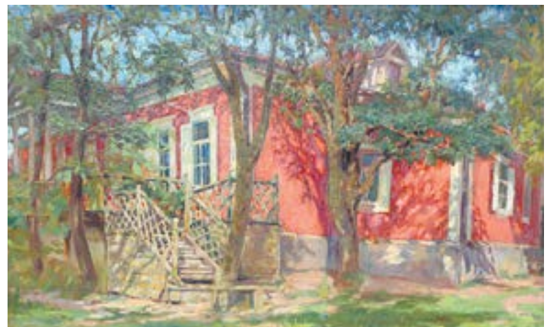
С. Виноградов. Красная дача (1911).

К началу XX века идея поиска собственного лица актуальности не потеряла.