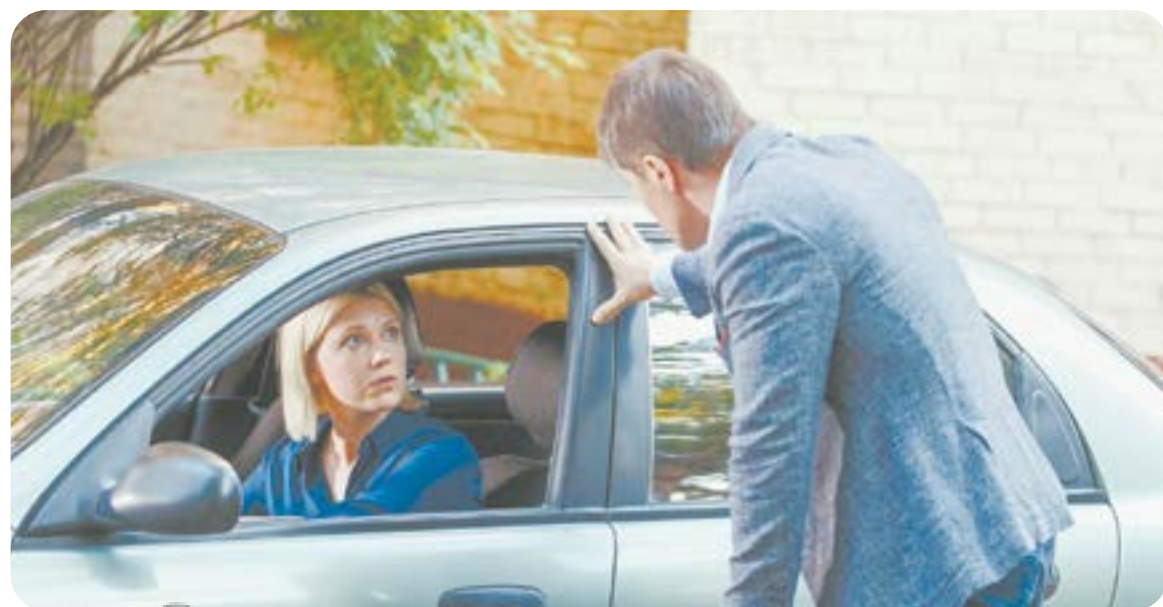
19.00 Х.ф. «ИДЕАЛИСТКА» (16+)

15.30 Х.ф. «Отставник. Защита Дедова» (16+) 16.00 «Сегодня» 16.20 Х.ф. «Отставник. Защита Дедова» (16+) 19.00 «Сегодня» 19.40 Х.ф. «Отставник. Ближний бой» (16+) 23.00 Праздничный концерт, посвященный 12 июня (12+) 00.20 Х.ф. «Последний герой» (16+) 02.15 Д.ф. «Три танкиста» (16+) 03.00 Д.с. «Военно-исторические маршруты» (16+) 03.25 Т.с. «Петля» (16+) СТС 06.00 Ералаш (6+) 06.30 М.с. Премьера. «Простоквашино» (0+) 06.45 М.с. Премьера. «Ну, погоди! Каникулы» (6+) 07.00 Т.с. «Вороныны» (16+) 07.55 Шоу «Уральских пельменей» (16+) 09.00 М.ф. «Князь Владимир» (0+) 10.45 Х.ф. «Календарь ма(й)я» (6+) 12.35 М.ф. «Angry Birds в кино» (6+) 14.25 М.ф. «Angry Birds - 2 в кино» (6+) 16.25 М.ф. Премьера. «Чинк. Хвостатый детектив» (6+) 18.05 М.ф. «Кролецып и Хомяк Тьмы» (6+) 20.00 Премьера. Фактор страха. Испытание тайгой (16+) 21.00 Премьера. Фактор страха. Испытание тайгой. Секреты сезона (16+) 22.05 Х.ф. «Иллюзия обмана» (12+) 00.20 Х.ф. «Иллюзия обмана - 2» (12+) 02.40 Т.с. «Братья» (16+) 03.55 Сториз (16+) 04.30 М.ф. «Мультфильмы» (0+) 05.50 Ералаш (6+)