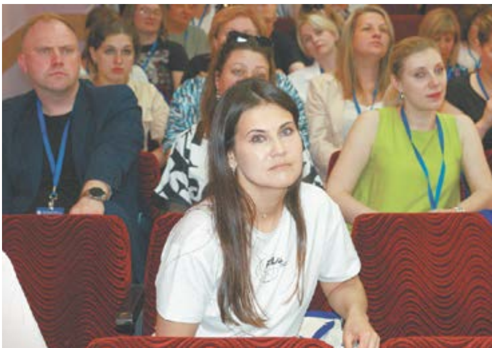
Семинар в Барнауле собрал делегатов со всей страны.

– По базовой профессии я преподаватель истории, обществоведения с дополнительной специальностью «право».