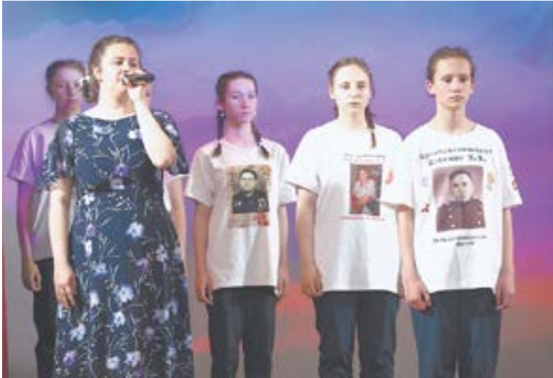
Защитники Отечества – навсегда в памяти.