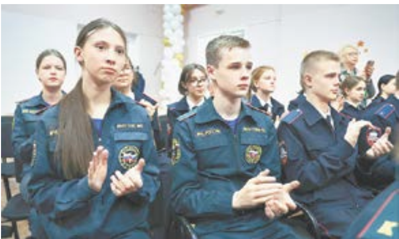
Учащиеся МБОУ «СОШ № 52» прониклись патриотическими речами.