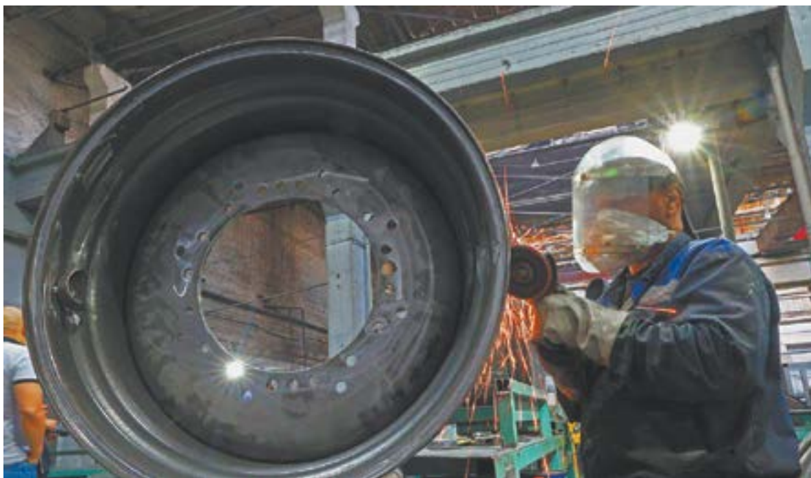
На Барнаульском заводе мехпрессов освоили выпуск колесных дисков.

Ситуация усугубляется из-за того, что в начале прошлого года Запад нам фактически объявил экономическую войну. А это страны, которые являются центрами создания передовых технологий, с которыми связаны почти все наши производства.