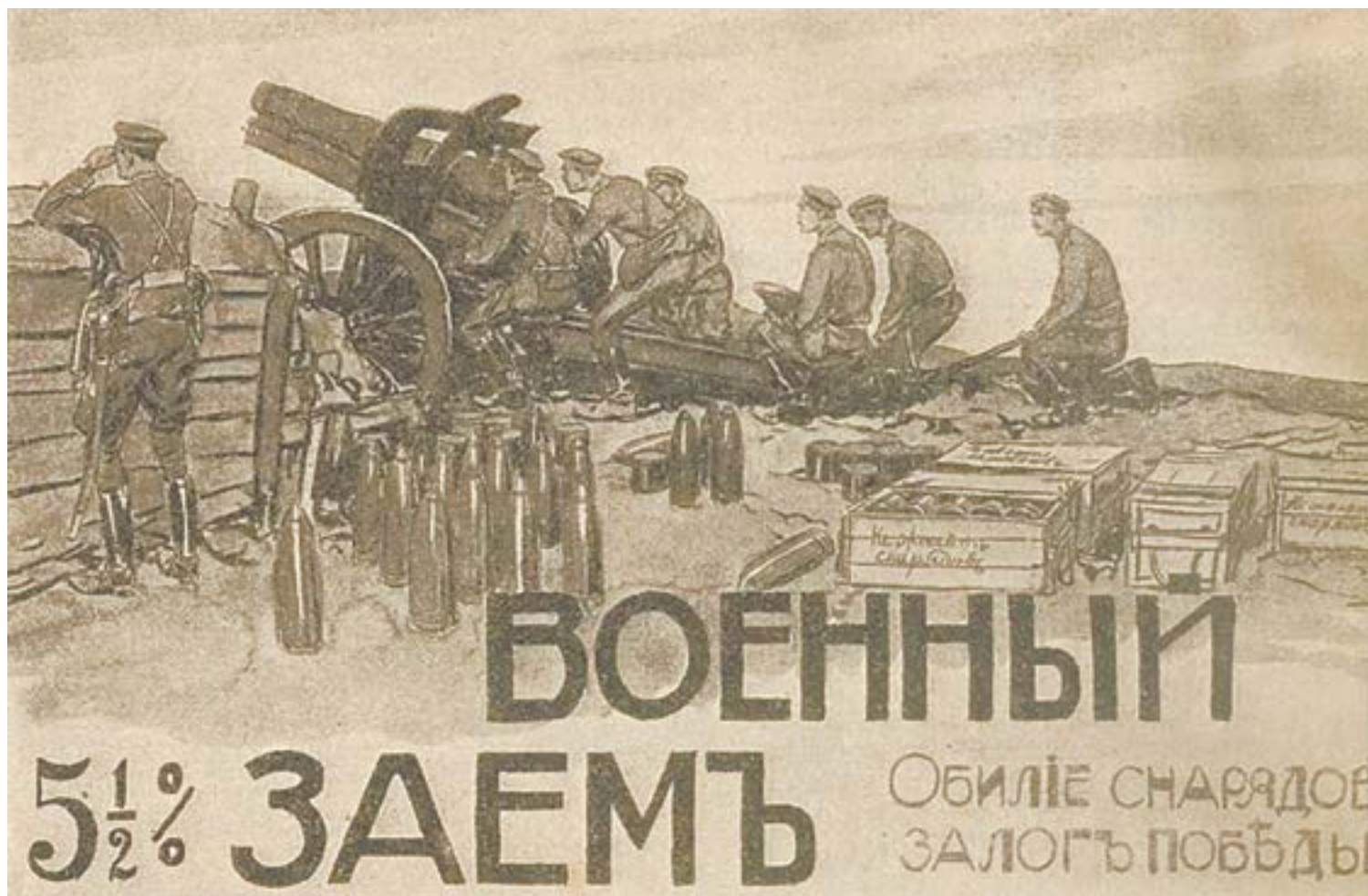
Плакат 1916 года. Автор Ефим Чепцов.

В него вошли 54 человека, председателем комитета был избран управляющий