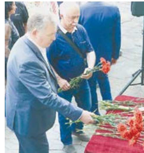
Возложение цветов к мемориальной доске.