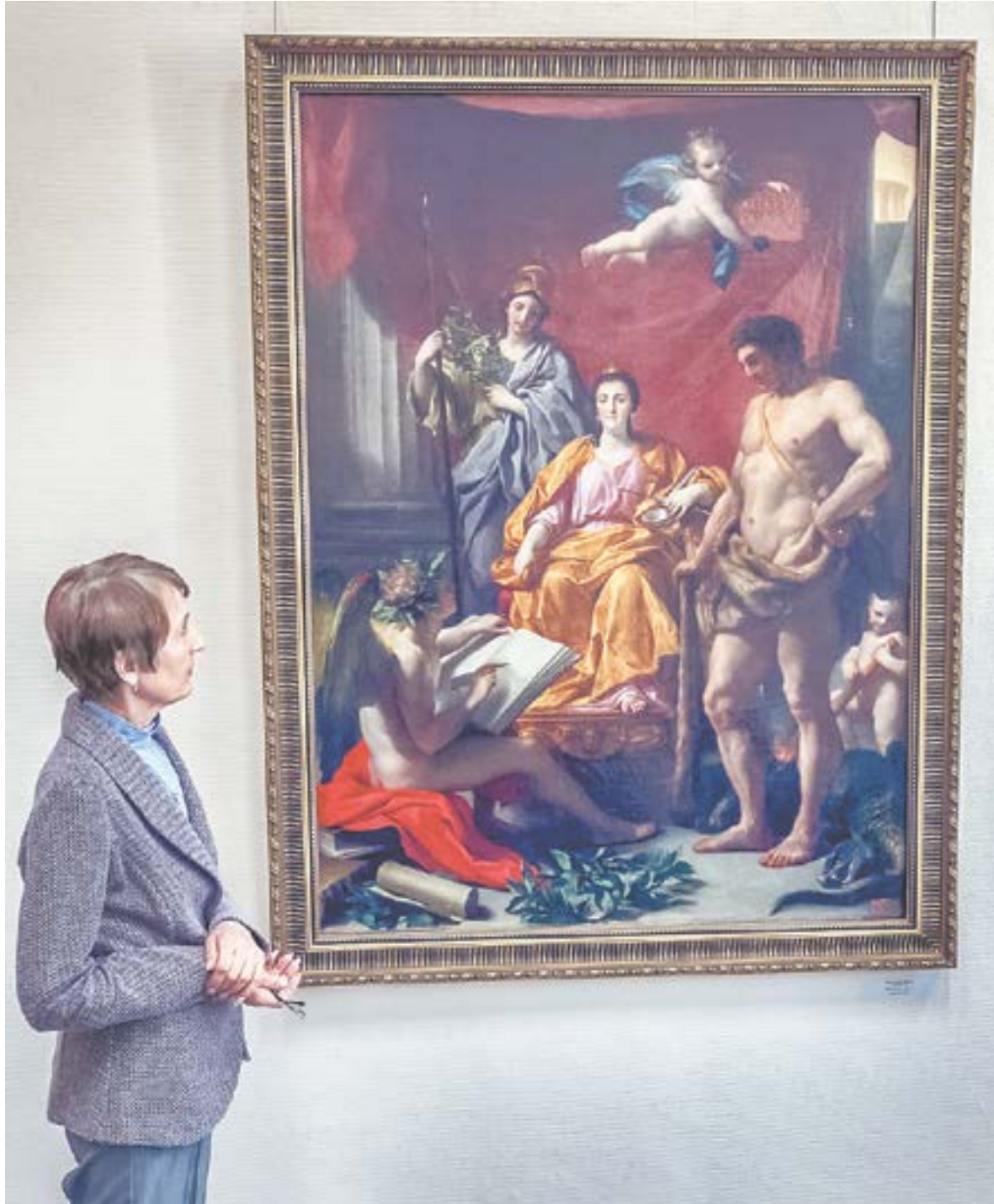
Подлинная работа Менгса стала поводом вспомнить яркую эпоху и показать другие сокровища ГХМАК.

Кстати, в собрание ГХМАК картина попала в 1960 году из Третьяковской галереи в числе са-