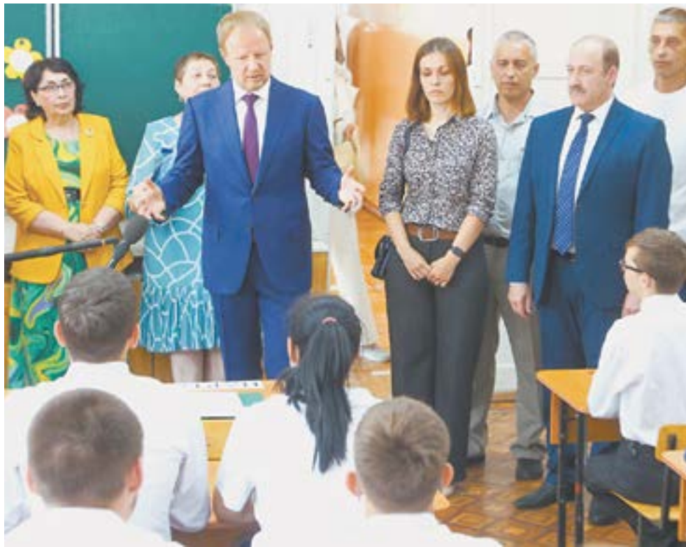
Виктор Томенко прибывает в Рубцовск почтить память Героя России.