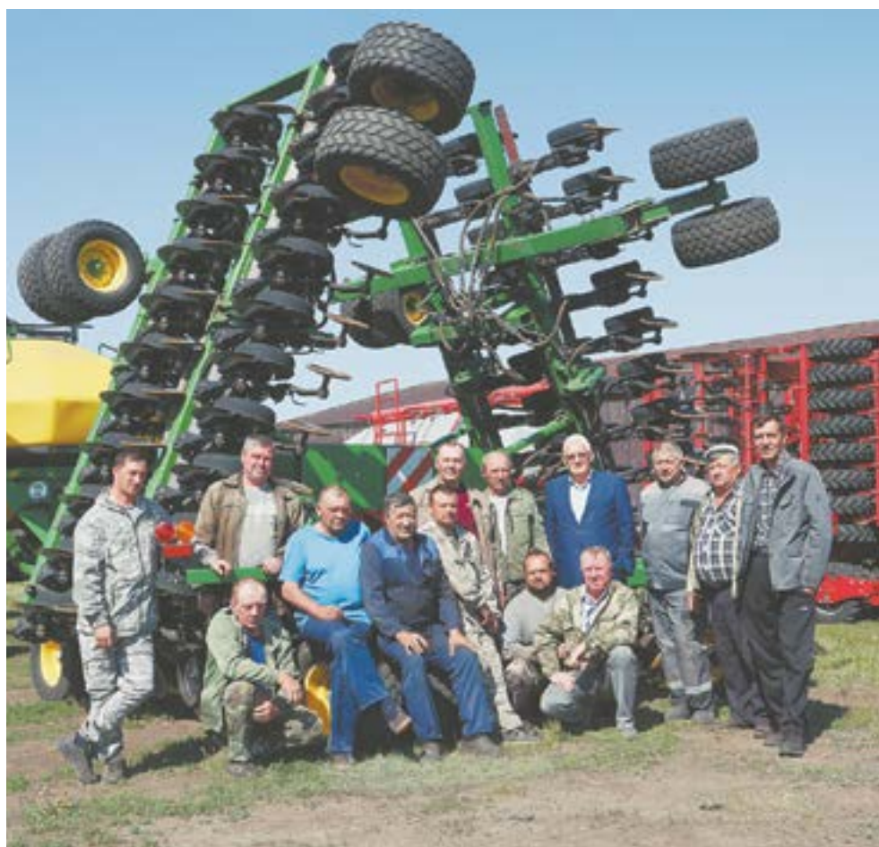
Посевная прошла, механизаторы проводят диагностику техники.

– В этом году все ветра идут с севера или северо-востока, хотя традиционно у нас – юго-западные ветра. Дует в послед-