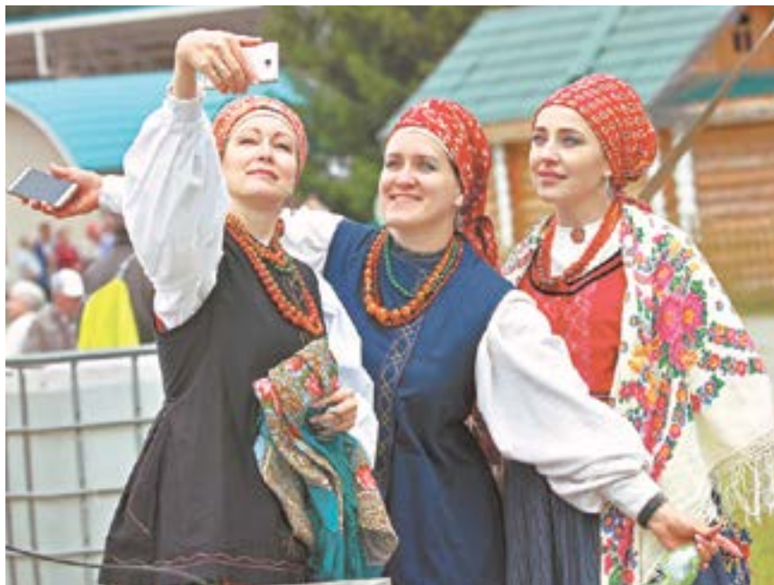
Фестиваль на «Бирюзовой Катуни» ежегодно собирает тысячи гостей.

День России на Алтае: самое важное и интересное.