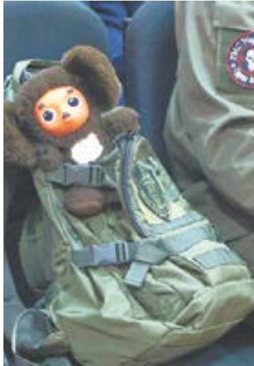
Война не искоренит человечность.