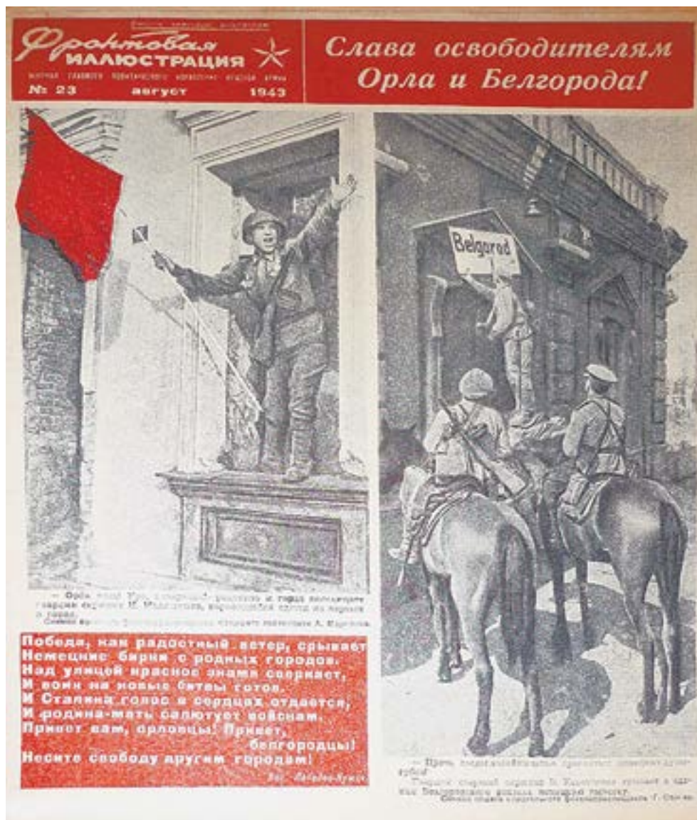
Листовка, 1943 г.

Но для советского военного командования проблема с перебежчиками накануне крупных наступательных операций оставалась непростой. «В мае, – сообщалось в ежемесячном докладе фронтовых контрразведчиков Виктору Абакумову, – наибо-