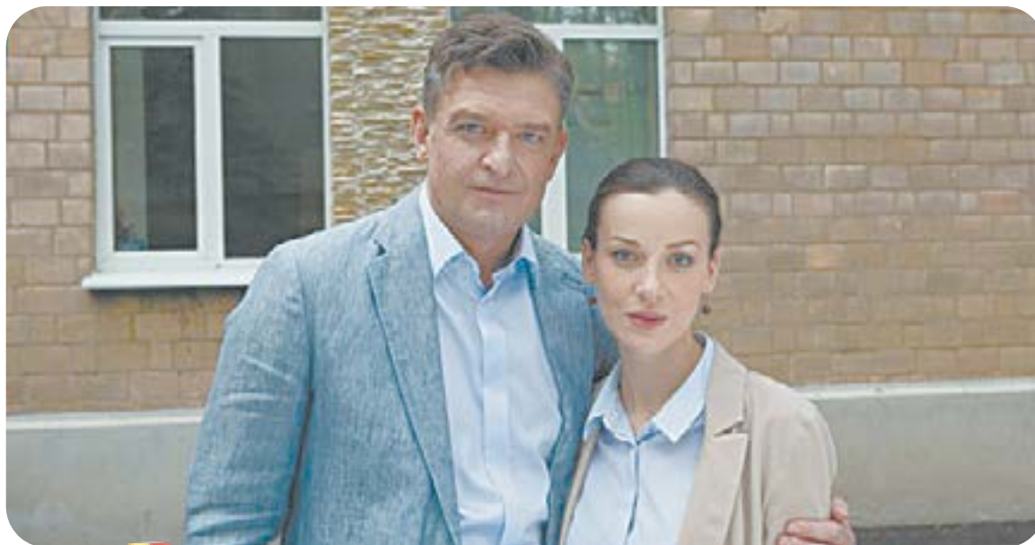
19.00 Х.ф. «МОЯ СЕСТРА ЛУЧШЕ» (16+)

04.55 Т.с. «Москва. Центральный округ» (16+) 06.30 «Утро. Самое лучшее» (16+) 08.00 «Сегодня» 08.25 Т.с. «Лесник» (16+) 10.00 «Сегодня» 10.35 Т.с. «Лесник» (16+) 13.00 «Сегодня» 13.25 «Чрезвычайное происшествие» 14.00 «Место встречи» (16+) 16.00 «Сегодня» 16.50 «За гранью» (16+) 17.55 «ДНК» (16+) 19.00 «Сегодня» 20.00 Т.с. «Эффект домино» (16+) 22.15 Т.с. «Реализация» (16+) 23.35 «Сегодня»