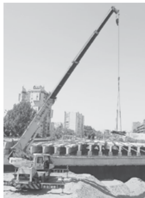
Мост на реконструкции.