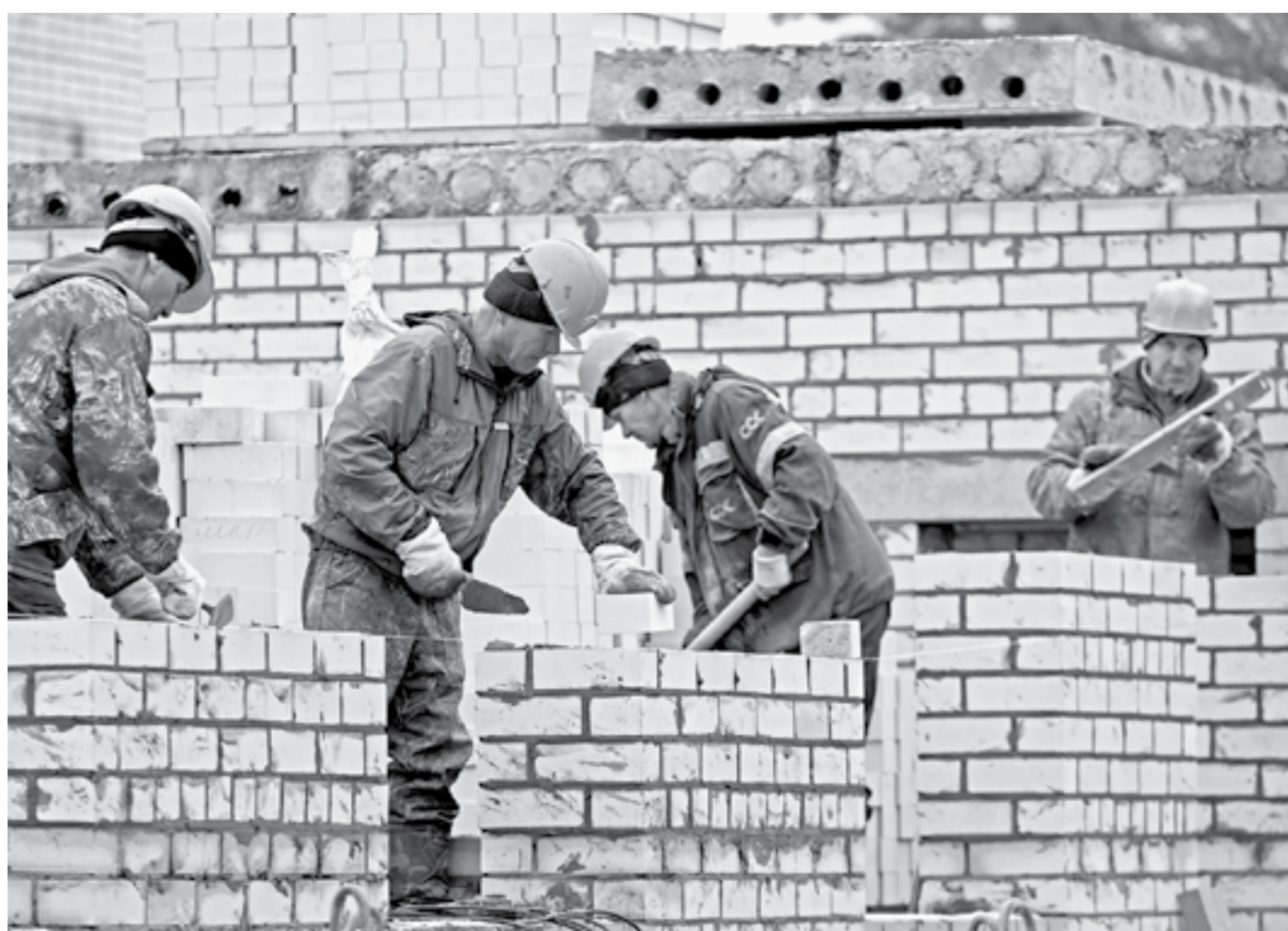
За год зарплата строителей выросла на 40%.