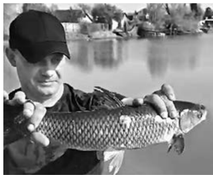
Белый амур будет спасать рубцовский водоем.

Белый амур – пресноводный обитатель, относящийся к семейству карповых. Живет в местах с медленным течением или стоячей водой. Польза его заключается в контроле роста водорослей. Рыба прекрасно справляется с очисткой и предотвращает цветение водоема. Толстолобик – крупная рыба семейства карповых. Отлично очищает водоемы от мути, зеленых микроорганизмов и примесей. Это настоящий живой фильтр от природы, который делает цветущую и грязную воду чистой и прозрачной.