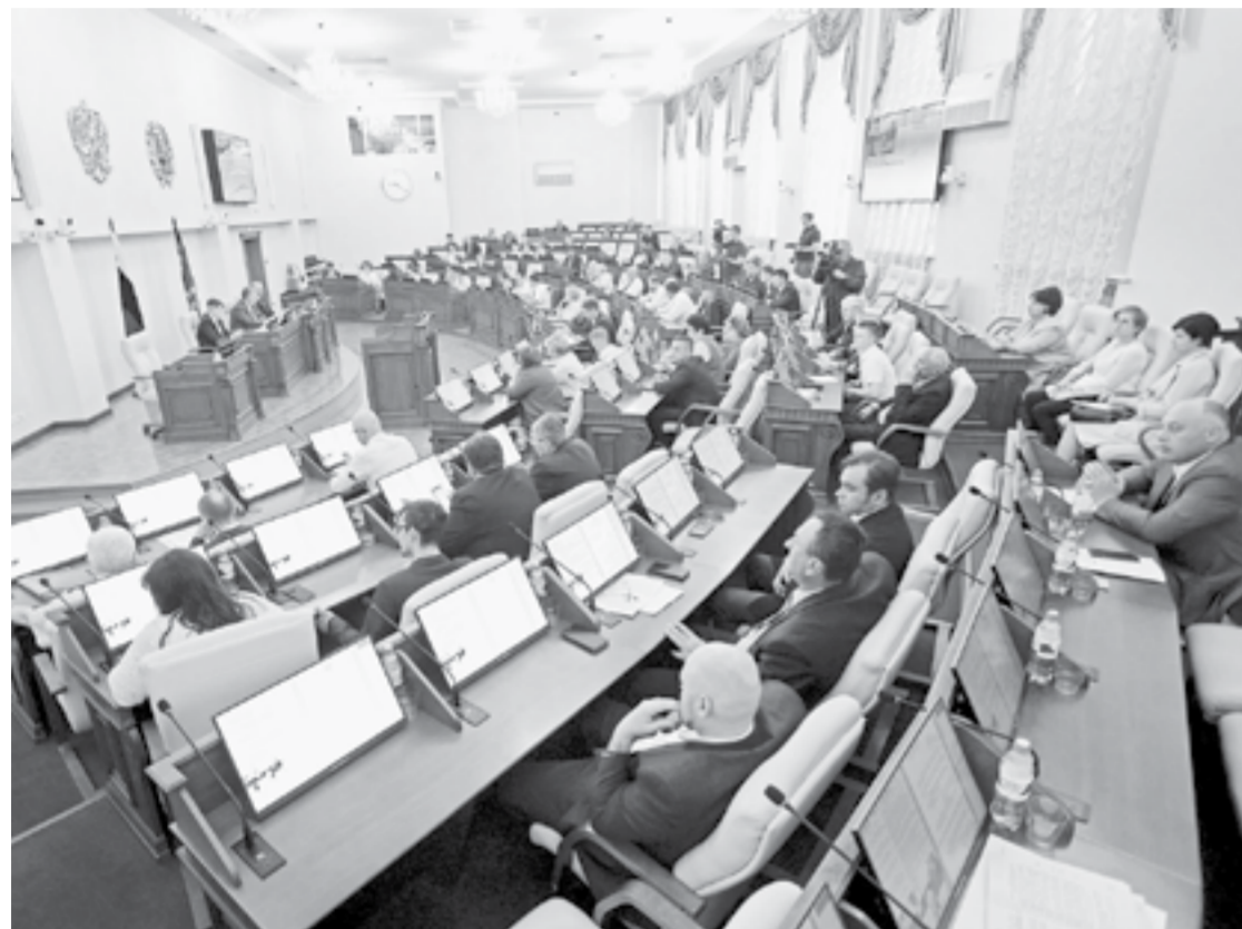
На июньской сессии АКЗС.

Эти и другие новости читайте на сайте: www.ap22.ru