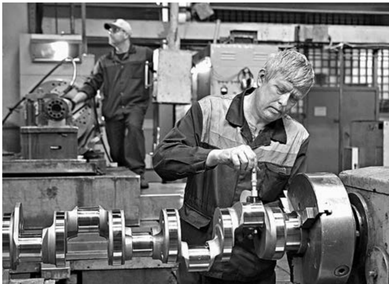
Несмотря на западные санкции, промышленность края работает стабильно.

Нарушения на сумму порядка 4,5 млрд рублей подлежат устранению. Есть грубые нарушения, материалы по которым направлены в прокуратуру. Одно из них касается сферы здравоохранения. 100 млн в год тратит краевой бюджет на прачечные, принадлежащие больницам. Эти средства некоторыми учреждениями расходуются неэффективно. В коммерческих предприятиях на одного работника