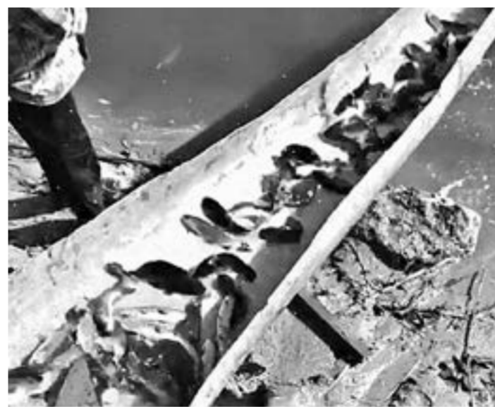
В старицу выпущено свыше тонны рыбы.