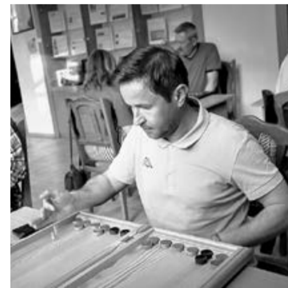
Семь раз отмерь...