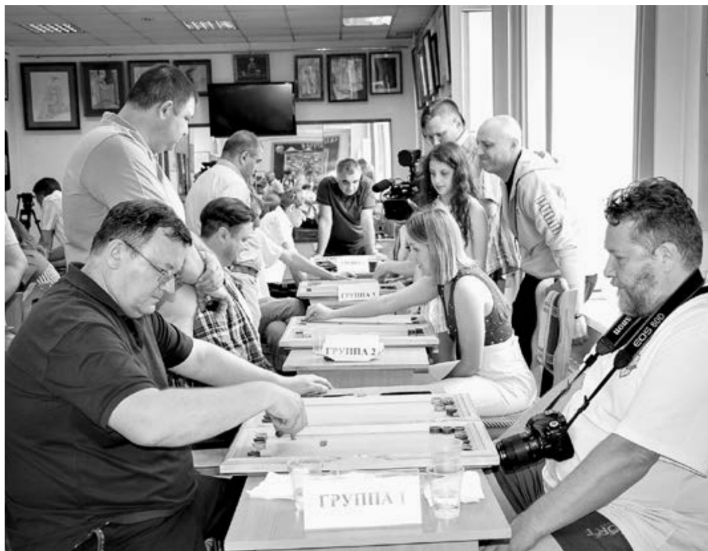
Борьба за призовые места получилась горячей.