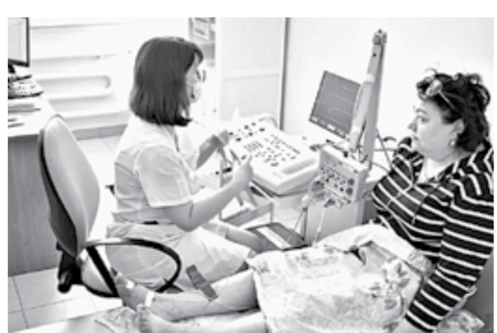
На базе центра пациенты проходят тщательное обследование.

В мае прошлого года для пациентов с эндокринной патологией в Алтайском крае был создан краевой амбулаторный эндокринологический центр на базе Консультативно-диагностического центра. Здесь оказывают помощь самым сложным пациентам со всего региона. За год центр посетили более 26 тыс. человек, еще около 50 тыс. получили телемедицинские консультации с федеральными центрами.