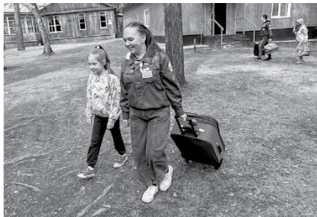
Востребованность летних лагерей высока даже без нештба.

– На самом деле было очень сложно, потому что это первый опыт, – вспоминает юноша прошлый год. – Но когда вернулся в город, через какое-то время потянуло назад. Я даже еще не сформулировал для себя, почему. Наверное, особая атмосфера, и с