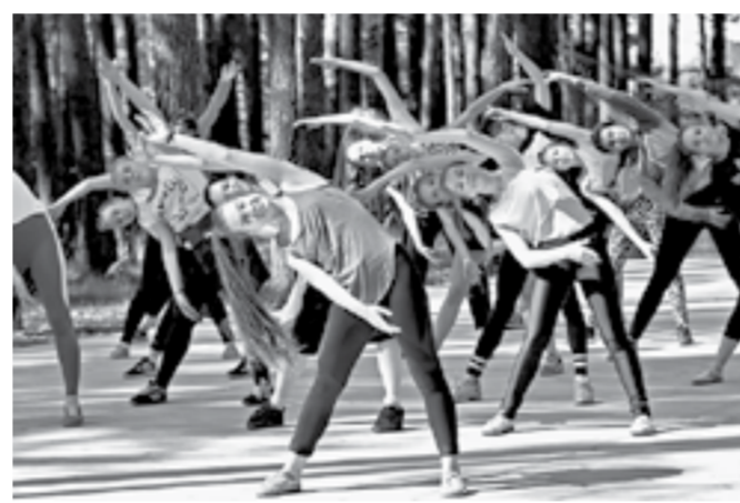
Нужно провести время весело и с пользой.