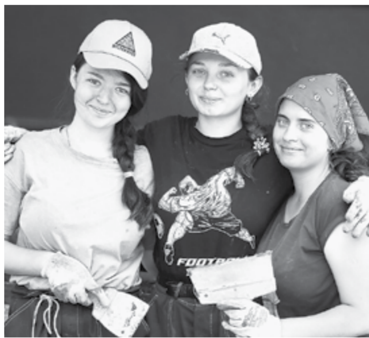
Школьники узнают разные профессии.

В помощь учителям в Минпросвещения России разработали комплекты материалов для