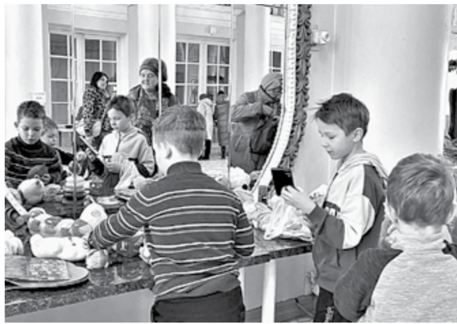
Много вещей и игрушек приносят на акцию для детей.