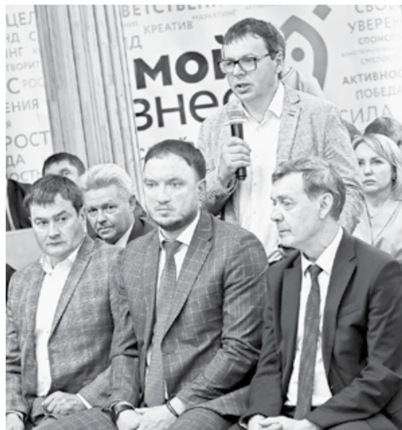
В режиме открытого микрофона.