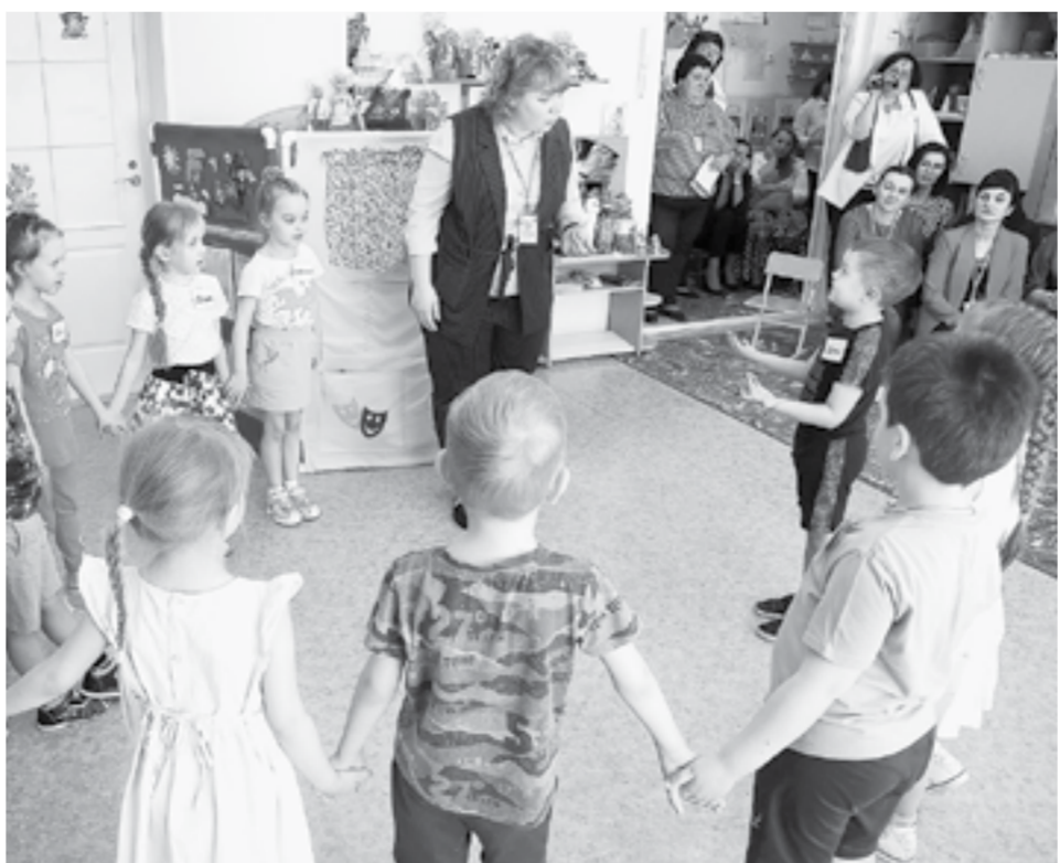
Медикам предоставят первоочередное право на места для их детей в детсадах.

Новые правила увеличат пропускную способность приютов для бездомных животных. Действующая система обращения с животными базируется на методике «отлов – стерилизация – вакцинация – возврат в среду», этапы стерилизации и вакцинации проходят в приютах. По