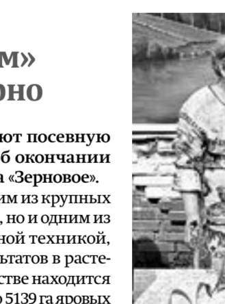
На празднике в Черемшанке было весело и многолюдно.

Аграрии района завершают посевную кампанию. В понедельник об окончании работ сообщили из хозяйства «Зерновое». Оно считается не только одним из крупных по земельным угодьям в районе, но и одним из самых оснащенных современной техникой, где добиваются хороших результатов в растениеводстве. В обработке в хозяйстве находится 13 тысяч гектаров земли. Посеяно 5139 га яровых зерновых и зернобобовых культур, 3897 га подсолнечника, с осени прошлого года – 2332 га озимой пшеницы, которая успешно перезимовала.