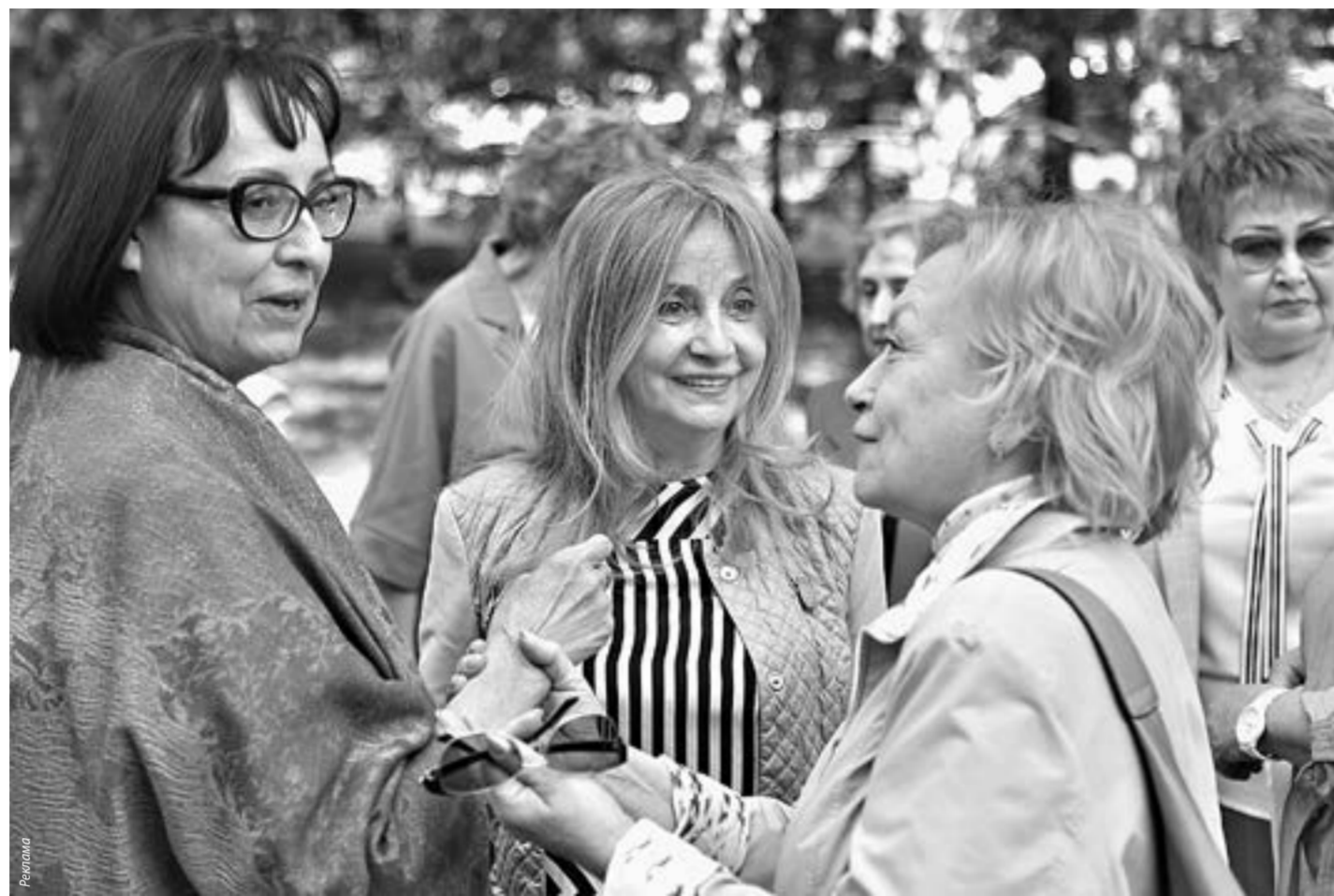
Одним из самых теплых и трогательных событий юбилейной недели стала встреча самых первых выпускников.