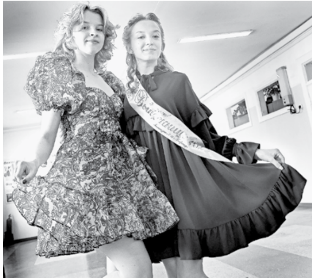
Такие нарядные выпускницы!