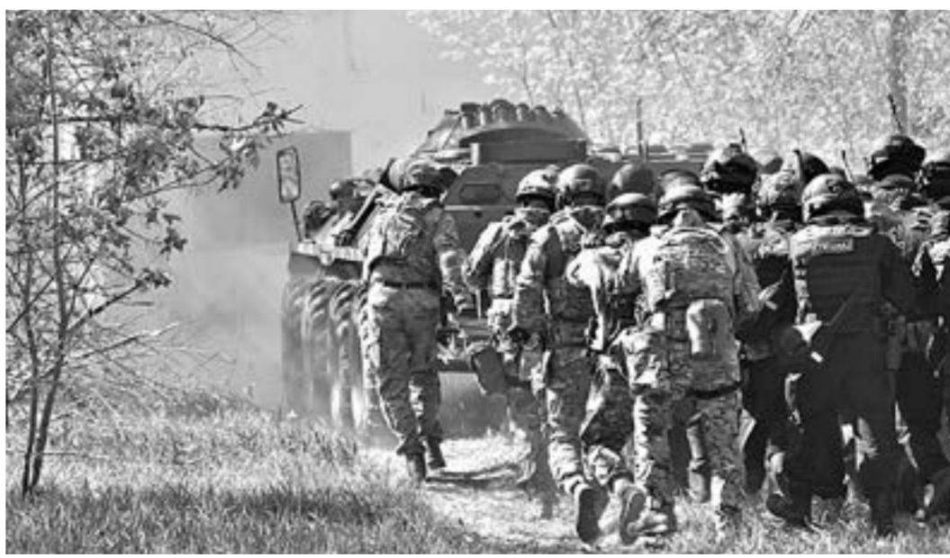
Под защитой техники.

взрыве самодельного взрывного устройства в одном из общежитий и блокировании жильцов на верхних этажах, сообщили «АП» в пресс-службе УФСБ России по краю. Людей удалось вывести благодаря профессиональным действиям спасателей.