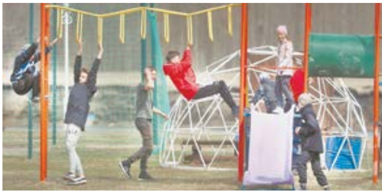
Стадион в селе – популярное место.

Достопримечательность села – футбольное поле с искусственным покрытием и примыкающая к нему зона отдыха с мостками через запруженную реку. Футбольное поле сделано по программе комплексного развития сельских территорий, остальные спортивные объекты – за счет средств ООО «Вирт». Территория не пустует, здесь не только проходят тренировки местных спортсменов, но и организуют районные игры. Рядом со стадионом – зона отдыха, она также оборудована в рамках комплексного развития сельских территорий с участием спонсорских средств.