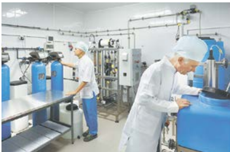
В производственном отделе аптеки.