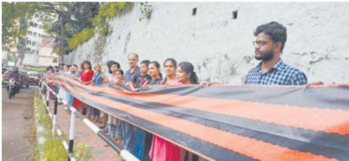
Жители Тривандрума готовятся к памятной шествию с георгиевской лентой длиной 78 метров.