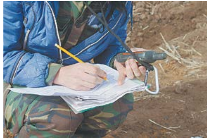
Координаты каждого участка заносятся в журнал.

«Целинник» применяет классическую технологию. Нынешняя посевная кампания складывает-