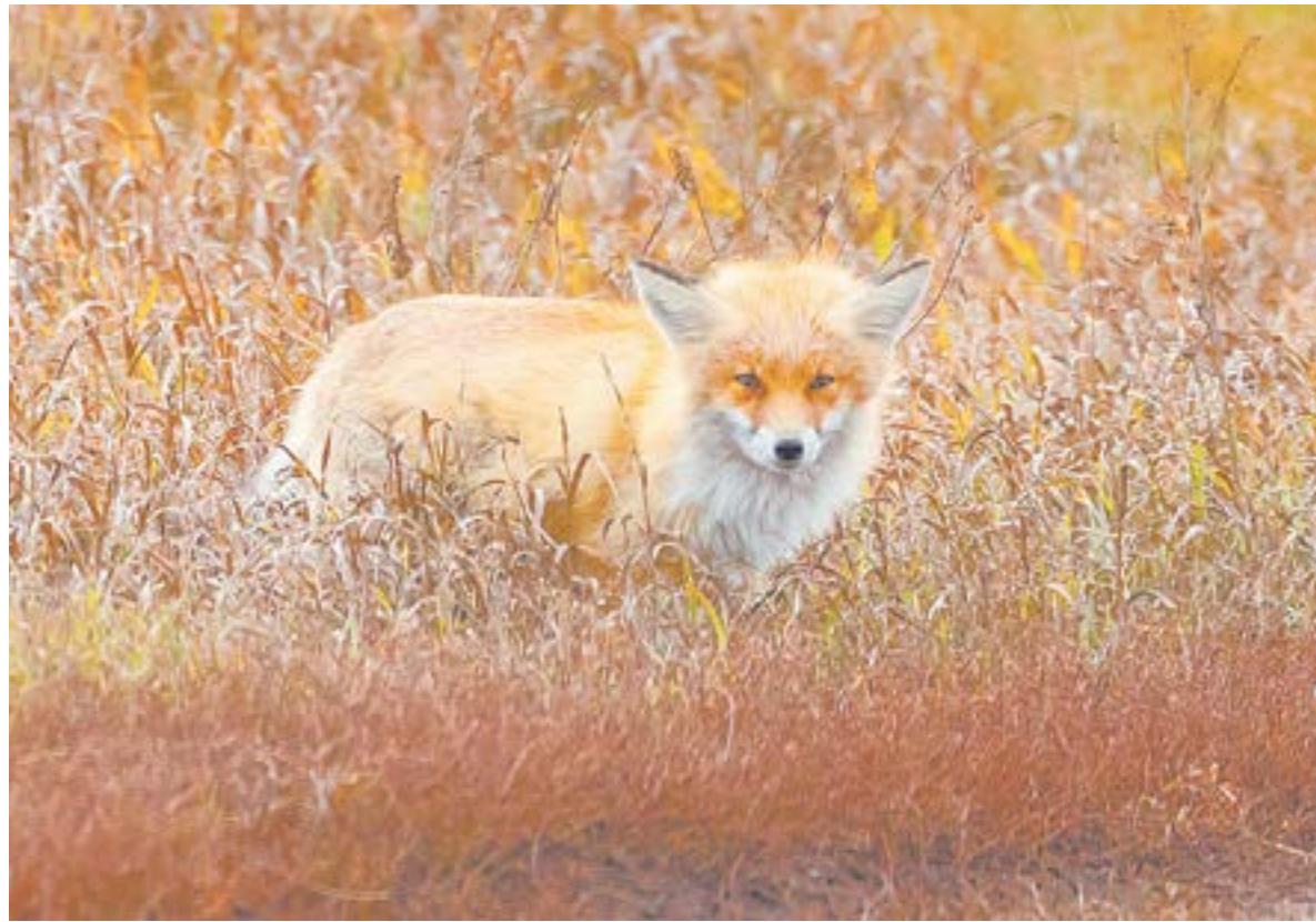
К лисе наши охотники давно равнодушны.

Это увеличение специалисты связывают с приказом Минприроды РФ, который минимальный процент нормы изъятия (то есть отстрел животных во