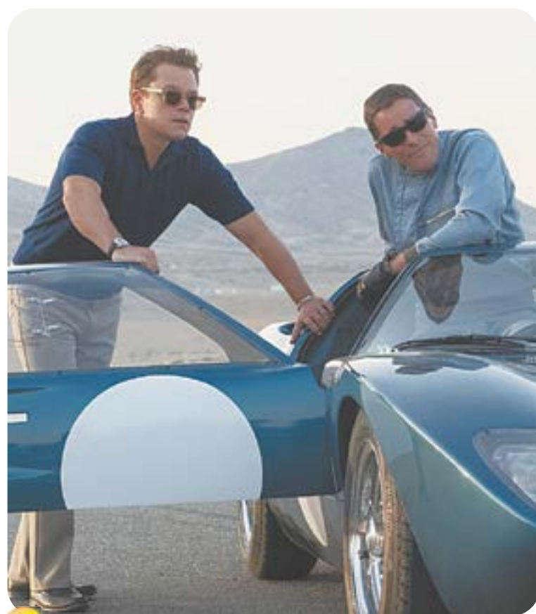
20.00 Х.ф. «FORD ПРОТИВ FERRARI» (16+)

04.55 Т.с. «Москва. Центральный округ» (16+) 06.30 «Утро. Самое лучшее» (16+) 08.00 «Сегодня» 08.25 Т.с. «Лесник. Своя земля» (16+) 10.00 «Сегодня» 10.35 Т.с. «Лесник. Своя земля» (16+) 13.00 «Сегодня» 13.25 «Чрезвычайное происшествие» 14.00 «Место встречи» (16+) 16.00 «Сегодня» 16.50 «За гранью» (16+)