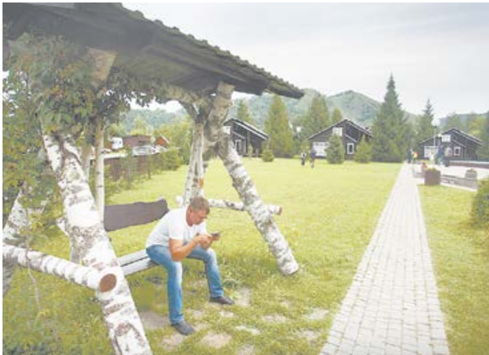
На Алтае немало мест для отличного отдыха.

В крае уже не первый год отмечен спрос на комфортный отдых, который предприниматели пытаются удовлетворить. На сегодняшний день в крае 19 гостиниц имеют категории 4–5 звезд. Они находятся в Барнауле, Белокурихе и Алтайском районе. В прошлом году появился пятизвездочный «Гранд шале Алтай» на «Бирюзовой Катунь» и четырехзвездочный апартамент-отель