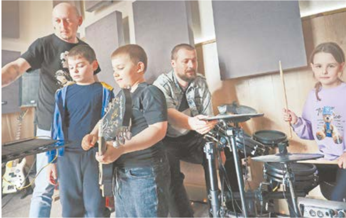
Занятия в ДК.

Как только въезжаешь в село, понимаешь, что оно отличается от множества других, в которых населения менее 1000 человек. Дороги в центре гладкие, без колдобин, их асфальтируют за счет программы поддержки местных инициатив, муниципального дорожного фонда и якорного предприятия. Администрация района поставила перед собой задачу через пару лет все улицы в Дружке привести в порядок.