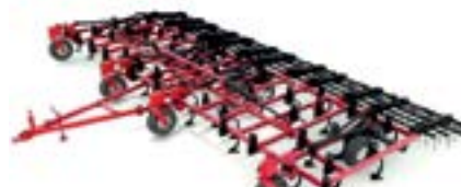
Культиваторы R серии