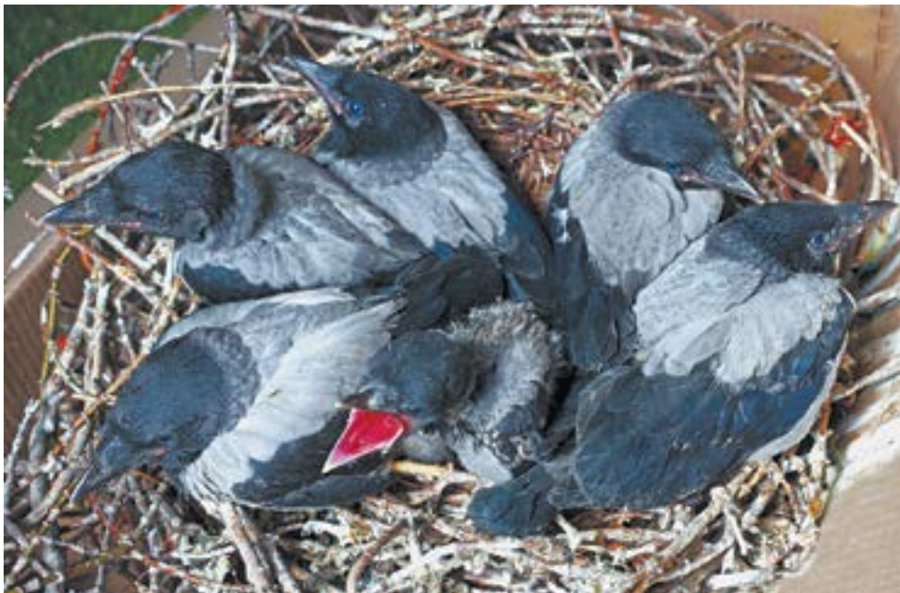
Шесть воронят лишились дома.

Ворона – умная птица. Выкормить-то ее несложно, она всеядна. А вот дальнейшая судьба воронят под вопросом.