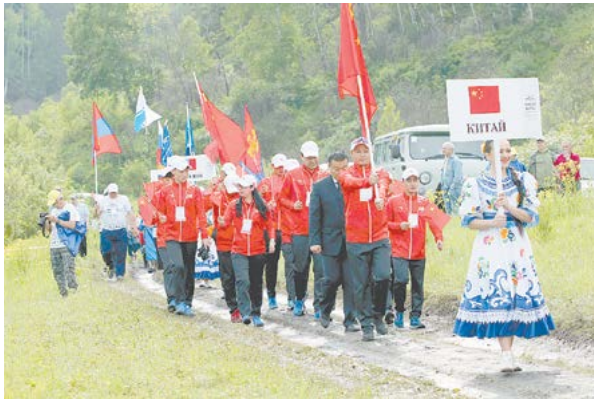
Фестиваль «Большой Алтай» собирает друзей.