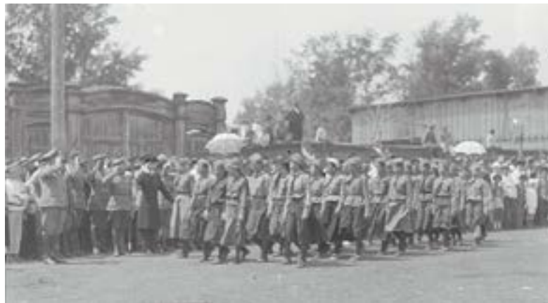
Девушки-скауты на параде в Барнауле летом 1919 года.