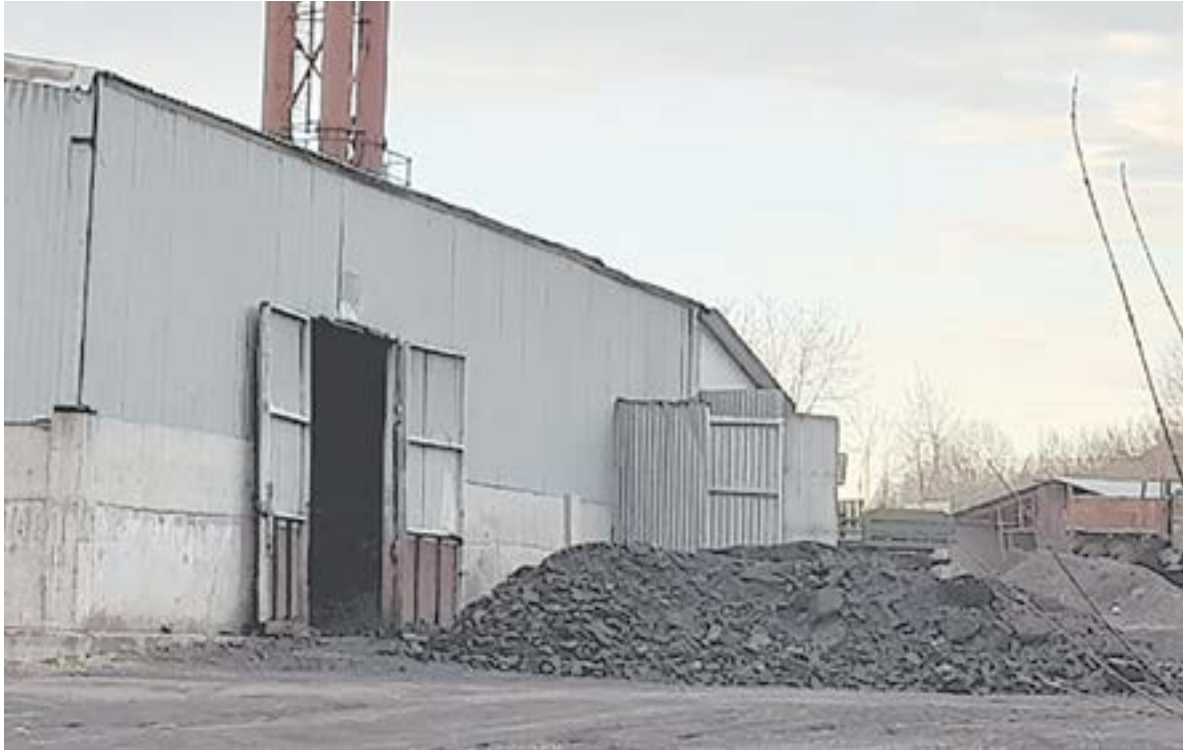
Дымок из трубы с примесями?

– Персонал не очень хорошо использует котел. Можно сказать, это делается просто безобразно, – подчеркнул завкафедрой. – Поэтому есть определенный процент механического недожога топлива. Когда мы, котельщики, проектируем котлы, то всегда делаем так, чтобы дым был белый. Это свиде-