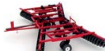
Тандемные дисковые бороны DX