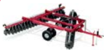
Офсетные дисковые бороны DV