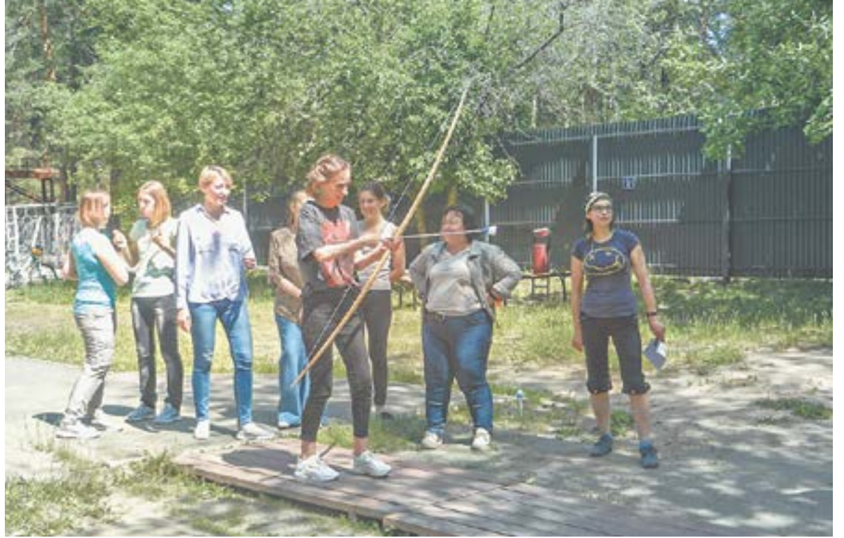
Выездные мероприятия коллектива Шишковки проходят весело.