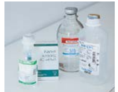
Чисто! Продукция алтайских аптек.

Законодательная новелла позволит производственным аптекам занять в том числе нишу индивидуального изготовления