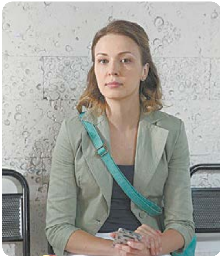
19.00 Х.ф. «Первокурсница» (16+)

04.45 Т.с. «Пляж» (16+) 08.00 «Сегодня» 08.25 Т.с. «Морские дьяволы. Смерч» (16+) 10.00 «Сегодня» 10.35 Т.с. «Морские дьяволы. Смерч» (16+) 13.00 «Сегодня» 13.30 «Чрезвычайное происшествие» 14.00 «Место встречи» (16+) 16.00 «Сегодня»