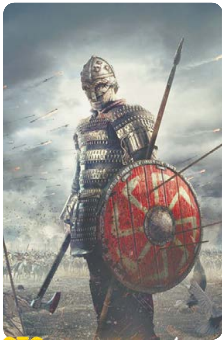
СТС 16.35 Х.ф. «ЛЕГЕНДА О КОЛОВРАТЕ» (12+)

04.55 Т.с. «Пляж» (16+) 06.30 «Центральное телевидение» (16+) 08.00 «Сегодня»