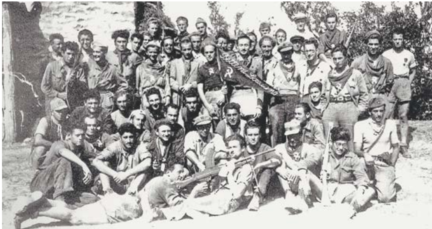
63-я партизанская бригада была интернациональной по своему составу.