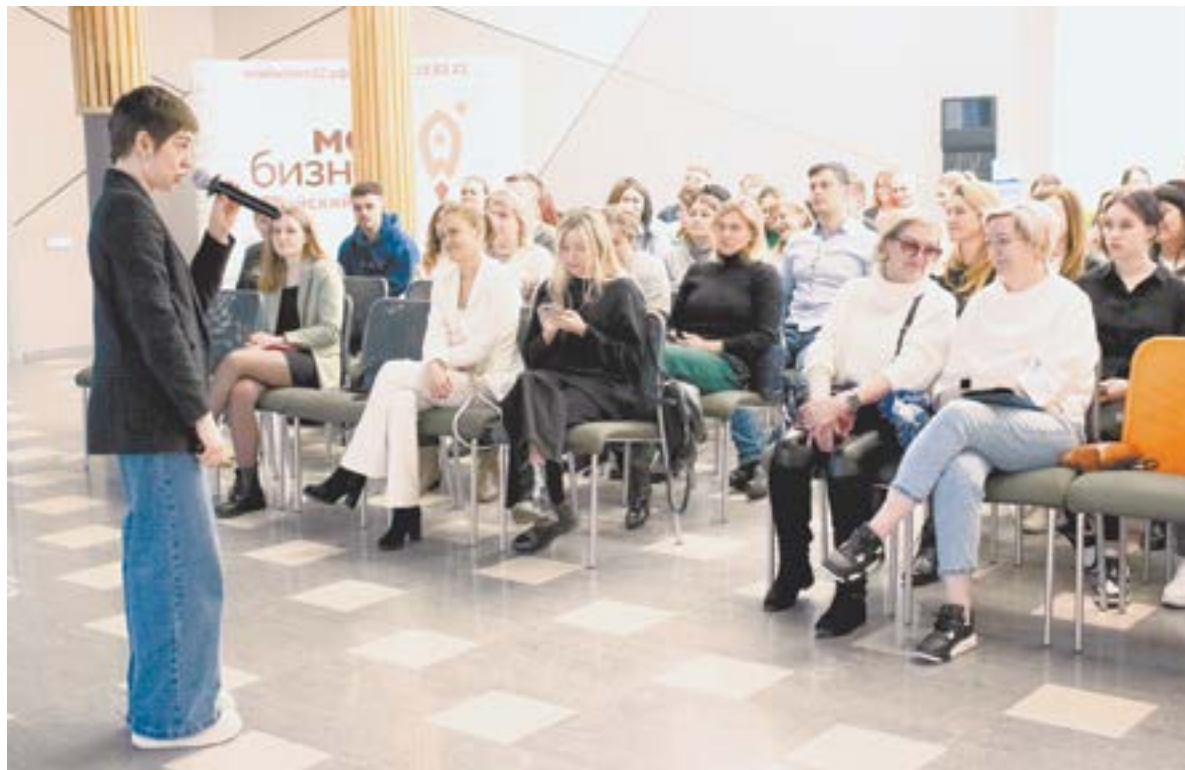
Человеческий капитал – большая ценность, уверена эксперт.

– Представим, что я хочу пойти поужинать, – объясняет она. – На основе чего я буду выбирать заведение? Отзывы, меню, интерьер, средний чек. Но станет ли