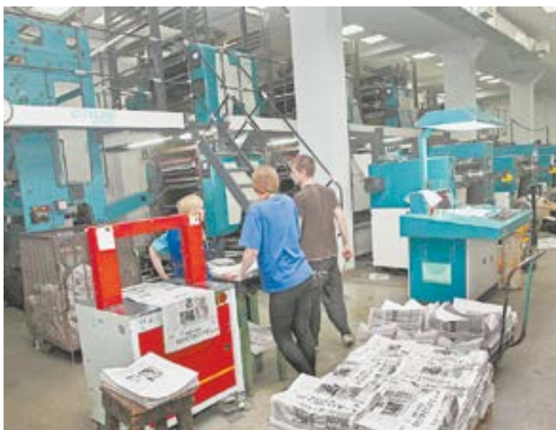
В цехе ИПП «Алтай», 2023 год.

Первой книгой, напечатанной в барнаульской типографии, стало «Учреждение для управления сибирских губерний» М.М. Сперанского. Тираж составил 140 экземпляров и был разослан по волостным правлениям. В краевой библиотеке им. В. Шишкова хранится книга, изданная в Барнауле в 1856 году. Это таблицы, с помощью которых определялось содержание металла в рудах. В 1828 году типография выпустила «Учреждение об управлении Кольвано-Воскресенских горных заводов», которое было напечатано на бумаге, произведенной уже в Барнауле.