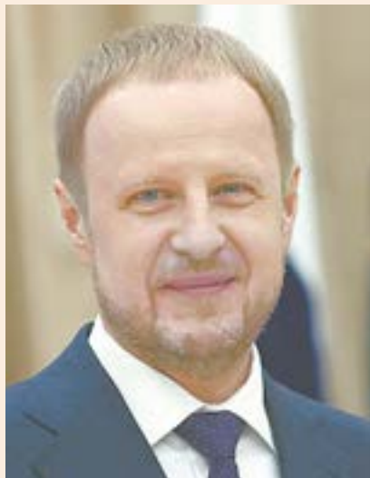
Губернатор Алтайского края В. ТОМЕНКО.