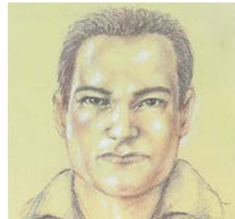
Каратон – Харитон по рисунку из Италии.