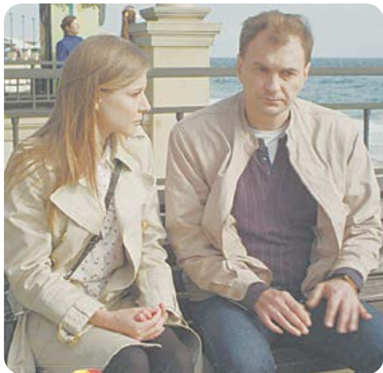
19.00 Х.ф. «ПРОЗРЕНИЕ» (16+)

04.45 Т.с. «Пляж» (16+) 08.00 «Сегодня» 08.25 Т.с. «Морские дьяволы. Смерч» (16+) 10.00 «Сегодня» 10.35 Т.с. «Морские дьяволы. Смерч» (16+) 13.00 «Сегодня»