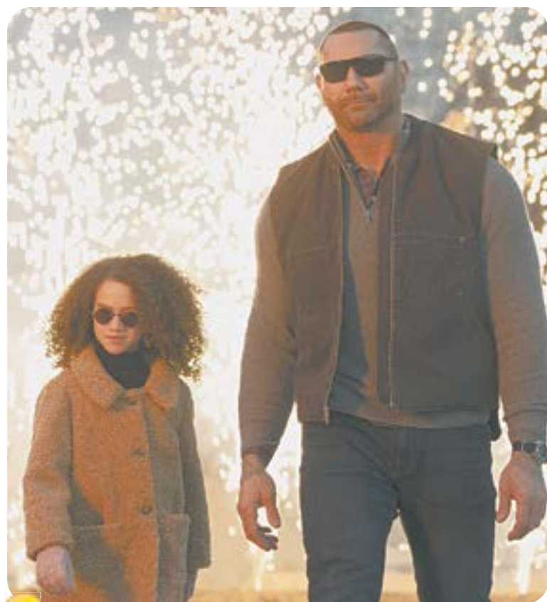
20.00 Х.ф. «Мой шпион» (12+)

04.45 Т.с. «Пляж» (16+) 08.00 «Сегодня» 08.25 Т.с. «Морские дьяволы. Смерч» (16+) 10.00 «Сегодня» 10.35 Т.с. «Морские дьяволы. Смерч» (16+)