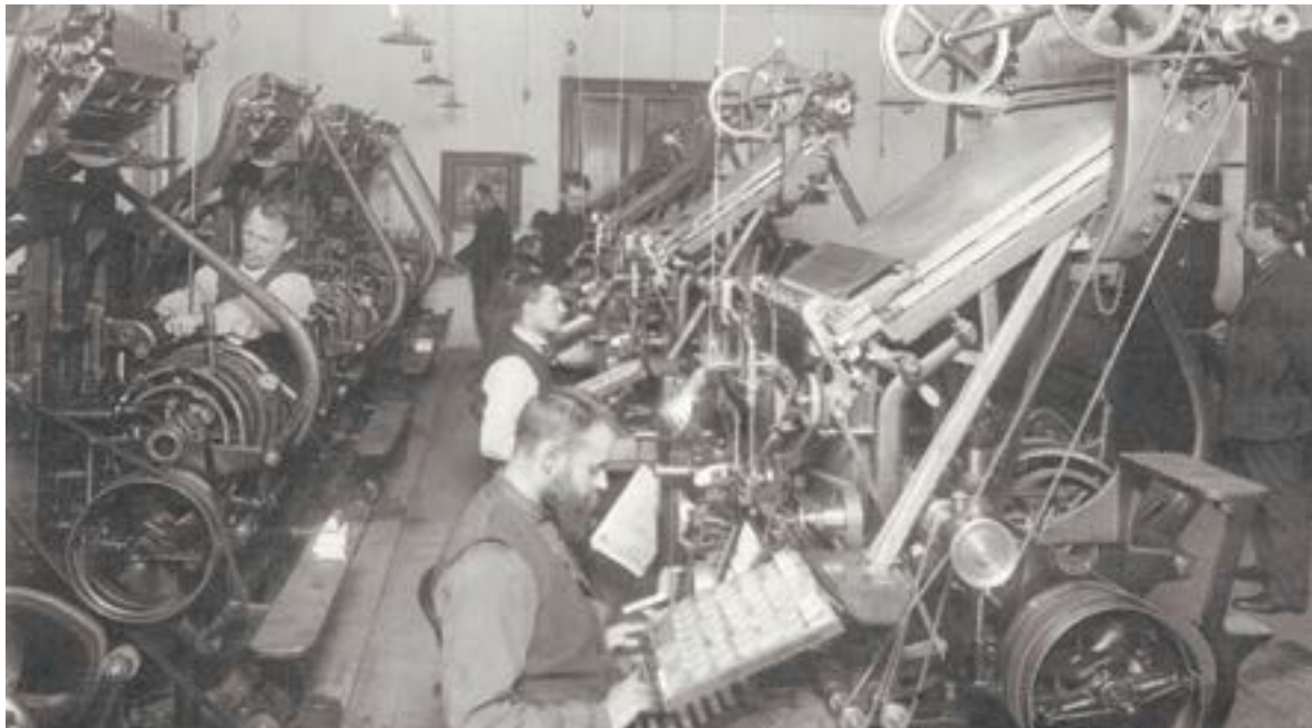
Типография. 1903 год.

Типография была построена для того, чтобы облегчить канцелярское делопроизводство. Для этого размножали канцелярскую документацию – приказы, циркуляры, послужные списки и т. д., печатали обложки для архивных дел, конторские книги, различные бланки.