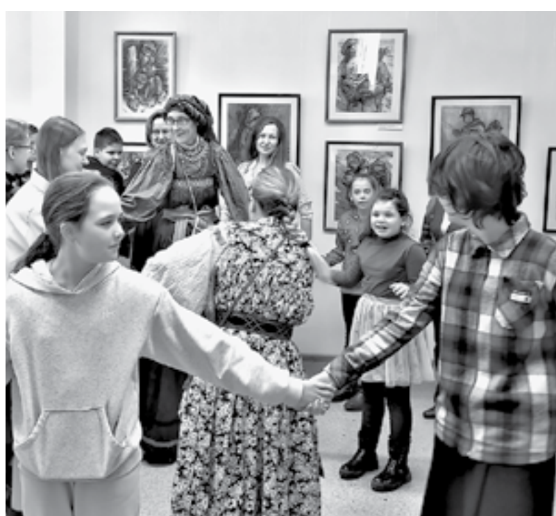
Гости праздника разучивали орнаментальные хороводы.