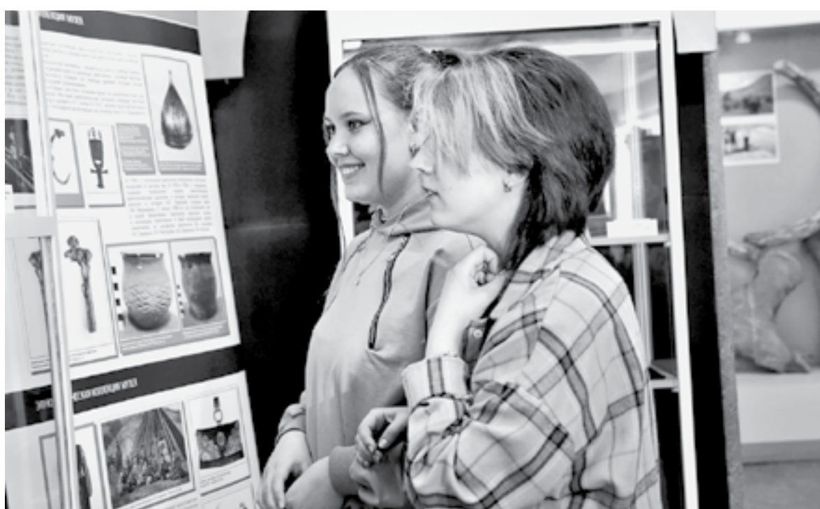
Студенткам понравилась новая выставка.

Начинается она со стенда, рассказывающего об истории самого музея. Параллельно посетители знакомятся с историей региона. В каждом разделе всего несколько экспонатов, зато каких! Взяв, к примеру, сузунские иконы, которые очень ценятся и имеются далеко не в каждом музее.