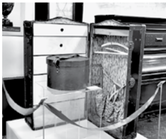
Дорожный сундук и шляпная коробка – интересные предметы на выставке.