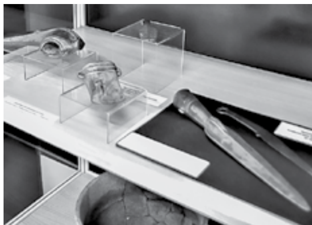
Археологическая коллекция – из числа первых экспонатов музея.