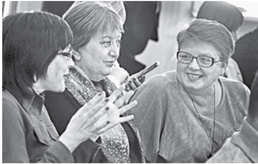
Редакторы живо откликнулись на ответы губернатора.

сократить очередь на получение многодетными семьями земельных участков.