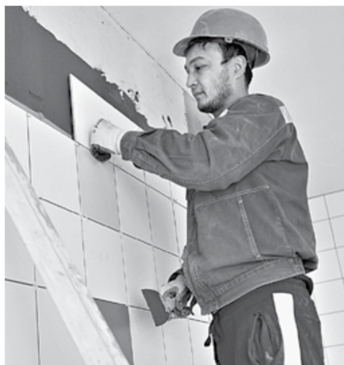
Строительные работы завершатся летом.