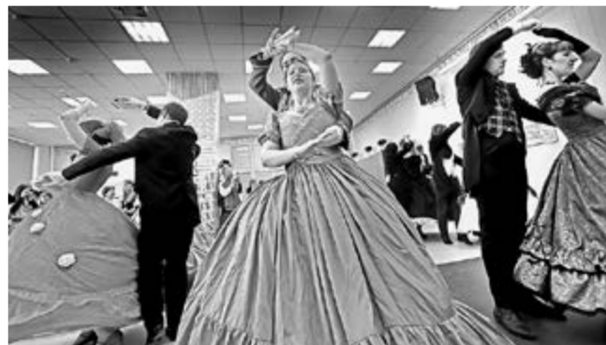
Выступление студии старинного танца «Северная сторона».