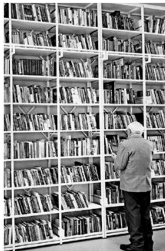
«Библионочь» как повод поискать хорошую книгу.