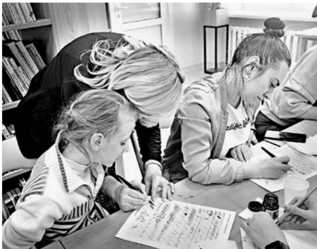
Азы английского курсива осваивали в специальных прописках.