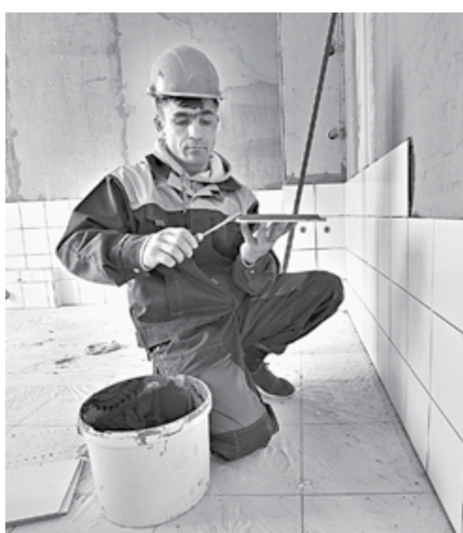
Идет отделка помещений.