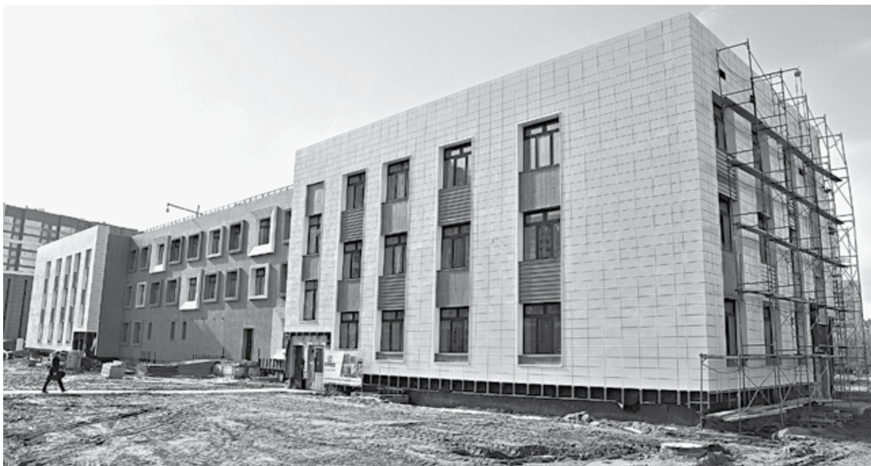
Таким нестандартным будет детский сад.