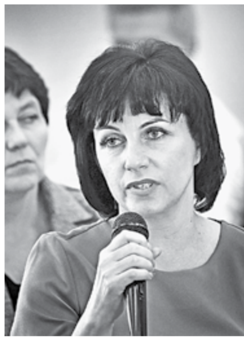
Вопросы касались положения дел в районах.