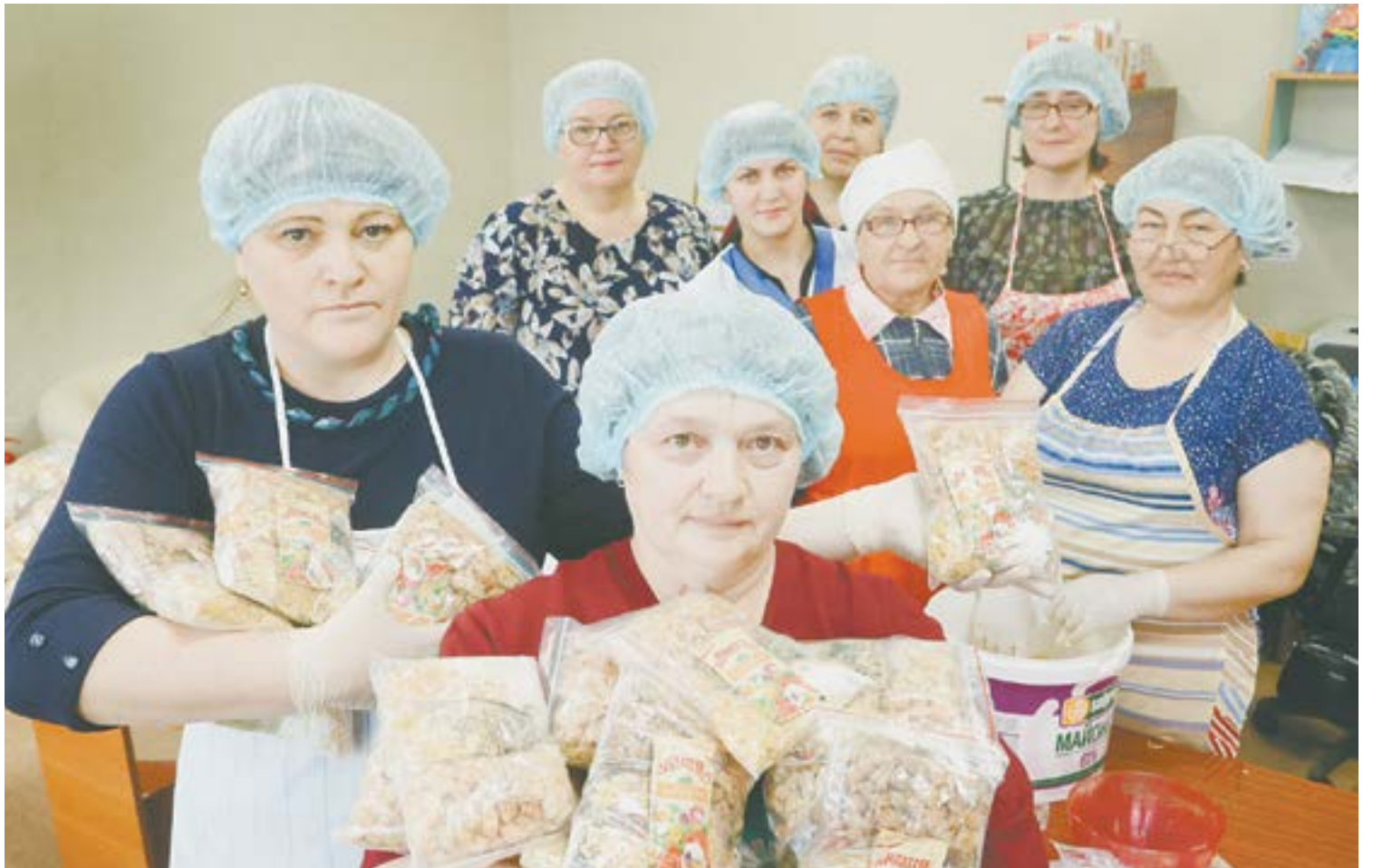
Женщины Красногорского за упаковкой сухих смесей.

На столах – горы сухих ингредиентов, овощи, бульонная основа, специи. Все, что нужно, уже отварено, спассеровано и готово к упаковке. Пространство вокруг благоухает так, что голодным лучше не входить в это просторное помещение, выделенное специалистами местного управления социальной защиты населения.