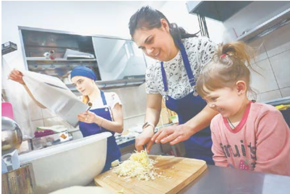
С самого утра повар готовит горячие блюда.

– Я стираю белье, готовлю. Денег не хватает. Из пенсии оплачиваю коммунальные услуги, на руках остается совсем чуть-чуть