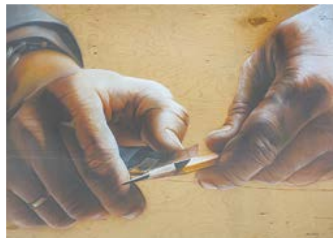
Иван Ильющенко «Руки учителя» (2015).

Большая выставка «Круг Зайкова» в Художественном музее Алтайского края посвящена Году педагога и наставника и представляет графику, живопись и скульптуру 16 художников.