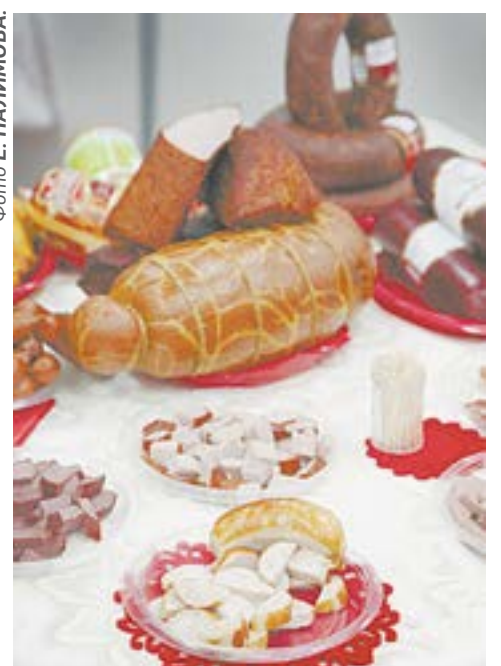
Алтайские фермерские продукты.

– Для фермеров и малых сельхозпроизводителей это отличная возможность орга-