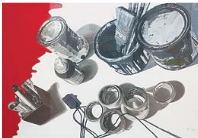
Николай Зайков «Натюрморт» (2023).