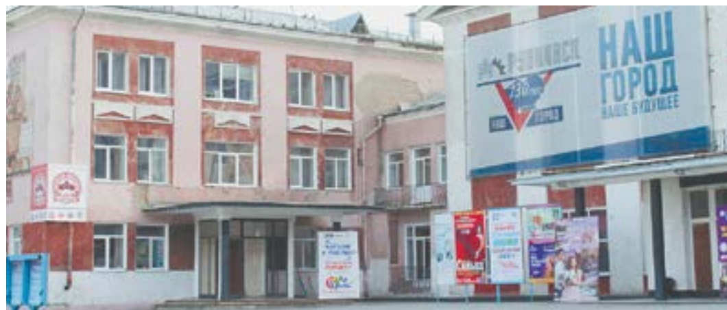
ДК «Тракторостроитель» нуждается в капитальном ремонте.