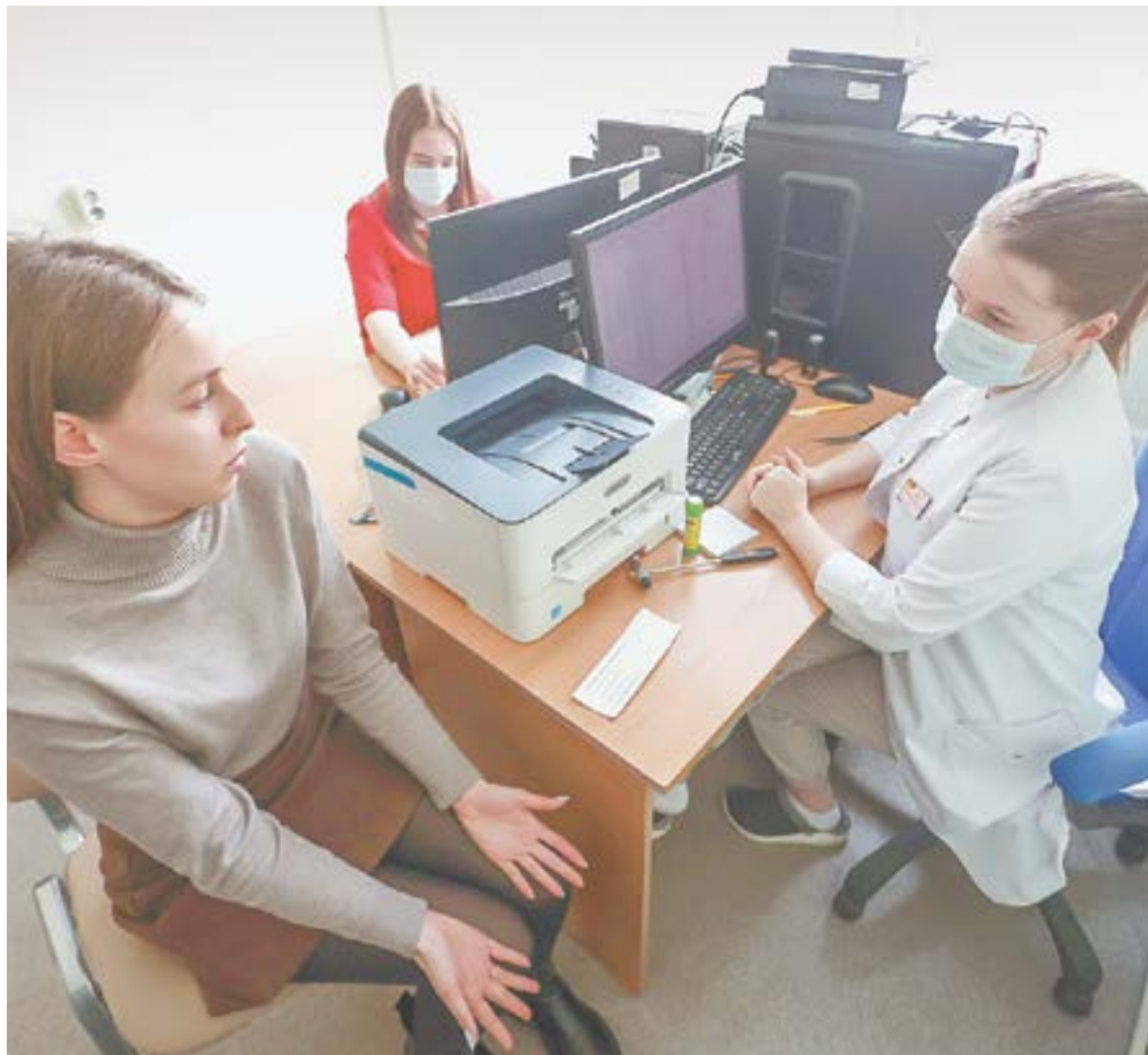
Один из видов поддержки – диспансеризация членов семей мобилизованных.

– Чем больше человек загоняет свое горе вглубь, тем сложнее потом справиться с депрессией.