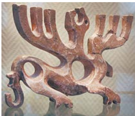
Александр Бувин «Свечник» (2013).