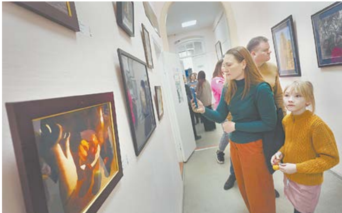
На выставке представлено более 80 произведений живописи, графики и скульптуры.