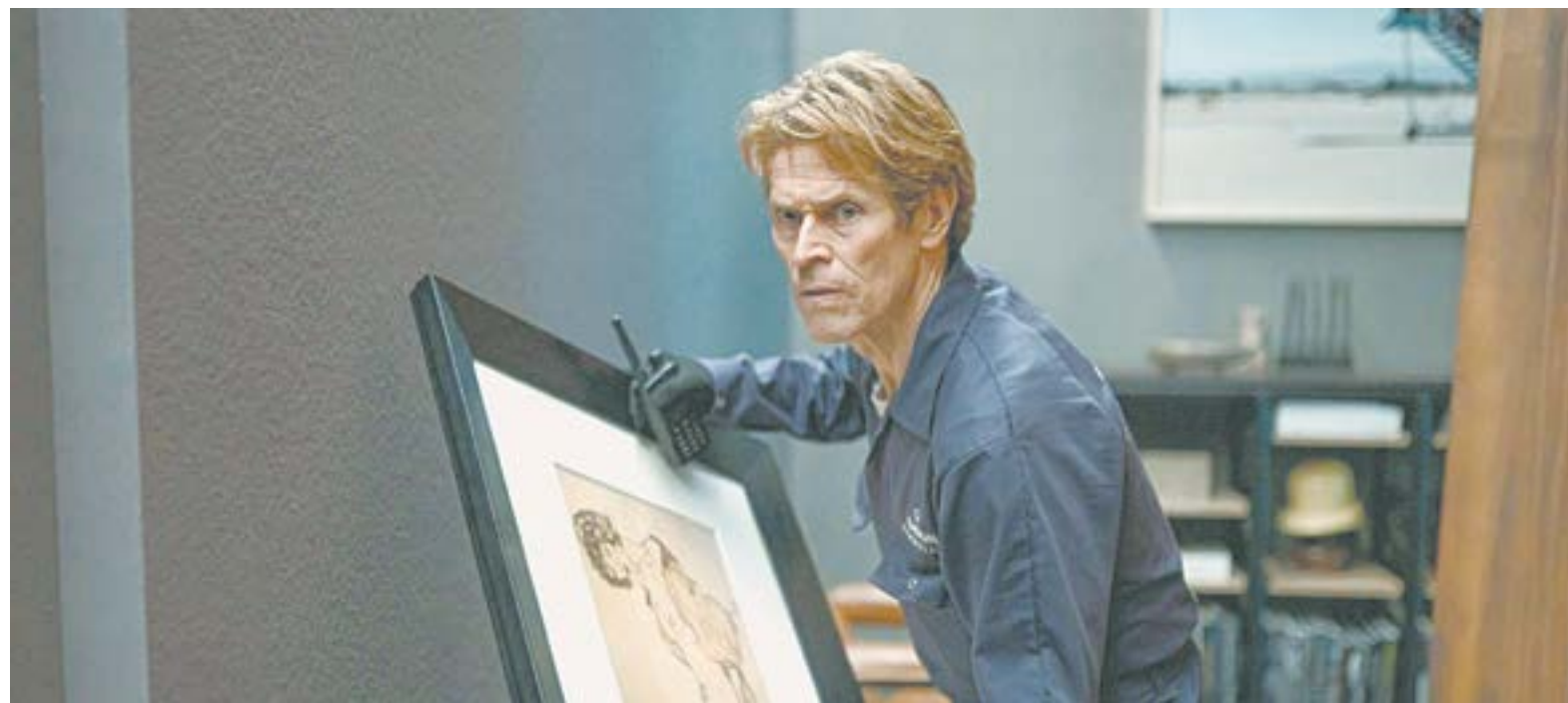
Зритель так и не узнает, обрел ли герой Уиллема Дефо свободу.

Из-за замочки запаниковал напарник Немо, который страховал его извне, подключившись к домашней системе безопасности. Видимо, не ту кнопку нажал, компьютер засбоил и заблокировал намертво все возможности вы-