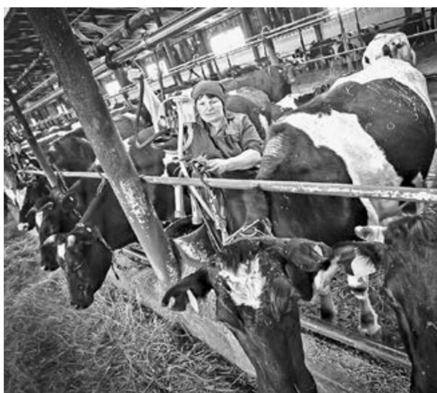
Прибыльность молочного скотоводства в регионе – 3%.

3. В этом году вступил в действие закон о побочных продуктах животноводства, который требует крупных вложений в строительство бетонных площадок, лагун для хранения и переработки навоза. «Боюсь, что многие животноводческие хозяйства,