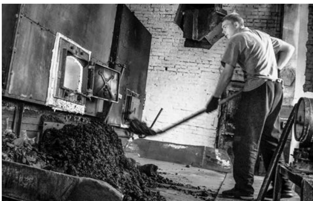
Вместе с теплом котельных иногда приходит и сажка на головы.

Еще в мае прошлого года вступило в законную силу решение Змеиногорского городского суда, по которому было признано незаконным бездействие МУП ЖКХ Змеиногорского района и районной администрации по принятию мер, направленных на очистку от отходов производства земельного участка на улице Подгорной. Злоупотребившие суд обязывал устранить в срок до 30 июля 2022 года. Также в течение одного месяца суд обязывал МУП устранить от сажки тот же земельный участок. Еще один срок (до 15 сентября 2022 года) был установлен для организации очистки золоуловителей котельной, чтобы предотвратить рассеивание сажки в новом отопительном сезоне.