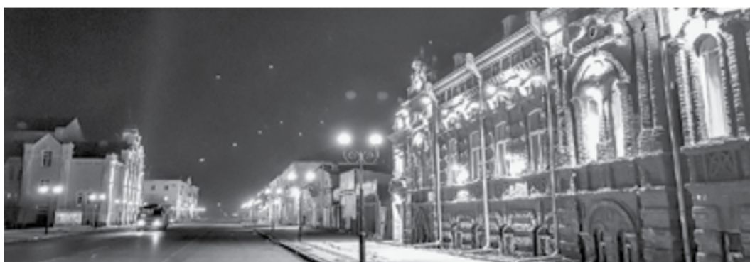
Улица Советская (Успенская) обязательно войдет в проект конкурса.

Бийск приступил к созданию туристского кода. Что это и для чего он нужен, узнал наш корреспондент.