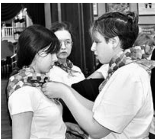
Участники готовятся к фестивалю.