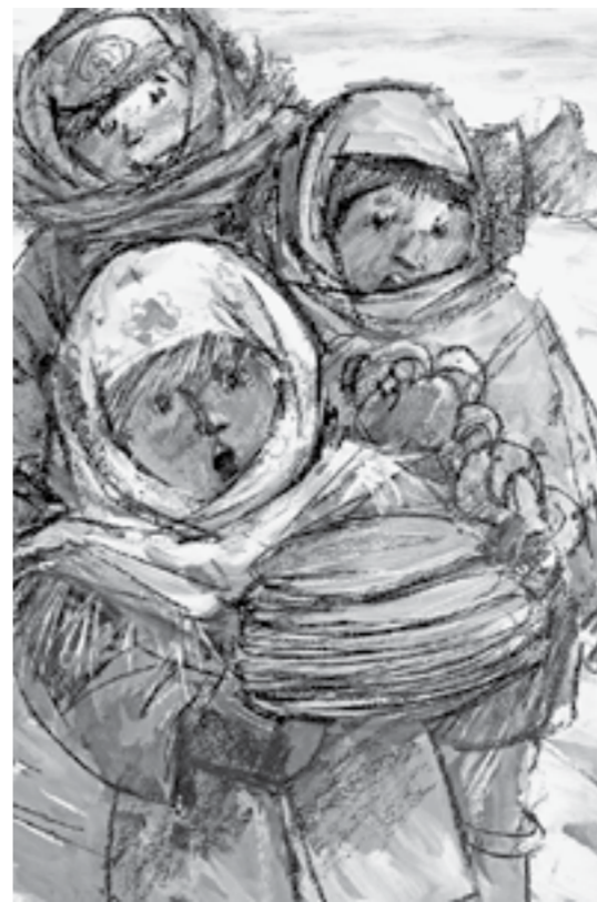
На выставке в Художественном музее представлены иллюстрации Виктора Хвостенко и рисунки, объединенные темой детства.