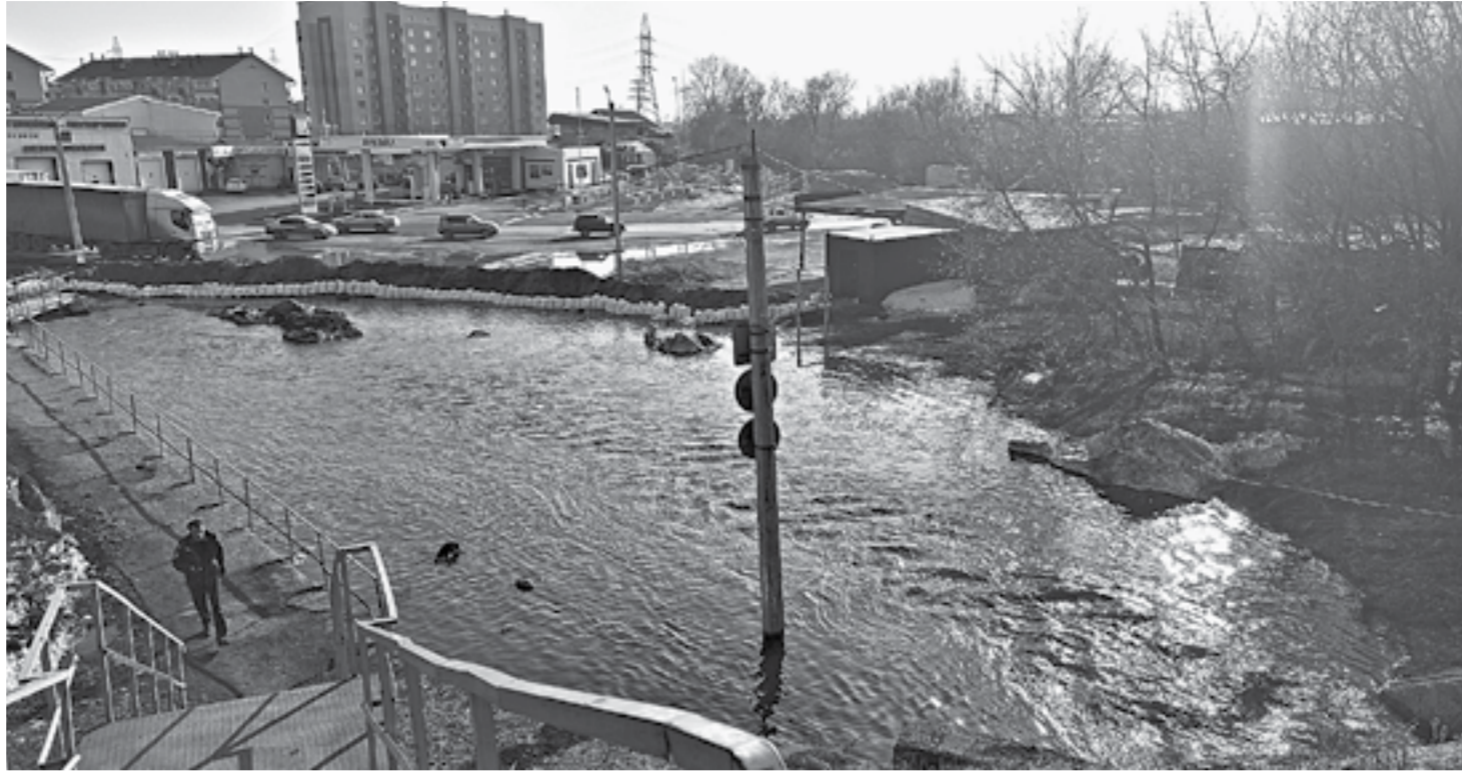
Весенняя сила «Голубого Дуная».

Автору этих строк довелось поучаствовать в подобной ак-