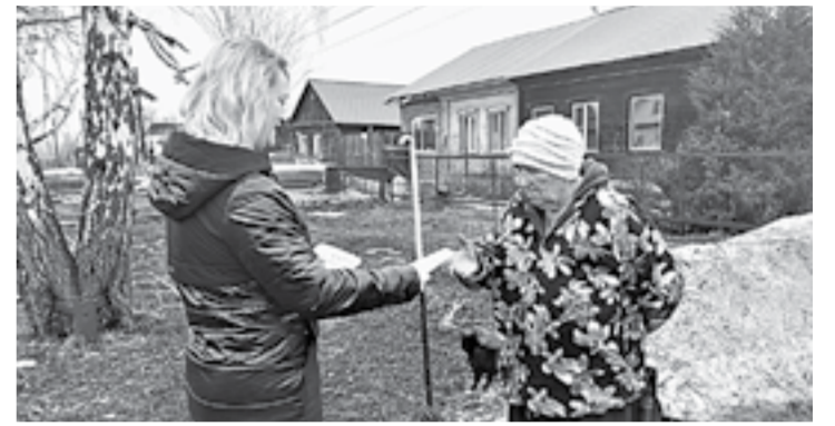
Более 1000 памятков раздали бийчанам специалисты управления по работе с населением.