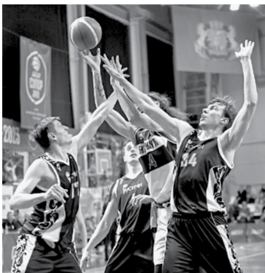
Барнаульские баскетболисты финишировали 13-ми в чемпионате Суперлиги.