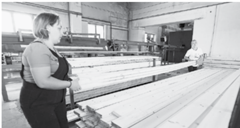
Теперь участники СВО и их семьи смогут получать льготную древесину.

Закон о том, что мобилизованные участники СВО или члены их семей теперь мо-