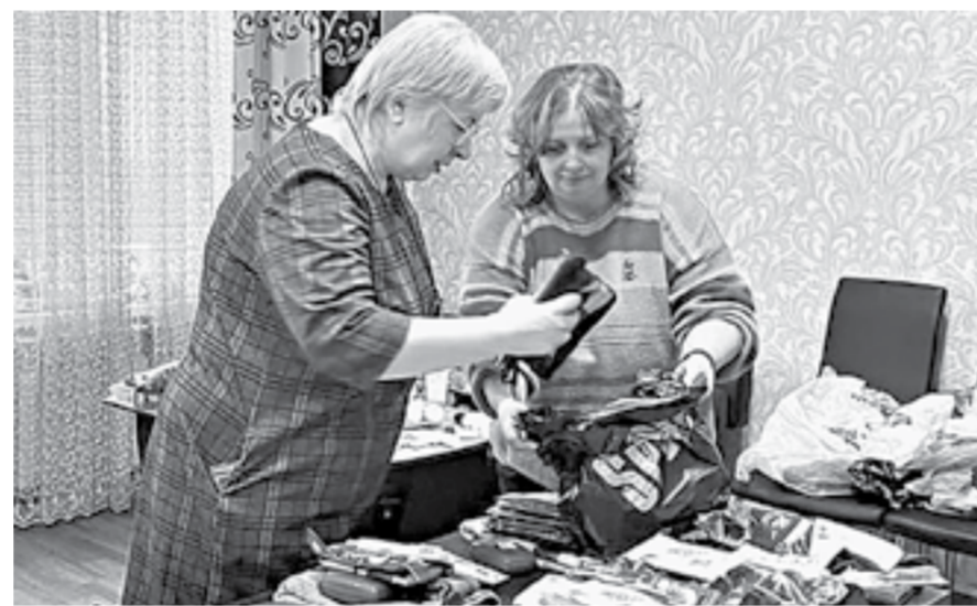
Сбор гуманитарных посылок в Бийске.

И март, и первая половина апреля для женсоветов края насыщены работой по сбору гуманитарной помощи для СВО. Хотя акции «Подарок солдату», а позже «Материнское тепло солдату» идут уже больше года.