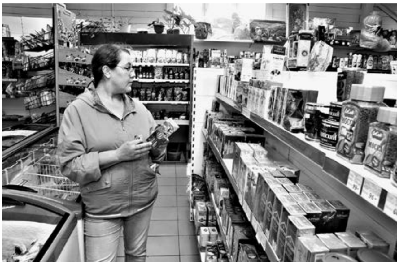
Сельская торговля – особая работа.

Но стоит напомнить, что современные цифровые услуги доступны только для 100 тысяч домохозяйств в сельской местности региона, то есть менее чем для трети. Поэтому онлайн-торговля с доставкой для села остается в определенной мере экзотикой.