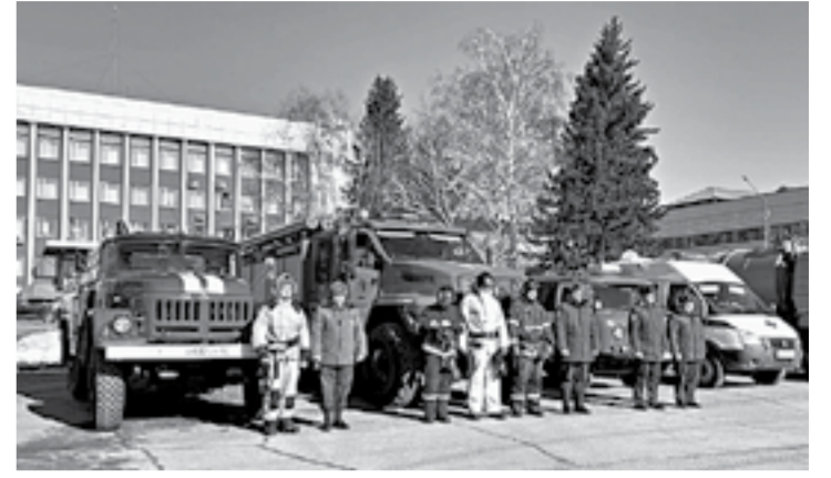
Спецтехника служб готова к борьбе с последствиями паводка.

Павел СИДОРЕНКО (фото автора и пресс-центра администрации города)