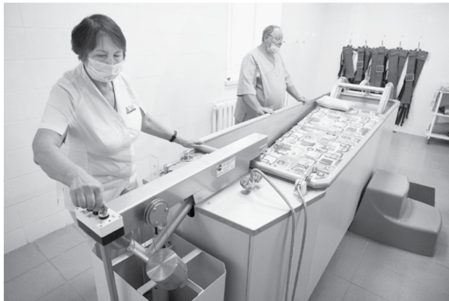
Белокуриха всегда славилась лечением радонем.