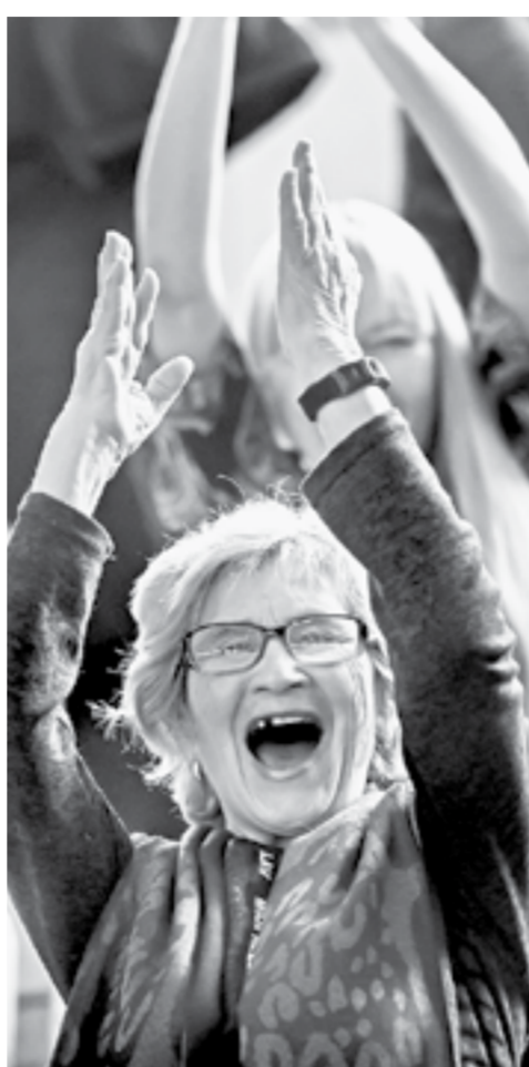
Неподдельные эмоции на трибуне.

– Для нас одно участие здесь – уже большая победа, – делился тренер с «АП». Ребя-