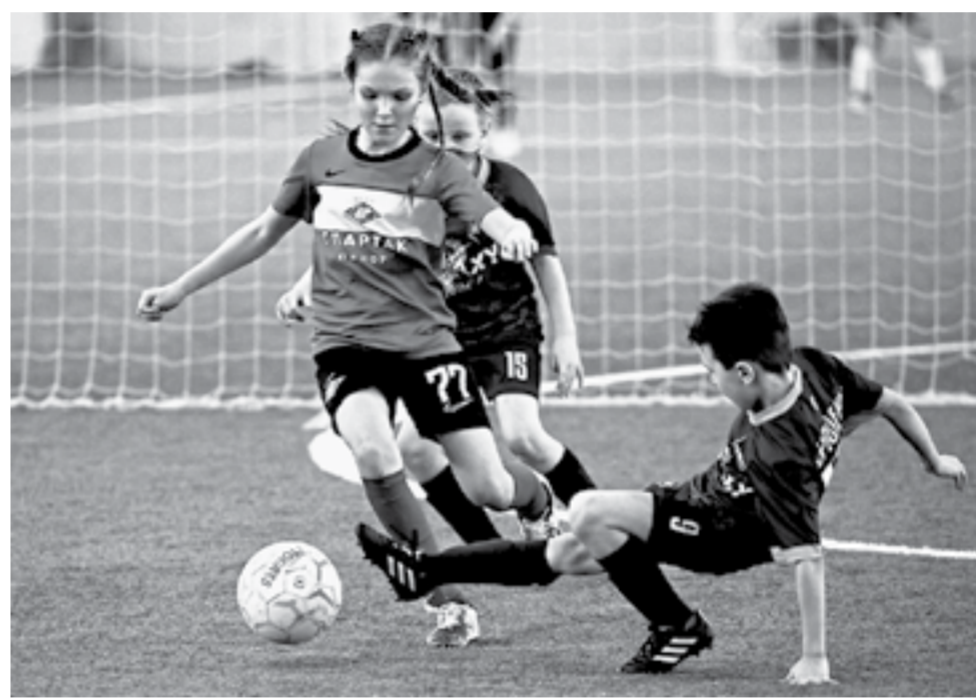
Лица Князева подкатов не боится.