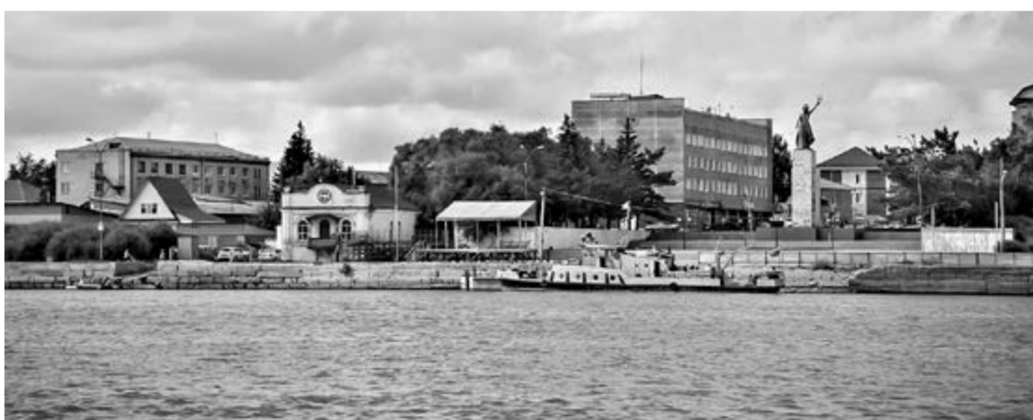
У жителей Каменского района остались вопросы к местной власти.

Бюджет остался социально ориентированным, хотя на содержание и функционирование социальной сферы денег в 2022