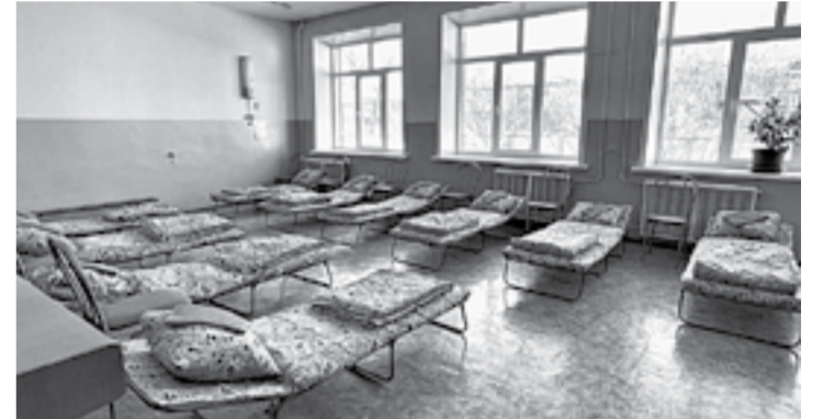
ПВР-3 в случае паводка сможет разместить 110 человек.