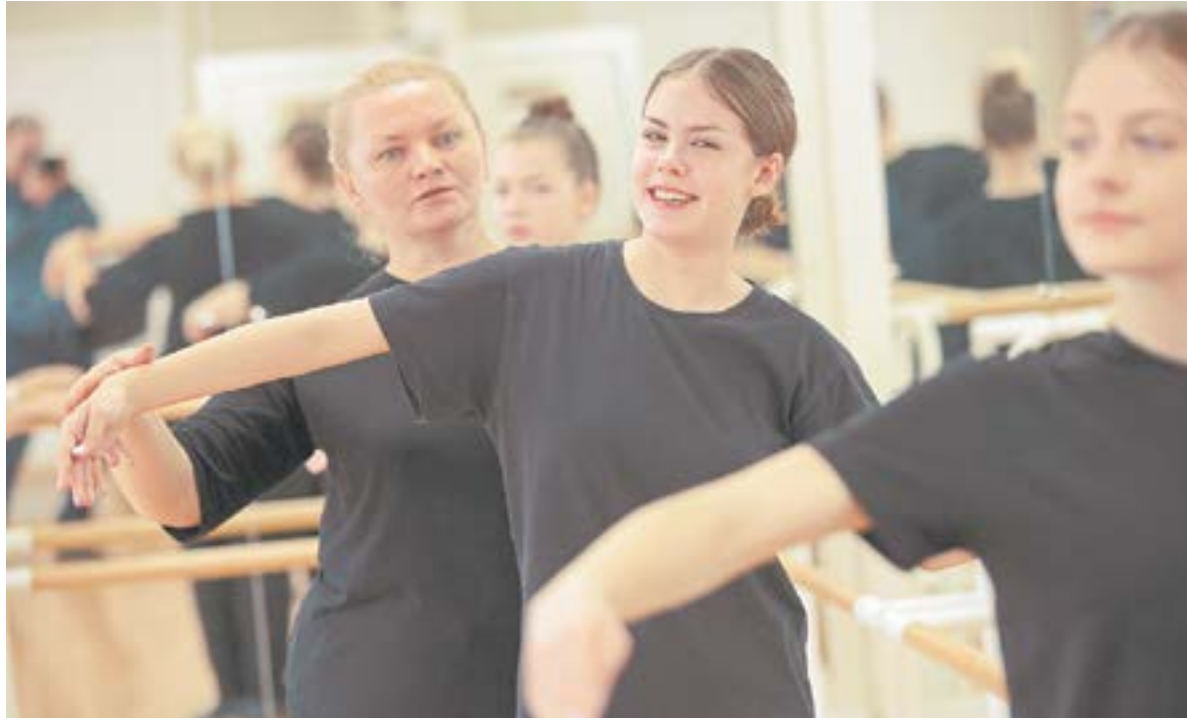
В зале хореографии.

Завьяловский район не единственный, где привели в поря-