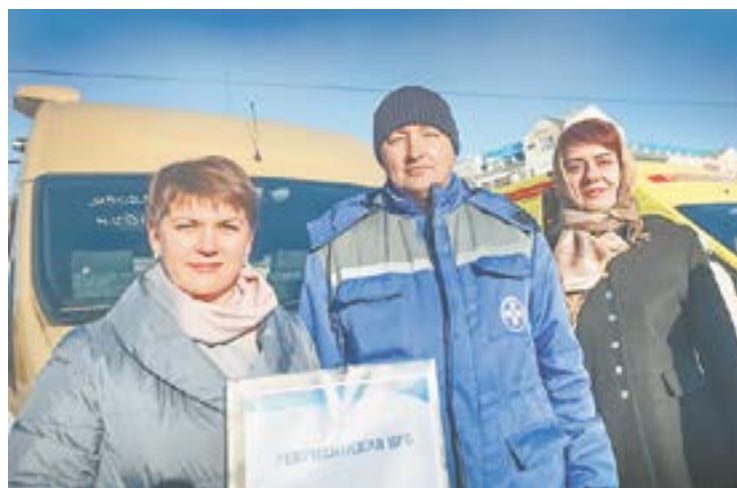
Ребрихинцы получили долгожданные машины скорой помощи.

В медучреждения Алтайского края отправились 48 новеньких автомобилей скорой помощи и 15 передвижных ФАП. Это самая крупная партия медицинского транспорта, поступившая в регион за последние годы, закупленная на средства федерального бюджета.