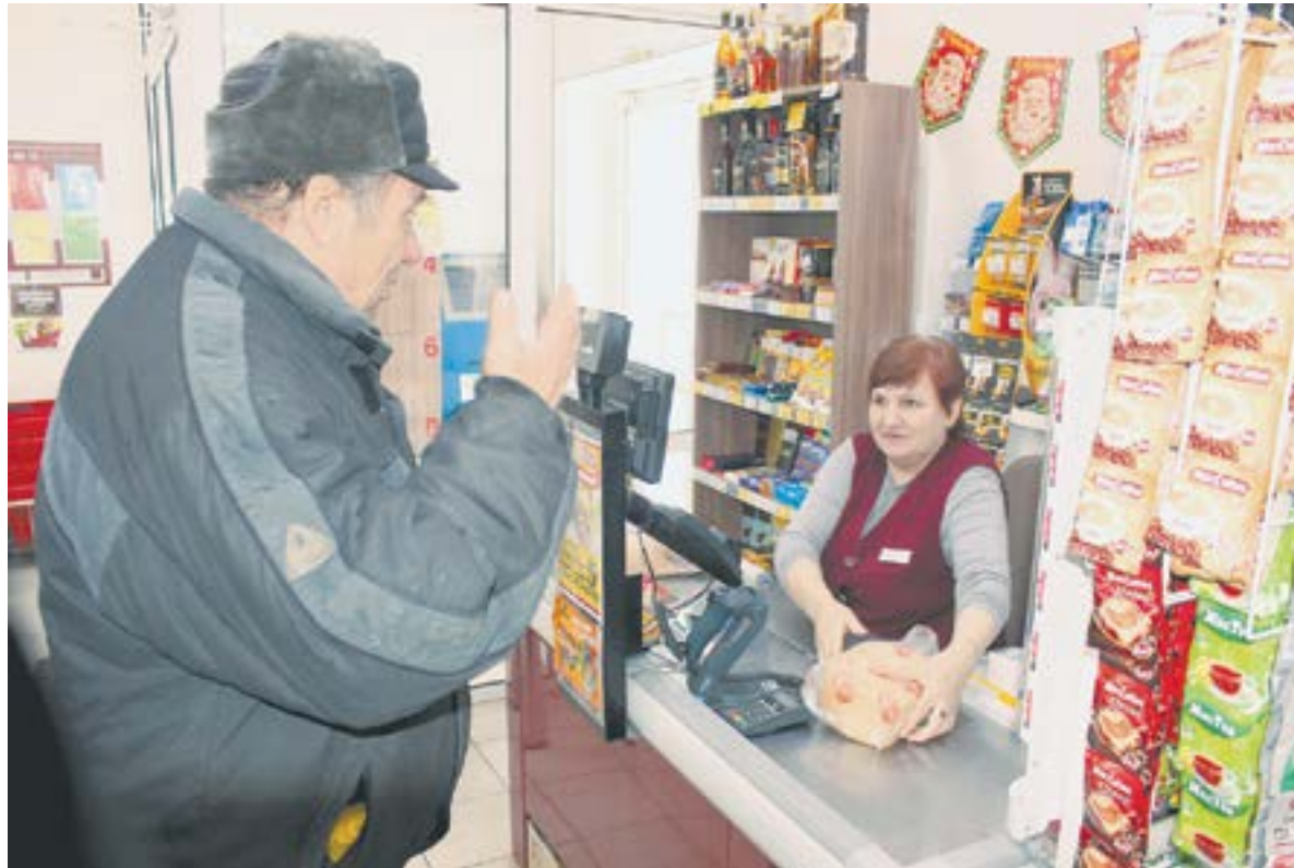
Разработчики поправок говорят, что стоимость патента для сельской торговли вырастет незначительно.

«Так, ИП заплатили в прошлом году за патенты около 500 млн рублей, примерно столько же получили обратно», – объясняет кра-