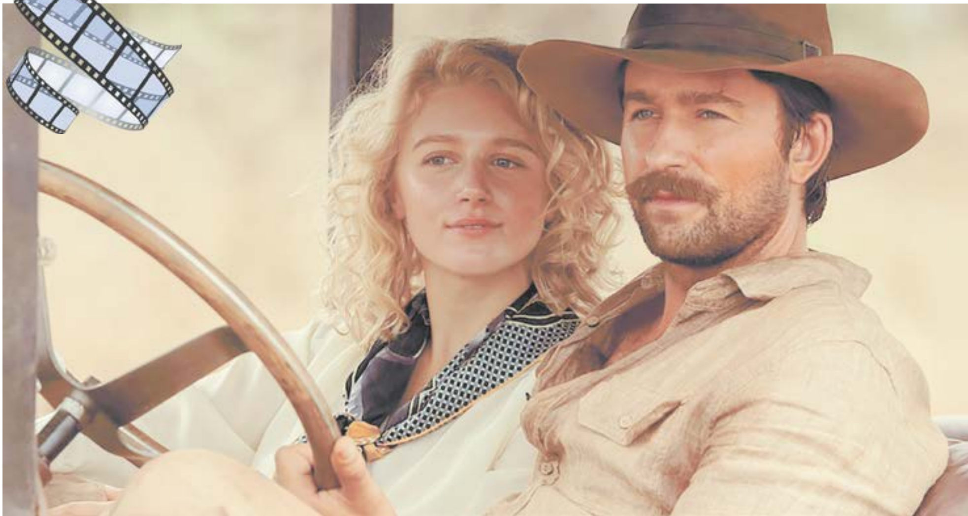
Спенсера и Александру судьба свела в Африке.