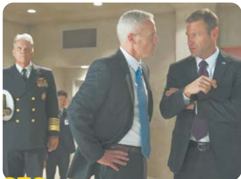
СТС 21.00 Х.ф. «Падение Олимпа» (16+)