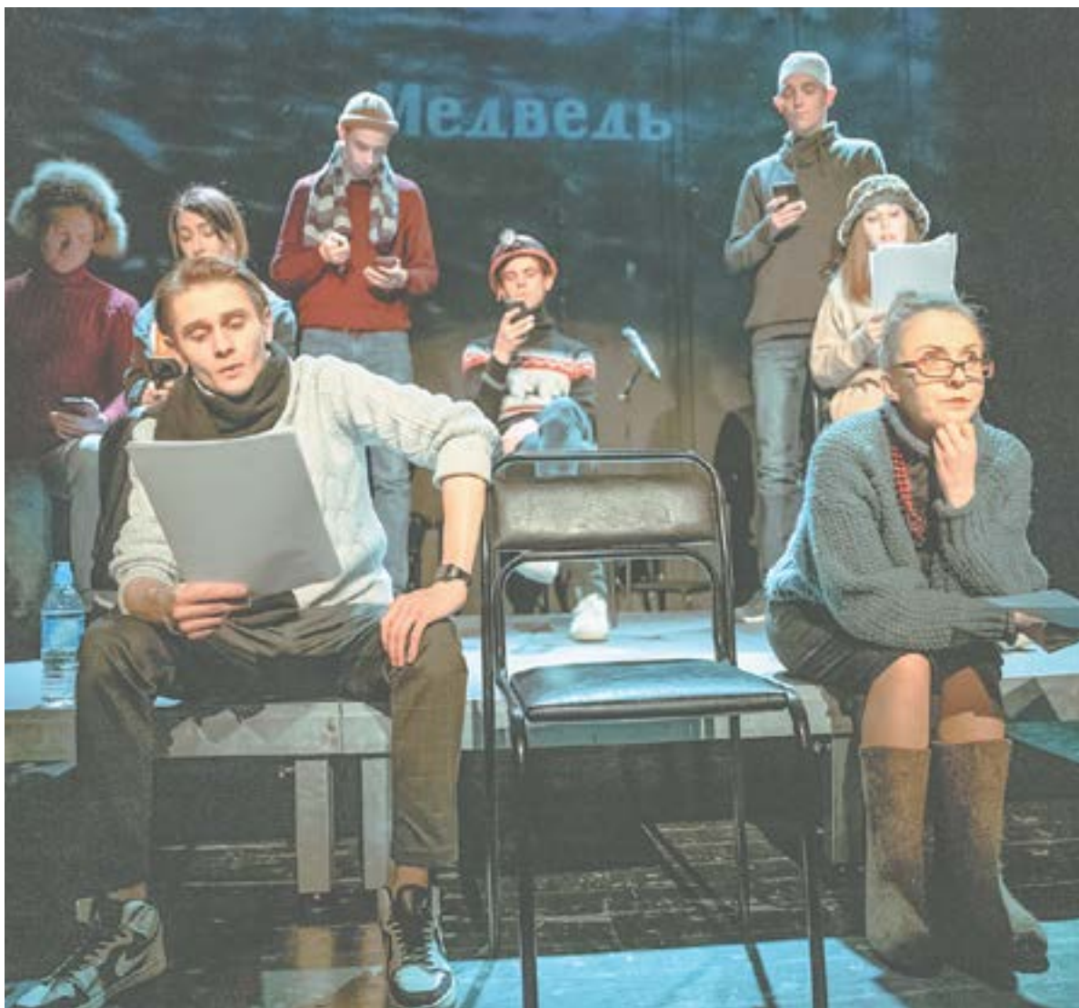
Артисты театра драмы на читке пьесы «Чёрная пурга» в феврале 2023-го.