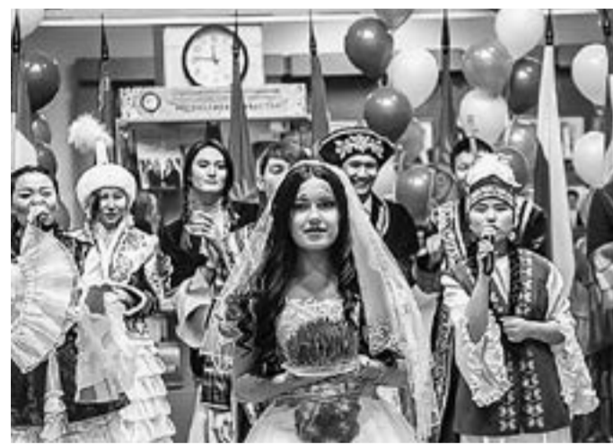
Официальное празднование длится с 21 по 23 марта.

Конец марта знаменует начало весеннего равноденствия. Для одних это астрономическое явление, а для других значит, что скоро Наурыз.