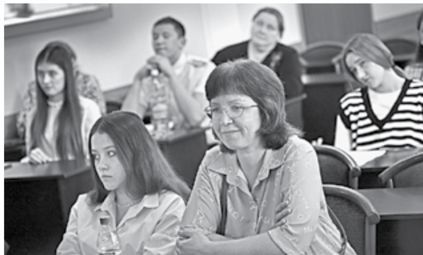
Из 68 заявленных работ к очной защите были допущены 20.