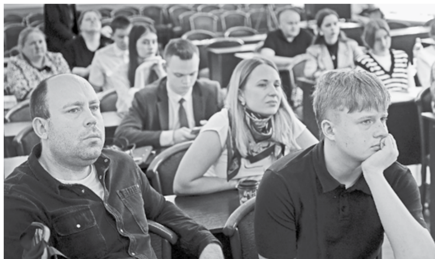
Рядом с участниками конкурса – их наставники.