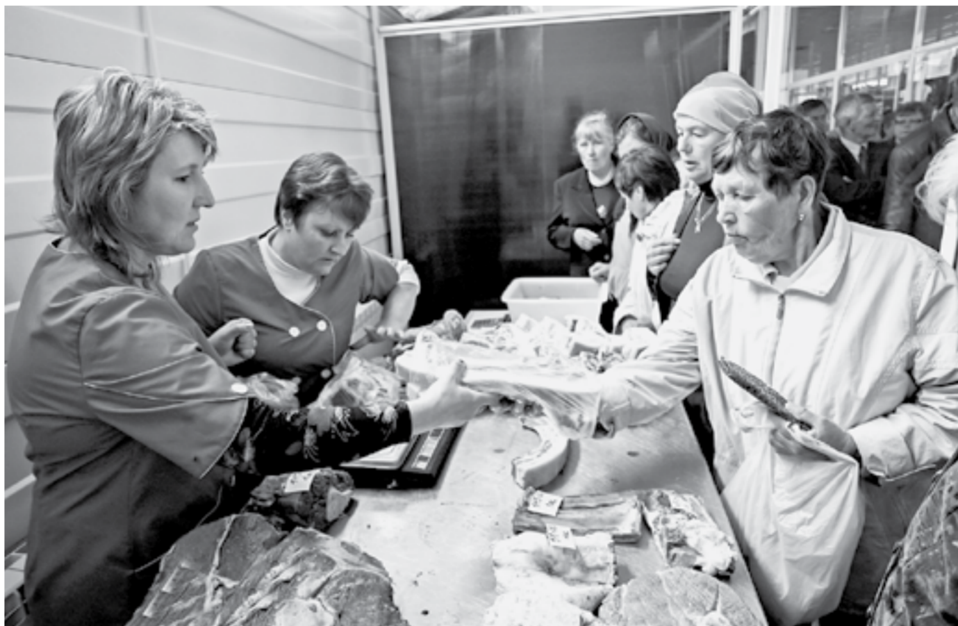
24% всех мелких и средних предпринимателей нашего рынка занимается торговлей.

В целом треть экономически активных жителей занята в сфере малого и среднего предпринимательства. И эта