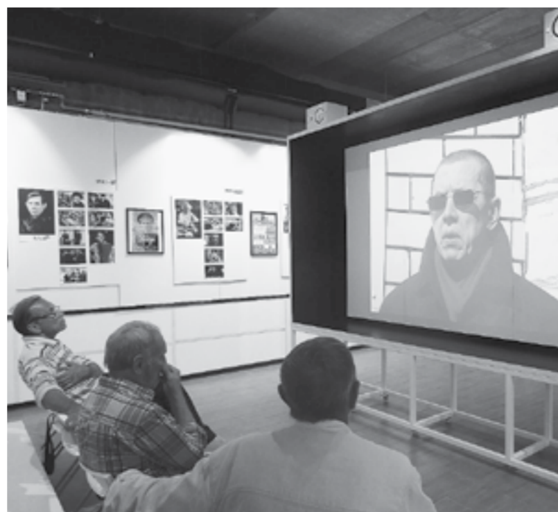
В Мемориальном музее Золотухина в Быстром Истоке.