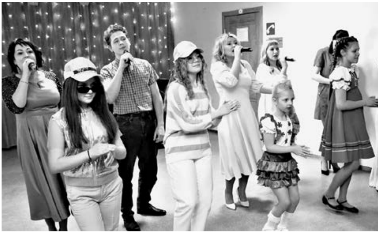
Артисты порадовали женщин прекрасным концертом.

Теплый, яркий и такой нужный праздник организовали женам мобилизованных каменцев сотрудники социальных служб, предприниматели и волонтеры. Женщин окружили заботой и вниманием, дарили песни, комплименты и цветы.