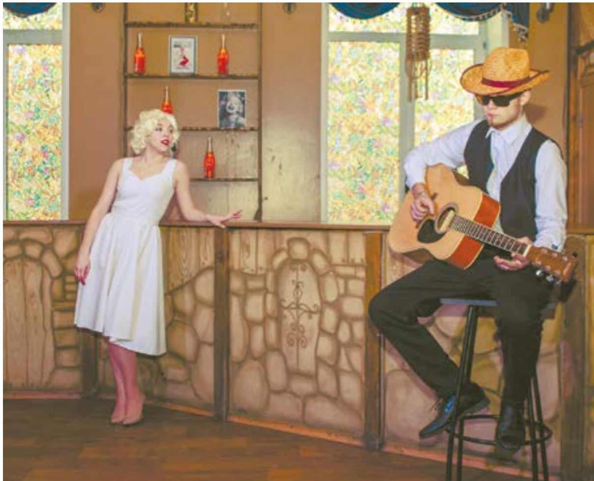
Действие спектакля происходит на всем пространстве Театра кукол.