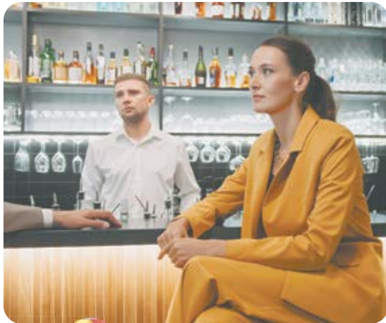
19.00 Х.ф. «ЖЕНИТЬ НЕЛЬЗЯ РАССОРИТЬ» (16+)

04.55 Т.с. «Москва. Три вокзала» (16+) 06.30 «Утро. Самое лучшее» (16+) 08.00 «Сегодня» 08.25 Т.с. «Морские дьяволы. Рубежи Родины» (16+) 10.00 «Сегодня» 10.35 Т.с. «Морские дьяволы. Рубежи Родины» (16+)