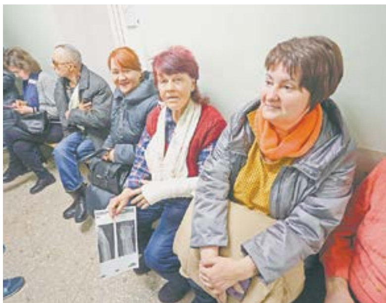
На прием в травмопункт.

– В тот день сплошной гололед был, даже на зебре. Когда свалилась, резко встать не стала, собралась с силами и как-то дошла до работы, потом вызвала мужа – и в травмопункт. Оказался перелом лучевой кости со смещением. Четыре недели буду ходить в гипсе! Потом еще руку разрабатывать. Я так надолго даже в отпуск никогда не уходила. Что теперь буду делать?левой рукой плохо орудую. Кое-как на-