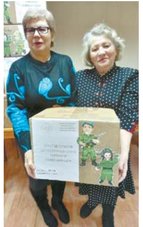
Поддержка участников СВО – одна из задач.

– Мы видим, как у нас люди отзывчивы, и они волнуются, стремятся успеть все сделать качественно, и у них тоже создается ситуация стресса, – сказала