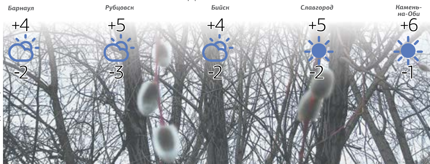
Фото Д. СТАРЦЕВА.