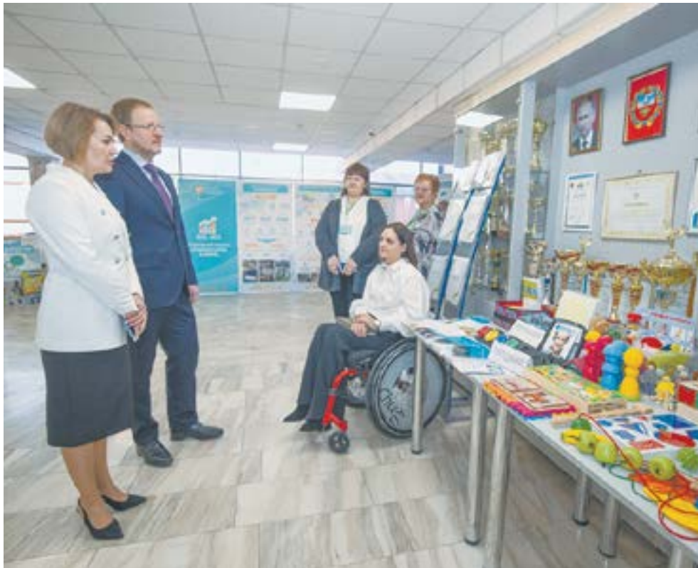
На коллегии в Минсоцзащиты подвели итоги за 5 лет.

Восемь из этих вновь поставленных задач связаны только со специальной военной операцией. В январе был утвержден комплекс мер по решению вопросов жизнеобеспечения ветеранов и инвалидов боевых действий, участников спецоперации и членов их семей. Все льготы и выплаты можно оформить и в соцзащите, и в МФЦ в режиме одного окна. Общий объем материальной помощи участникам СВО и членам их семей за год составил 1 млрд 184 млн рублей.