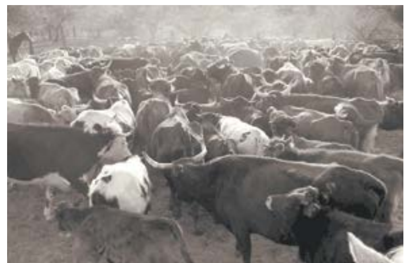
Героини труда спасли генофонд молочного КРС.