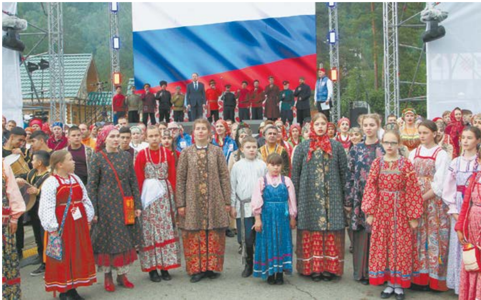
Алтай многоликий. Все вместе - сила!