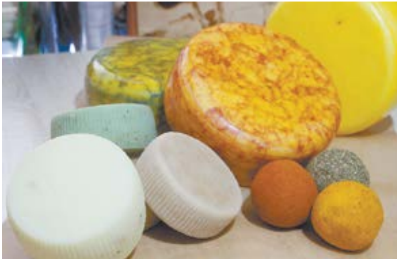
Образцы продукции семейной сыроварни.

Она со смехом вспоминает, как училась доить на первой своей козе Баранке. Настоящая это дери́за была, бойцовская, лягалась, пинаясь и кусалась, до слез доводила хозяйку. Та каждый раз тяжело вздыхала, когда подходило время дойки. Зато и характер закалила в преодолении трудностей, так что теперь мастерски управляется со стадом коз и даже уколы с прививками сама животным ставит, когда нужно.