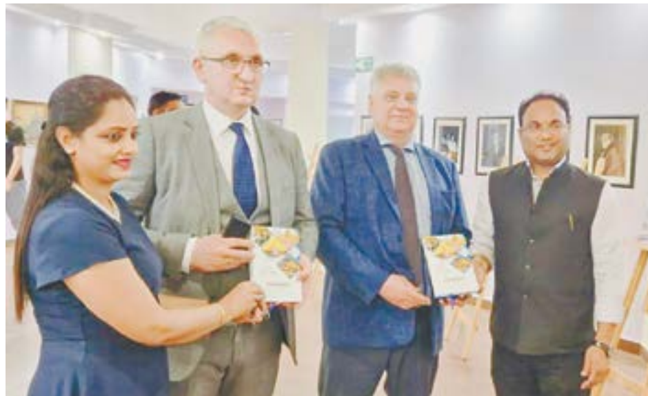
Встреча в Русском доме в Нью-Дели.

Развивать сотрудничество планируют и вузы Алтайского края и Индии. В городе Тривандрум, столице южноиндийского штата Керала, состоялась встреча руководителей АлтГУ, АГМУ, Академии гостеприимства с представителями Керальского государственного университета и других вузов Индии. Прошла презентация научно-образовательных проектов Алтайского края. Стороны обсудили со-