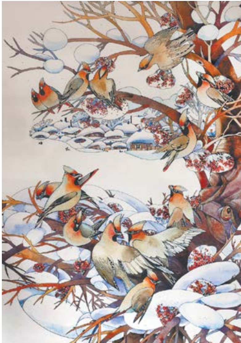
«Птичья симфония», 2022.