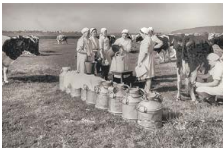
Летний выпас. 60-е.