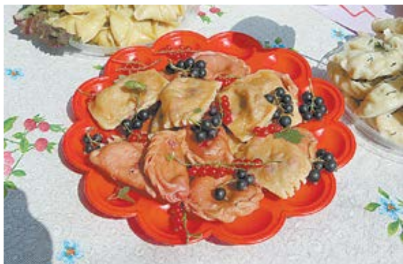
Вареники – блюдо сибирской кухни.