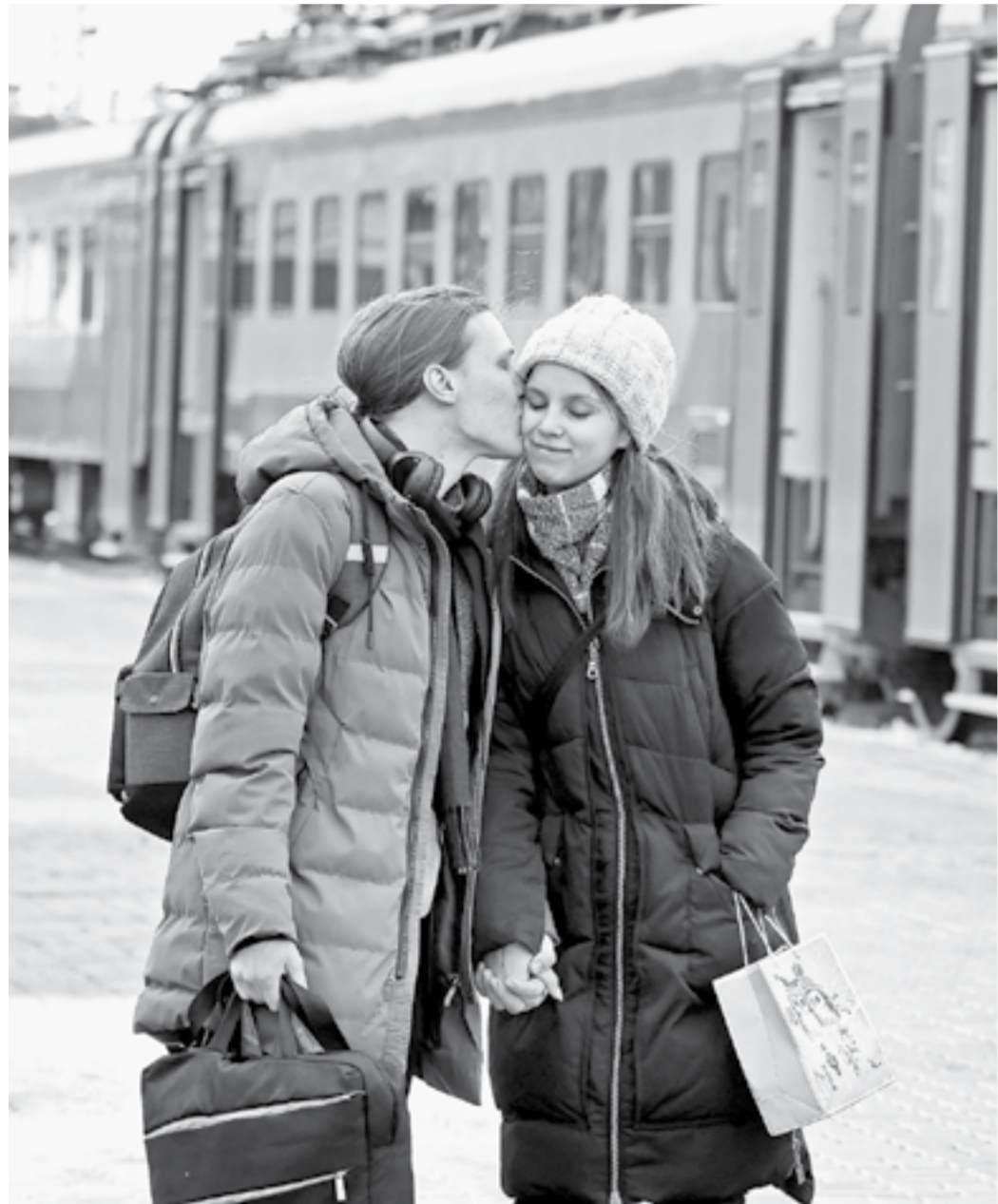
«До встречи, любимая!»