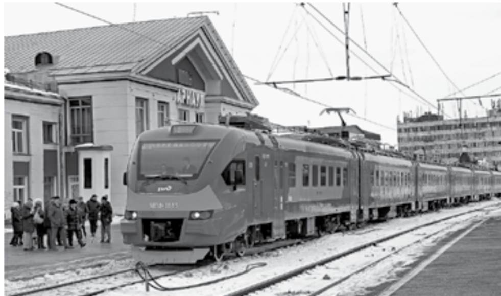
В составе – шесть комфортабельных вагонов.

Из Барнаула в Черепаново и обратно теперь можно доехать на новой электричке. В пятницу электропоезд серии ЭПЗД совершил свой первый рейс с пассажирами.