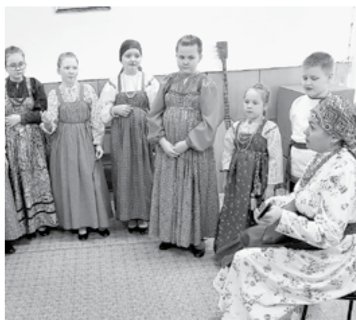
Фольклорный коллектив ждет окончания ремонта.

Глава региона Виктор Томенко в ходе поездки в Заринск посетил Детскую музыкальную школу № 2, чтобы провезти, как продвигается ее ремонт.