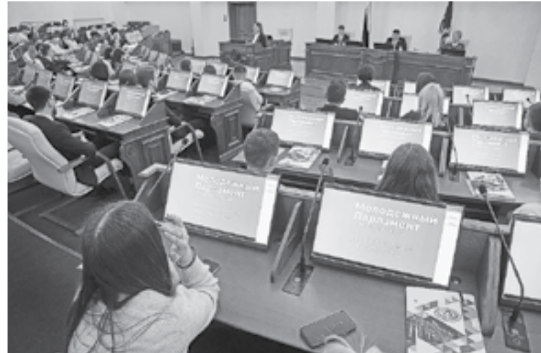
В торжестве приняли участие ребята из разных районов края.