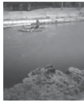
На улицах Бийска.

И если где-то погода бушевала, то где-то наступила настоящая оттепель. Так, 3 марта по соцсетям разлетелось видео, на котором бийчанин достал свою надувную лодку и отправился вилыв по городским улицам. Дело в том, что некоторые улицы наукограда стали походить на Венецию – лужи по колено растянулись на сотни метров. В такой ситуации поменять транспортное средство стало разумным, хоть и весьма комичным решением. По сообщению