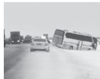
ДТП в Рубцовском районе.

нашего сибиряка в Бийске, воду с улицы незамедлительно откачали.