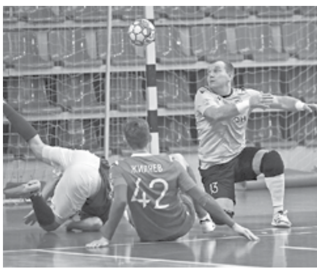
«АлтПолитех» выиграл все матчи чемпионата СФО и ДФО.

Пока «АлтПолитех» гонял мяч в краевой Суперлиге, его руководители размышляли о том, как быть дальше. Из существующих вариантов выбор был очевиден. – Изначально были мысли сыграть в Сибирской лиге, – продолжает президент команды. – Но пришло официальное письмо во Алтайскую краевую федерацию футбола о возрождении Первой лиги Сибири – и для меня, в общем, выбор уже не стоял. Сибирская лига – отличный турнир, но это неофициальный турнир, междусобойчик команд,