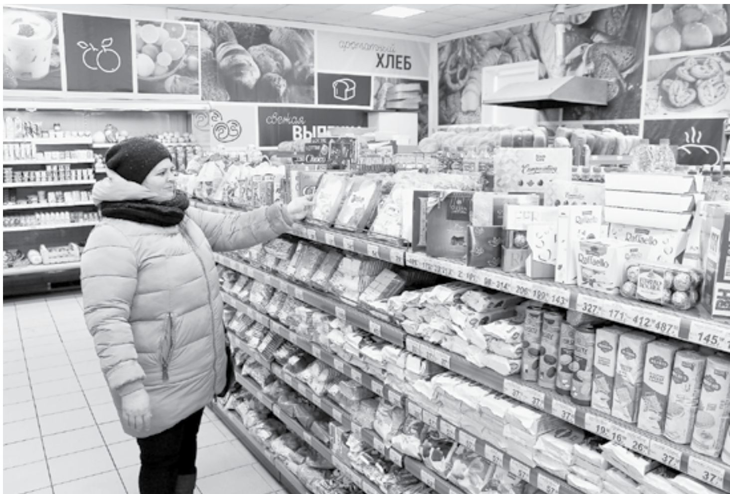
До 45% выросла доля россиян, которые тратят на еду больше половины своих доходов.