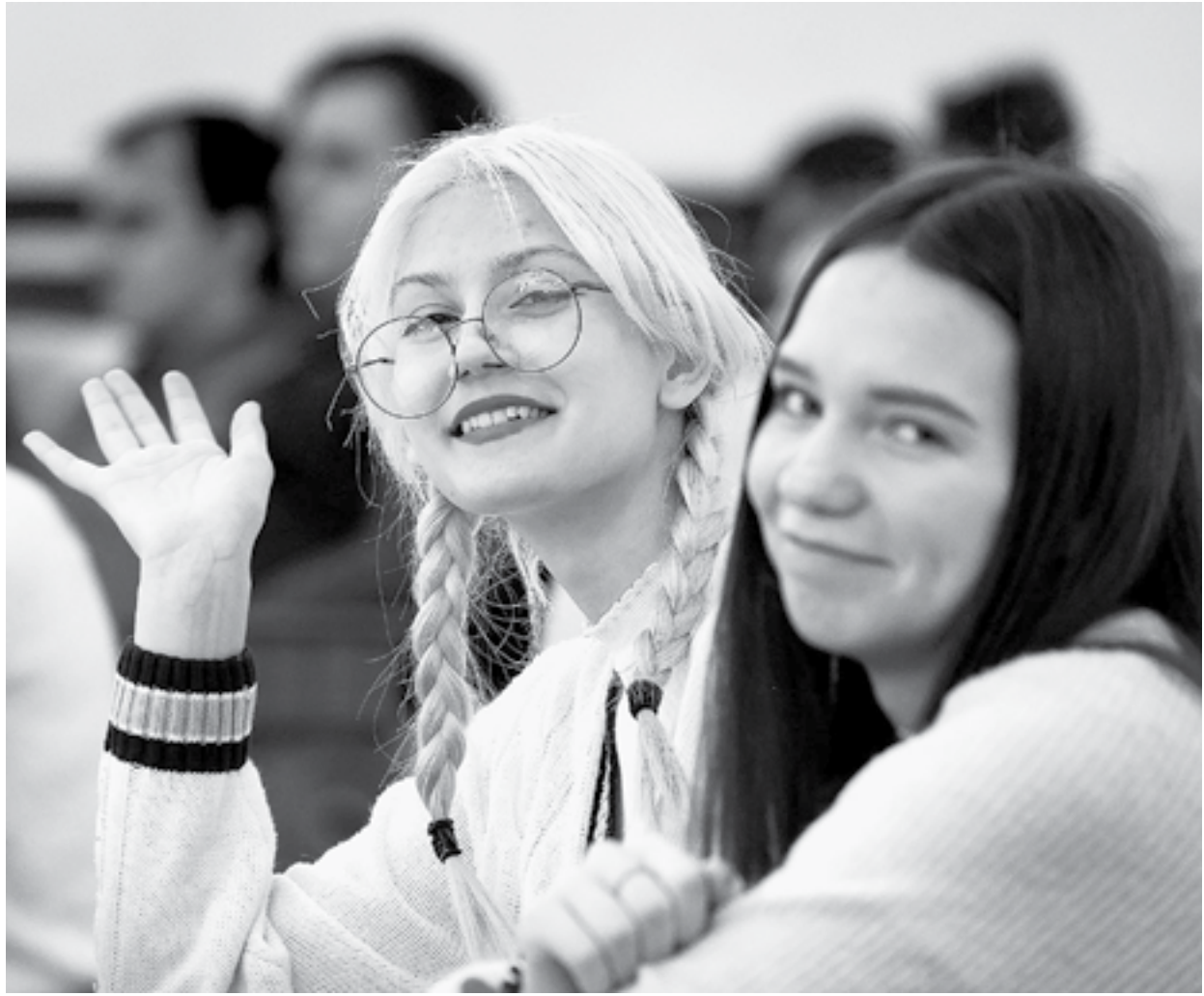
Сегодня – молодые избиратели, завтра – политики.

Конкурсы и викторины, лектории и круглые столы в рамках месячника молодого избирателя уже завершены. Их посетили около полумиллиона жителей края, от воспитанников детских садов до студентов. Итоги мероприятия подвели на заседании краевого Молодёжного парламента.