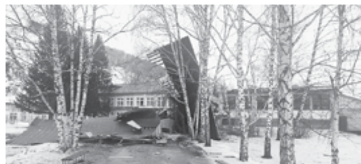
Со здания школы в с. Ая сорвало крышу.

Начало марта в Алтайском крае выдалось непростым. Погодные качели с потеплением по югу края до +10 градусов и ночными морозами до -10 градусов превратили регион в настоящий каток.