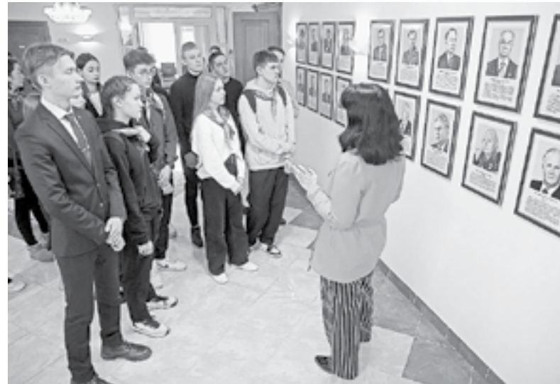
Для школьников провели экскурсию.