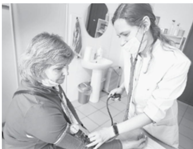
Больше 60 человек посетили медиков.