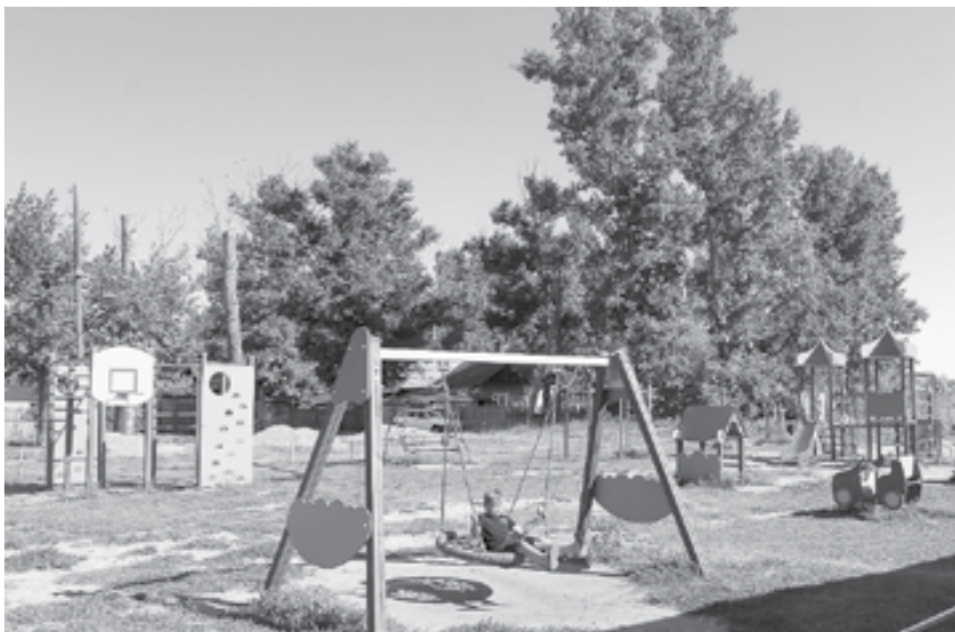
Такие детские площадки нужны сельским ребятишкам.

Традиционно одними из самых востребованных в сельской местности являются детские площадки.