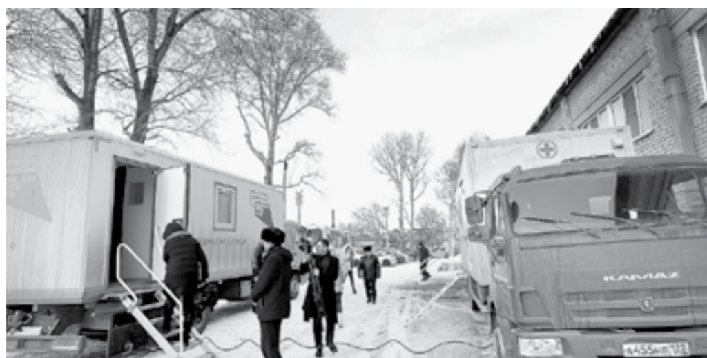
Помимо приема врачей в больнице работали передвижные пункты медицинской службы.

В Алтайском крае благодаря партийной акции «Медицинский десант» совет сторонников партии «Единая Россия» организовал автопоезд здоровья для обследования семей участников СВО.