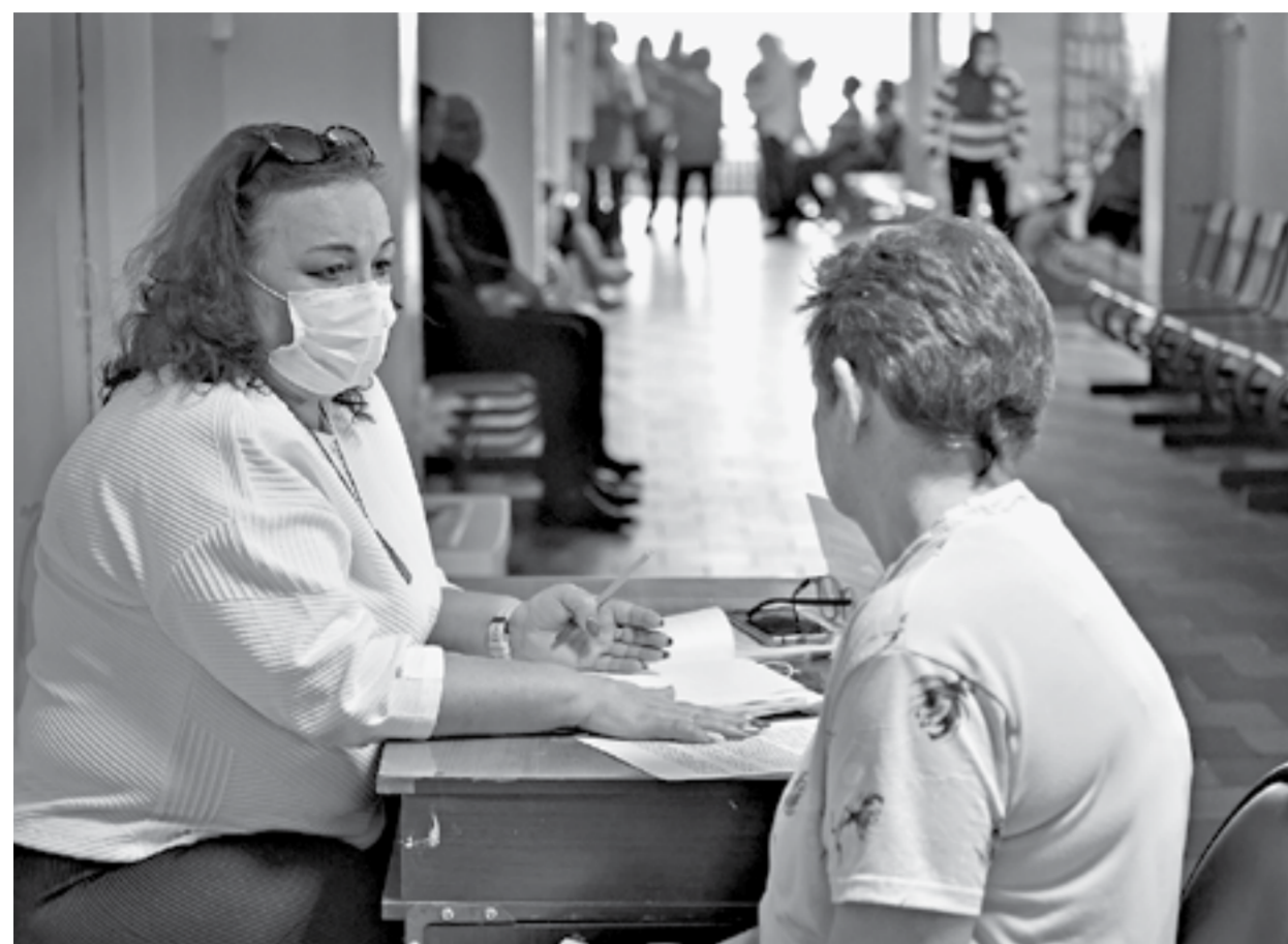
Чаще всего записывались на прием к неврологу и психологу.