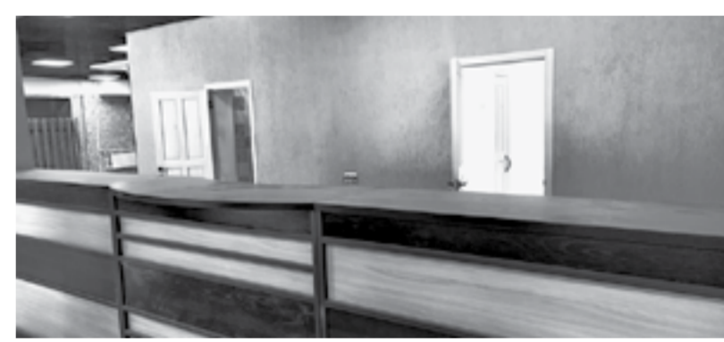
На ремонтные работы выделил деньги частный инвестор.

До 2015 года в Центральной бане работали и мужское, и женское отделения. Затем были введены мужские и женские дни, а чуть позже комплекс был закрыт на долгие годы.