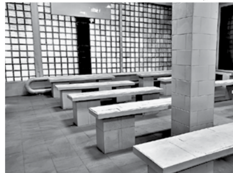
В бане № 1 сохранили мраморные скамейки в помывочных.

Очень хорошо обустроены холлы перед помывочной зоной: уложена напольная плитка, установлены новые шкафчики для одежды, скамейки, будут смонтированы