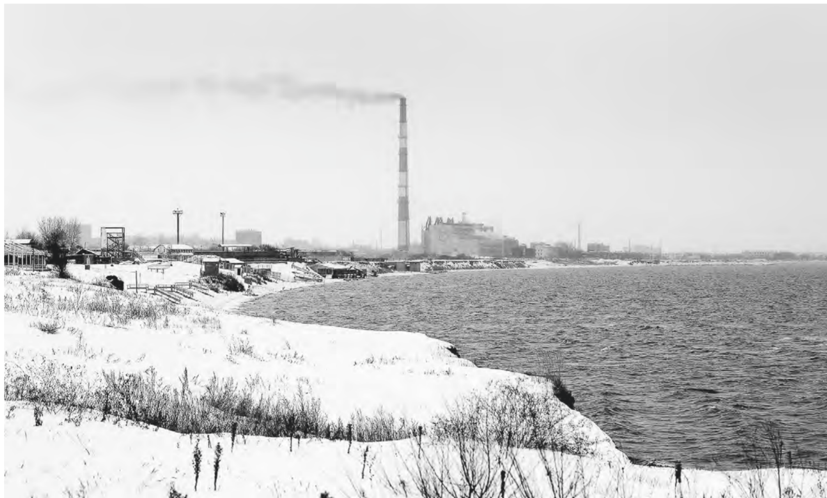
Очистные сооружения у озера Большого Ярового давно ждали реконструкции.