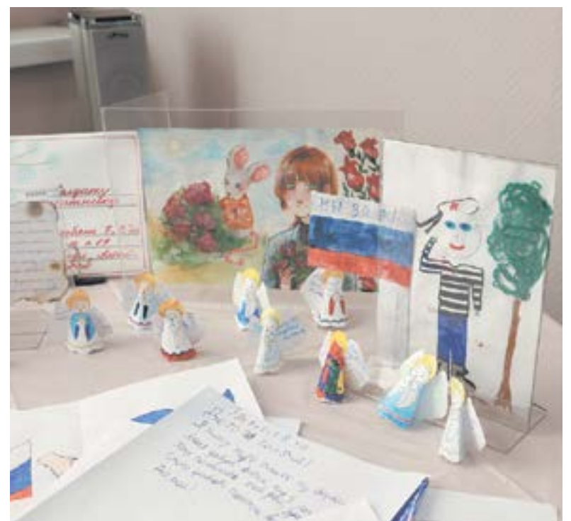
Детские письма и рисунки в поддержку солдат.

Выставка «Люди, защищающие людей. Росгвардия» в музее «Город» (ул. Льва Толстого, 24/пр. Ленина, 4) продлится до 26 февраля 2023 года. Будет работать в среду – воскресенье с 10.00 до 18.00; телефон для справок: 22-66-83.