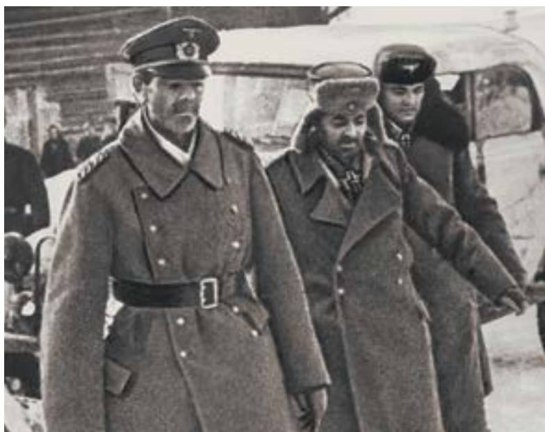
Фельдмаршал Паулюс и его генералы в плену.

перешли в контрнаступление из района Славянск – Краматорск. В итоге крупная группировка наших войск попала в котел, из которого пробиться немногие. Ситуация на южном направлении резко изменилась в пользу противника. Гитлеровцы неудержимо двигались на восток.