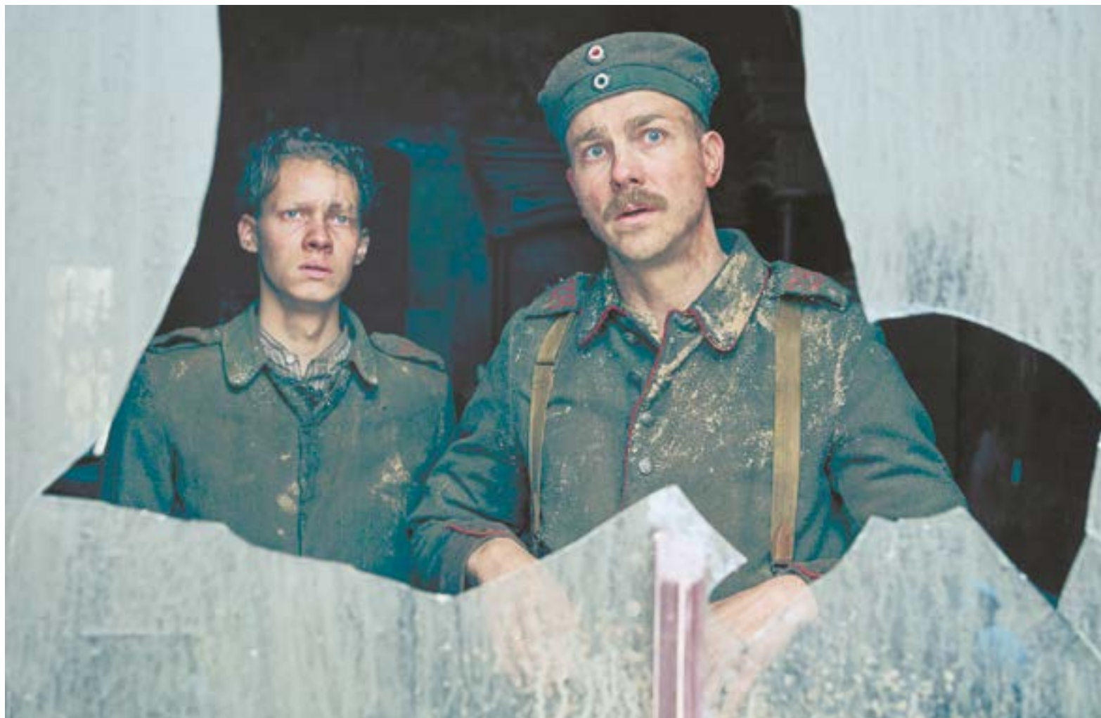
Пауль Боймер и старый служанка Станислав Катчинский теперь дошли почти до последних минут войны (кадр из фильма, вышедшего в Сети на платформе Нетфликс).

Первый фильм-экранизация «На Западном фронте без перемен» надолго занял почетное место в ряду известных фильмов на военную тему. Этому поспособствовало и то обстоятельство, что на самой первой церемонии вручения премии «Оскар» фильму дали две призовые статуэтки – в номинациях «Лучший фильм» и «Лучший режиссер». И, по версии Американского института кино, карти-