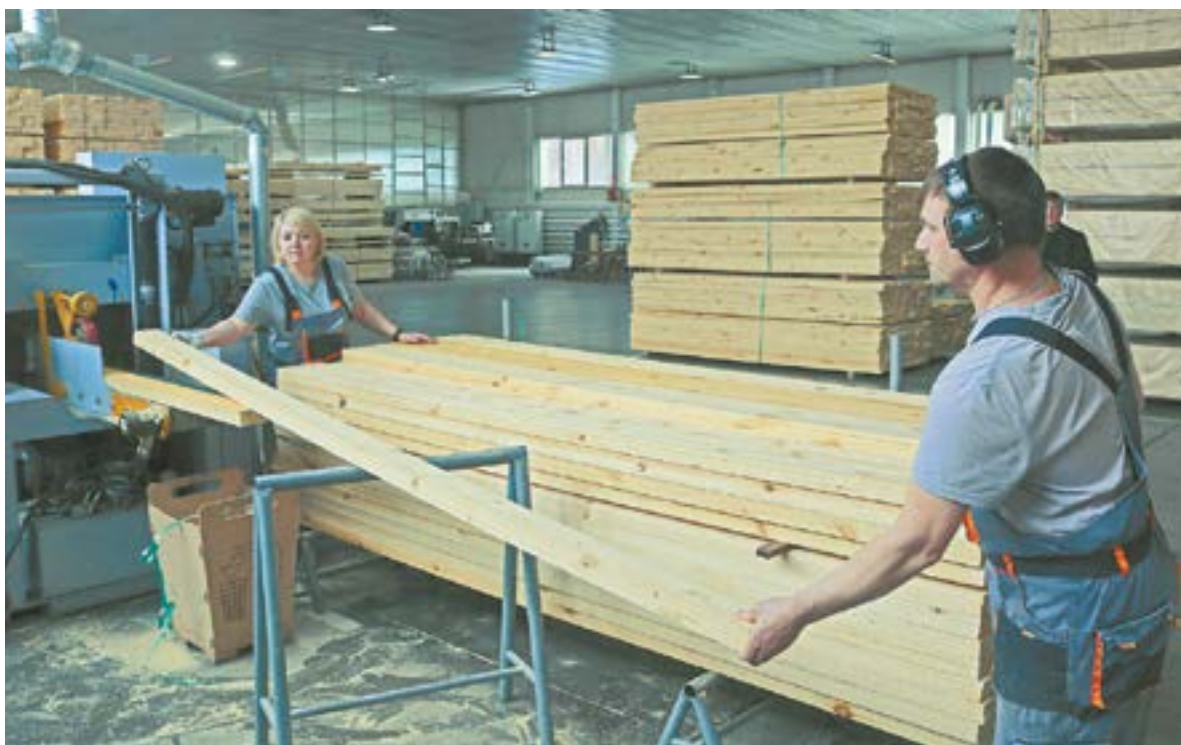
Производство погонажных изделий в цехе ООО «Содружество», входящем в ЛХК «Алтайлес».

Если в 2021 году ЛХК «Алтайлес» заключала большое количество контрактов на поставку оборудования и техники, то в прошлом пришлось много договоров расторгнуть. На фоне существенной инфляции мы столкнулись с необходимостью увеличения заработной платы своим сотрудникам сверх планируемого в начале года уровня. Мы по-прежнему сильно отстаем от других регионов. И задача субъектов предпринимательства эту дистанцию сокращать. Поэтому требуются создавать высокопроизводительные рабочие места, которые дают возможность людям, с одной стороны, получать достойную зарплату, с другой – прибыль предприятию.