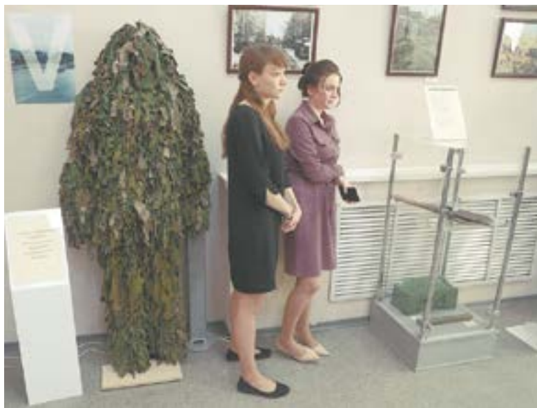
Экспозиция не оставляет равнодушным.