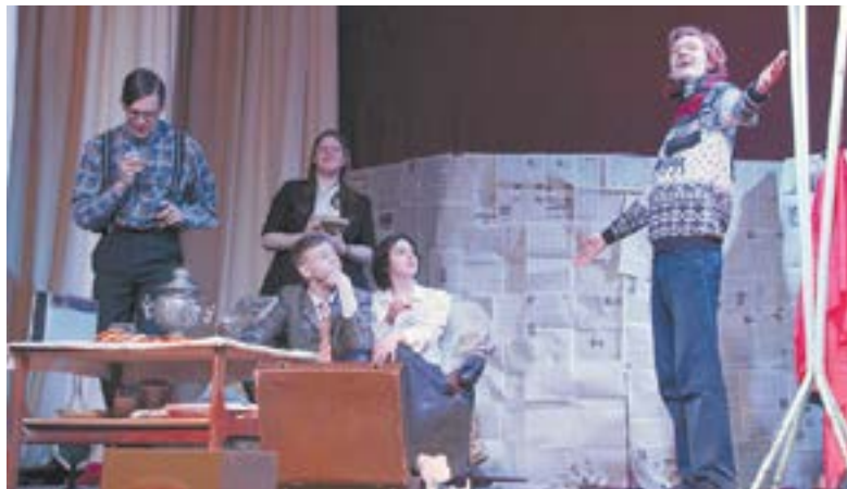
Молодость – это экспрессия!