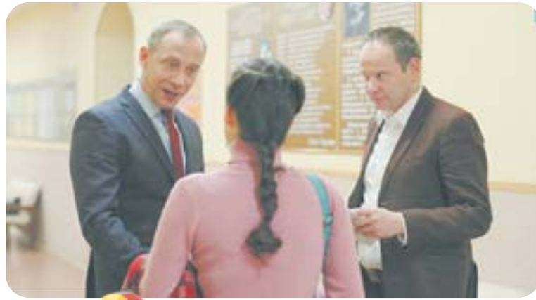
Х.ф. «Чужие и близкие» (16+)