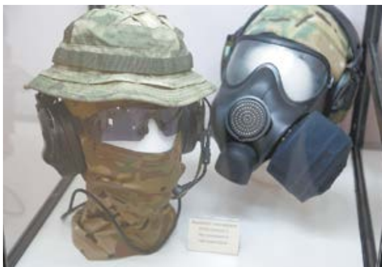
Варианты экипировки с наушниками и противогазом.

Выставка «Люди, защищающие людей. Росгвардия» в музее «Город» (ул. Льва Толстого, 24/пр. Ленина, 4) продлится до 26 февраля 2023 года. Будет работать в среду – воскресенье с 10.00 до 18.00; телефон для справок: 22-66-83.