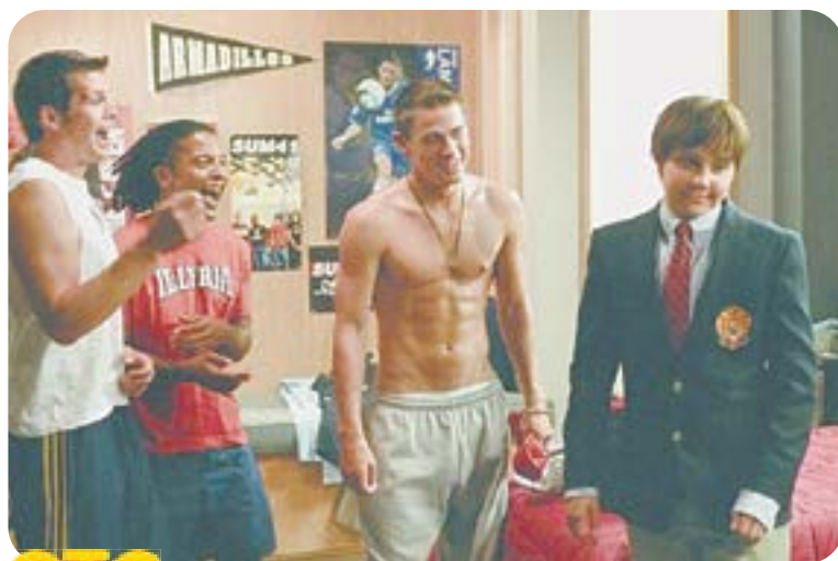
СТС 10.55 Х.ф. «Она - мужчина» (12+)

04.50 Т.с. «Стажеры» (16+) 06.35 «Центральное телевидение» (16+) 08.00 «Сегодня» 08.20 «У нас выигрывают!» (12+) 10.00 «Сегодня» 10.20 «Первая передача» (16+) 11.00 «Чудо техники» (12+) 11.55 «Дачный ответ» (0+) 13.00 «НашПотребНадзор» (16+) 14.05 «Однажды...» (16+) 15.00 «Своя игра» (0+) 16.00 «Сегодня» 16.20 «Человек в праве» с Андреем Куницыным (16+) 17.00 «Следствие вели...» (16+) 18.00 «Новые русские сенсации» (16+) 19.00 «Итоги недели» с Ирадой Зейналовой 20.20 «Маска». Новый сезон (12+) 23.30 «Звезды сошлись» (16+) 01.15 Т.с. «Невский» (16+) 02.35 Т.с. «Невский. Проверка на прочность» (16+)