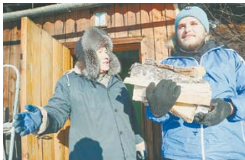
...и дров натаскали.

кто-нибудь из сегодняшних ребят в будущем решит приехать к нам! Такие талантливые, по-хорошему въедливые!