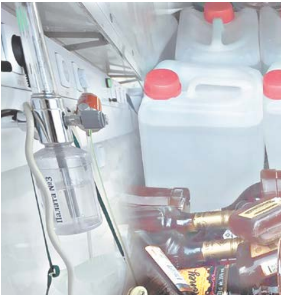
Коллаж О. ТАРАСОВОЙ.

Через два часа женщина вновь позвонила супругу и узнала, что он до дома так и не дошел, ему стало еще хуже: трудно дышать, не может идти, потому что плохо видит. Встревожившись, она поехала с рабо-