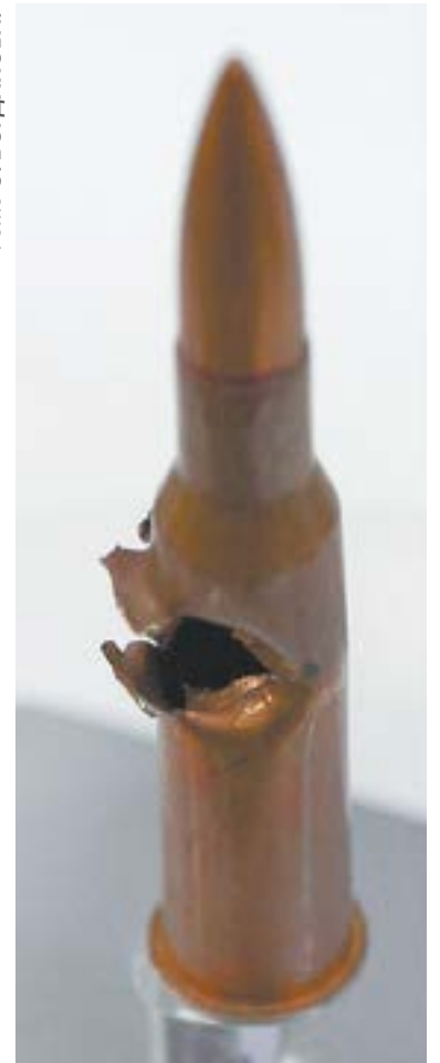
Патрон от снайперской винтовки.