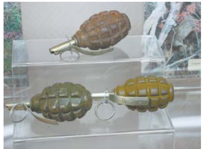
Образцы взрывных устройств.