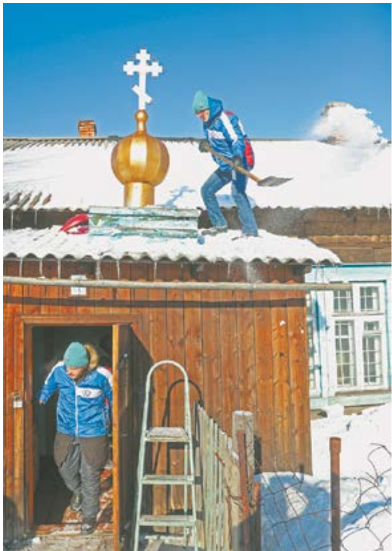
Студенты и снег скидали...