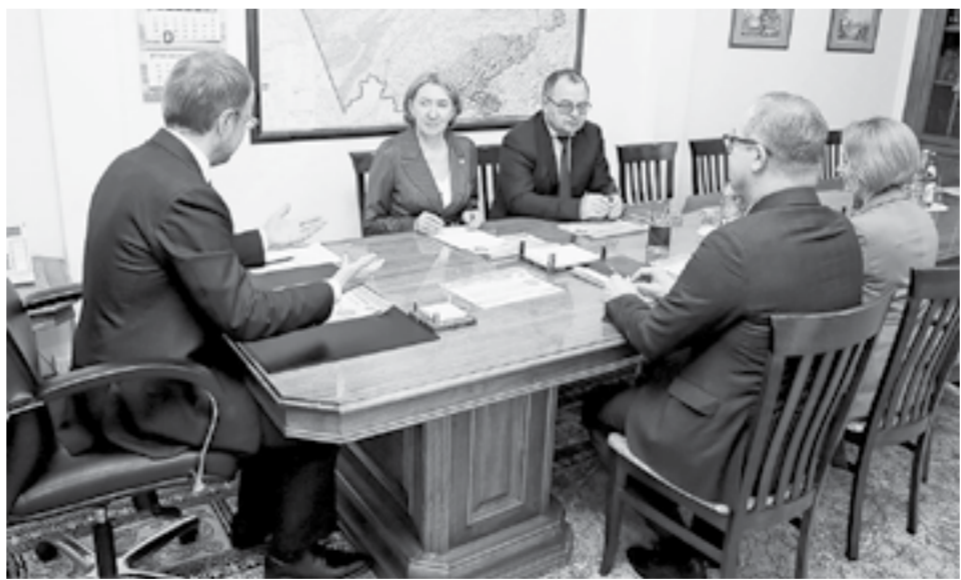
Губернатор провел рабочую встречу с новым руководителем Социального фонда.