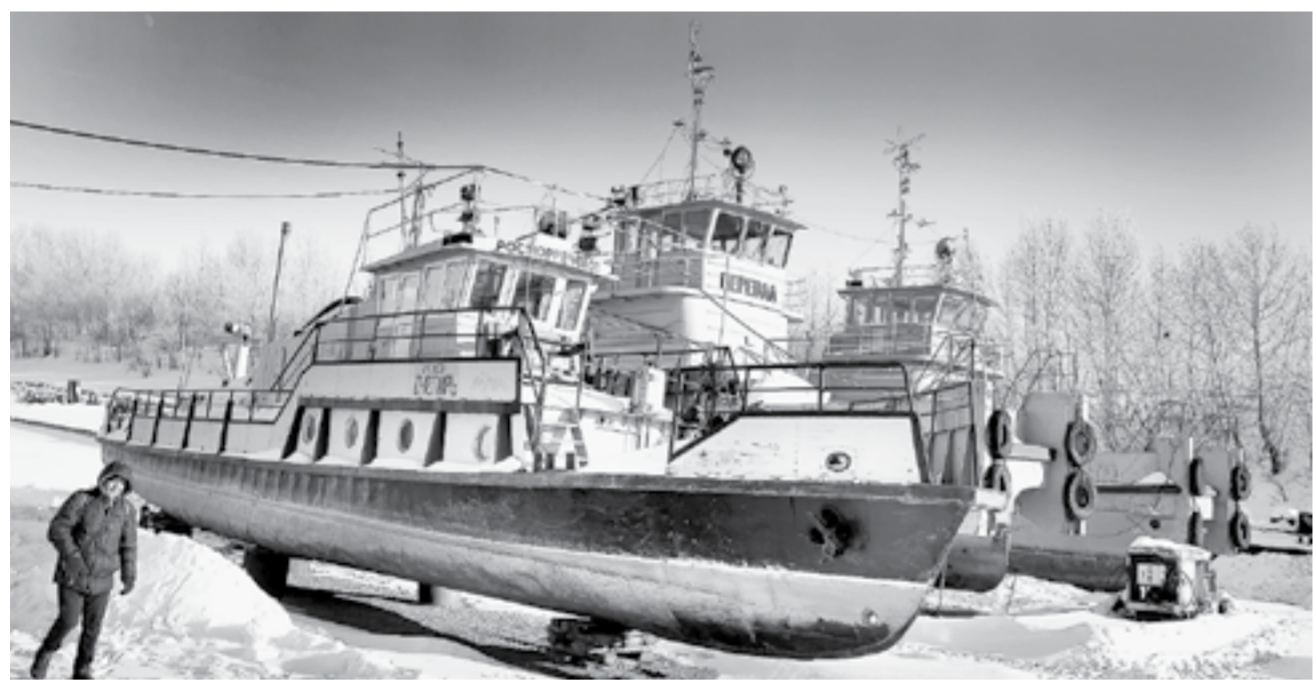
Ремонтируют и большие земснаряды, и малые катера типа «Снегирь» и «Переваль».