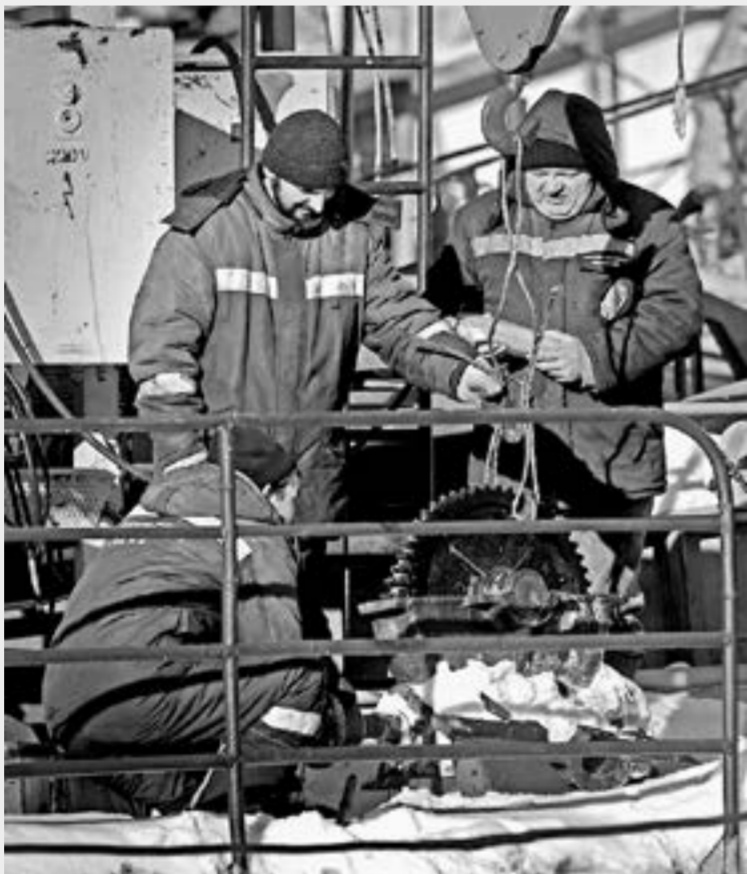
Открытие навигации запланировано на 26 апреля. Она продлится более полугода, до ноября.

– Подписанное трехстороннее соглашение рассчитано до 2023 года, но мы планируем его продлить, – рассказывает начальник Барнаульского района водных путей и судоход-