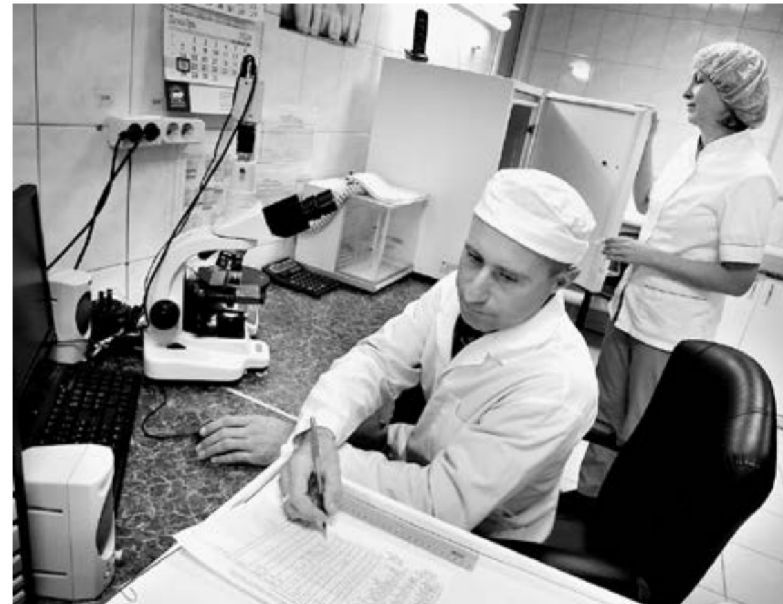
Оснащение ветлабораторий края позволяет им выполнять весь комплекс работ в рамках аккредитации.