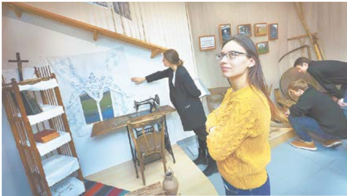
В музее много интересных экспонатов.