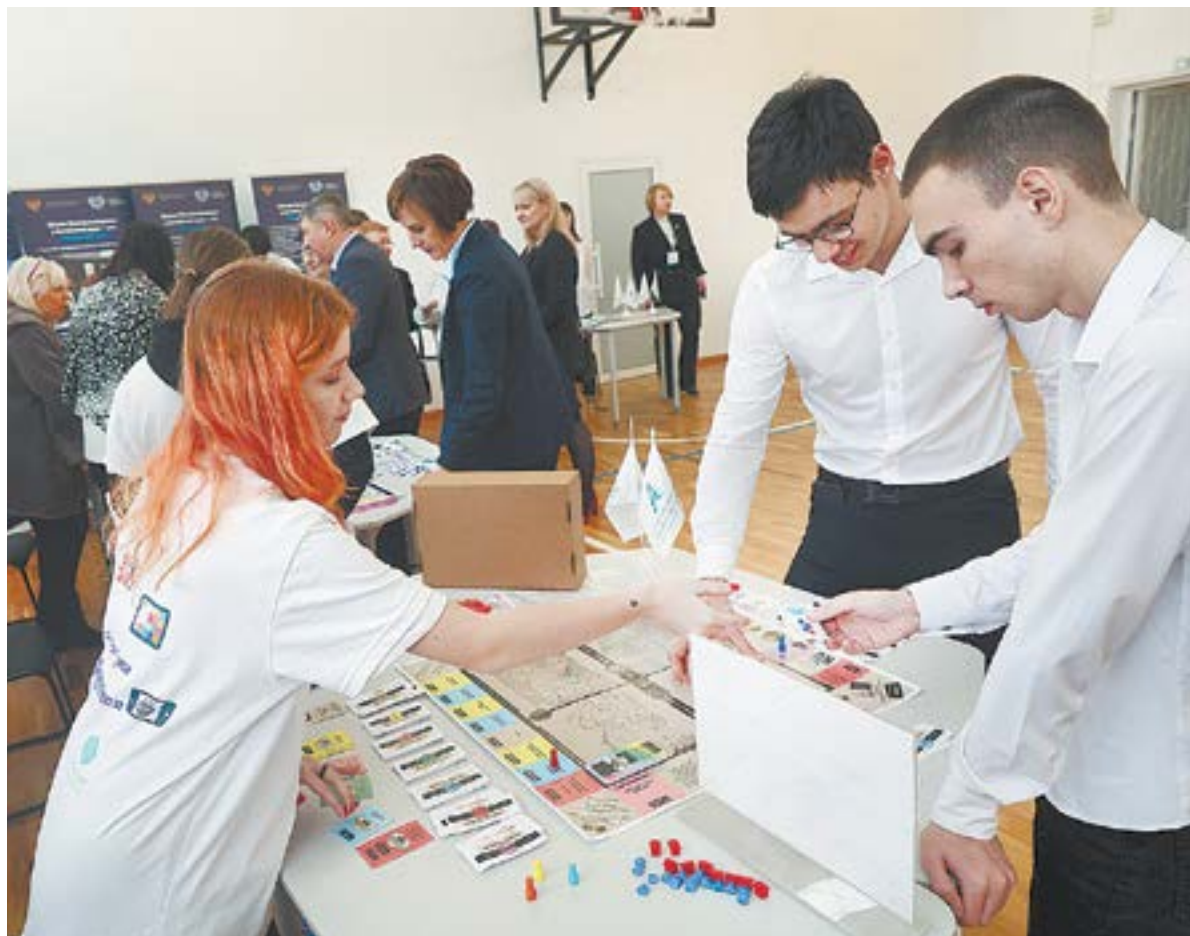
В АГГПУ открылась выставка достижений разных факультетов вуза.