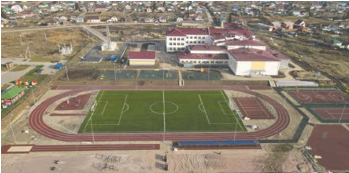
Тальменская школа № 3, вид с квадрокоптера.

– В конце года вы приняли бюджет на 2023 год. Каков он по