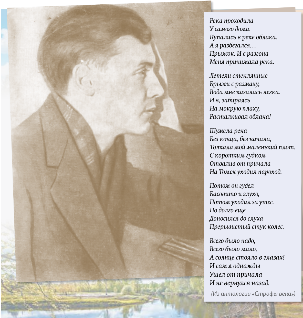
Кругом – зеро