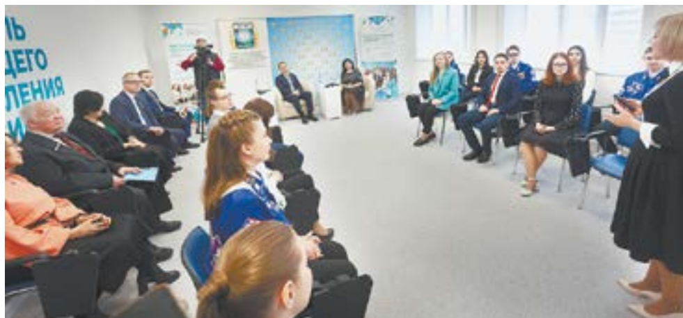
Главе региона представили проект «Центр педагогического наставничества».