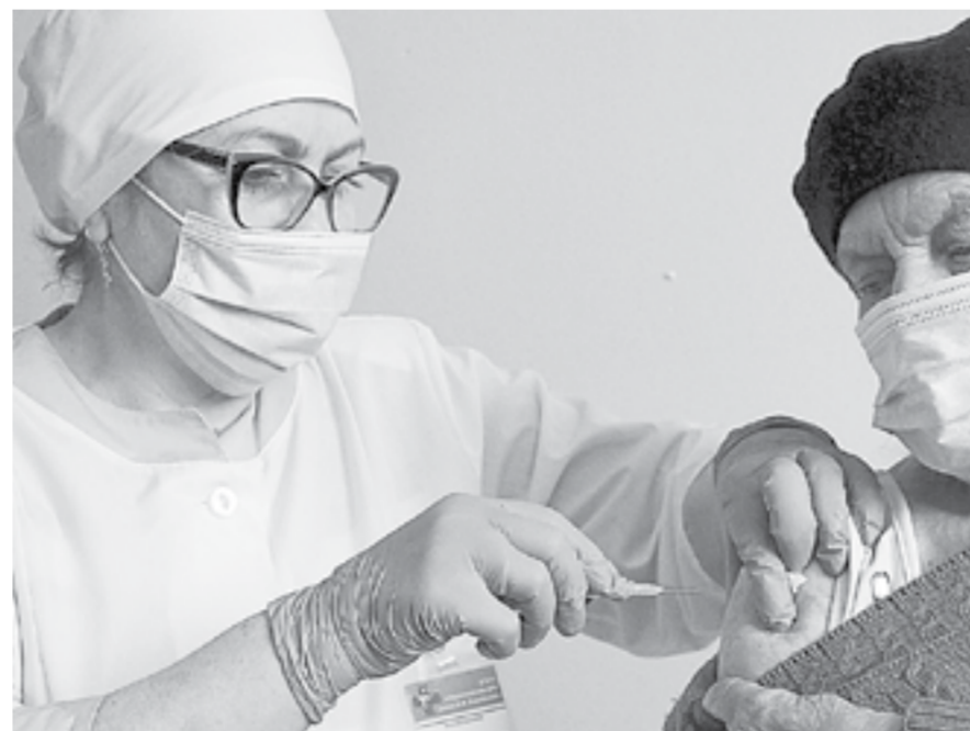
Прививка – единственный способ защититься от кори.

– Единственный способ защититься от кори – привиться. Вакцинация проводится в плановом порядке и в