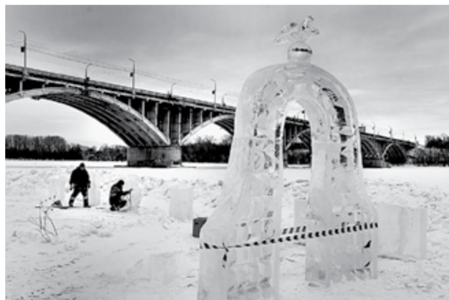
Ледовая скульптура стоит до самой весны не теряя форм.