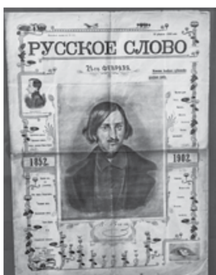
«Русское слово» от 21 февраля 1902 года.

коллеги везли их из Италии, Франции. А потом стали добавляться какие-то артефакты.