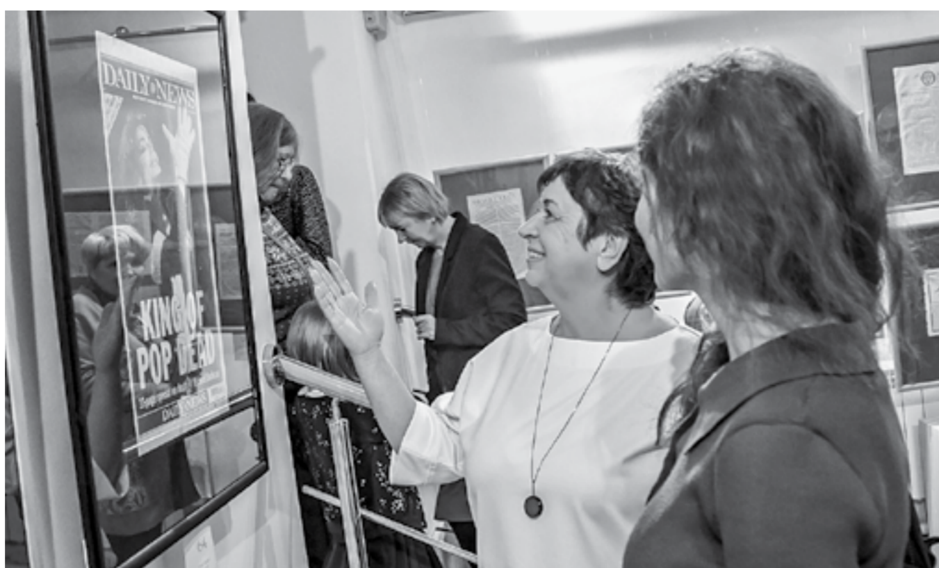
Самая ранняя газета на выставке выпущена в XVII веке, самая поздняя – в 2009 году.

– Они нужны были для работы – просто чтобы оставаться в тренде, отслеживать какие-то профессиональные веяния. Это стандартная практика для издательского дома. К кому же когда журналисты куда-то едут, даже если в отпуск, они не могут не купить местную газету, правильно? Поэтому