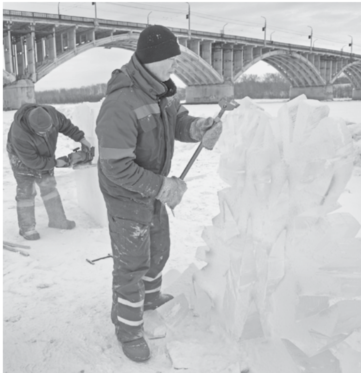
Мастера работали с утра до вечера – каждый день, чтобы успеть.