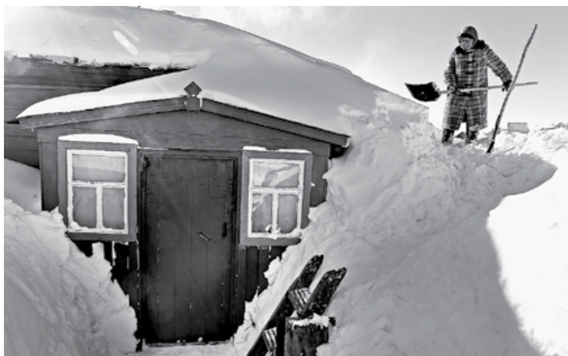
Такие подарки жителям края приподнесла метель.