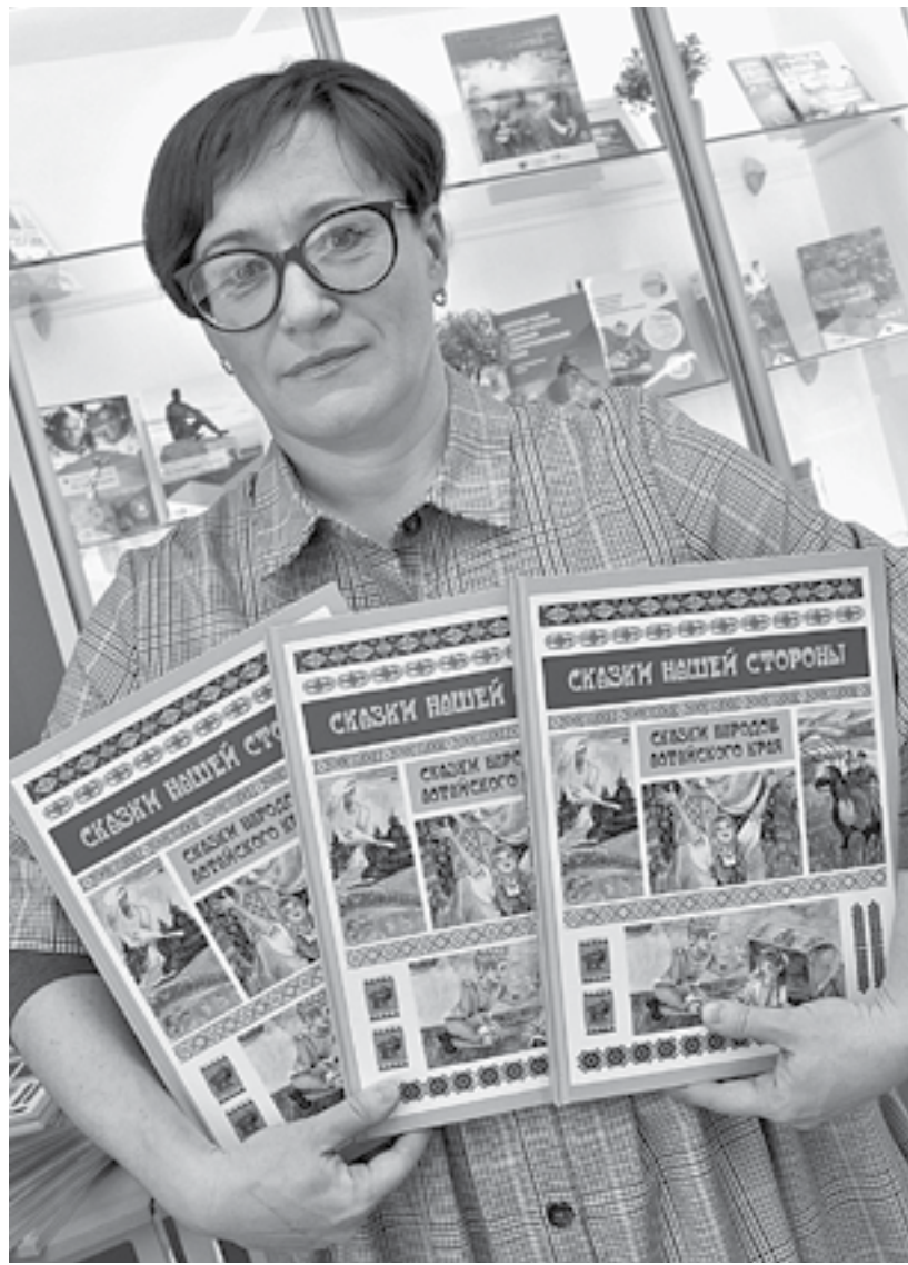
Редактор-составитель – Елена Клишина.