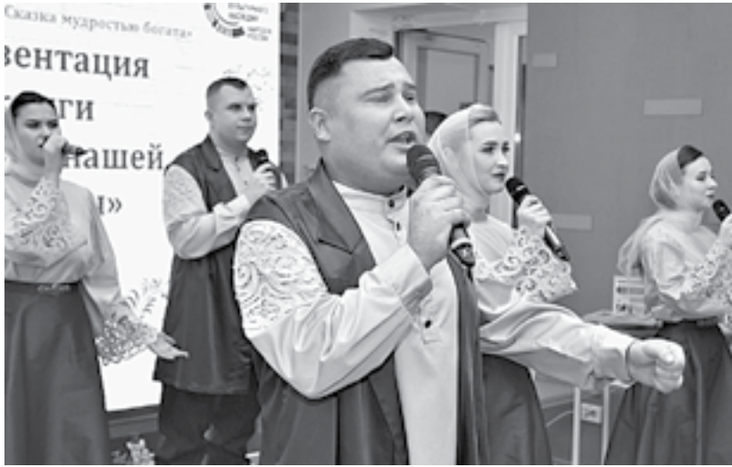
На презентации выступил ансамбль «Алтай».