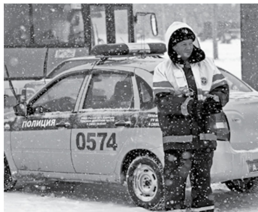
На дорогах дежурили экипажи ГИБДД.