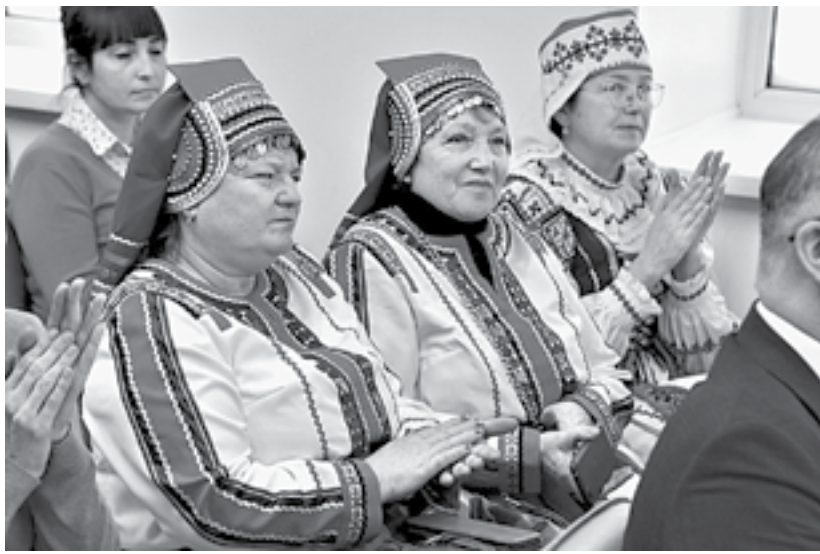
19 национальных организаций края выбрали свои сказки.