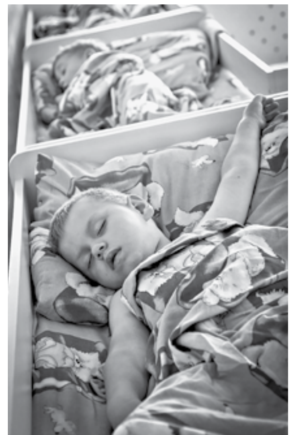
Чтобы дети спали в тепле!

В 2022 году жители Алтайского края обратились в управление по тарифам из соцсетей через систему «Инцидент Менеджмент» и портал «Госуслуги. Решаем вместе» 165 раз, с письменными заявлениями — 287. Только в декабре 2022 года было получено 105 письменных обращений и 93 — через соцсети и портал «Госуслуги», а уже в январе 2023 года за три рабочих дня — 31 обращение.