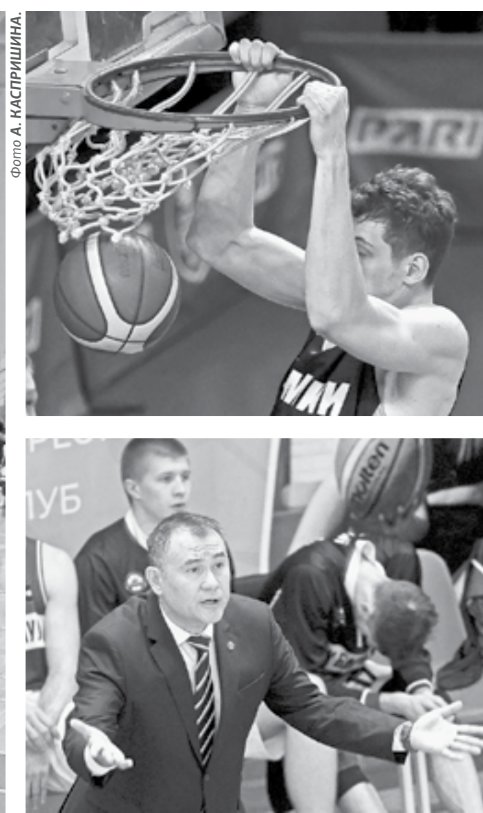
Барнаульская команда порадовала болельщиков яркой атакующей игрой в первых домашних встречах года.

результативнее, а клубы не стесняются завершать свои атаки бросками из-за дуги. У барнаульцев, например, если взять статистику по всем четвертям, количество дальних бросков превышало средние попытки.