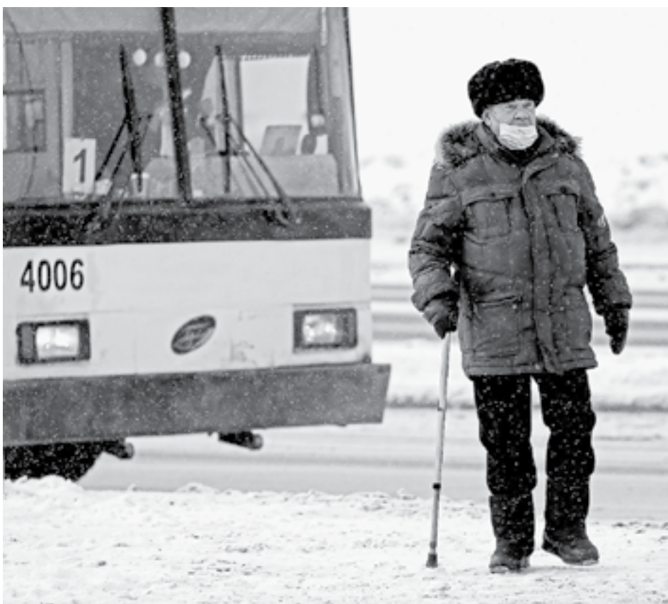
Чтобы оставаться доступным, муниципальный транспорт должен получать поддержку.

Также дорожная карта предусматривает внедрение контрактов с пассажиро-перевозчиками предприятиями на срок более трех лет. Как уверяют перевозчики,