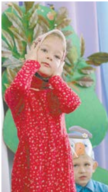
Ой, пропали гуси!

На каждом занятии главенствует книга – хранительница культурного наследия. Коллеги