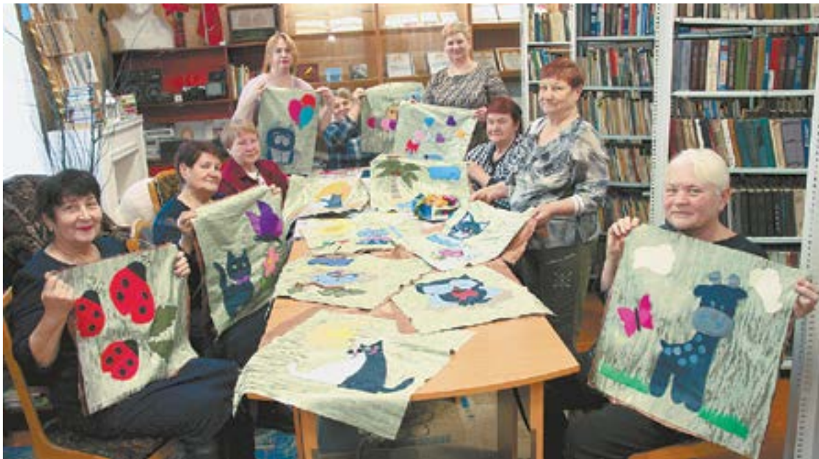
Бабушки шьют ковры-самолеты.

Ни один православный или старорусский праздник не останется в Гонохово без внимания. И стар и млад колятуют, гадают, катаются на саях, закутавшись в тулупы. На Масленицу блины пекут, на Ивана Купалу папоротник в лесу ищут и венки плетут. А какие красивые в селе проводят осенины, как красочно и вкусно празднуют в августе все Спасы!