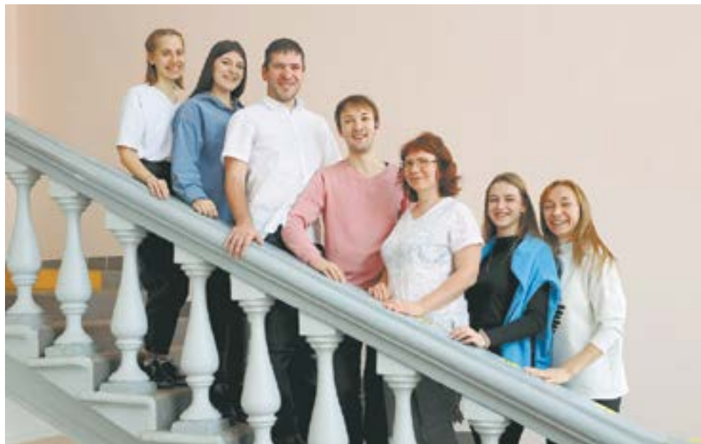
«За науку» – кузница журналистских кадров.