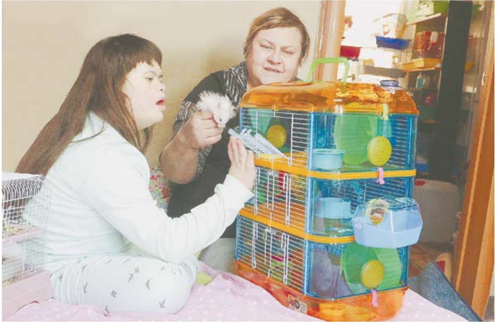
Новая клетка понравилась всем – и людям, и животным.