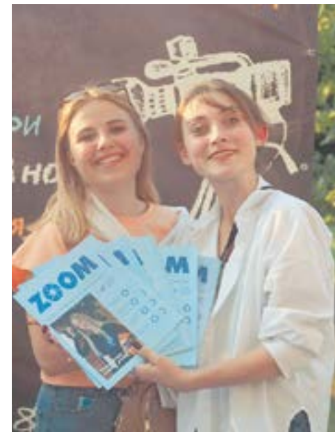
ZOOM: команда сближает!

институтов педагогического вуза. Институт и курс не имеют значения.