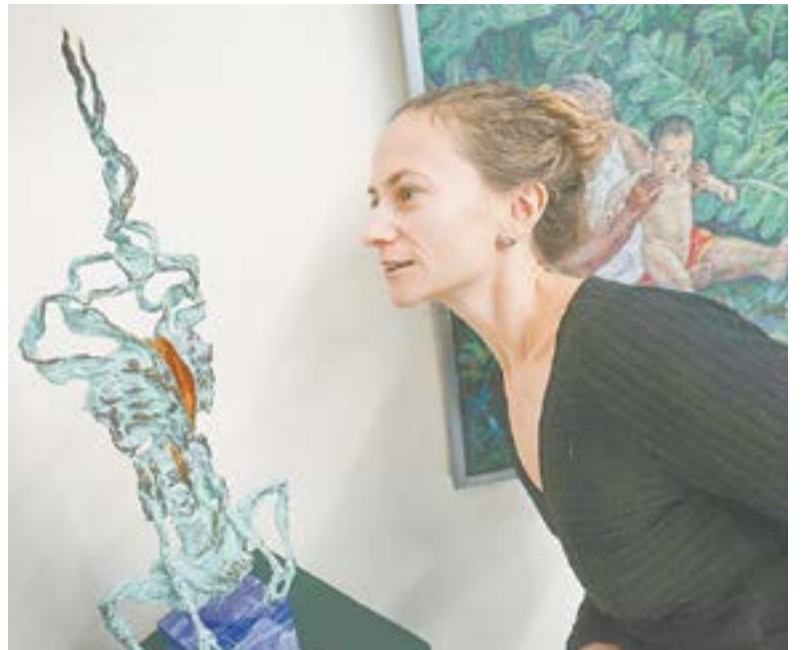
В зале Художественного музея.