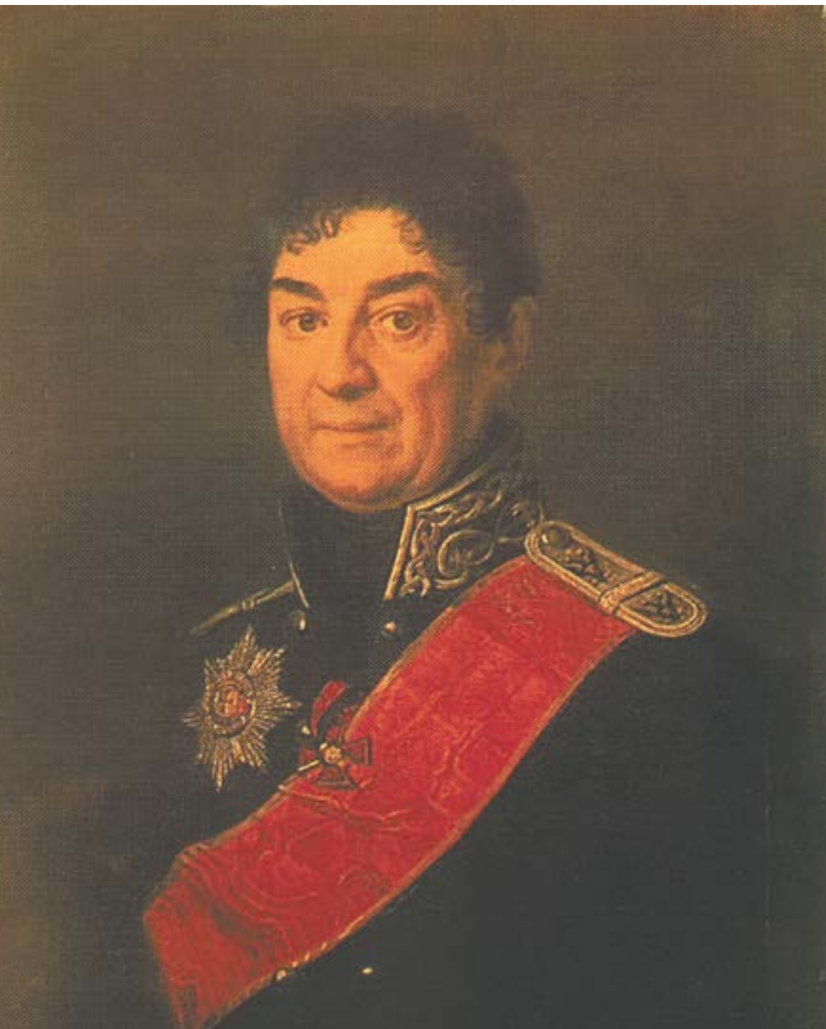
Портрет генерала Ахвердова (художник Александр Варнек) в 1930 году из Третьяковской галереи был передан в Ереван.

«Он к волчьей злобе был безграмотен и глуп,