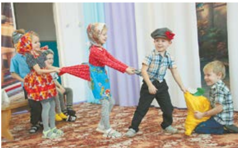
Малыши с азартом играют в сказку.