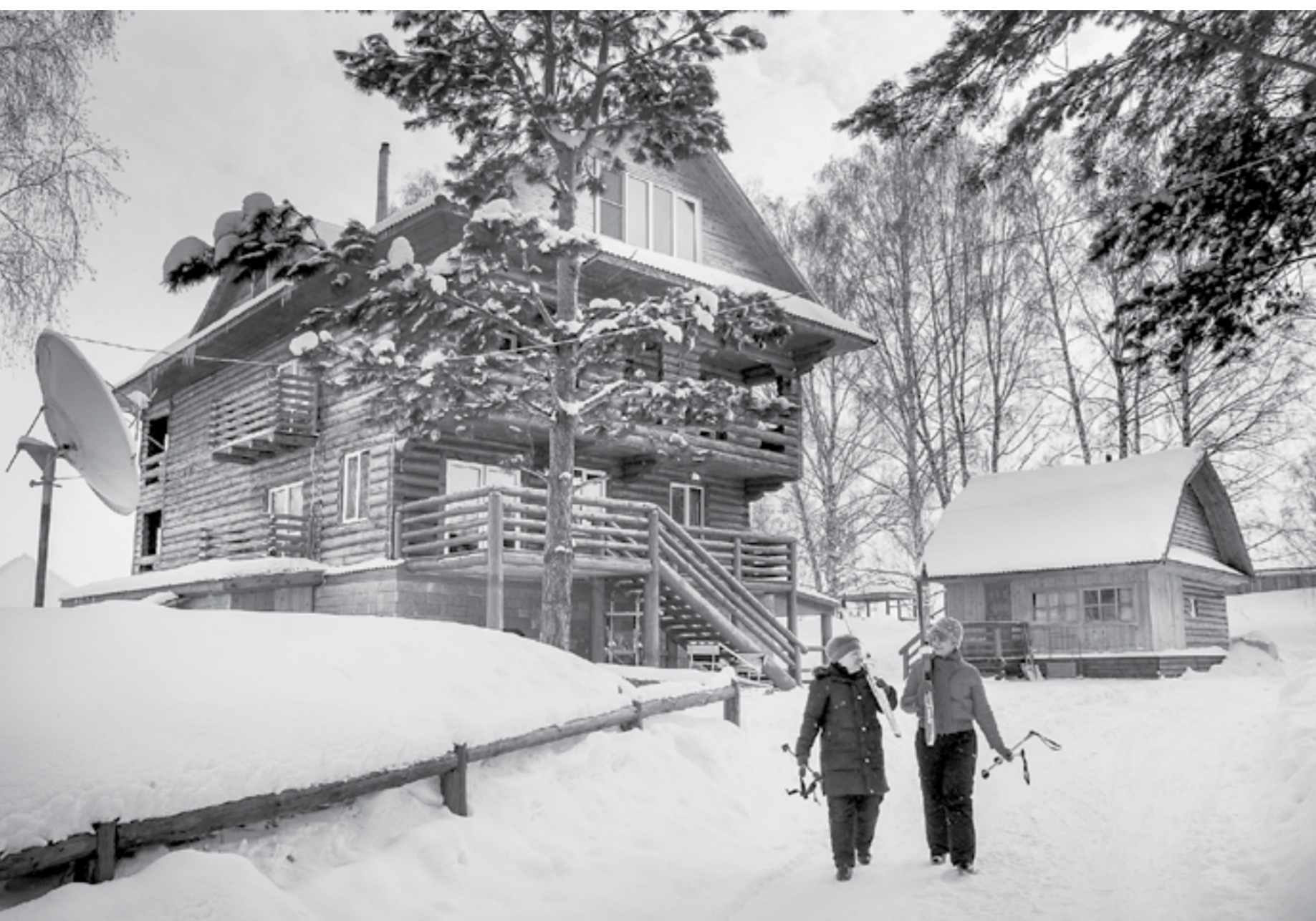
На Алтае отдых можно найти на любой вкус.

Неподалеку на «Бирюзовой Катунь» есть ледовое поле искусственного озера в окружении снежных шапок гор. В полудне езды от Белокурихи находится таежная заимка «Лесная сказка». Здесь можно покатайтесь по замерзшей глади озера между поросшим лесом склонами, а также отправиться на горнолыжный склон или съездить по двое на финских санках, которые не придется тянуть за веревку.