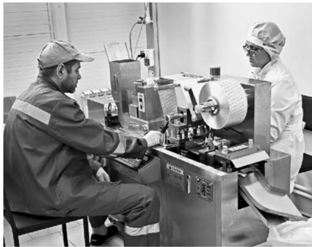
Линия по производству фитокапсул.

По ее словам, одна из задач нового производства – поддержать разработки алтайских ученых. Ставка именно на местные компоненты сделана неслучайно. И российские, и зарубежные потребители знают и ценят Алтай за уникальные природные ресурсы и экологичные продукты.