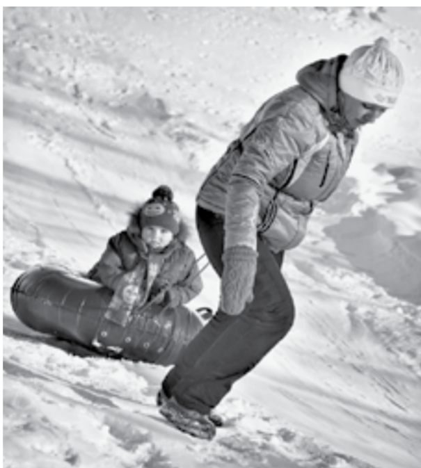
Катание с горы на надувных «санях».