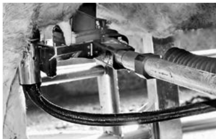
Процесс роботизированного доения на ферме в Топчихинском районе.