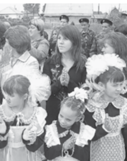
Это будет золотой стандарт качества знаний детей.

По всем школьным предметам вместо примерных появятся федеральные основные образовательные программы.