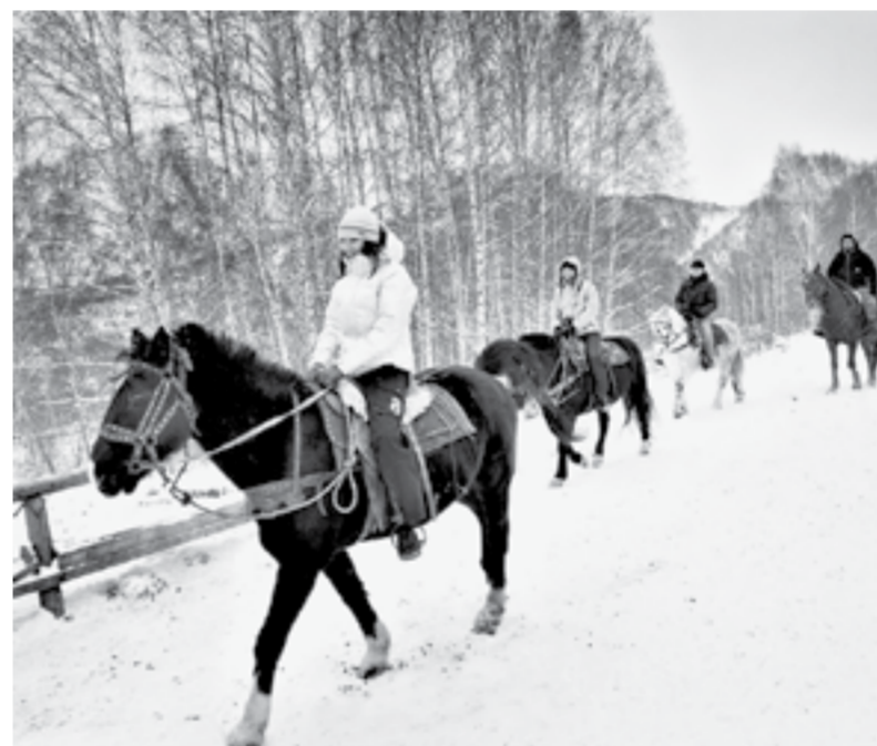
Конная прогулка по заснеженным тропам.

Самая новогодняя локация находится в Белокурихе. В резиденции Деда Мороза Алтайского края будет интересно как детям, так и взрослым. Это интерактивный музей сказок, волшебства и добра, в котором люди всех возрастов учатся мечтать и верить в исполнение желаний. Гости резиденции во время экскурсии смогут посидеть на троне Деда Мороза, побывать в логове Бабы-яги, увидеть коллекцию посохов и варежек зимнего волшебника.