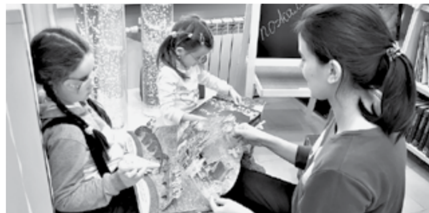
В новой комнате для детей.