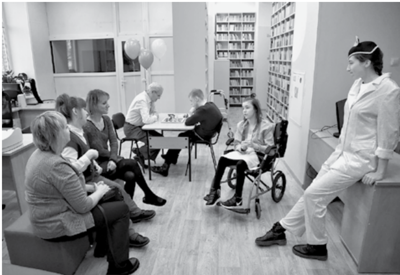
Где были старые стеллажи для книг, теперь светло и уютно.