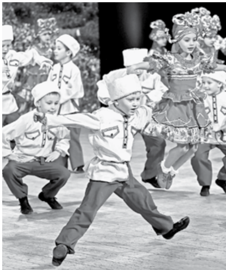
Поздравление от самых юных артистов.