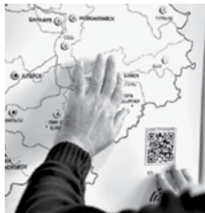
Тактильно-звуковая карта края.

На 2023 год запланированы ремонт фасада и пандуса, а также обновление мебели.