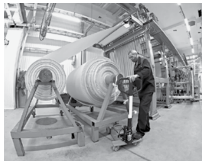
В цехе комбината «Меланжист Алтай».

По словам министра, до 2022 года в Алтайском крае не существовало ни одного промышленного технопарка или индустриального парка. Запуск для региона индивидуальной программы социально-экономического развития позволил привлечь на развитие данных видов производственной инфраструктуры 1,5 млрд рублей. В итоге был