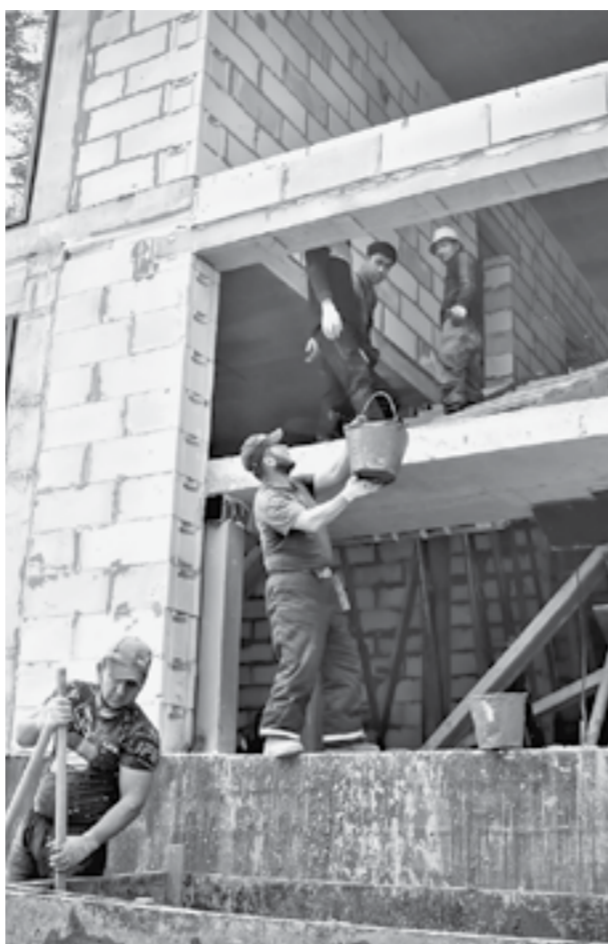
Строительство нового отеля на «Бирюзовой Катунь».

Как известно, в Республике Алтай, в 20 минутах езды от