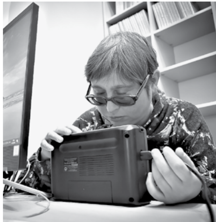
Работа с тифлофлешплеером.

В Барнауле после модернизации открылась специальная библиотека для незрячих и слабовидящих – единственное в крае специализированное учреждение культуры.